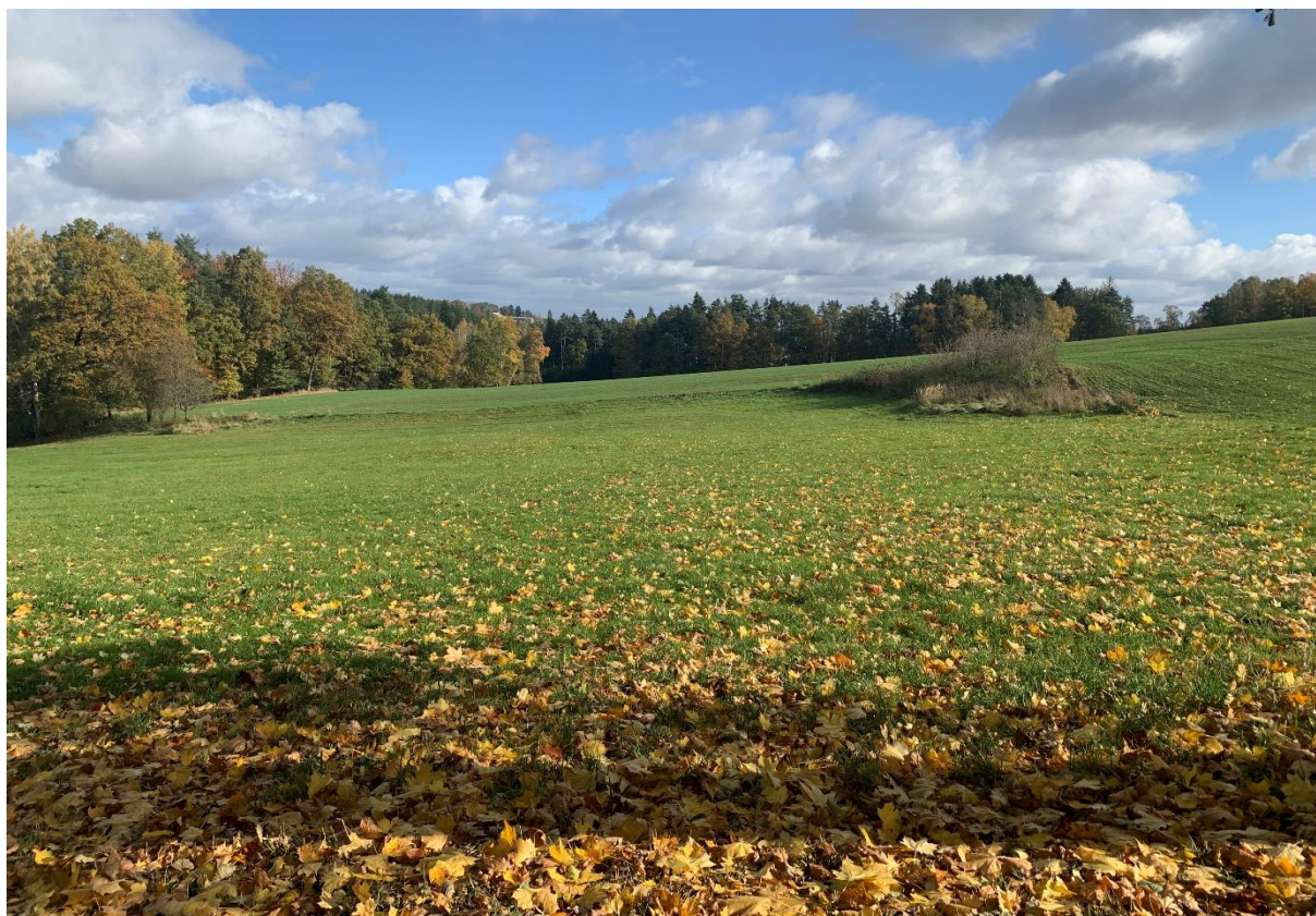
Obr. 8: Stávající krajina za mostním objektem SO 202 ve směru staničení variant 1,2,4