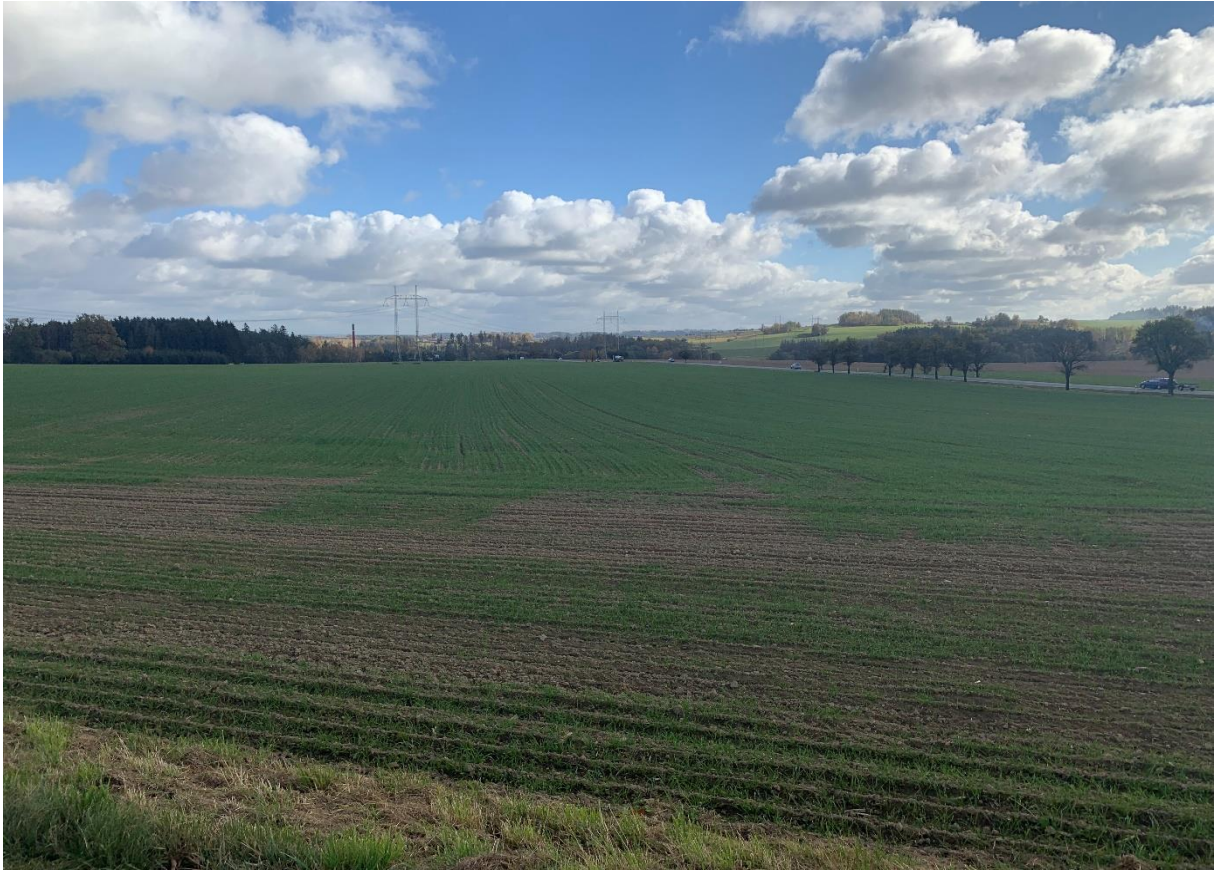
Obr. 9: Pohled ze silnice III/34752 na místo napojení variant 3,4,5 a stávající silnici I/34 na konci úseku ve směru na Havlíčkův Brod