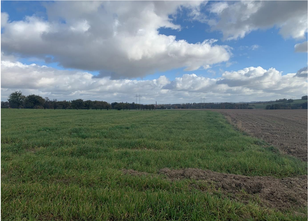
Obr. 11: Napojení variant 1,2 na stávající silnici I/34