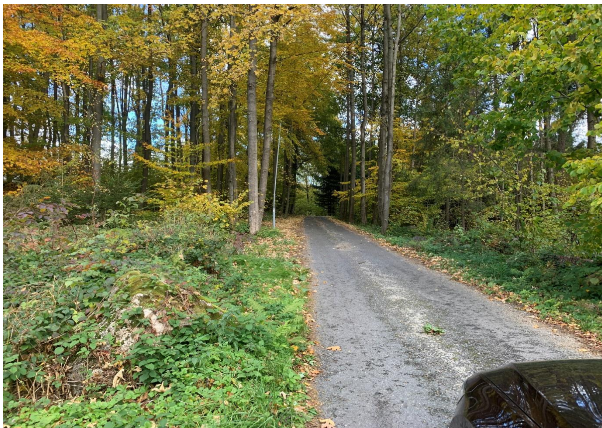
Obr. 21: Stávající lesní cesta ze silnice I/34 vedoucí k obci Leština na začátku staničení obchvatu