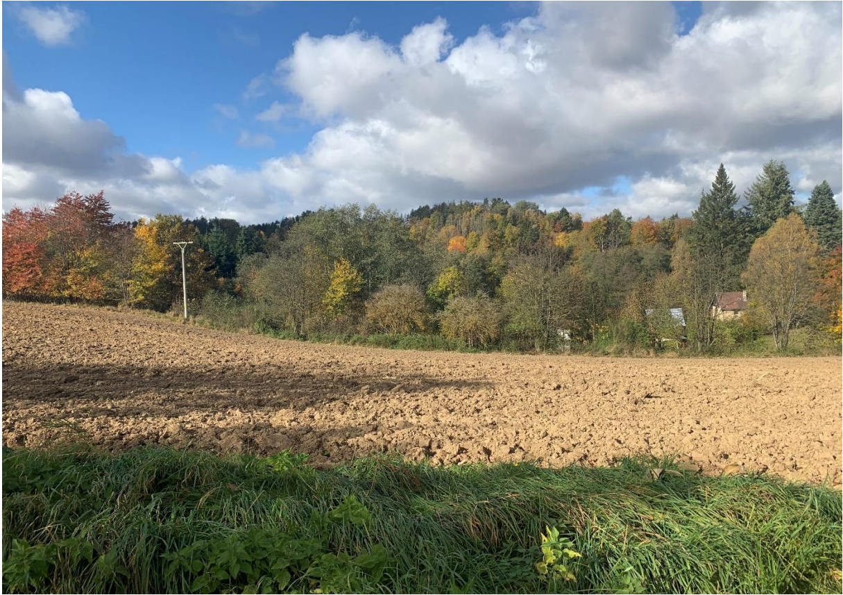
Obr. 5: Údolí se zástavbou pod mostním objektem SO 201 variant 1,2,4