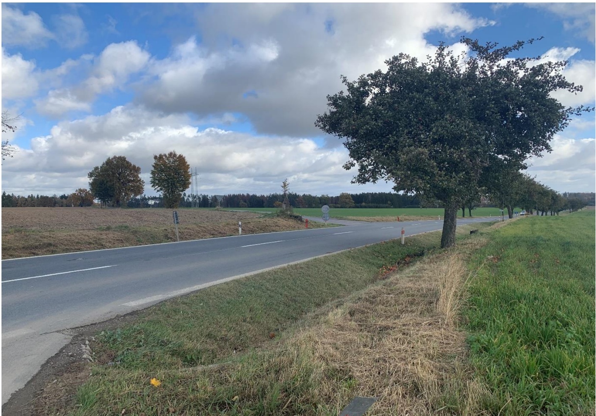
Obr. 10: Stávající napojení silnice III/34752 na silnici I/34