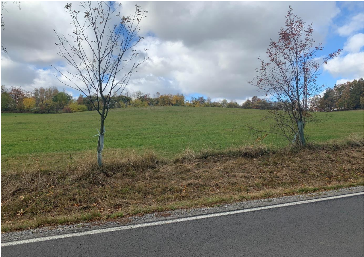
Obr. 14: Pohled na vrcholek Lejchovec ze silnice III/34766