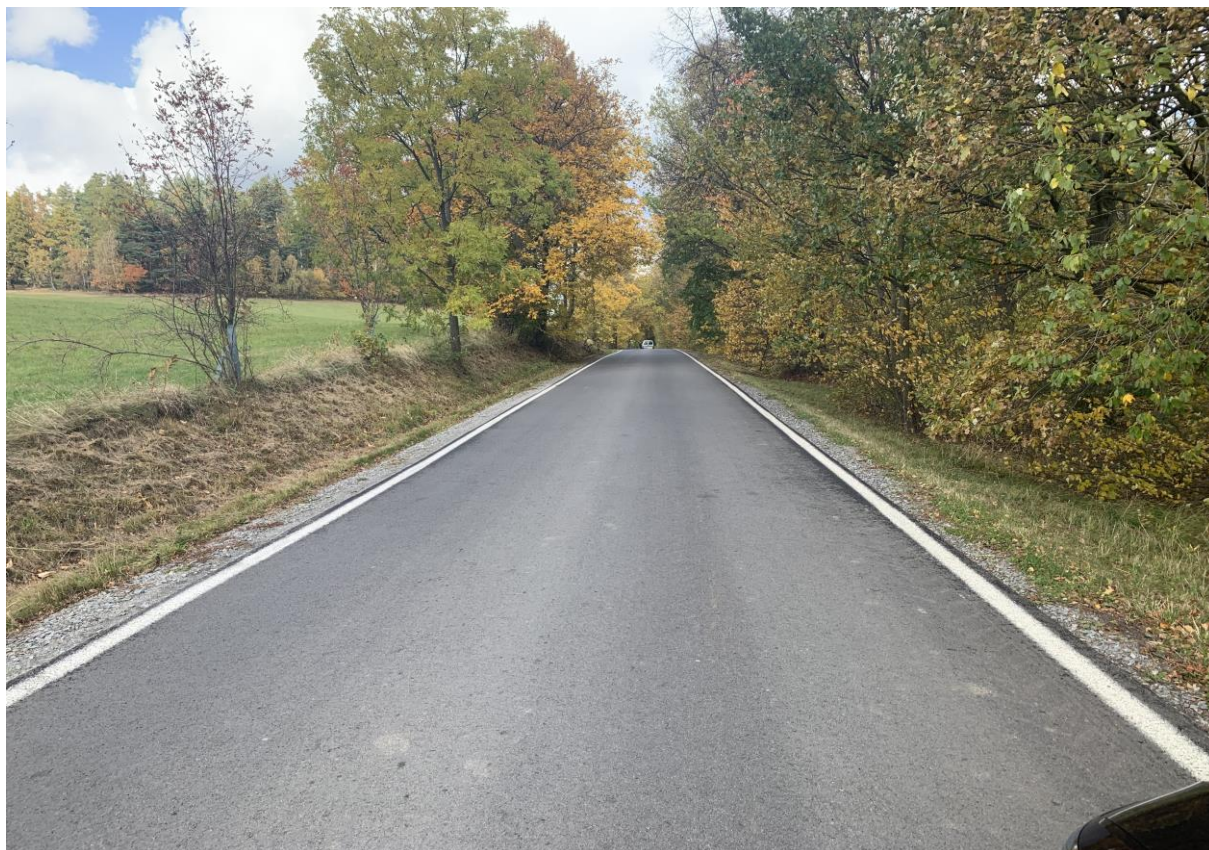
Obr. 15: Stávající silnice III/34766 v místě křížení s hlavní trasou variant 3,4,5