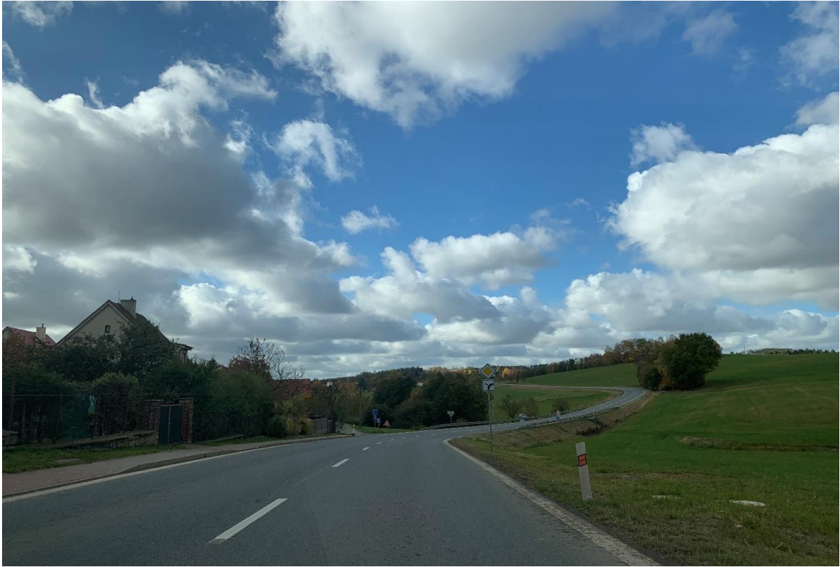
Obr. 17: Výjezd z Obce Věž po silnici I/34