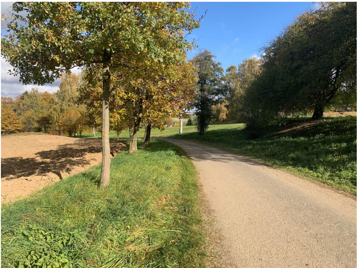
Obr. 6: Stávající místní komunikace obce Skála vedoucí ke hřbitovu variant 1,2,4