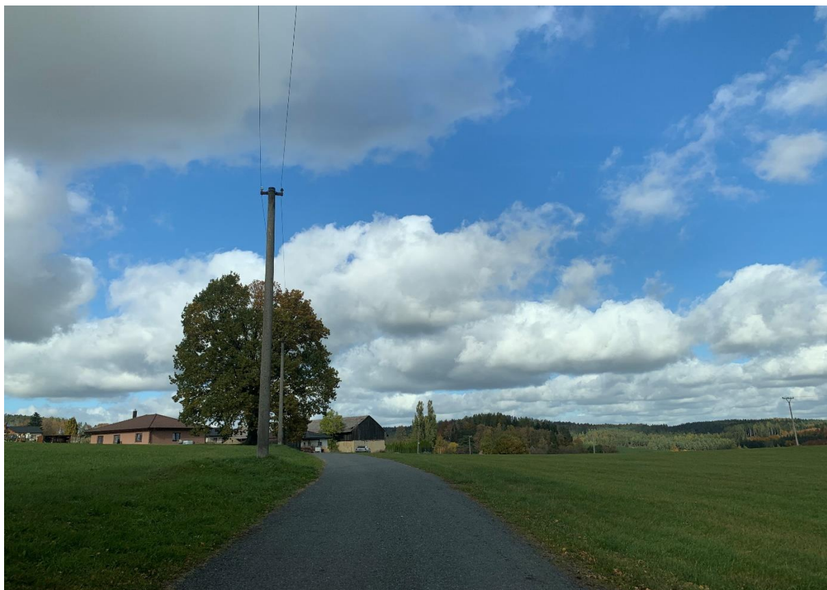
Obr. 23: Stávající účelová komunikace u obce Leština vedoucí k silnici I/34