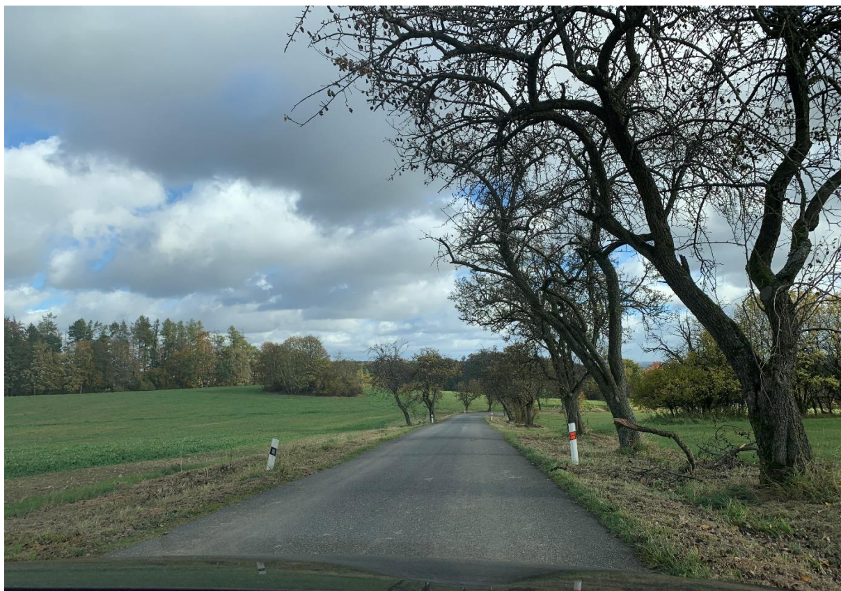
Obr. 20: Stávající silnice III/34770 v místě mostního objektu SO 201 varianty 3