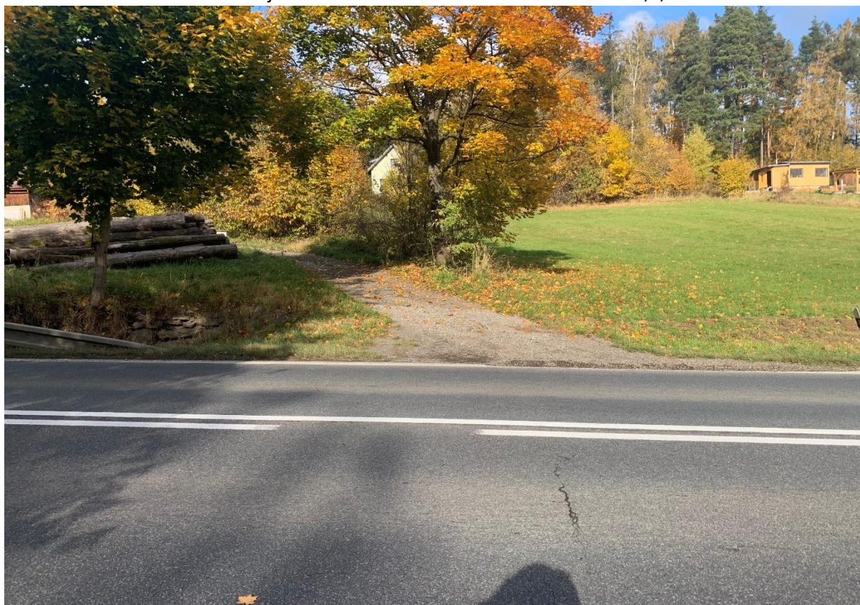
Obr. 4: Místo napojení účelové komunikace na levé straně na začátku obchvatu variant 1,2,4