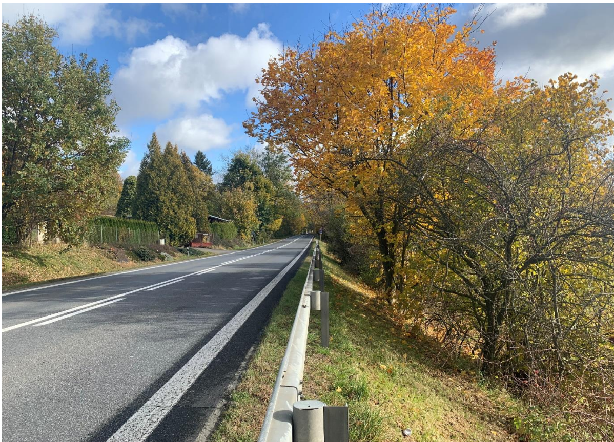
Obr. 1: Místo napojení nového obchvatu na stávající silnici I/34 za sjezdem Kachlička ve směru od Humpolce