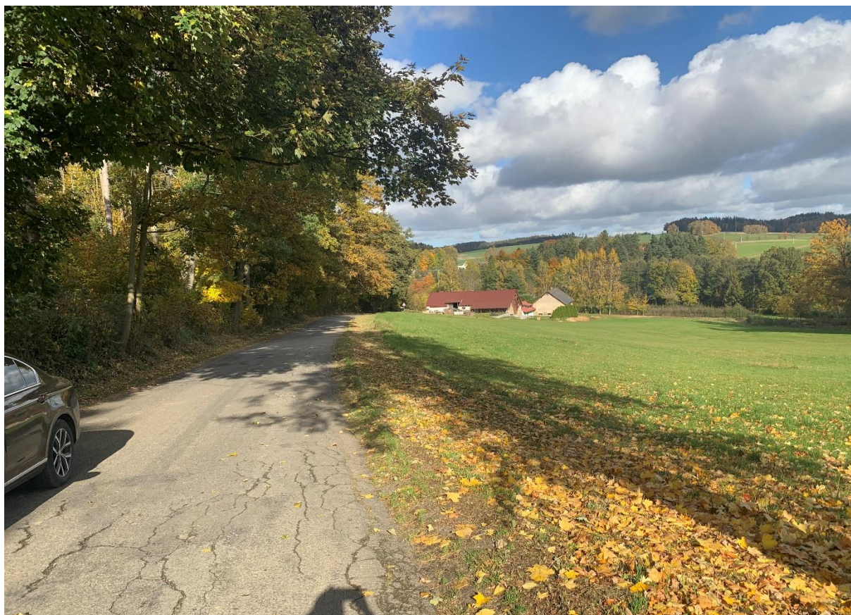
Obr. 7: Silnice III/3482 v místě navrženého mostního objektu SO 202 variant 1,2,4