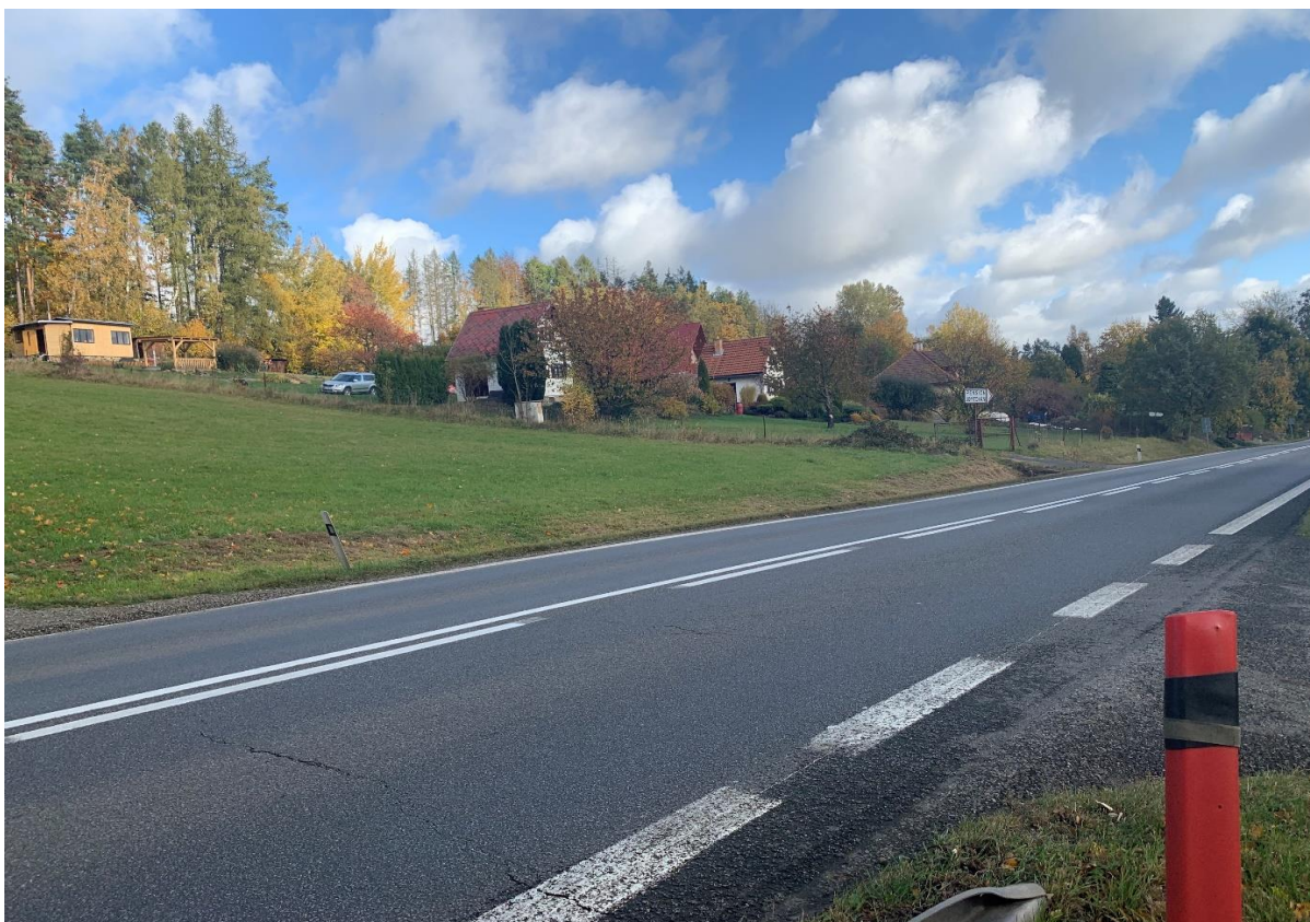
Obr. 2: Zástavba na levé straně na začátku obchvatu variant 1,2,4