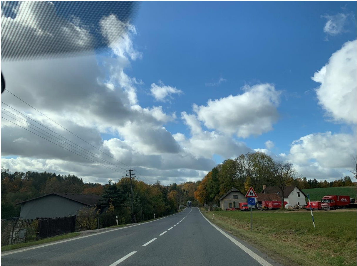
Obr. 18: Přejezd po silnici I/34 do místní části Skála z obce Věž