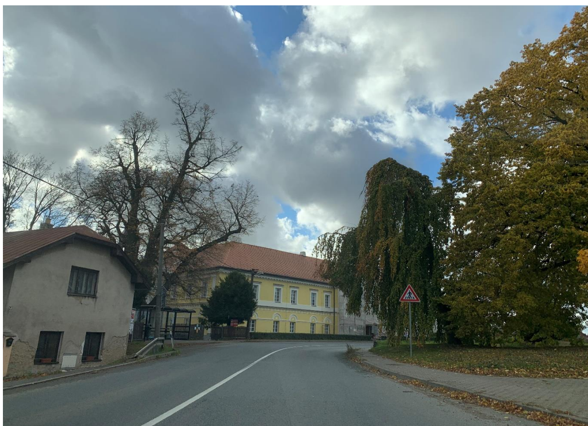
Obr. 16: Průtah silnice I/34 obcí Věž