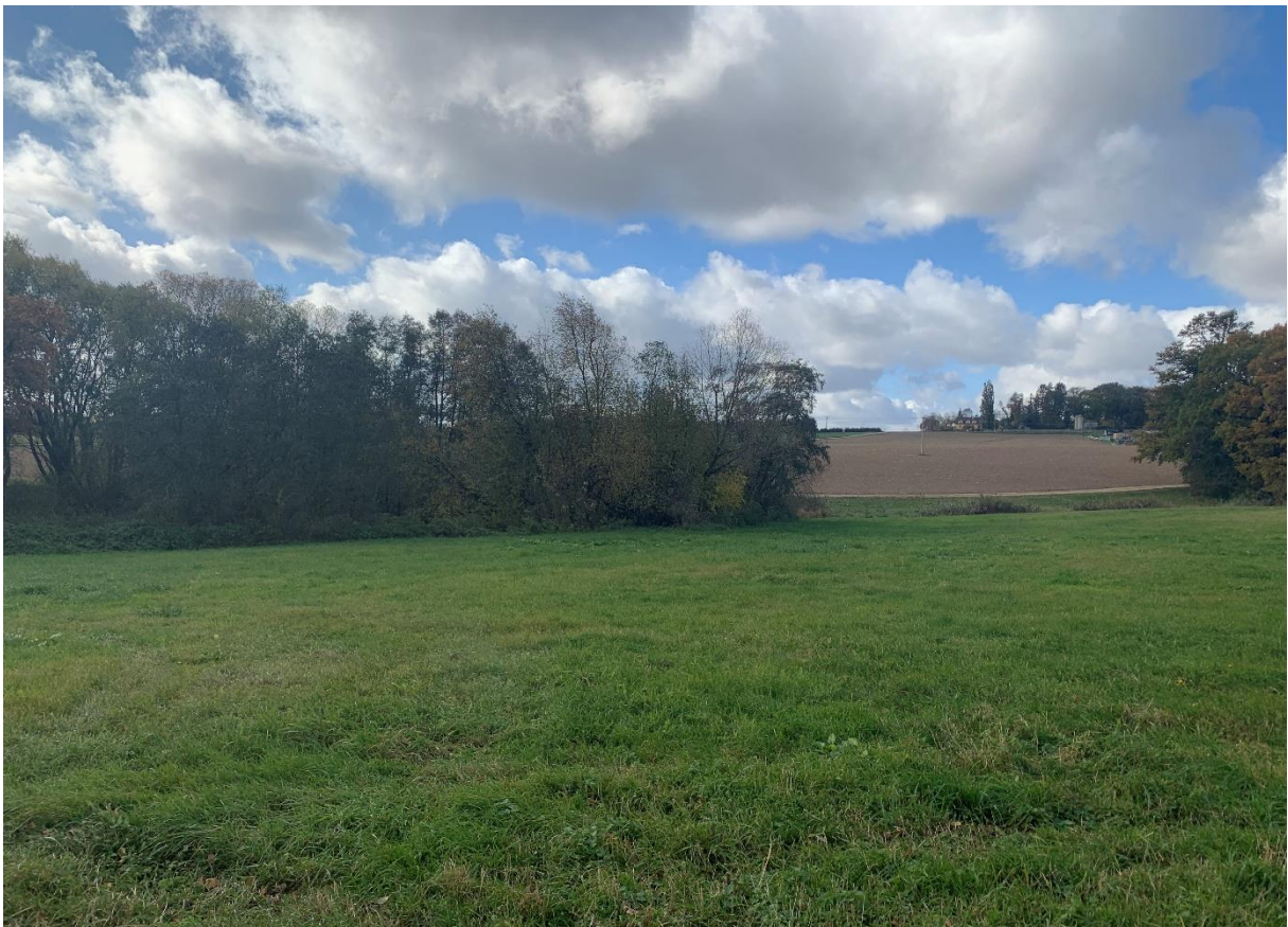
Obr. 12: Stávající rybník a vodní tok pod mostním objektem SO 204 variant 1,2