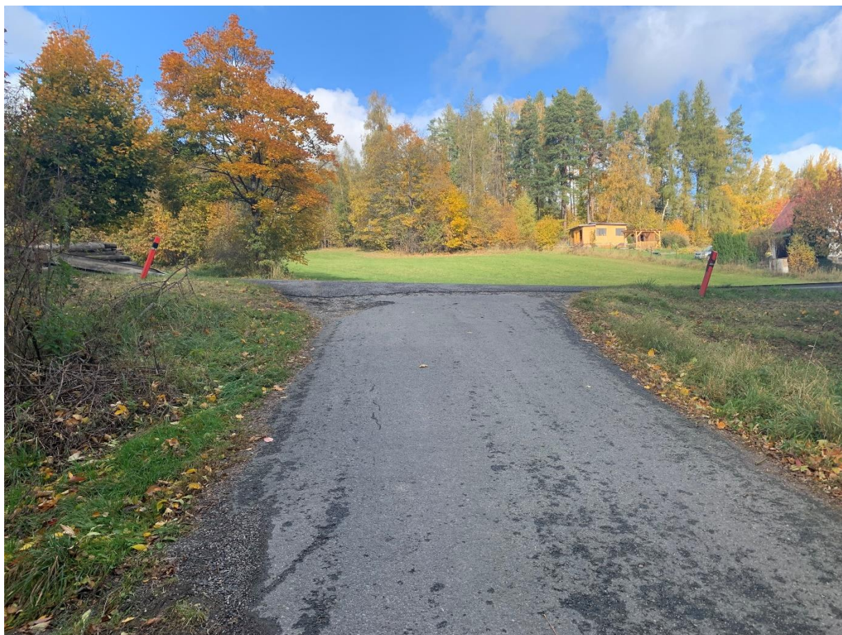
Obr. 3: Sjezd Kachlička na začátku obchvatu variant 1,2,4