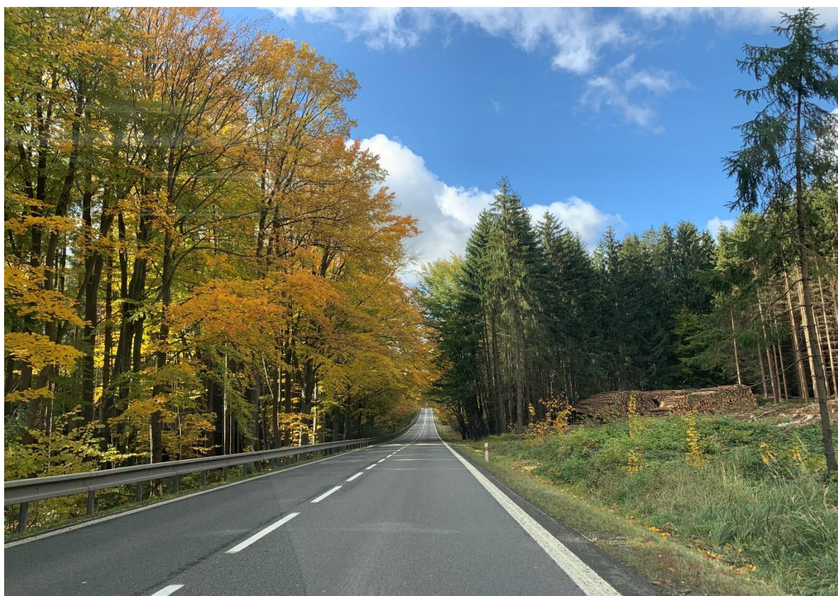
Obr. 24: Stávající silnice I/34 na začátku staničení varianty 3