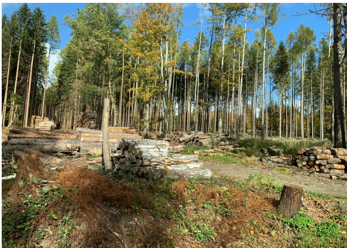
Obr. 22: Místo Panského lesa v místě MUK Skála varianty 3