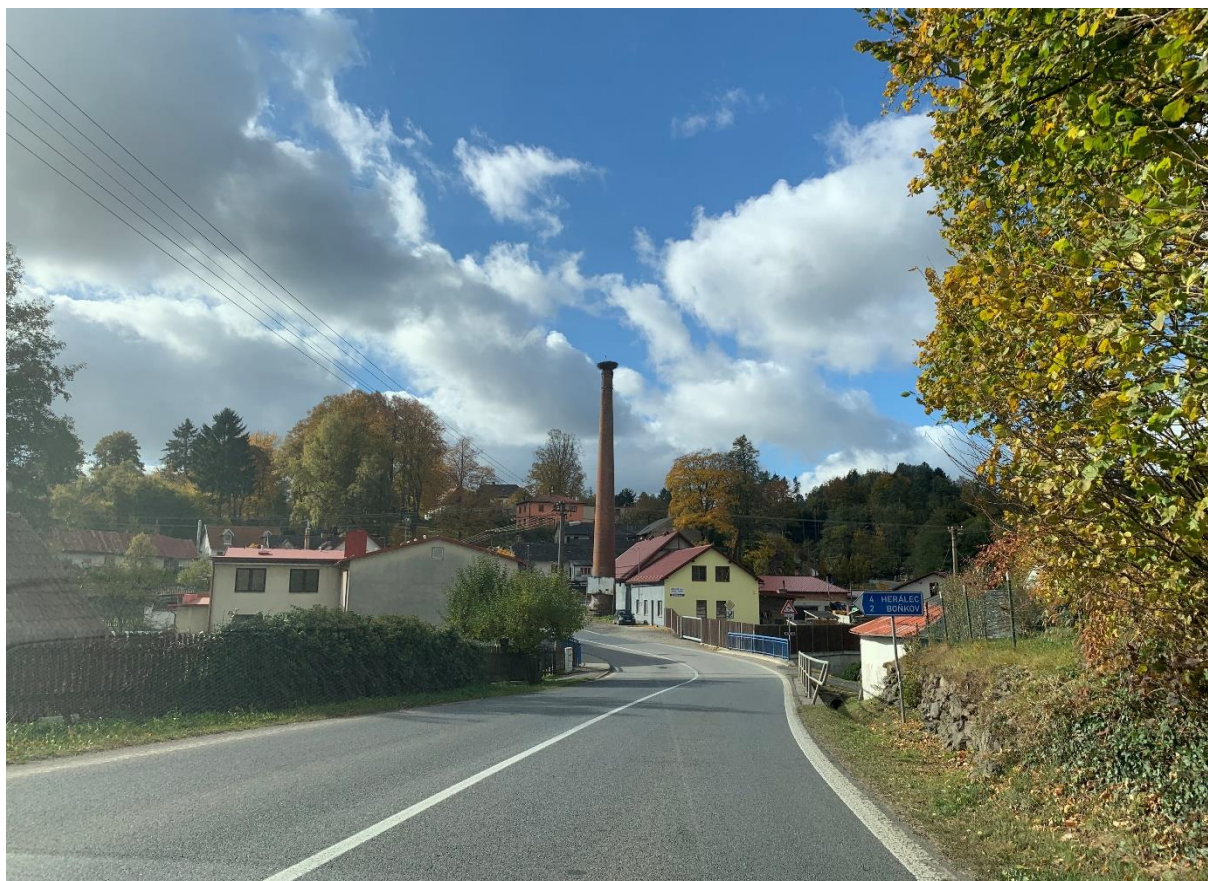
Obr. 19: Průtah silnice I/34 místní části Skála