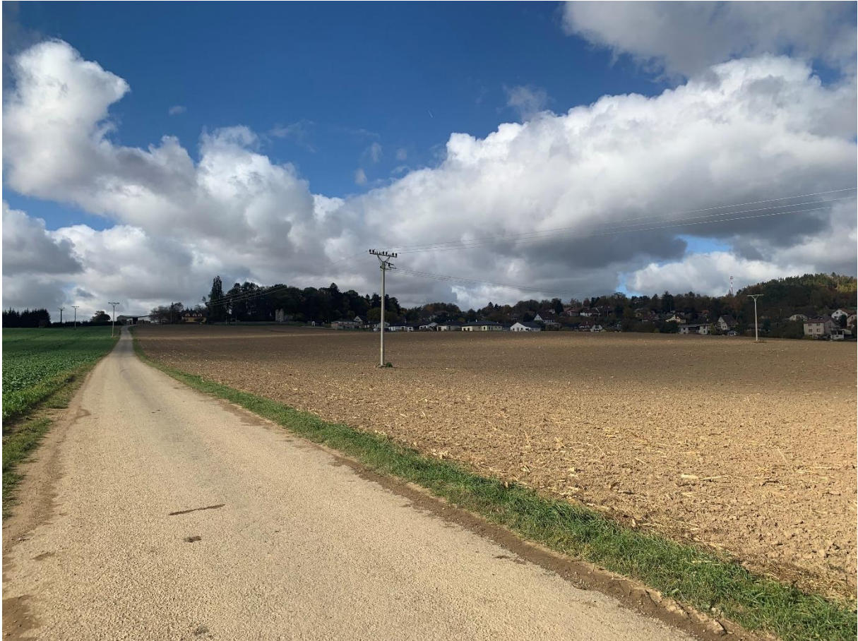
Obr. 13: Stávající účelová komunikace a zástavba na jižním okraji obce Věž