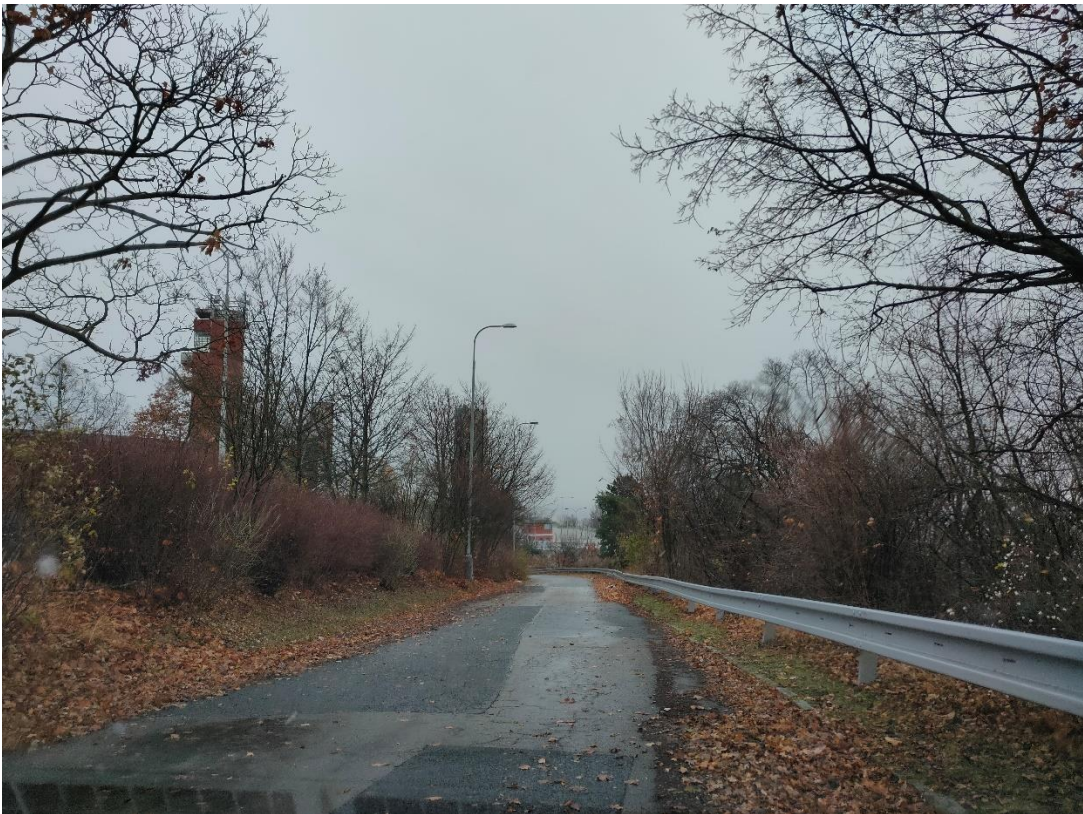
Obrázek č.12 – Čekací prostor na zastávce v ulici Vaníčkova