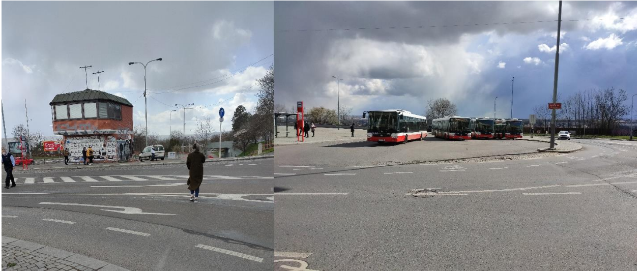
Obrázek č.1 – Chybějící přechody pro chodce v ulici Turistická a Vaníčková