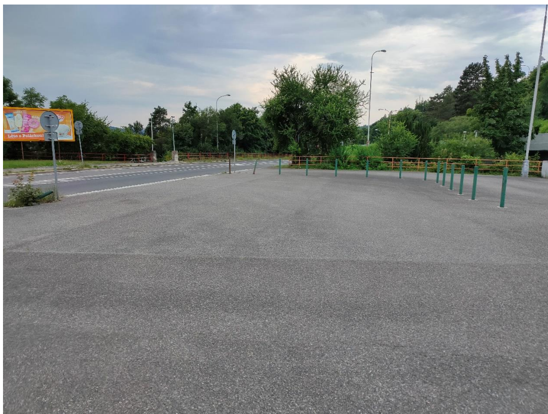
Obrázek č.10 – Vzhled na nevyužívanou parkovací plochu pro vozidla MHD