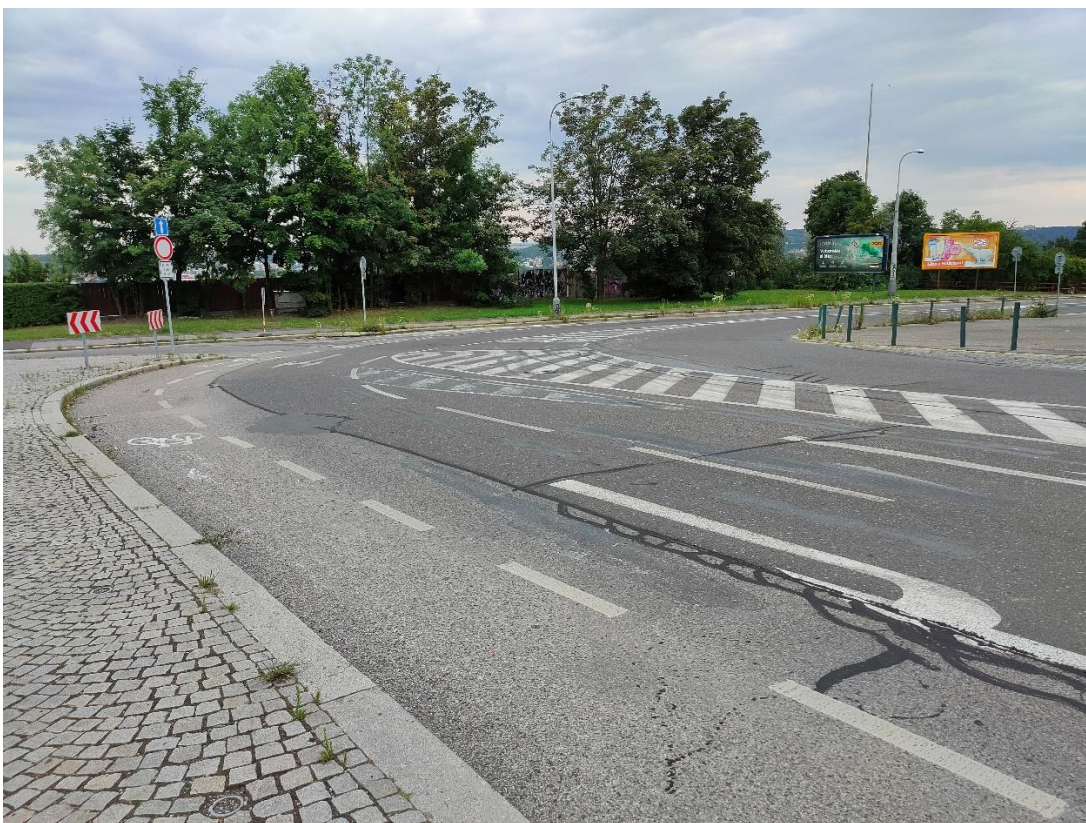
Obrázek č.6 – Ostrá zatáčka v ulici Turistická