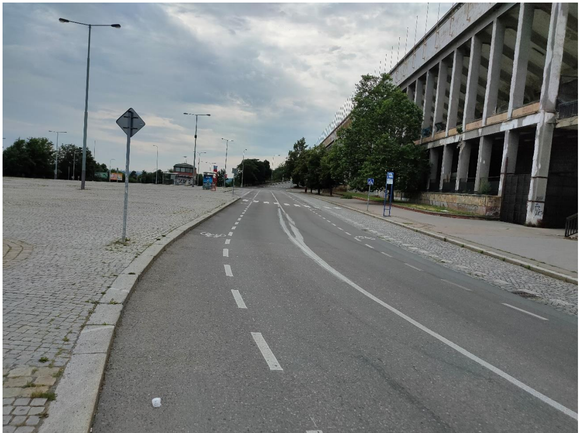
Obrázek č.8 – Vzhled na ulici Vaníčková