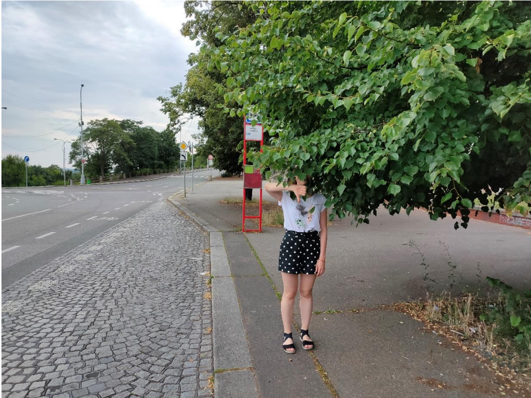
Obrázek č.11 – Čekací prostor na zastávce v ulici Vaníčkova