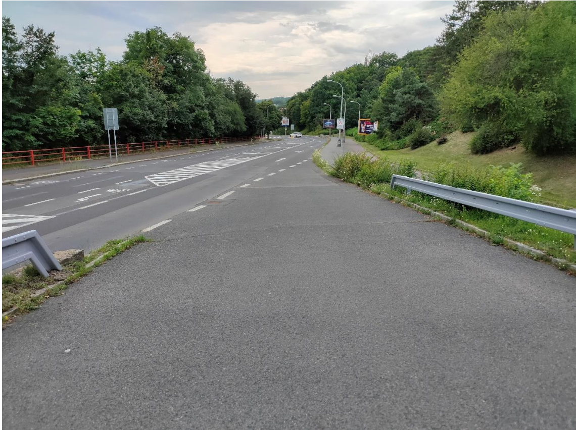
Obrázek č.7 – Křížení ulic Motoristická a Turistická