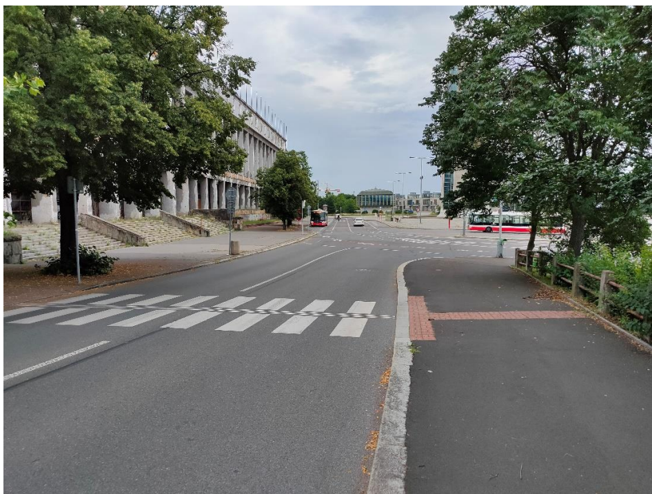
Obrázek č.4 – Chybějící dopravní značení IP6 na přechodu pro chodce v ulici Atletická