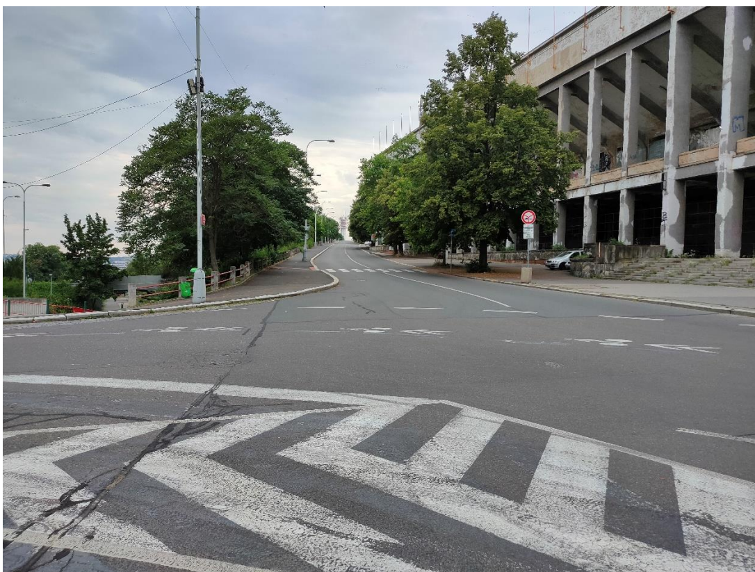
Obrázek č.5 – Vzhled na ulici Atletická