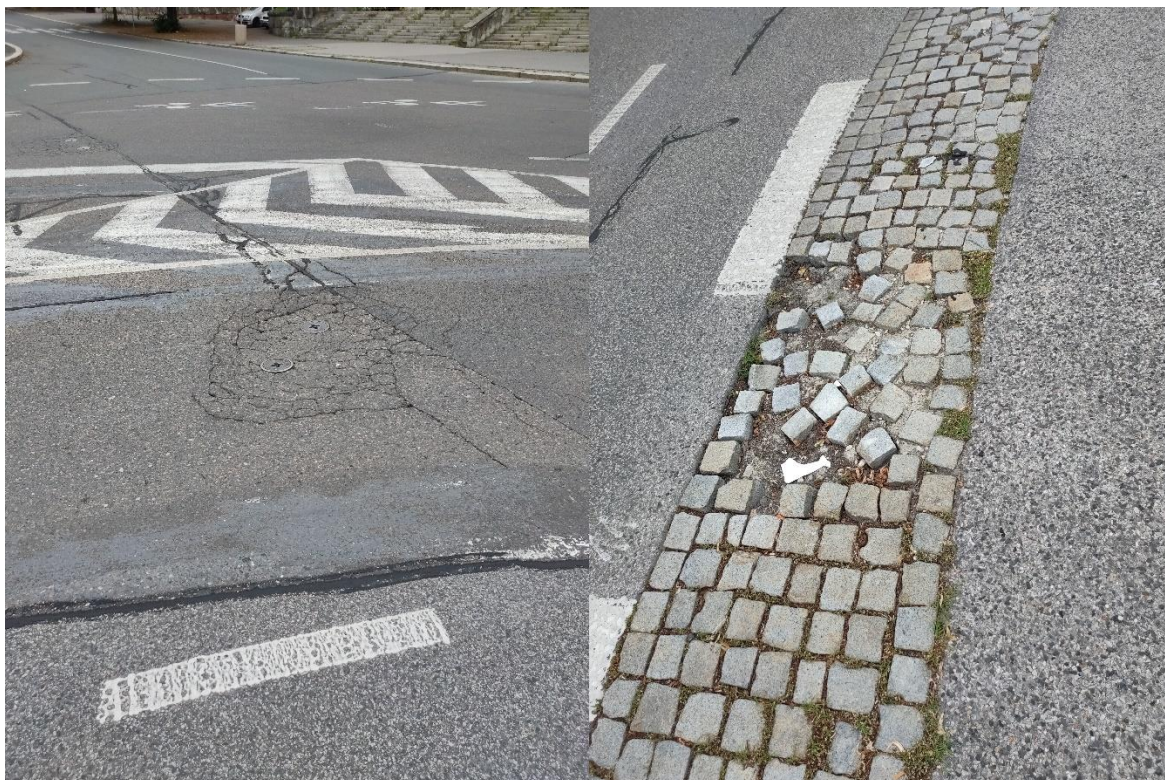
Obrázek č.13 – Příklady poruch na povrchu vozovky