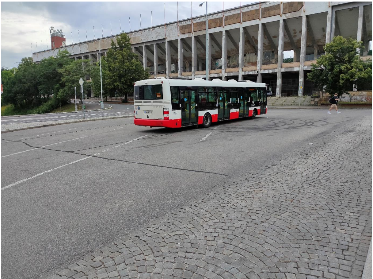
Obrázek č.2 – Pohyb chodců přes odstavňovou plochu pro vozidla MHD