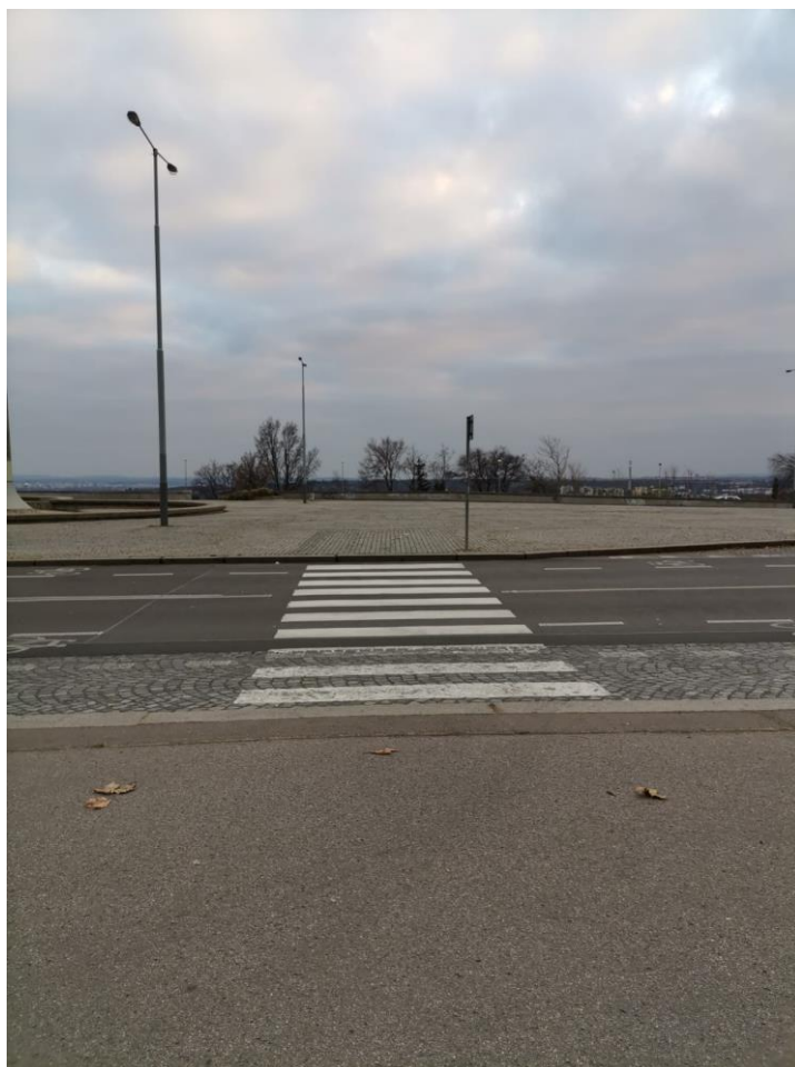
Obrázek č.3 – Přechod pro chodce v ulici Vaníčkova