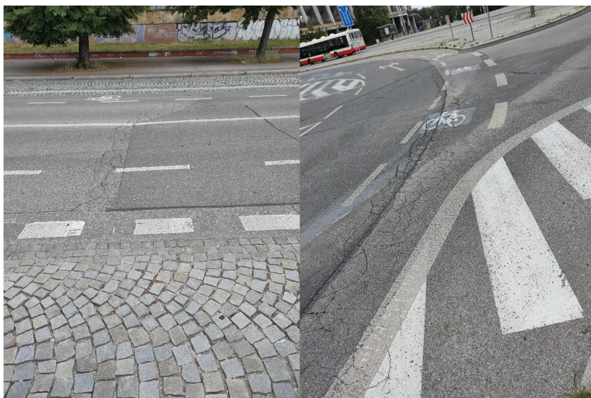
Obrázek č.14 – Příklady poruch na povrchu vozovky