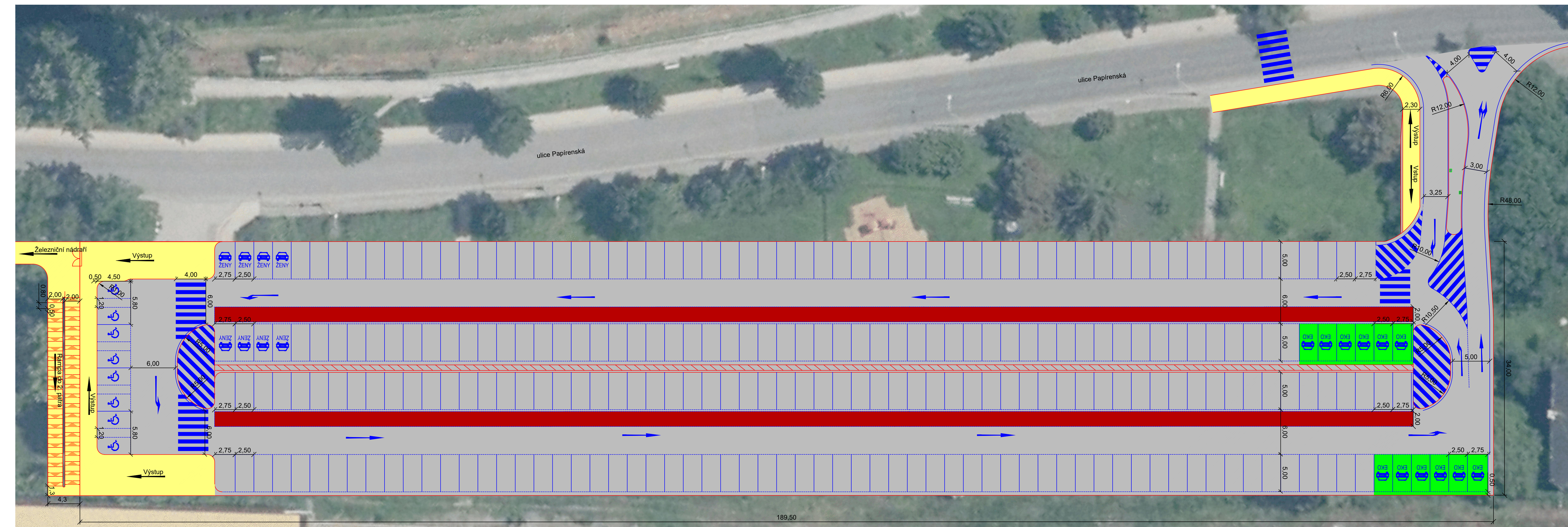
Schéma 1. patra