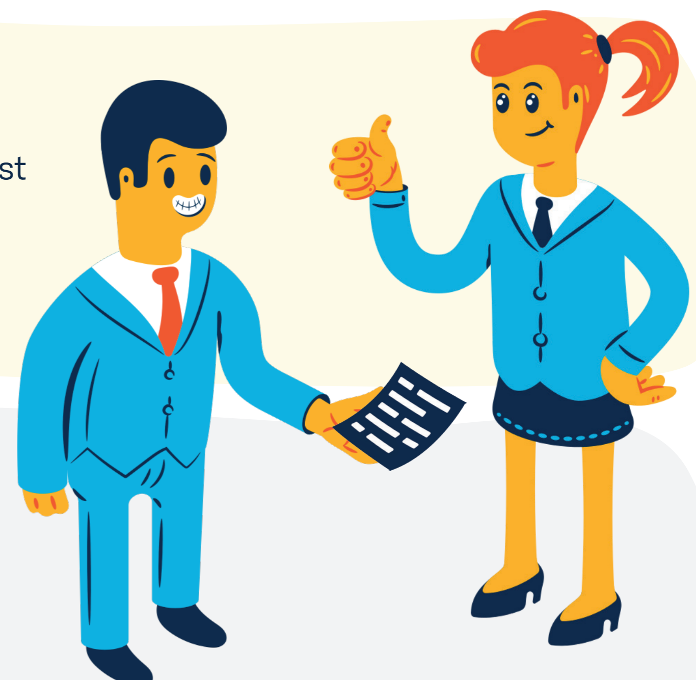
Illustration by Icons 8 / Natasha Remarchuk from Uch! / Style Flame icons8.com/illustrations

Organizace GoodCall s.r.o. postupuje v rámci procesu adaptace zaměstnanců podle ověřených metod a nejnovějších trendů, díky kterým jsou zaměstnanci s procesem adaptace velmi spokojeni. Organizace velmi dbá na získávání průběžné zpětné vazby od zaměstnanců, což je klíčové jak pro spokojenost zaměstnanců, kteří se mohou ke svým potřebám průběžně vyjadřovat tak pro veškeré změny a inovace, které by organizace chtěla v budoucnu realizovat. Organizace si je vědoma, jak důležité je se zajímat o spokojenost a potřeby zaměstnanců již od prvního kontaktu s nimi a jak na tyto potřeby v průběhu jejich působení v organizaci správně reagovat.