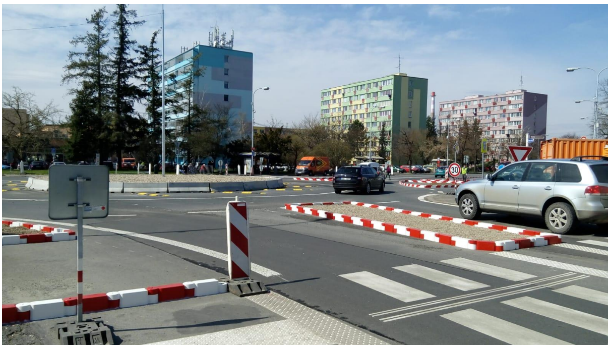
Obrázek 7 - Plastové montované obruby vyplněné kamenivem (Benátky nad Jizerou)