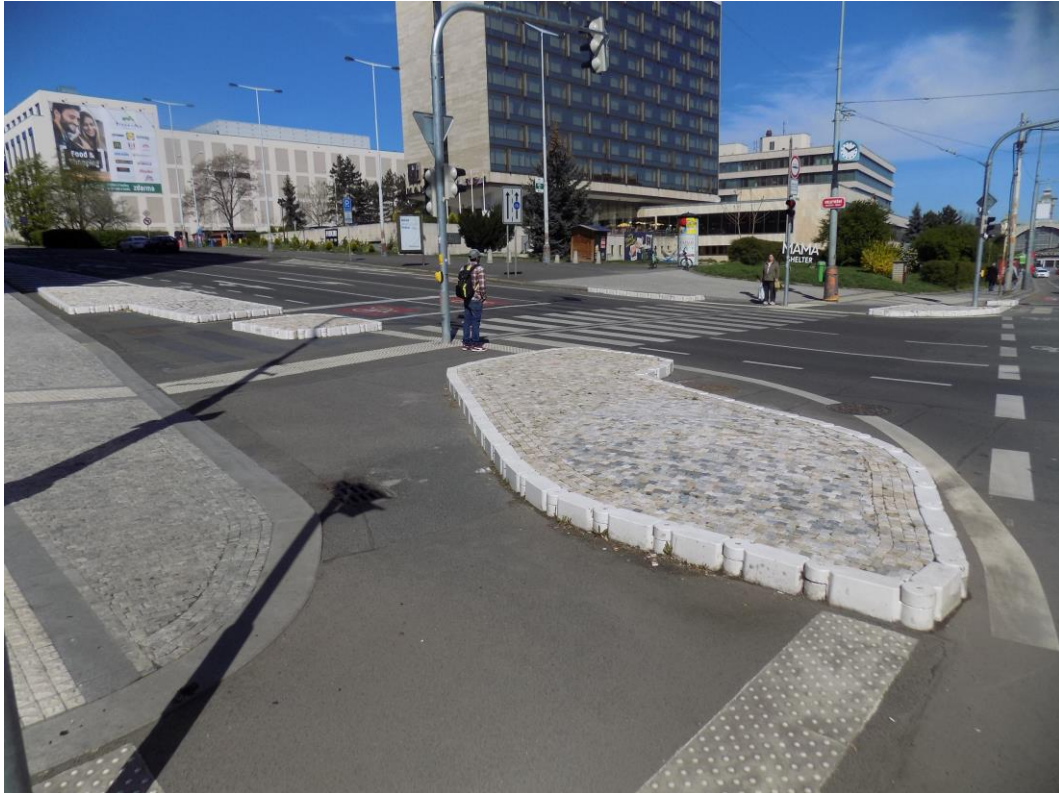
Obrázek 1 - Plastové montované obruby vyplněné kamennou dlažbou (Praha – Holešovice)