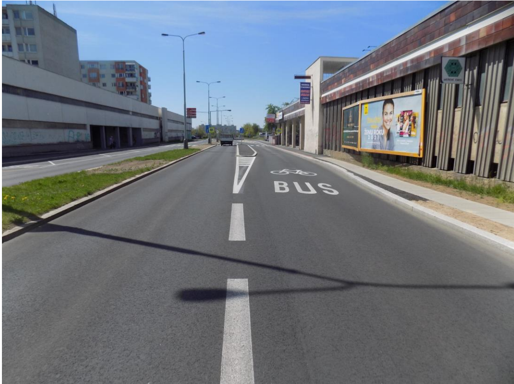
Obrázek 5 - Autobusová zastávka Mikulova (v případě nestavebního řešení oddělení pomocí plastových montovaných obrub)