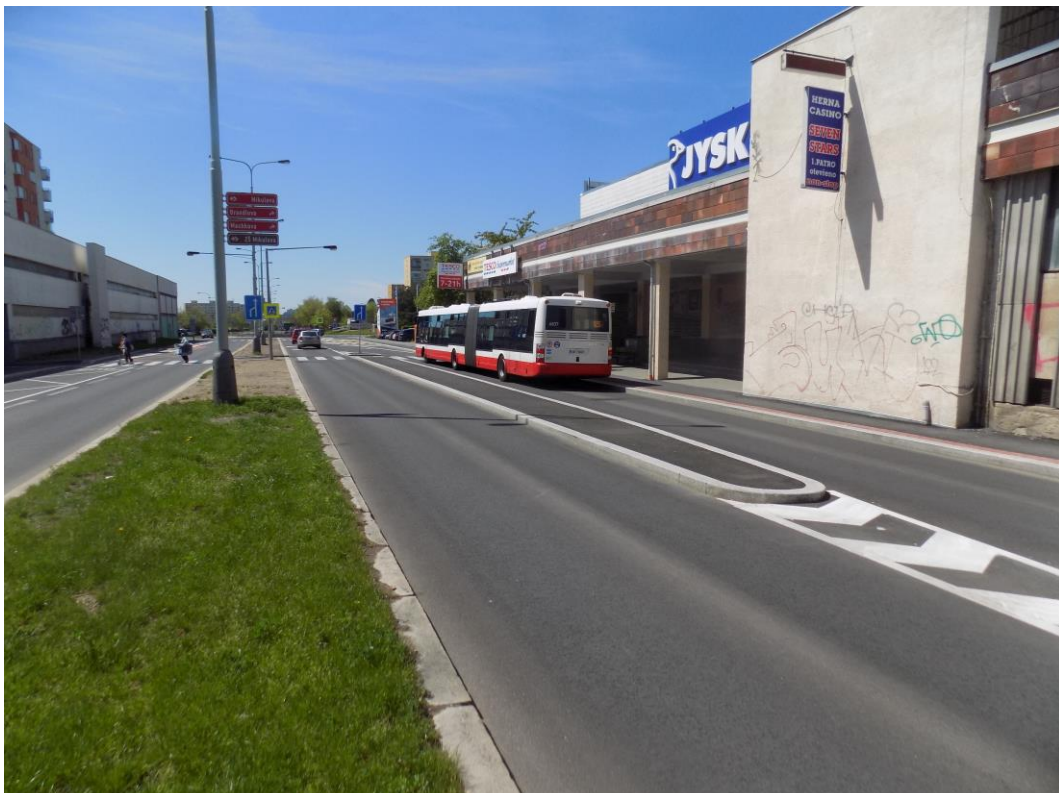
Obrázek 6 - Autobusová zastávka Mikulova