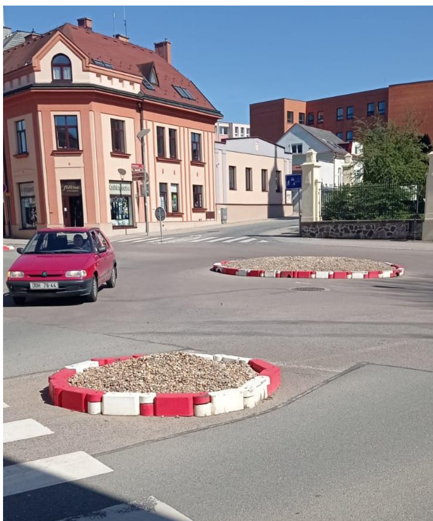
Obrázek 8 - Plastové montované obruby vyplněné kamenivem (Ústí nad Orlicí)