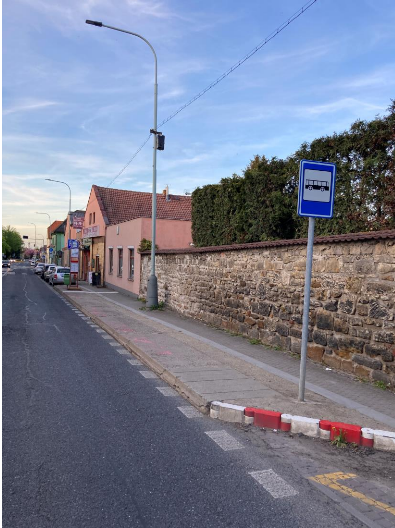
Obrázek 9 - Autobusová zastávka z betonových panelů (zastávka Vinořský zámek)