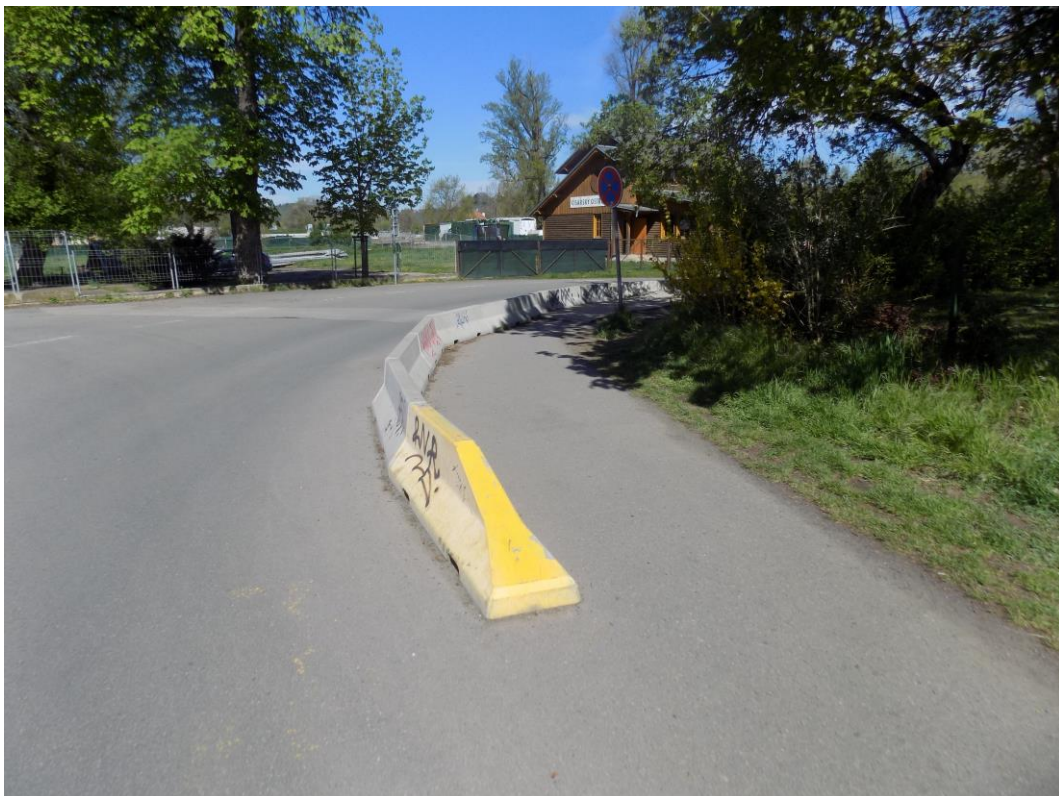
Obrázek 4 - Fyzické oddělení pěších/cyklistů od motorové dopravy (Praha – Troja)