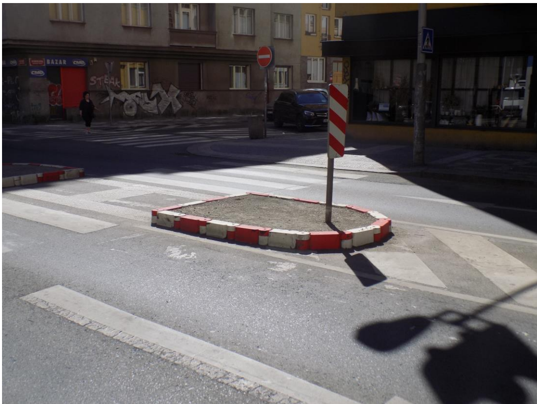
Obrázek 2 - Plastové montované obruby vyplněné betonem (Praha – Holešovice)