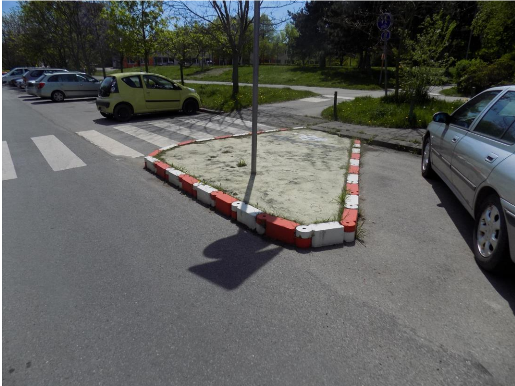
Obrázek 3 - Plastové montované obruby vyplněné betonem (Praha – Jižní Město)