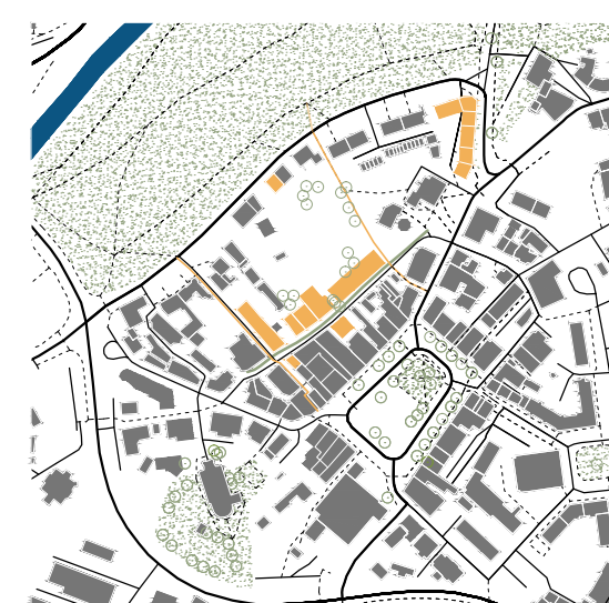
Nová pěší ulice, nové bloky domů a zelený pás ve stopě Struhu.