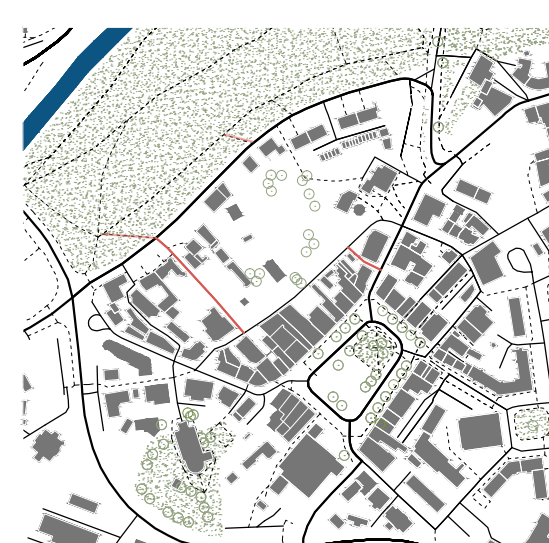
Slepe cesty ve směru náměstí - park.