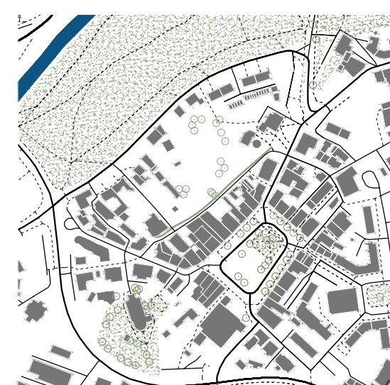
Zelený pás připomíná historickou stopu Struhu.