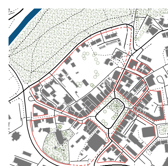
Přiloučené bloky. Drobnější bloky na východě, velké, v některých místech špatně definované na západě.