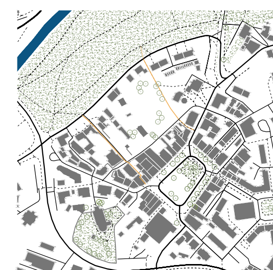
Propojení náměstí a parku.