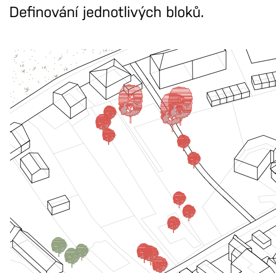
Vzrostlé stromy na pozemku.