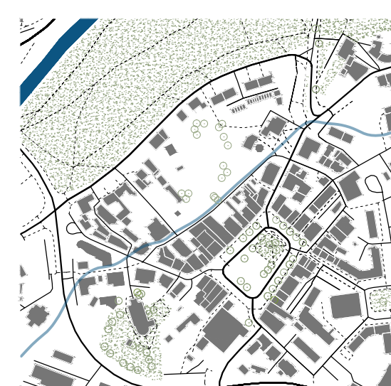
Historické stopa Struhu.