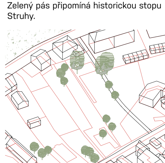
Pozemky stále s historickým charakterem úzkých pásů směřujících od náměstí k parku.