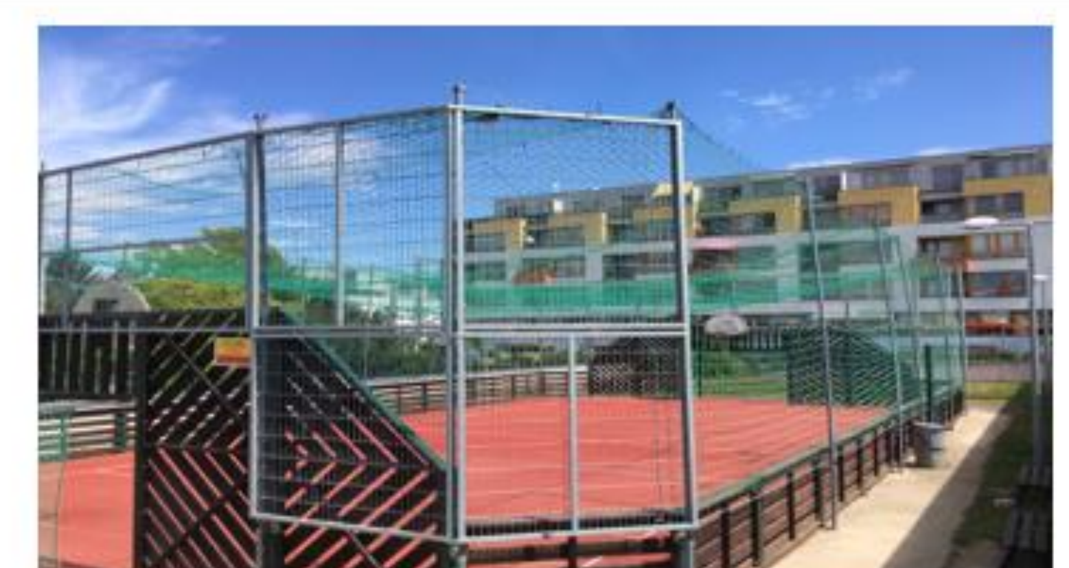
Obrázek 26 Multifunkční sportovní hřiště