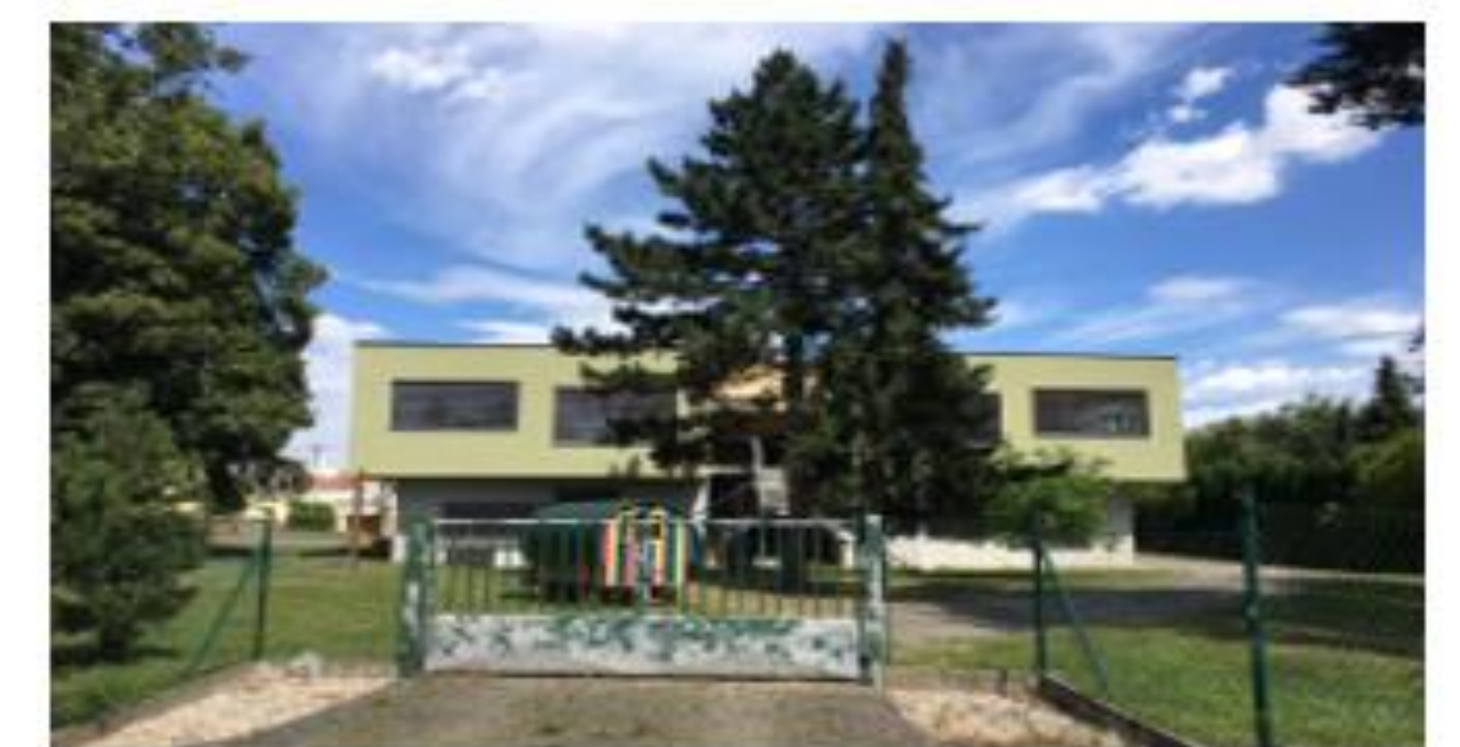
Obrázek 12 Mateřská škola Za Nadýmačem 927, zdroj: vlastní foto