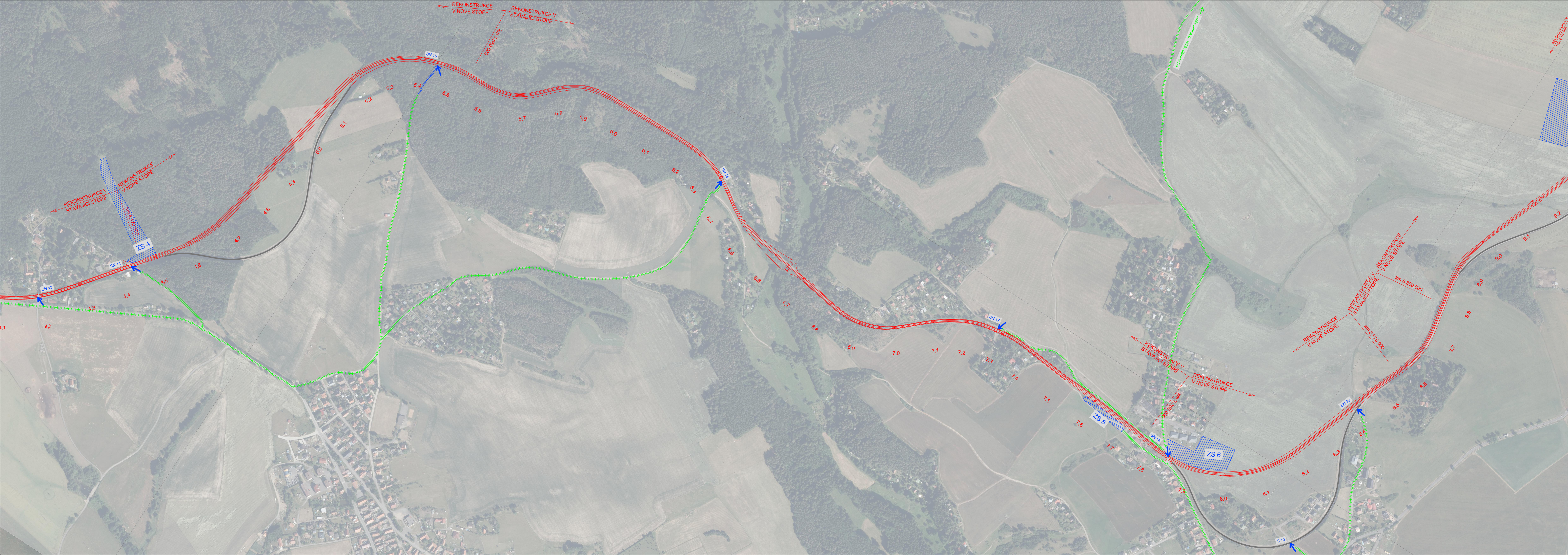
SCHÉMA SKLÁDÁNÍ VÝKRESŮ: