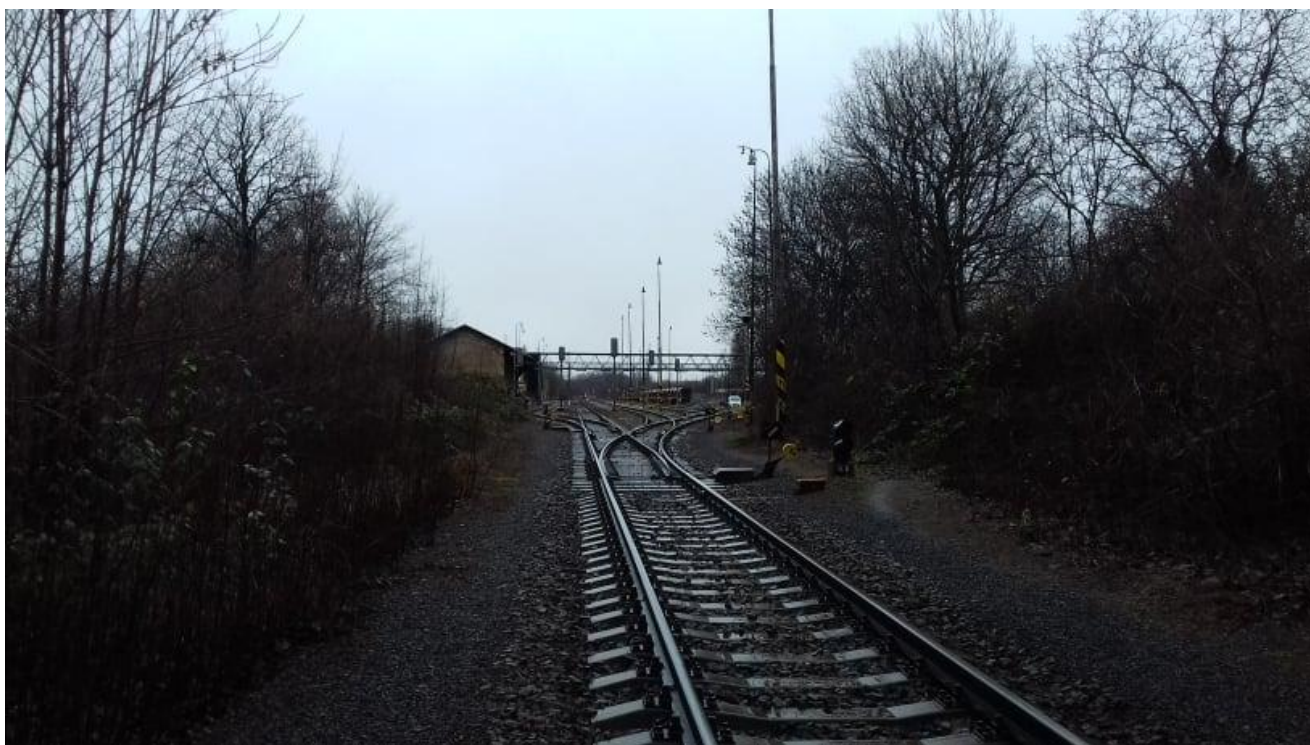
Obr.1: Neratovické zhlaví stanice, výhybka č. 27, pohled proti směru staničení