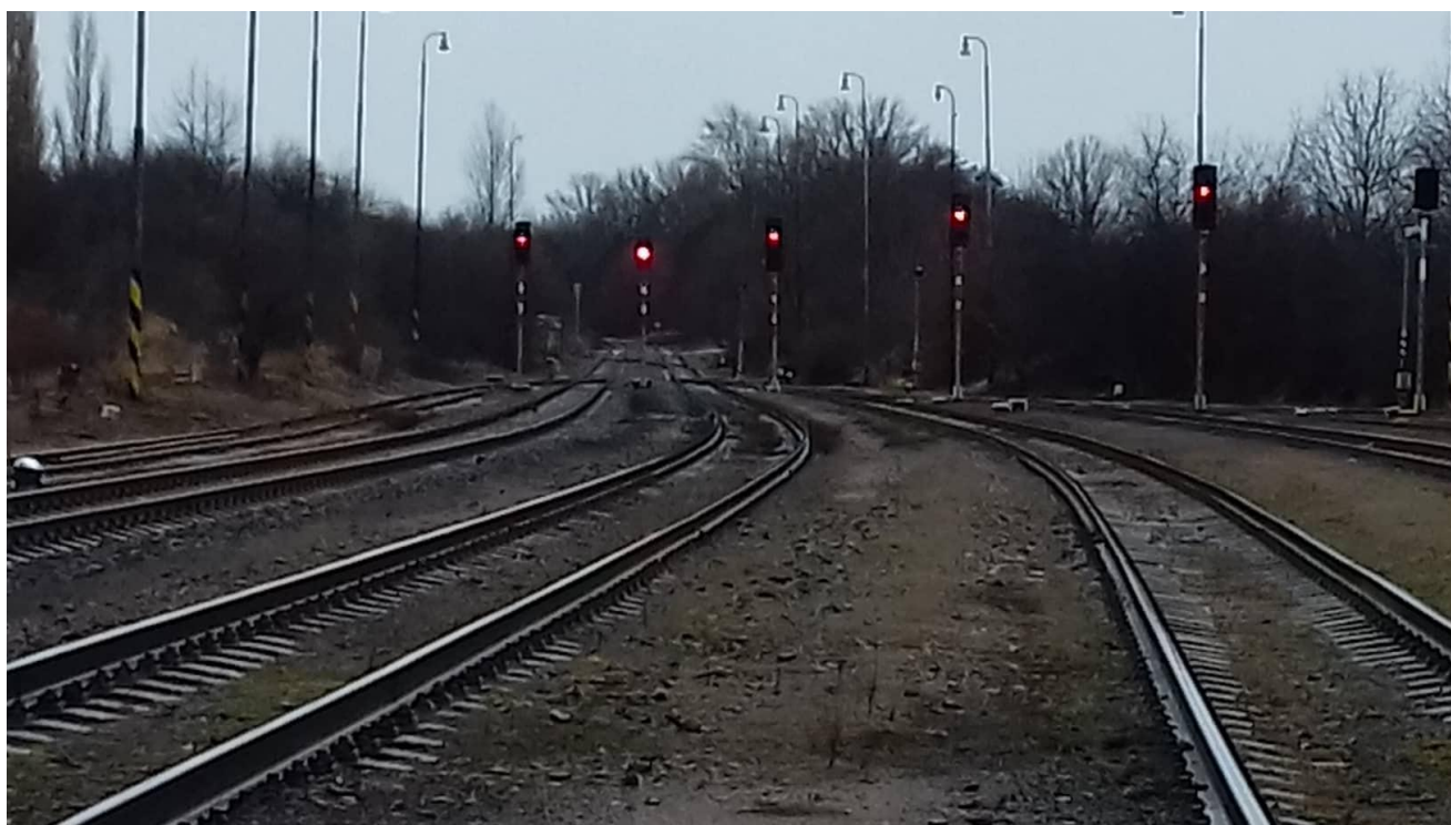
Obr.18: Pohled na pražské zhlaví 2, koleje č. 3 a 5