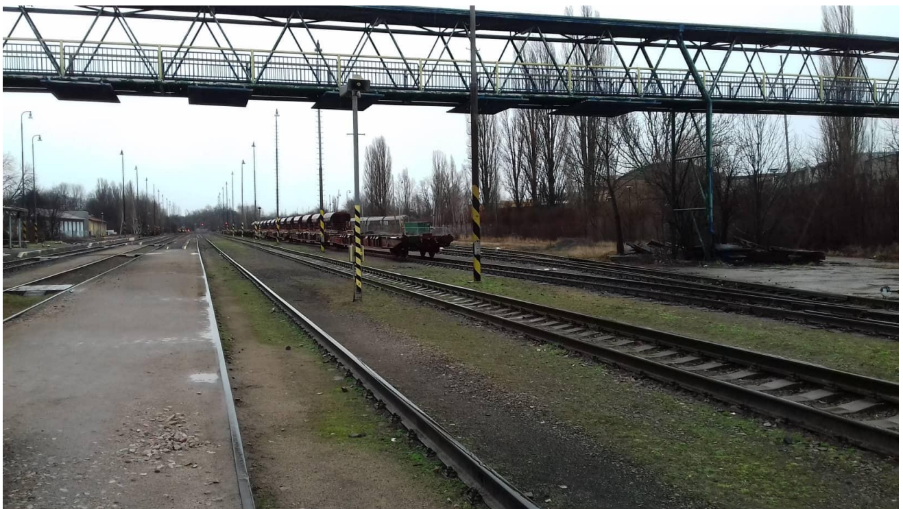
Obr.20: Nadchod ve stanici 2