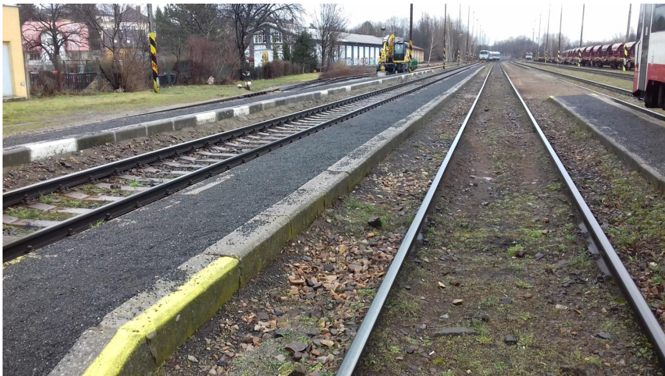
Obr.27: Detail nástupiště II.