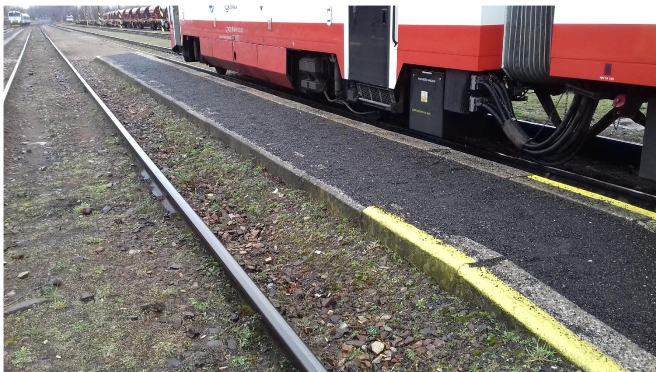
Obr.28: Detail nástupiště III.