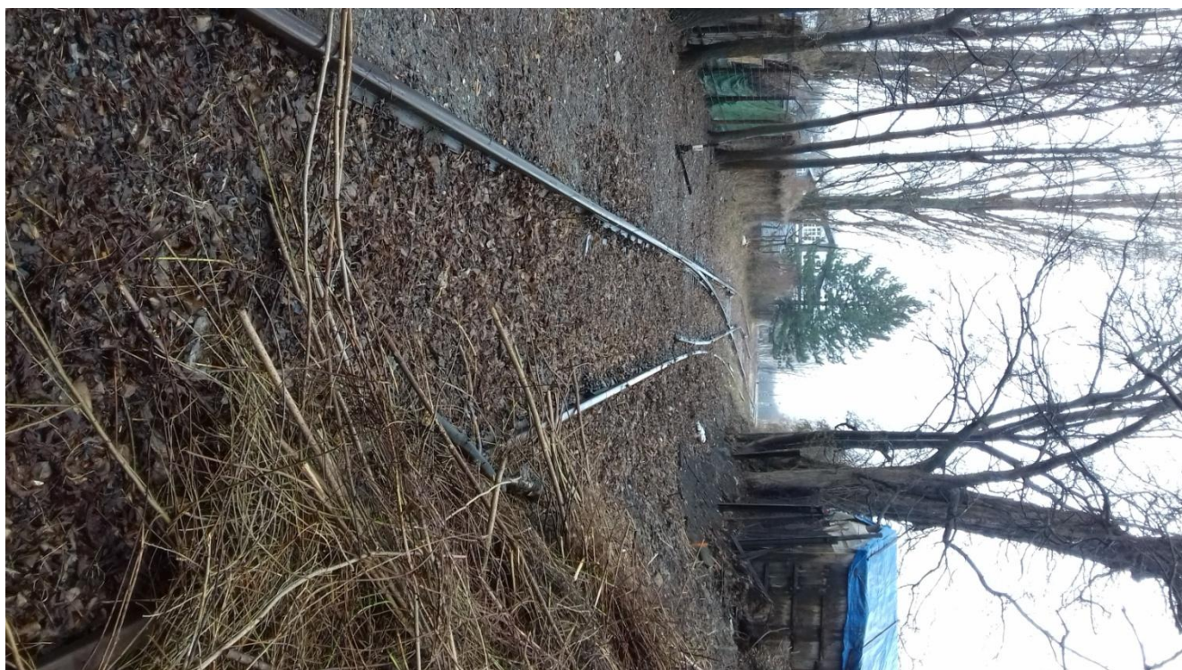
Obr.21: Vlečka č.1118, vjezd do stanice