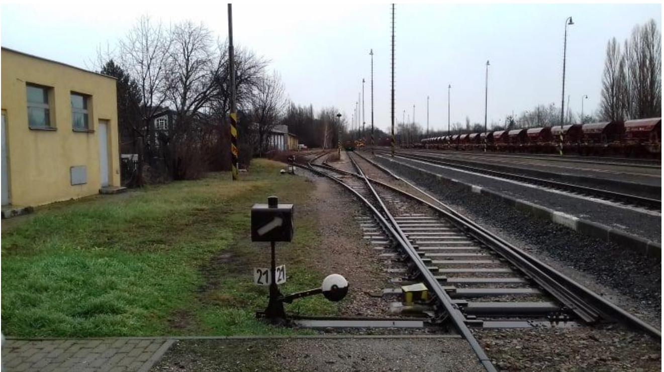
Obr.14: Výhybka č.21 v koleji č.2, vlečka č.1118, pohled proti směru staničení