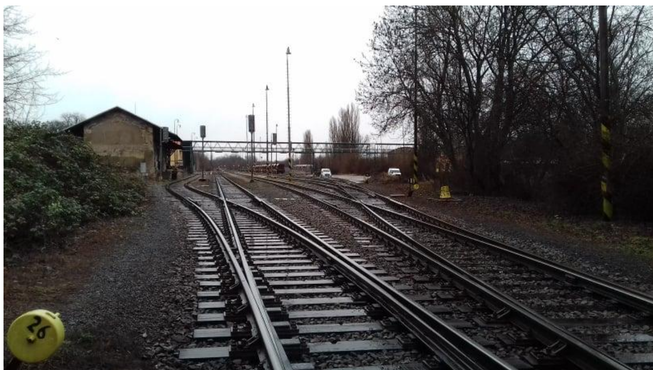
Obr.2: Neratovické zhlaví stanice, výhybky č. 25 a 26, pohled proti směru staničení