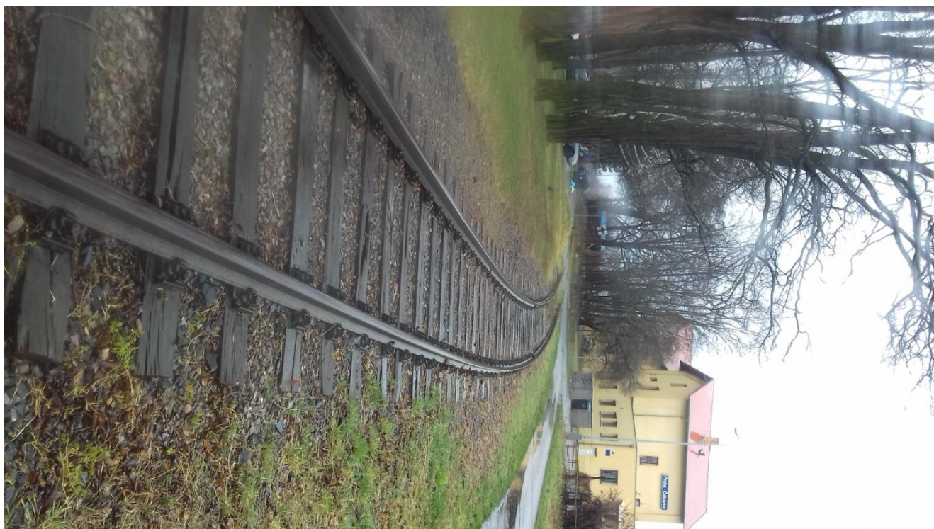
Obr.23: Vlečka č.1118, za výpravní budovou 2