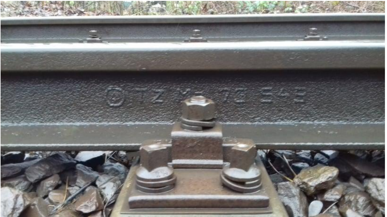
Obr.5: Detail upevnění a typ kolejnic v hlavní dopravní koleji