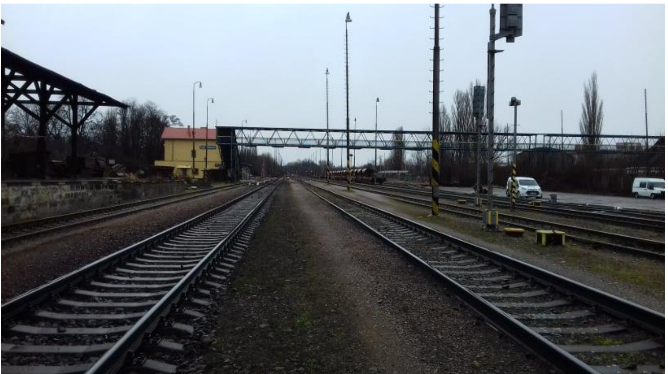
Obr.8: Kolej č. 1 a 3, pohled proti směru staničení