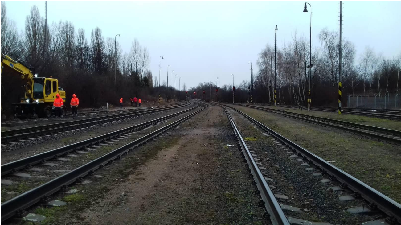
Obr.17: Pohled na pražské zhlaví, koleje č. 3 a 5