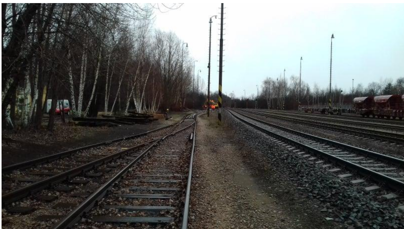
Obr.15: Výhybka č.18A v koleji č.2, vlečka č.1118, pohled proti směru staničení