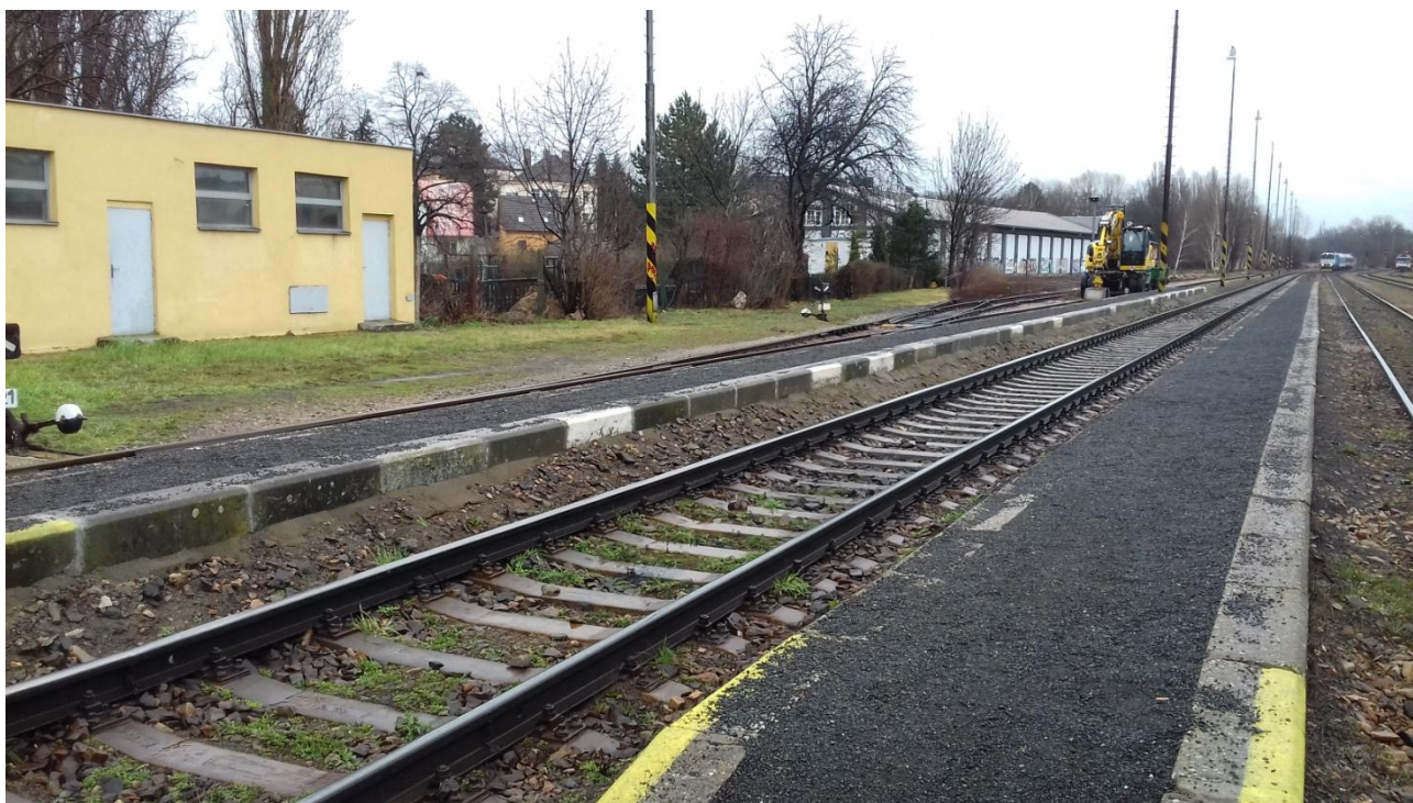
Obr.26: Detail nástupiště I.