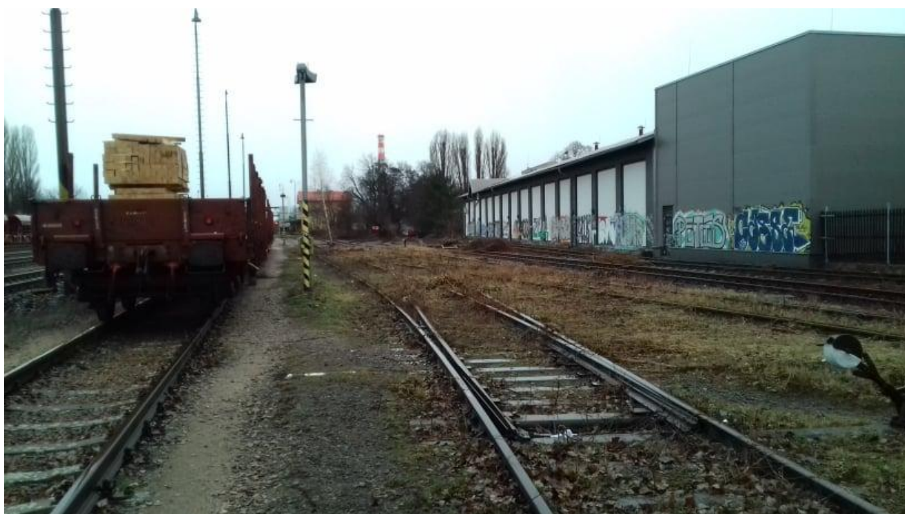
Obr.16: Vlečka č.1118, pohled po směru staničení