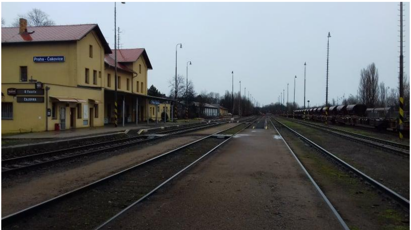
Obr.11: Výpravní budova, nástupiště I. a II. a III. a koleje č. 1, 3 a 5, pohled proti směru staničení