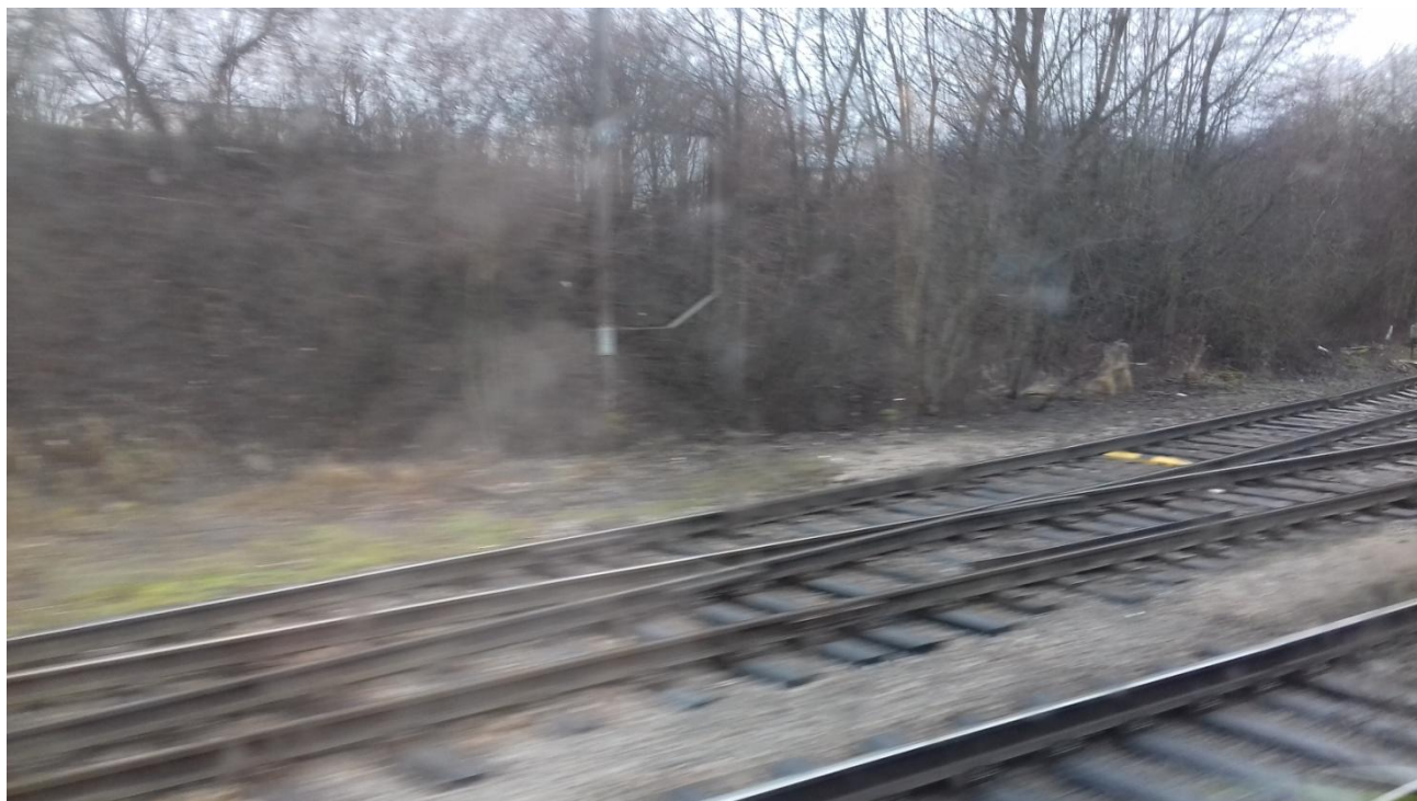
Obr.25: Vlečka č.1244