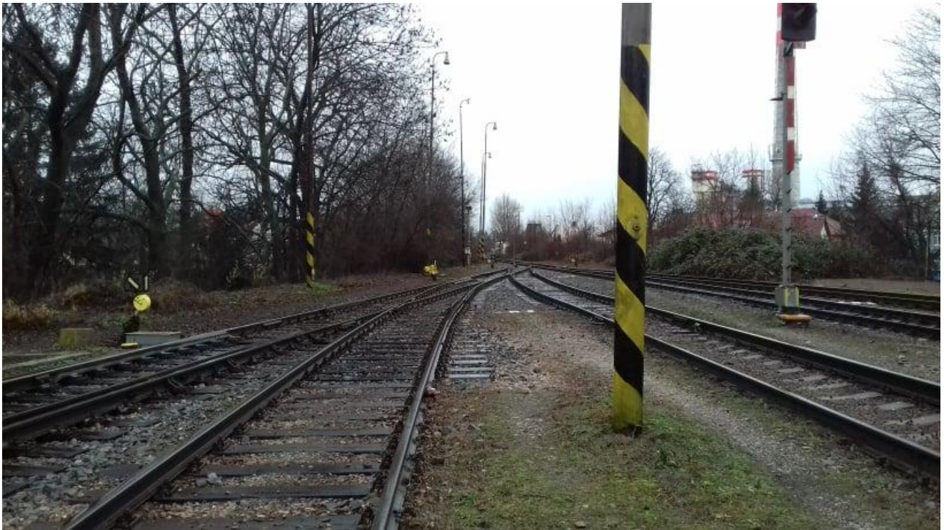
Obr.3: Neratovické zhlaví stanice, výhybka č. 24 a 23, pohled ve směru staničení