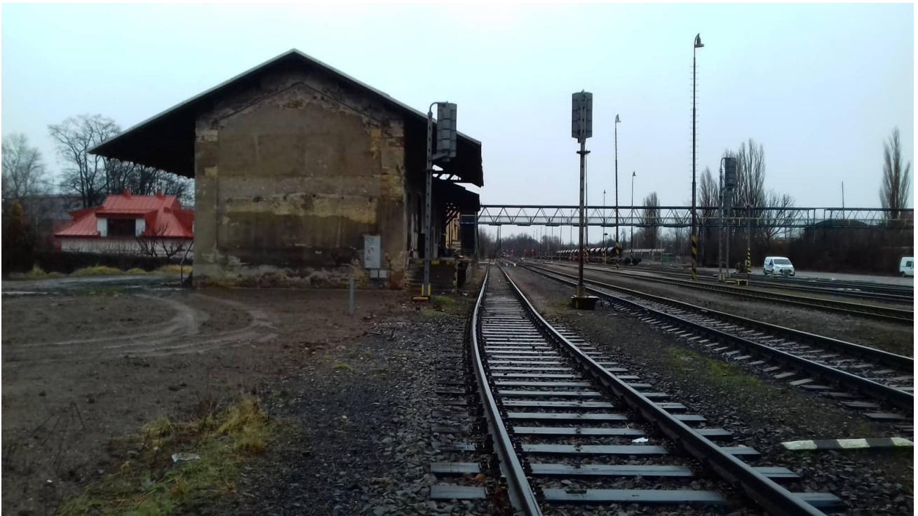
Obr.7: Kolej č. 2 a 1, bývalé překladiště, pohled proti směru staničení