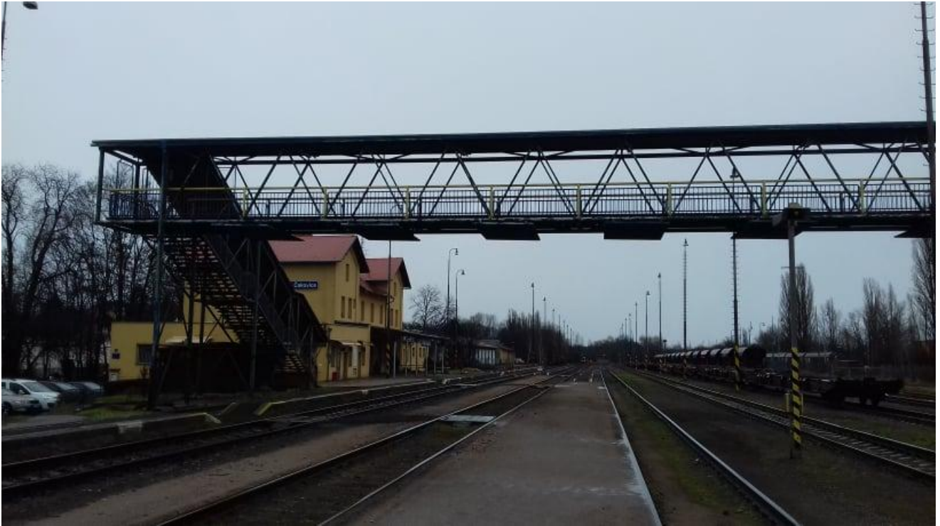
Obr.19: Nadchod ve stanici 1