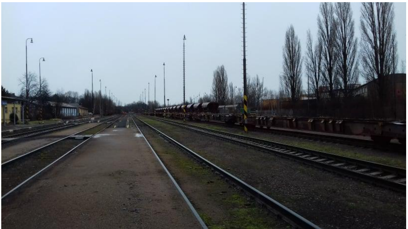
Obr.12: Nástupiště II. a III. a koleje č. 3, 5 a 7, pohled proti směru staničení