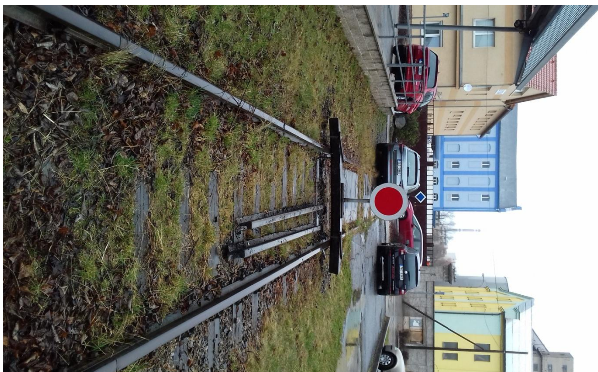
Obr.24: Vlečka č.1118, vjezd do cukrovaru