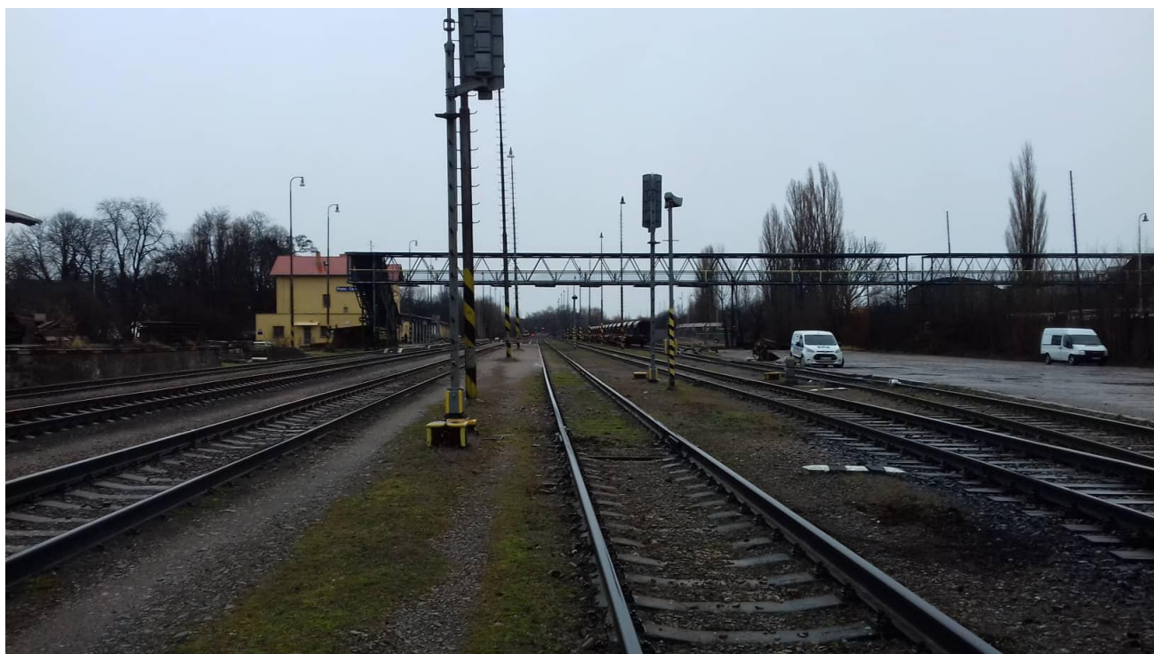
Obr.9: Kolej č. 3, 5 a 7, pohled proti směru staničení