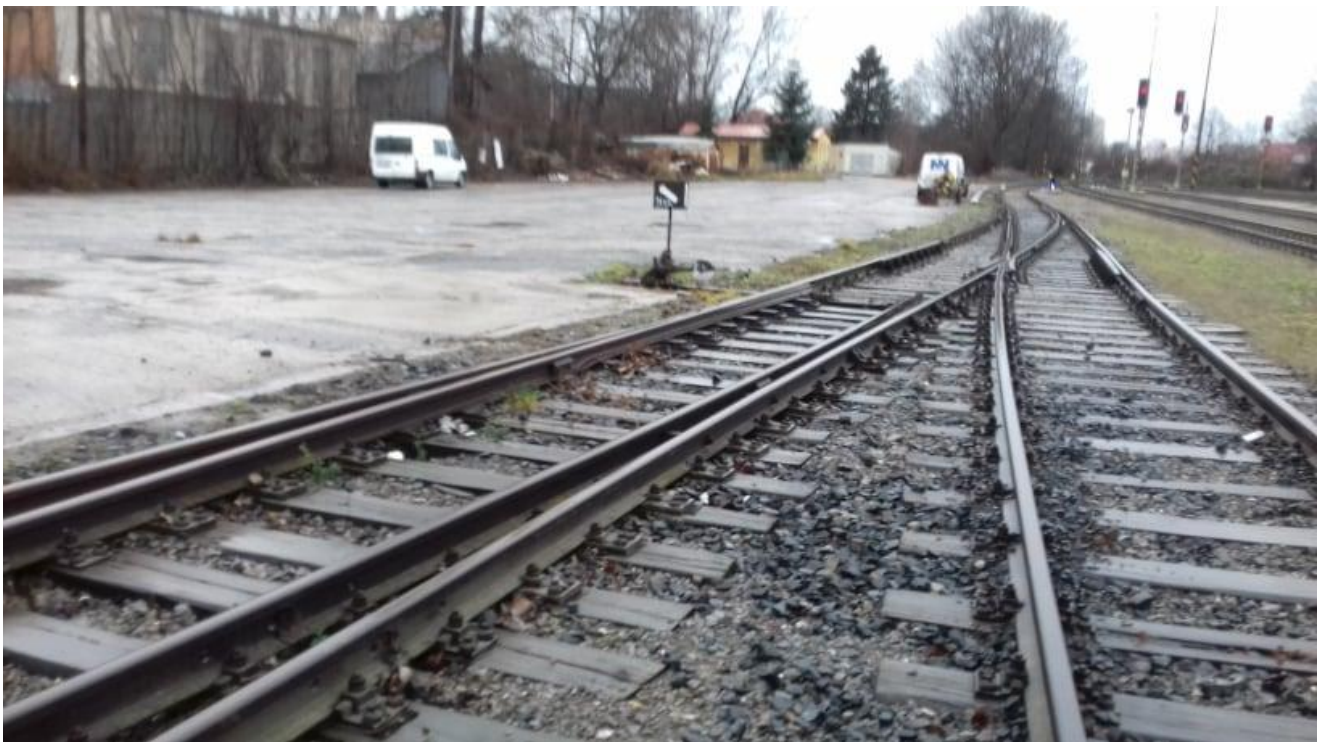
Obr.4: Neratovické zhlaví stanice, výhybka č. 21A a 23A, pohled ve směru staničení