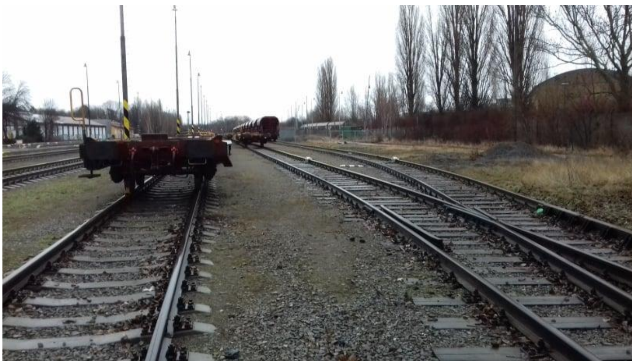
Obr.10: Kolej č. 9, 11 a 13, pohled proti směru staničení