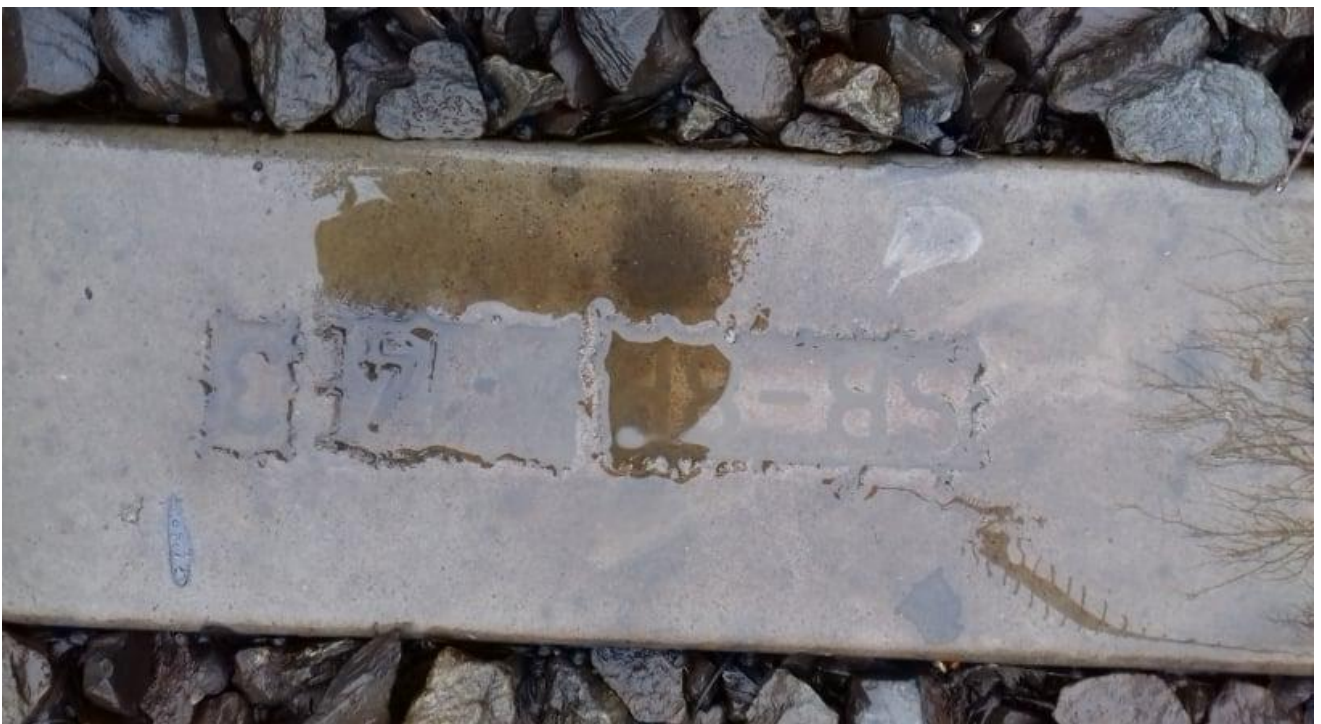
Obr.6: Typ pražců v hlavní dopravní koleji