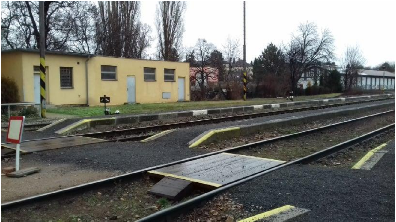
Obr.13: Nástupiště I., II. a III. s přechody