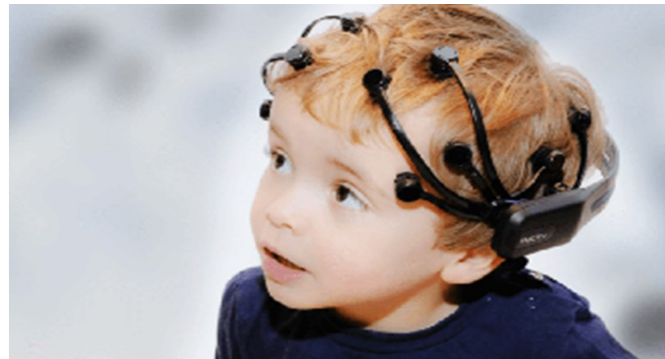
Obrázek 7: EPOC Neuroheadset, Zdroj: www.emotive.com

BCI, prognosis, growth, elektroencefalography, market