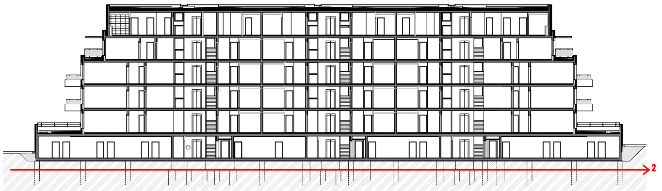
Obrázek 3- Schéma etapy 2