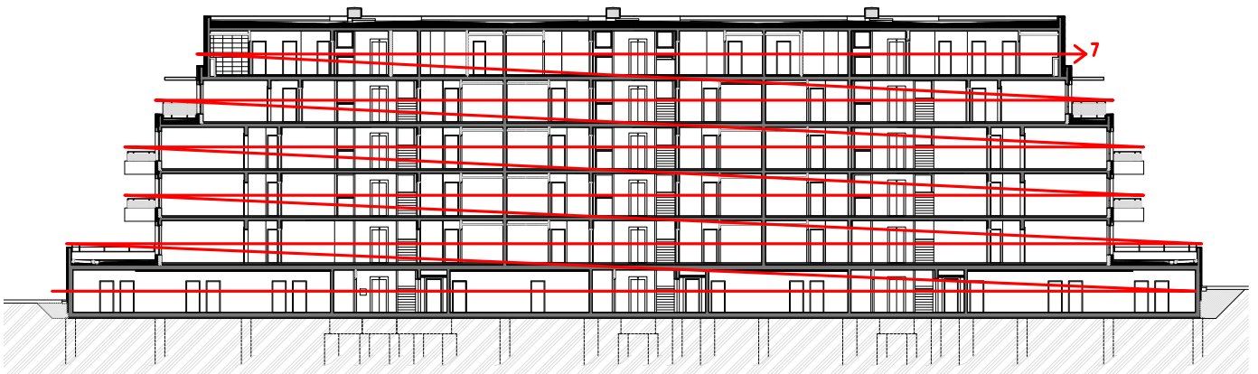
Obrázek 8- Schéma etapy 7