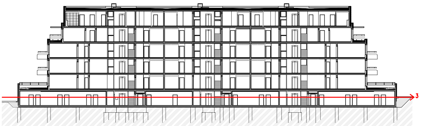
Obrázek 4- Schéma etapy 3