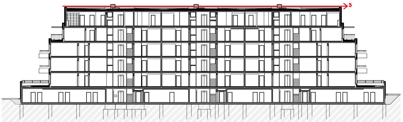
Obrázek 6- Schéma etapy 5