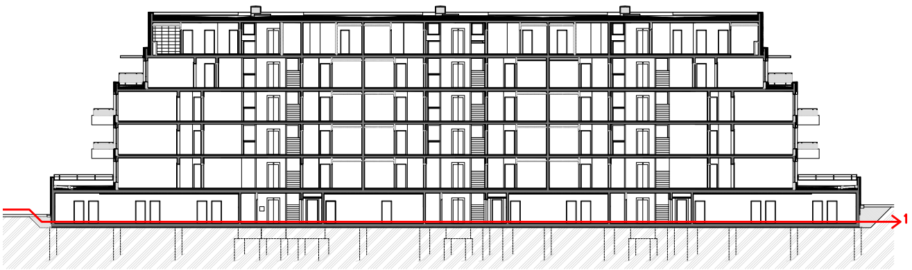
Obrázek 2- Schéma etapy 1