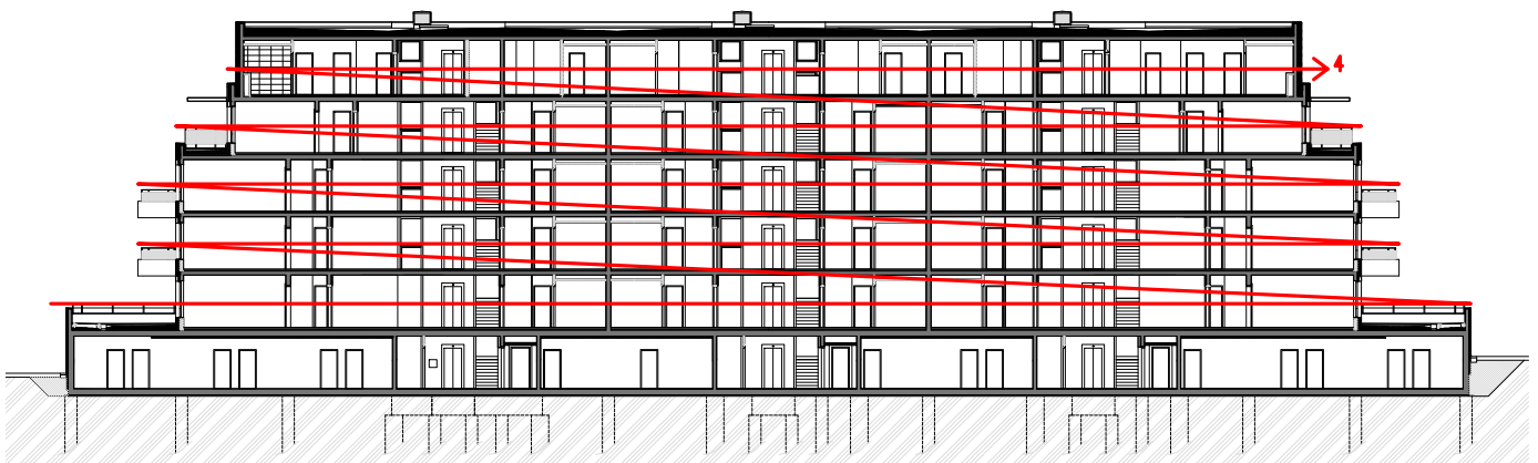
Obrázek 5- Schéma etapy 4