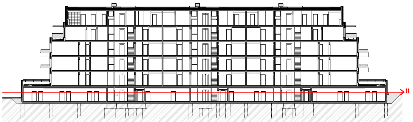
Obrázek 12- Schéma etapy 11