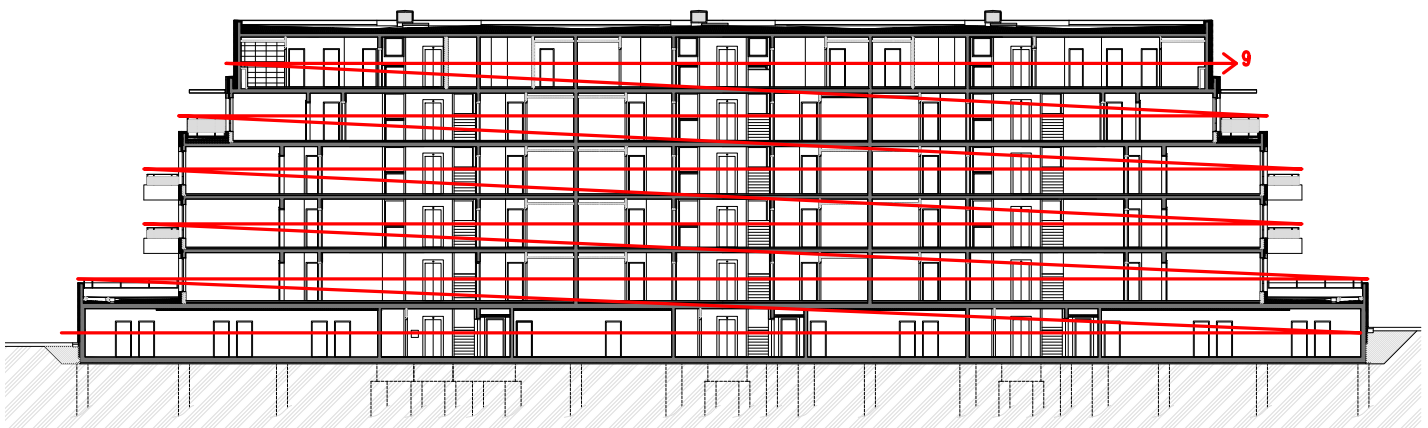
Obrázek 10- Schéma etapy 9