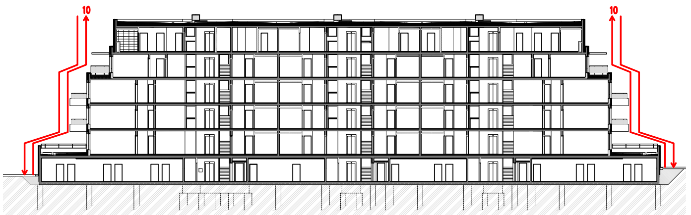
Obrázek 11- Schéma etapy 10