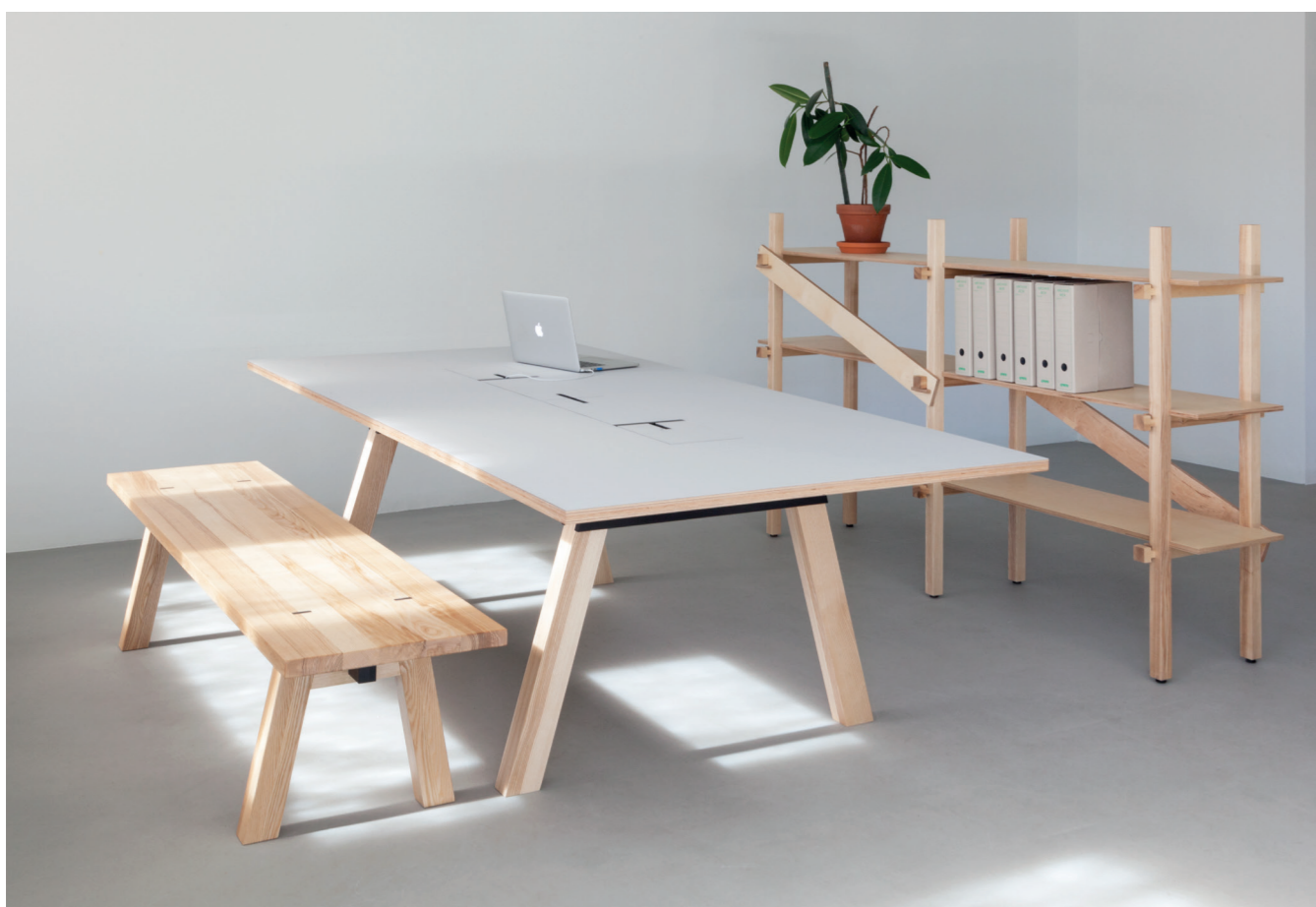
Poslední kolekce kancelářského nábytku TAK společnosti Profil nábytek