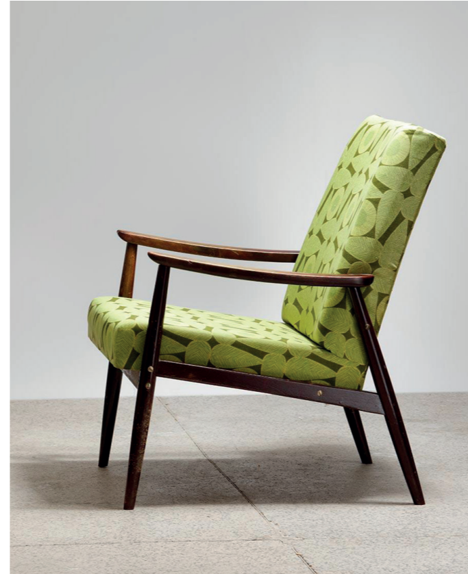
Retro křesilka ze 60. let od Jitony

Následuje vymezení problematiky zacházení designu ve vybrané společnosti a na základě poznatků z celé práce je vytvořena strategie pro zapojování designéru do výroby a několik doporučení pro implementaci designu do firemních činností společnosti Profil nábytek.