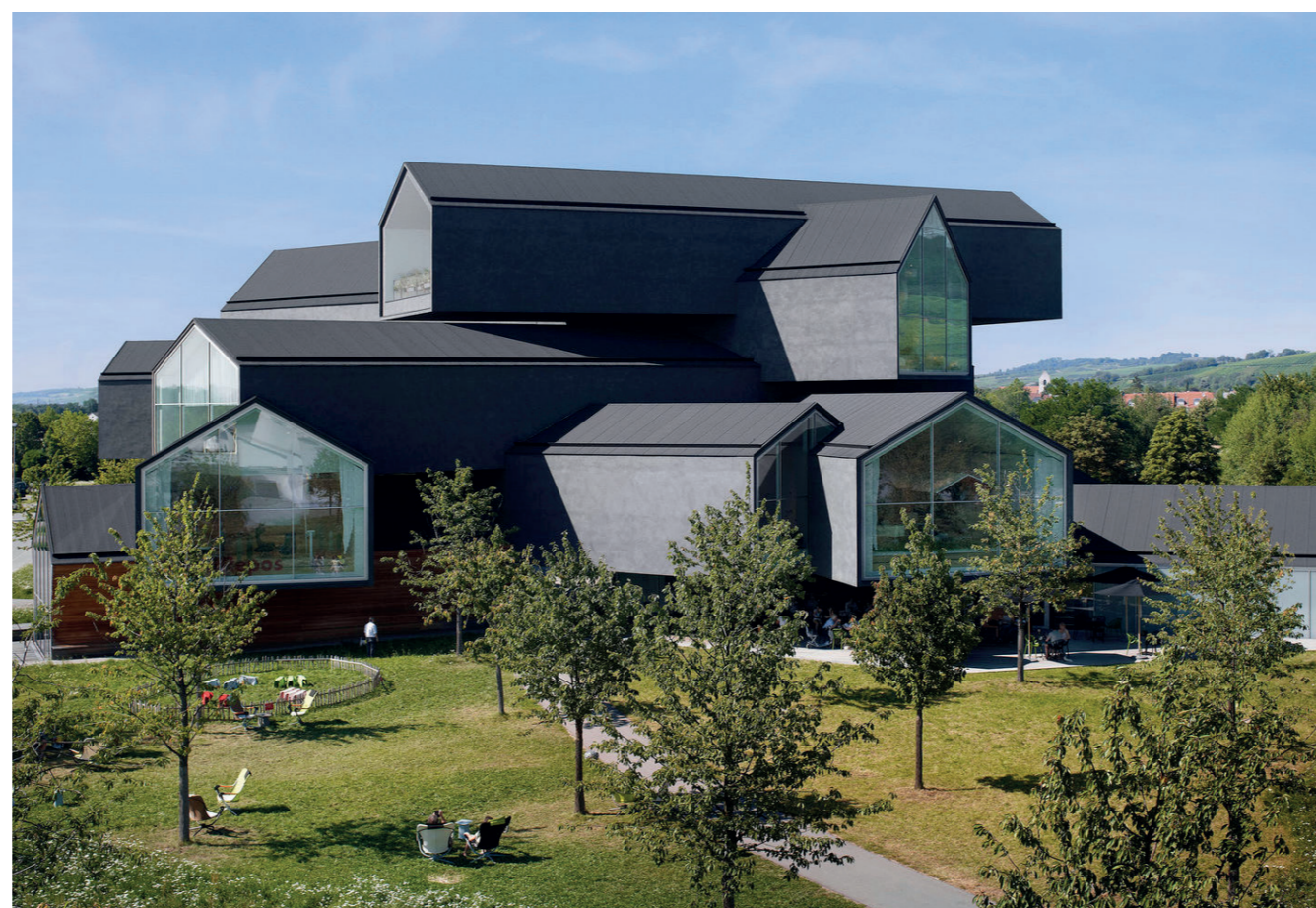
Vitra Campus Weil am Rhein