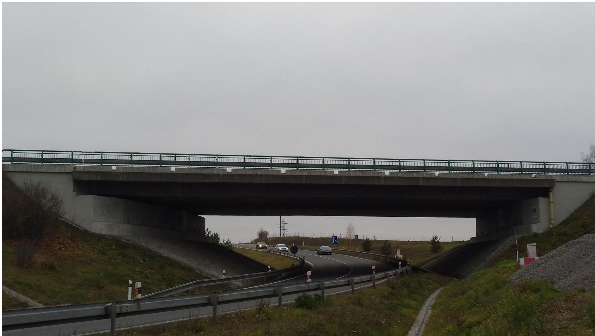
Obrázek 1 – D3 (EXIT 76) – pohled na most