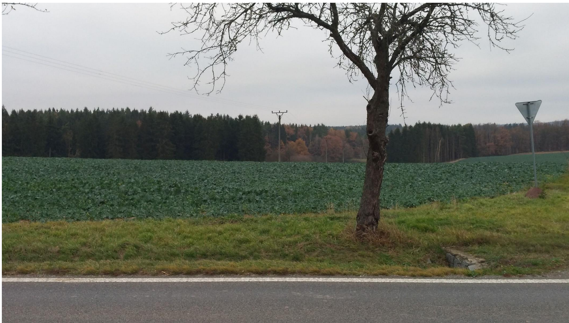
Obrázek 7 - Stávající komunikace I/19 – pohled na údolí Chotovinského potoka