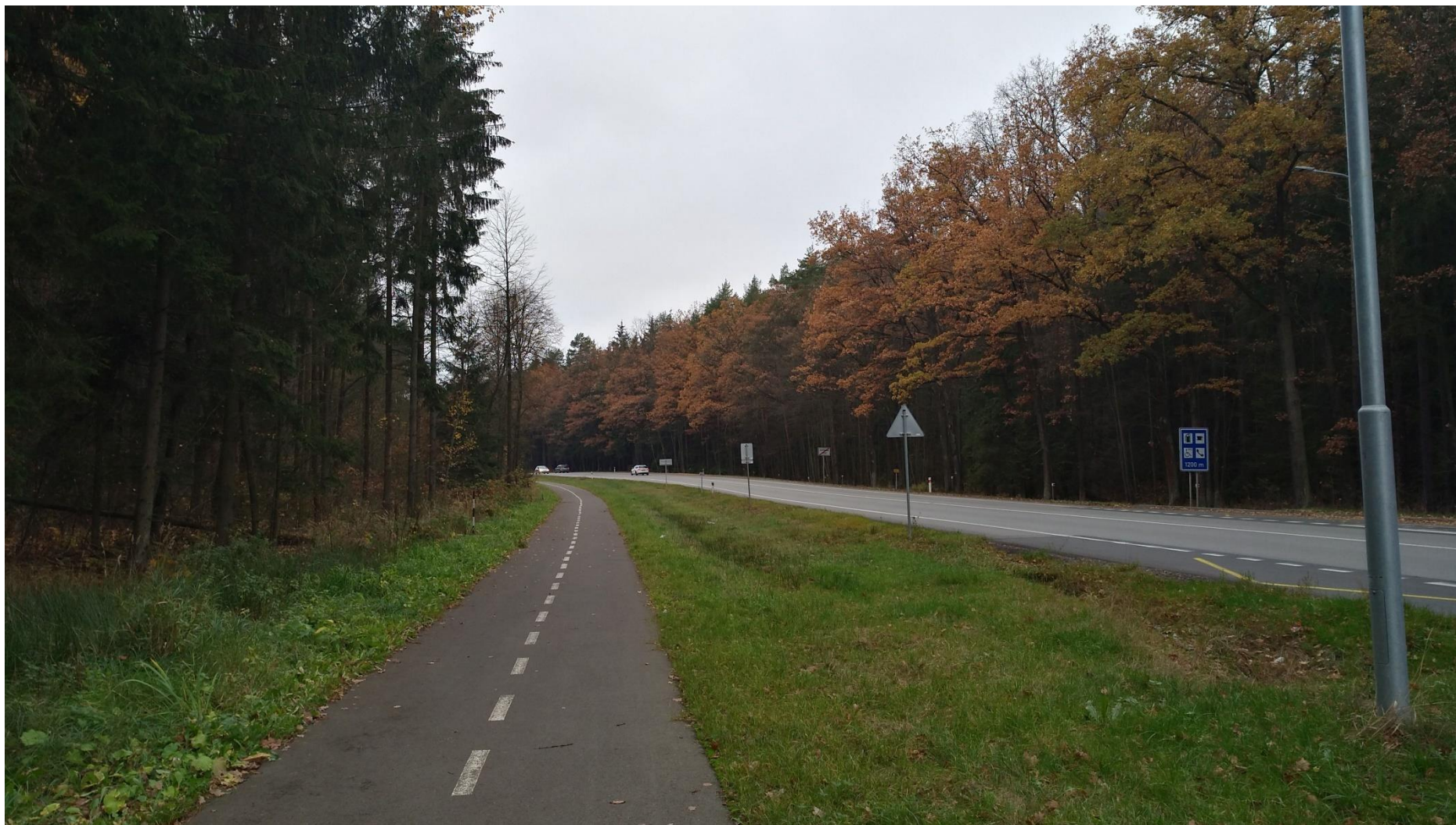
Obrázek 8 - Stávající komunikace I/19 –směr Tábor