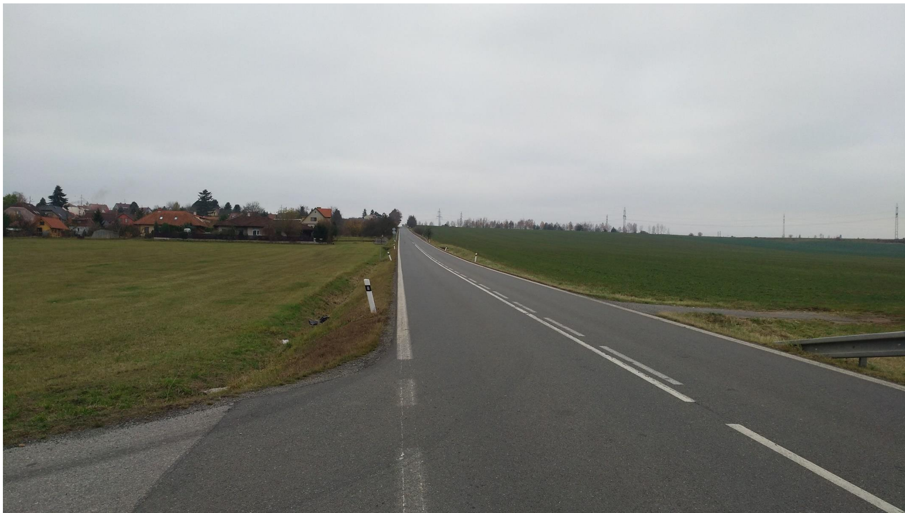
Obrázek 3 - Stávající komunikace II/137 – pohled na obci Záluží