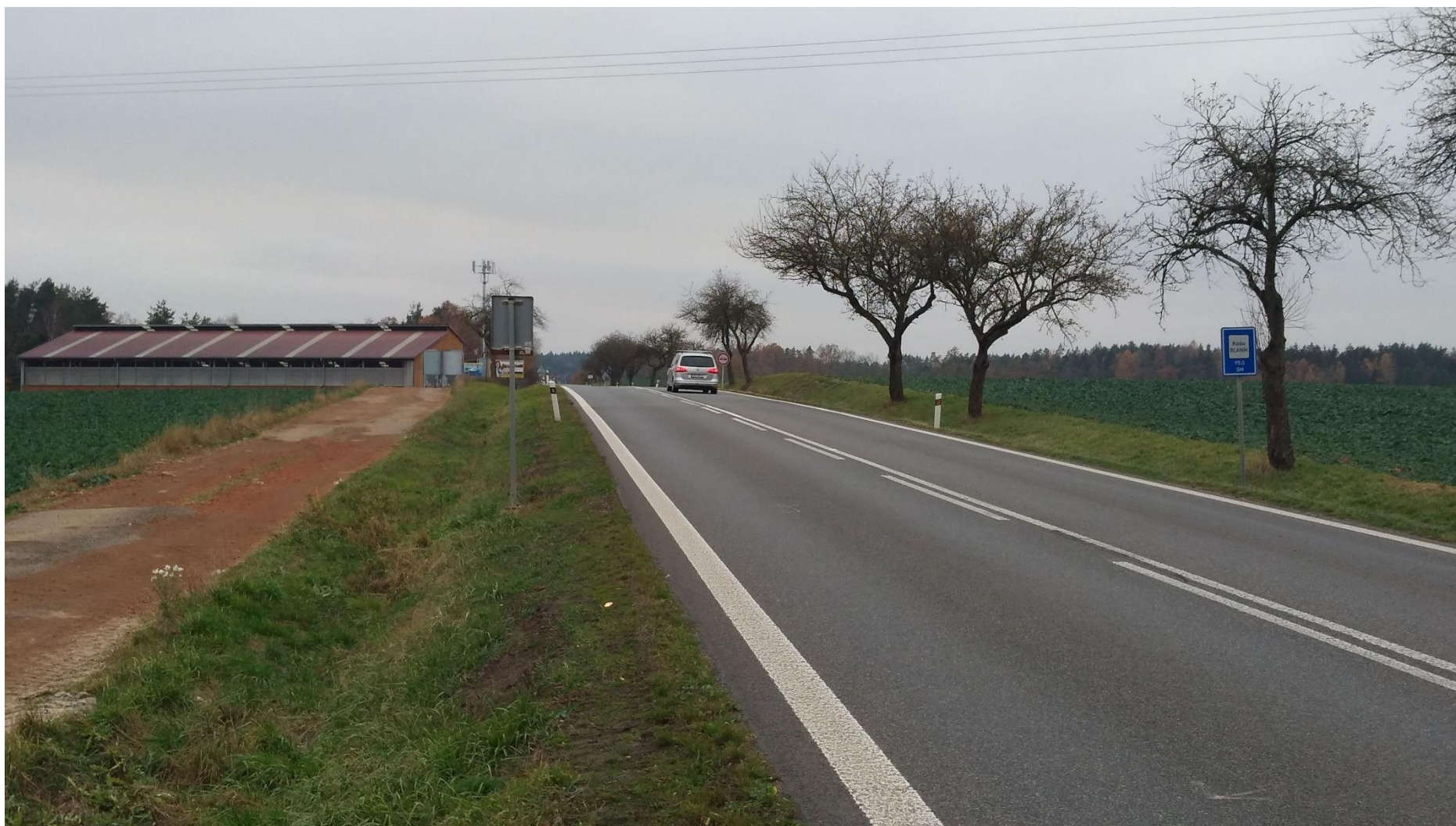
Obrázek 6 - Stávající komunikace I/19 –pohled na obci Zárybnická Lhota