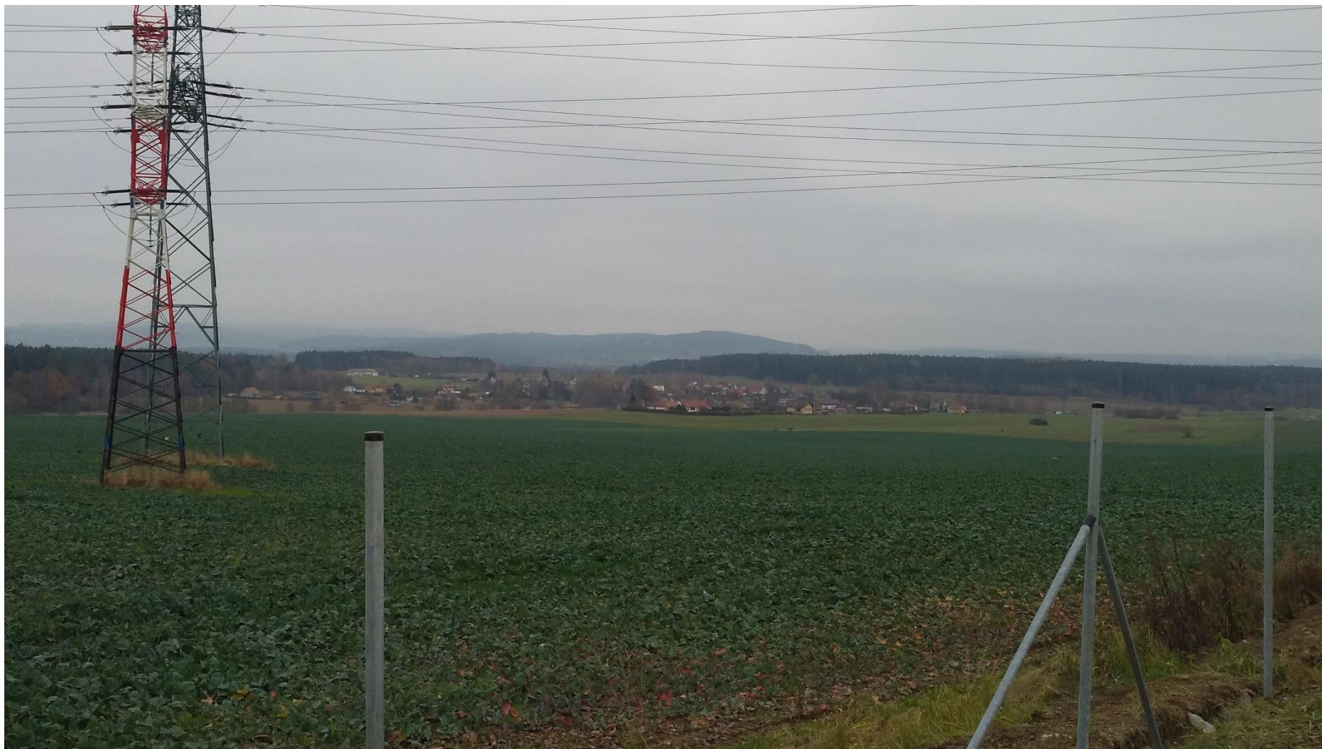
Obrázek 2 – D3 (EXIT 76) – pohled na obci Hlinice