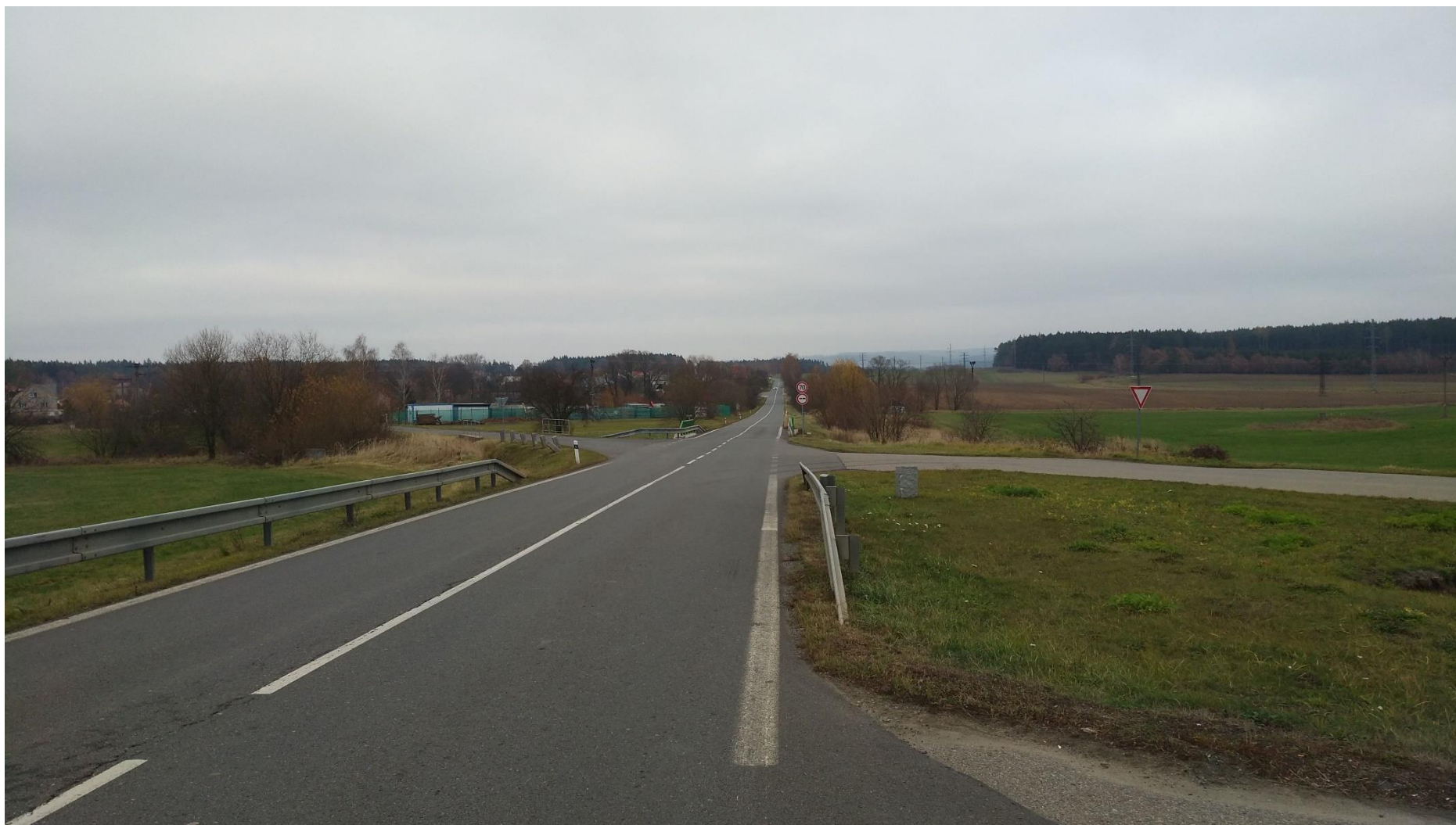
Obrázek 5 - Stávající komunikace II/137 – pohled na obci Hlinice