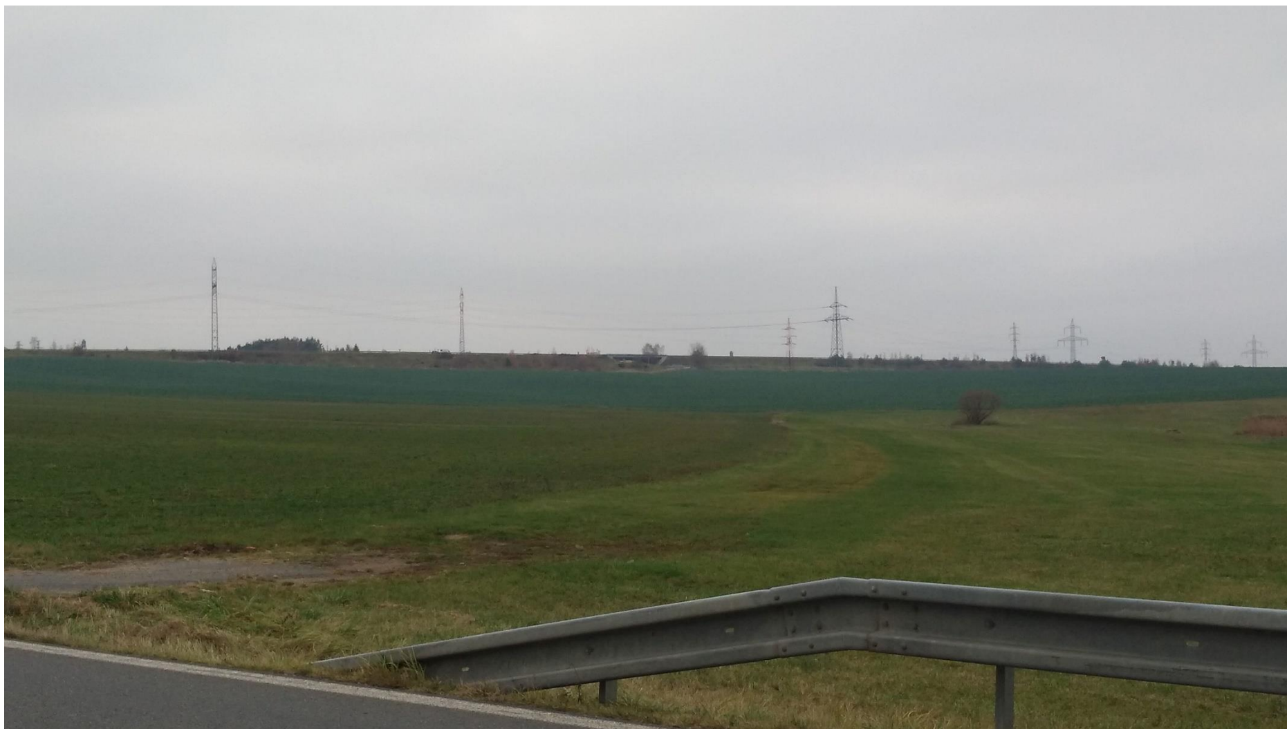
Obrázek 4 - Stávající komunikace II/137 – pohled na D3 (EXIT 76)