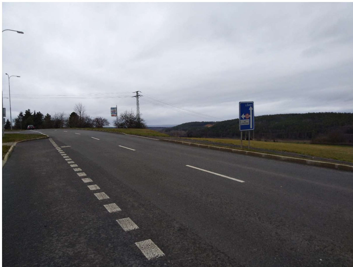
Obr. 9. Místo napojení nově navržené místní komunikace