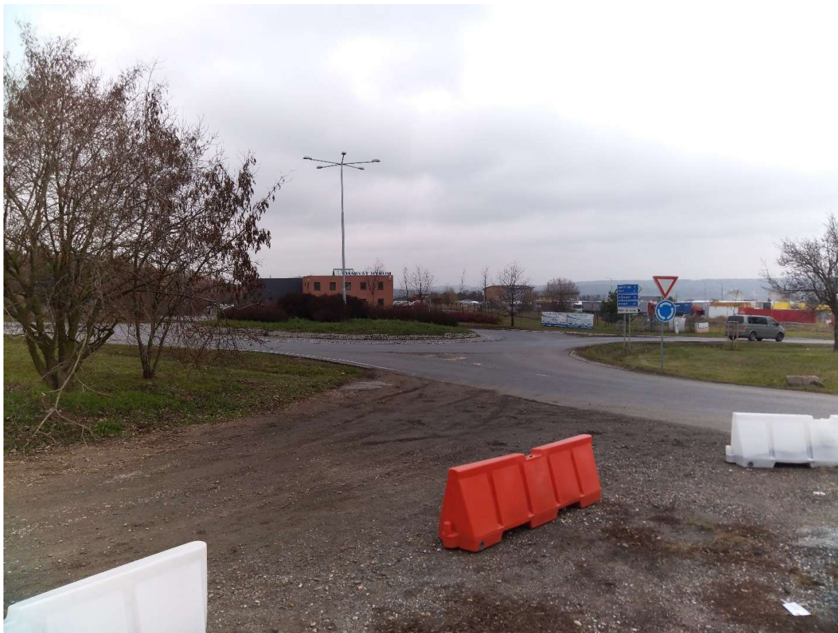
Obr. 1. Okružní křižovatka na začátku úpravy