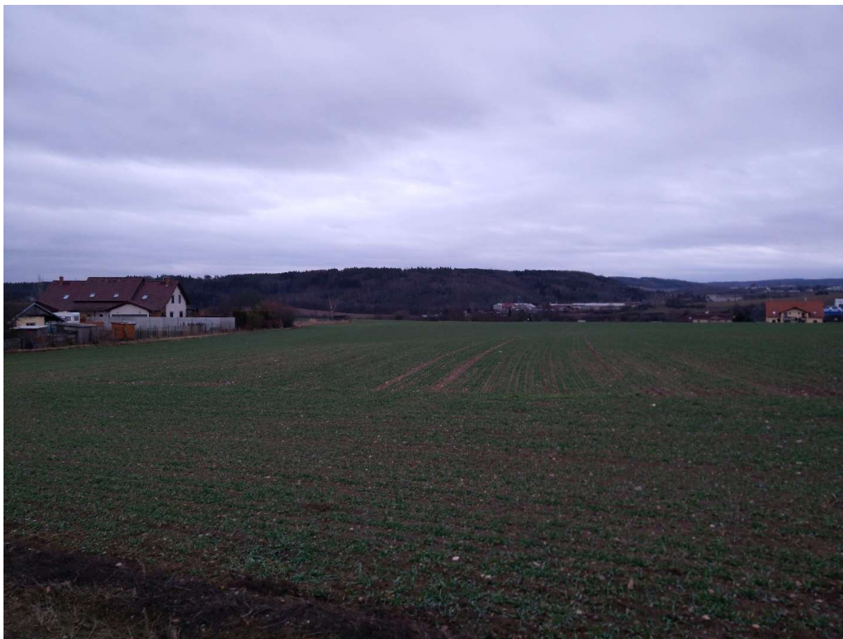
Obr.5 pohled na úsek mezi lokalitou „Na spravedlnosti“ a Rakovníkem