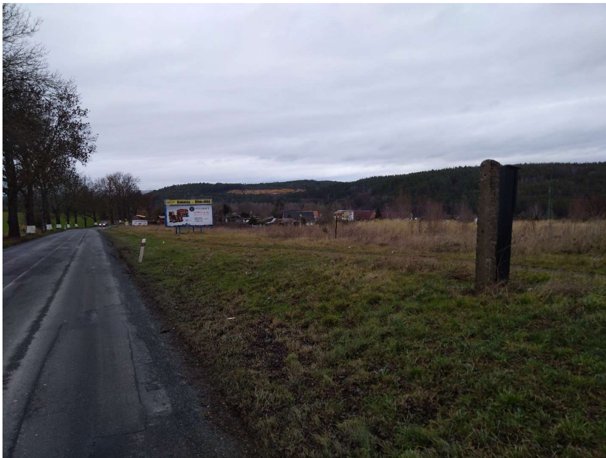
Obr.12. Místo konce úpravy, Okružní křižovatka