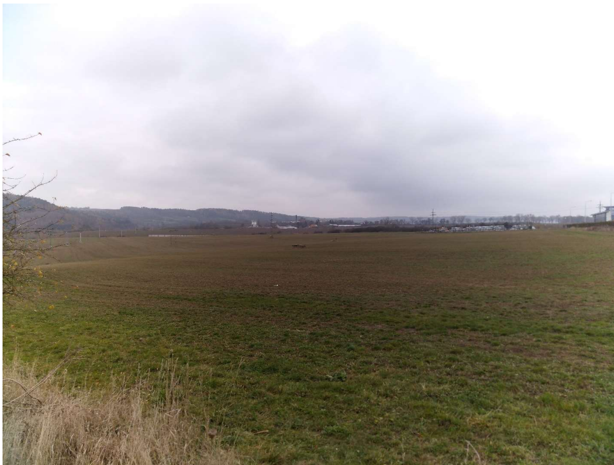
Obr.2. pohled od Okružní křižovatky, začátek vedení trasy