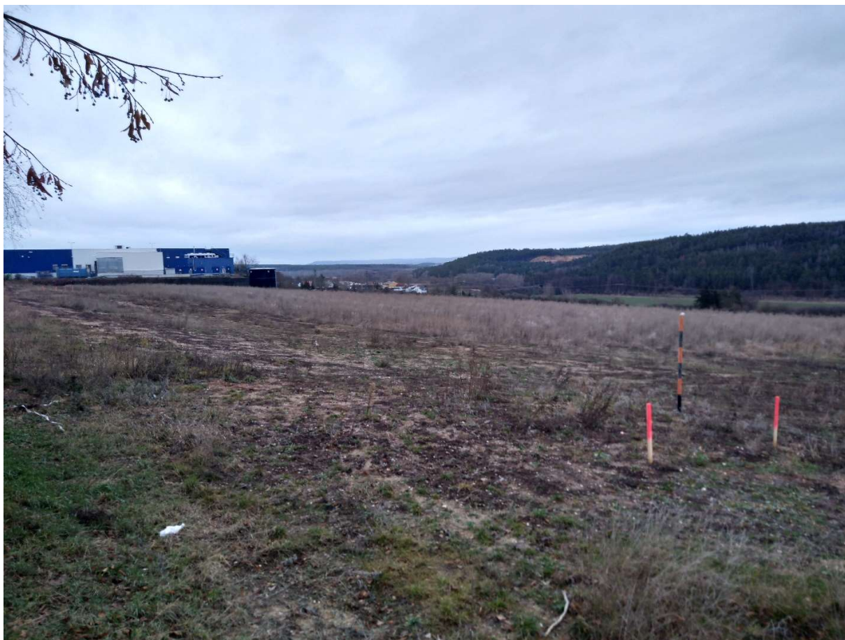
Obr.11 Pohled na obchodní dům Tesco, trasa obchvatu je navržena za obchodem