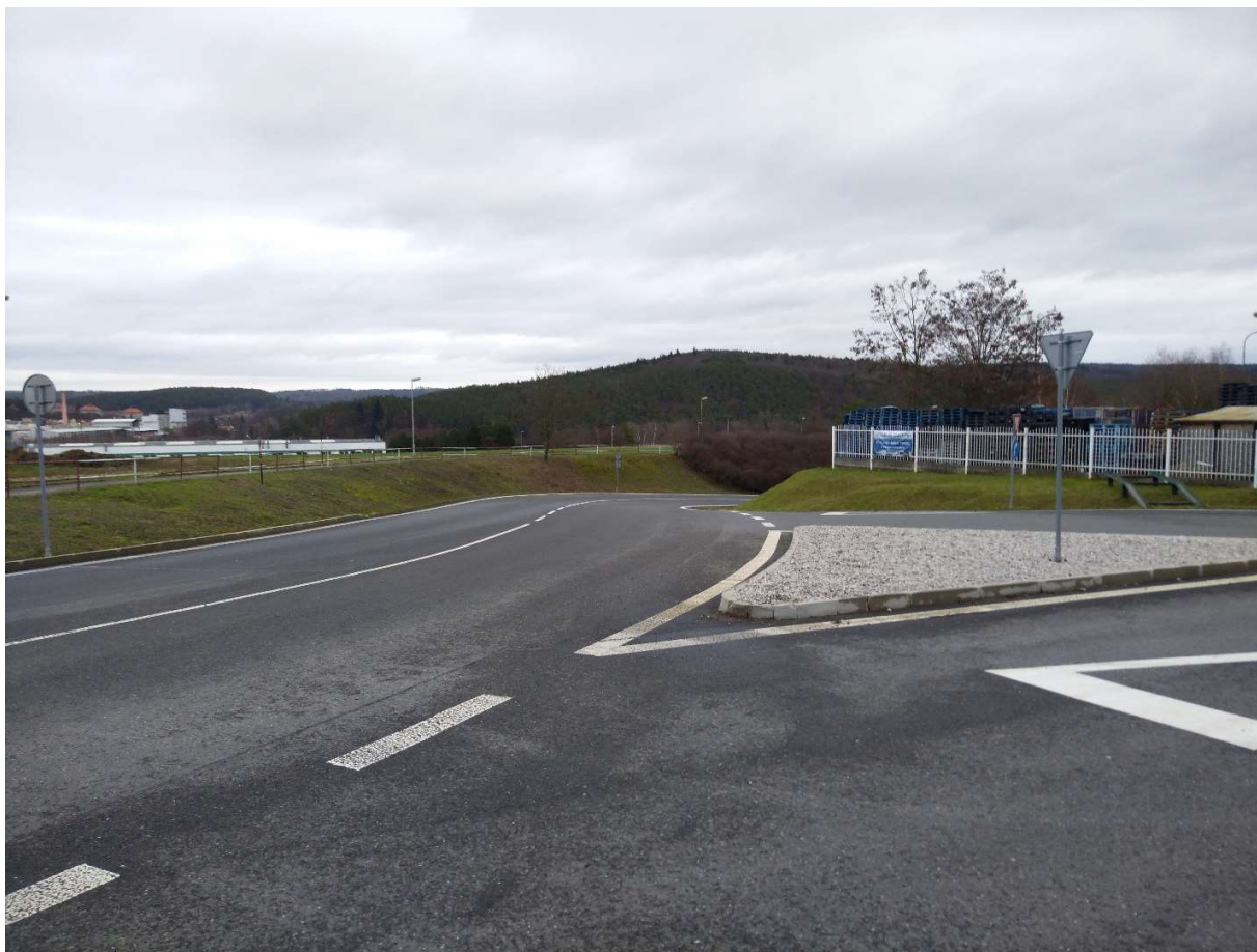
Obr.8. Pohled na místo budoucí mimoúrovňové křižovatky