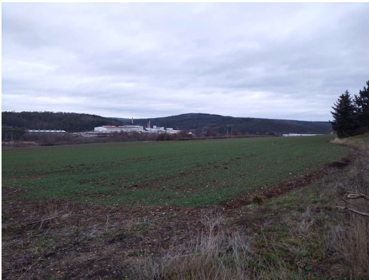
Obr.10. Pohled směrem na výrobní závod RAKO, konec obchvatu