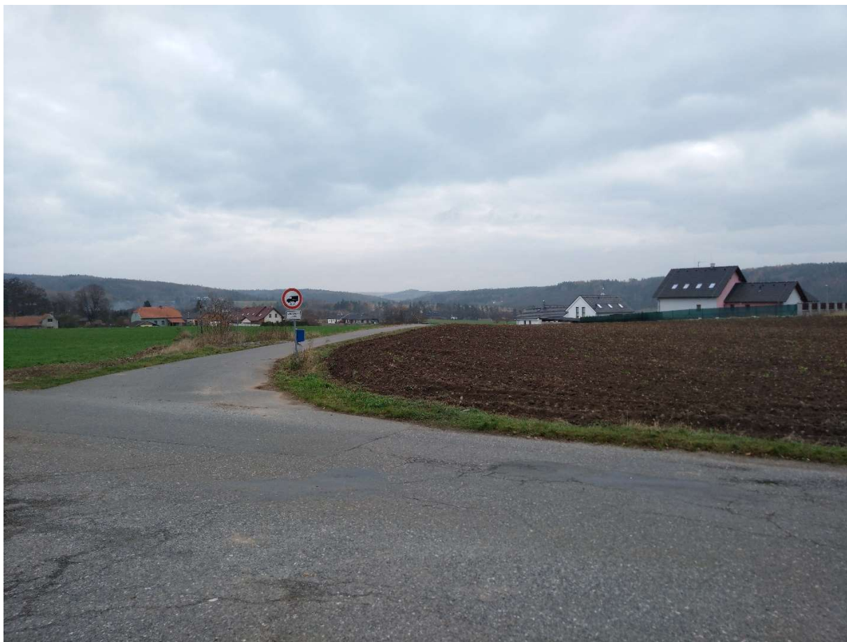
Obr. 6. Pohled na místo budoucího křížení s místní komunikací a napojením účelových komunikací