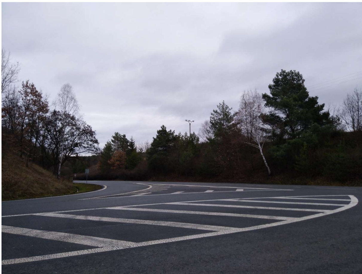
Obr.7. Pohled na budoucí mimoúrovňovou křižovatku, silnice II/237