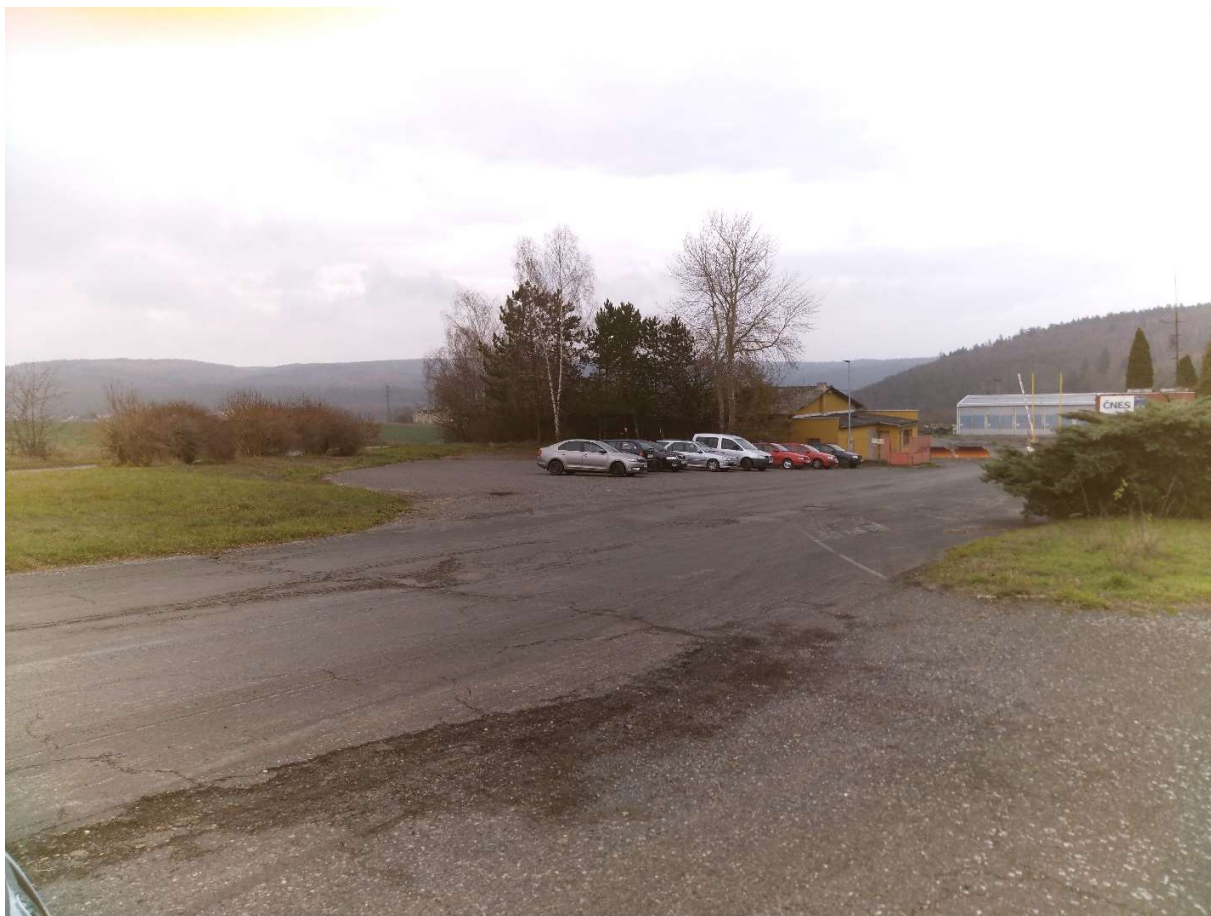
Obr.3. Správa a údržba silnic