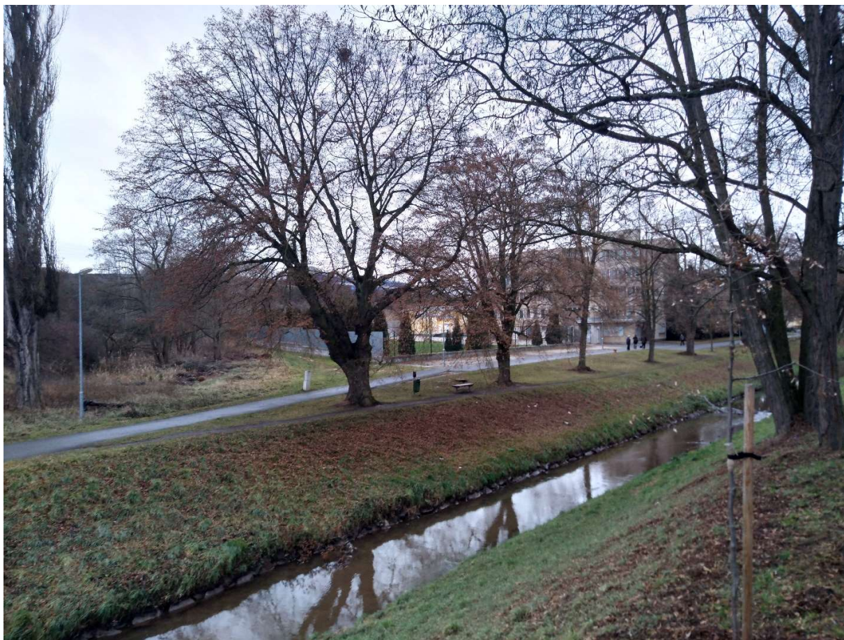
Obr.4. Údolí Rakovnického potoka v místě plánovaného přemostění