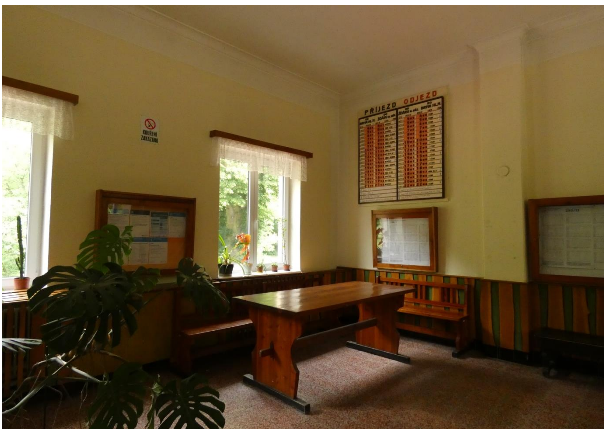
Fotografie 26: Zastávka Doubravník – interiér bývalé VB