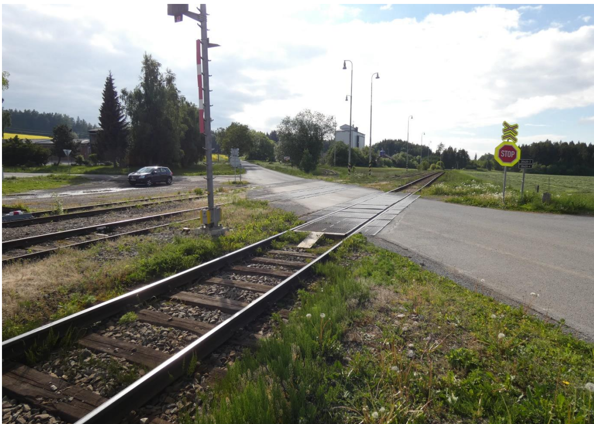
Fotografie 33: Železniční přejezd u žst. Veselíčko přes 3 koleje