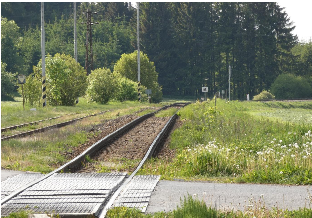
Fotografie 34: Technický stav žel. svršku u žst. Veselíčko – směr Žďár nad Sázavou