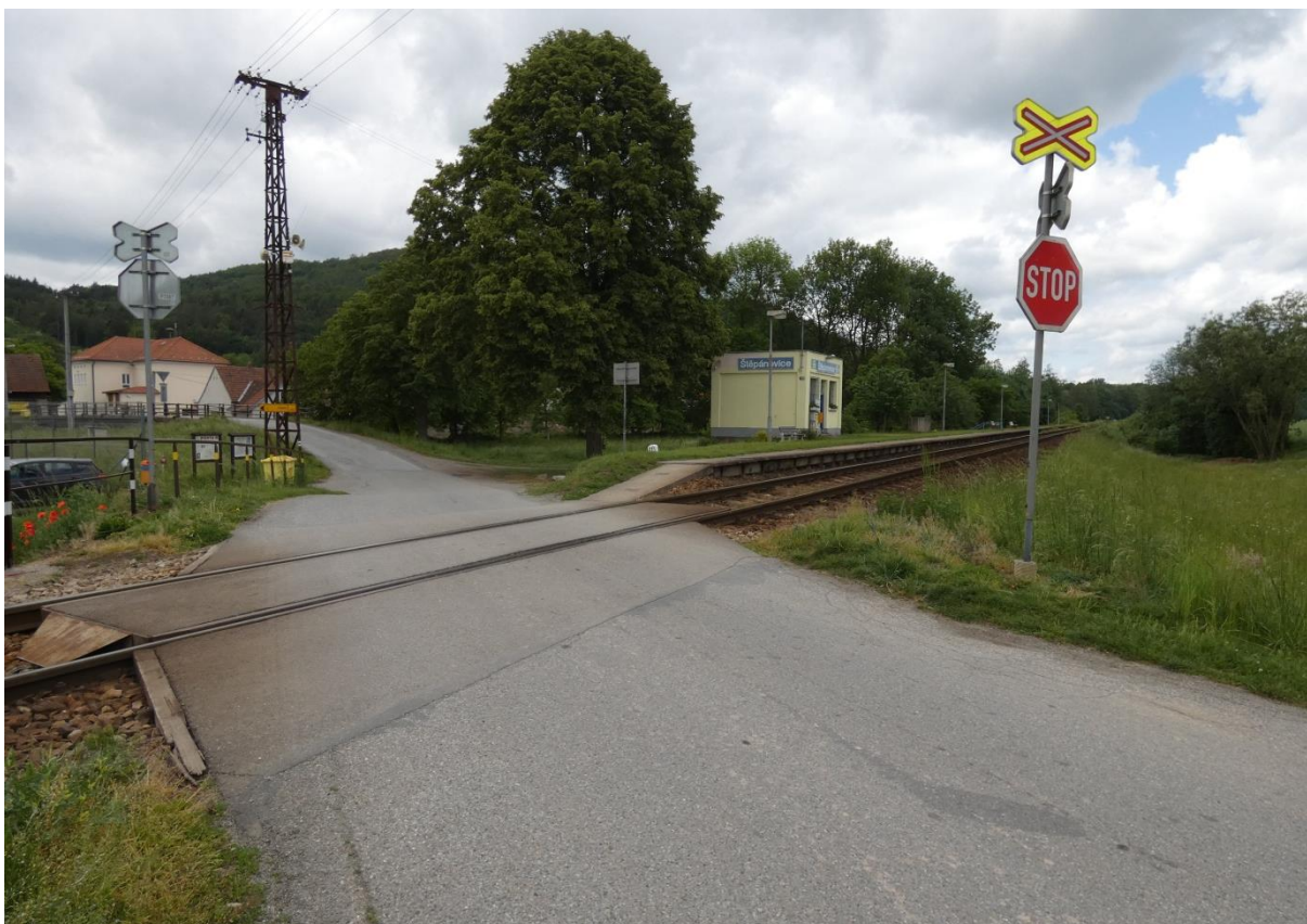
Fotografie 31: Pohled na zastávku Štěpánovice