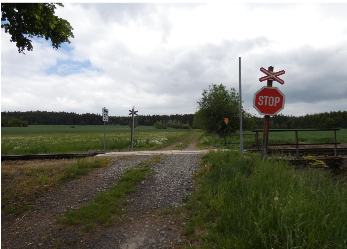
Fotografie 36: Přístupová komunikace k zastávce Rovné – Divišov