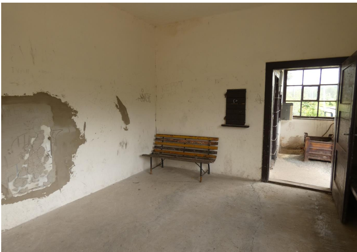
Fotografie 30: Zastávka Borač – interiér zastávkového domku