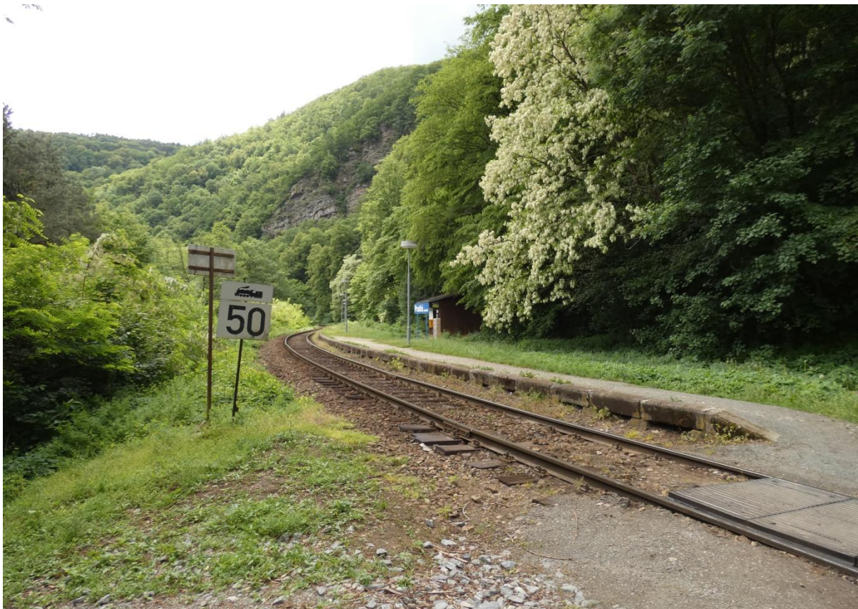
Fotografie 27: Pohled na zastávku Prudká od přilehlého železničního přejezdu