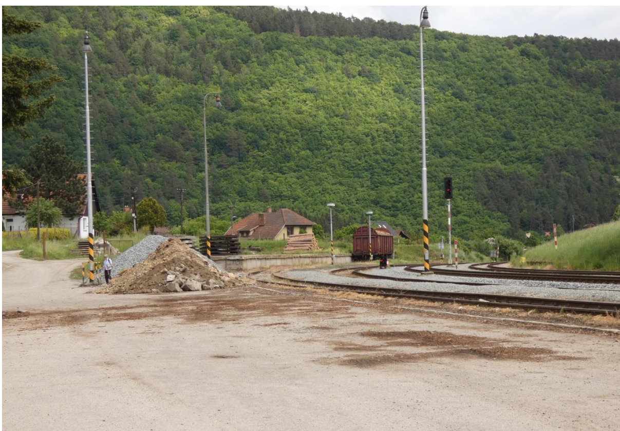
Fotografie 22: Žst. Nedvědice – pohled na boční rampu