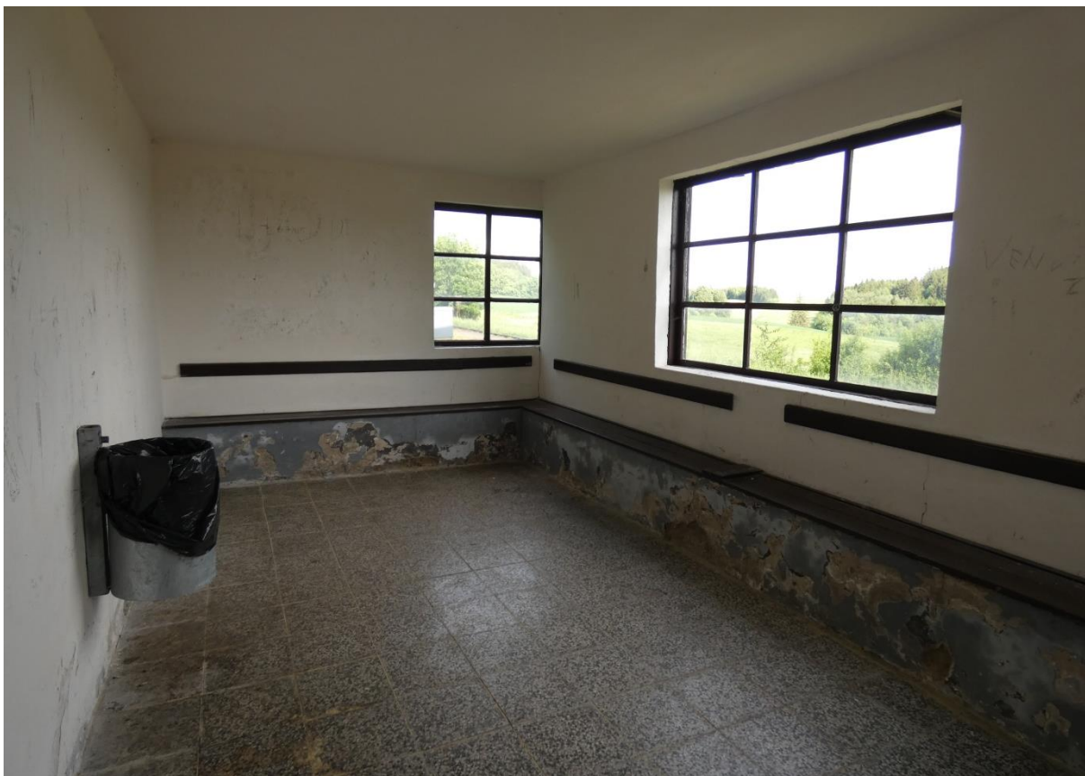
Fotografie 4: Zastávka Radňovice – interiér zastávkového přístřešku