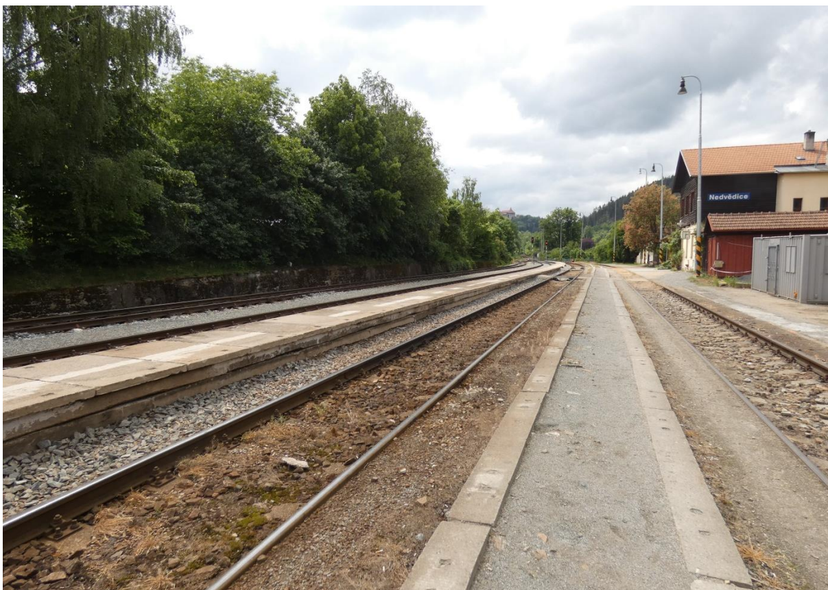
Fotografie 21: Žst. Nedvědice – úrovňová nástupiště