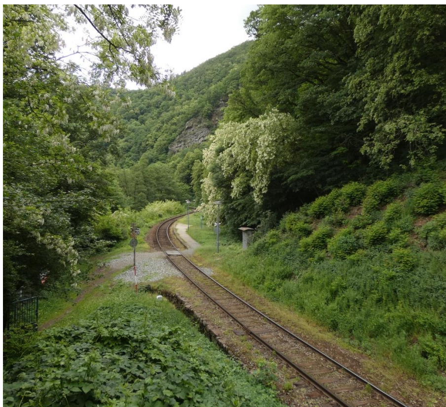
Fotografie 28: Pohled na „schovanou“ zastávku Prudká