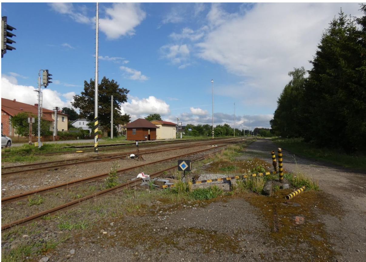
Fotografie 1: Pohled na železniční stanici Veselíčko od Žďáru nad Sázavou