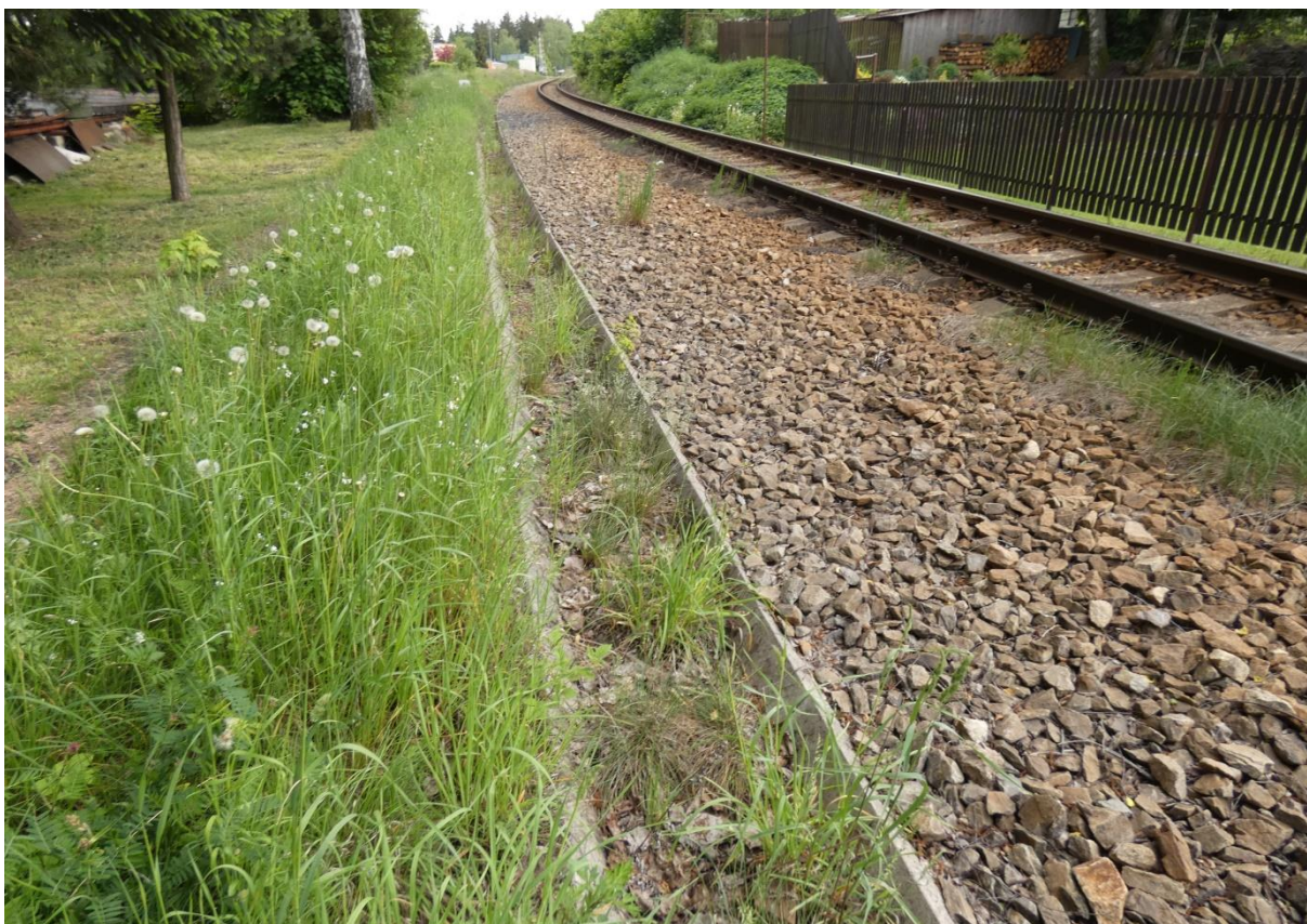
Fotografie 35: Nefunkční odvodňovací zařízení v zastávce Nové Město na Moravě