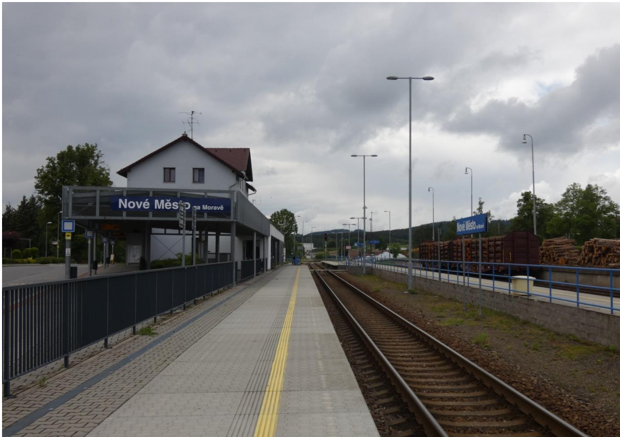
Fotografie 7: Pohled na žst. Nové Město na Moravě s autobusovým terminálem vlevo