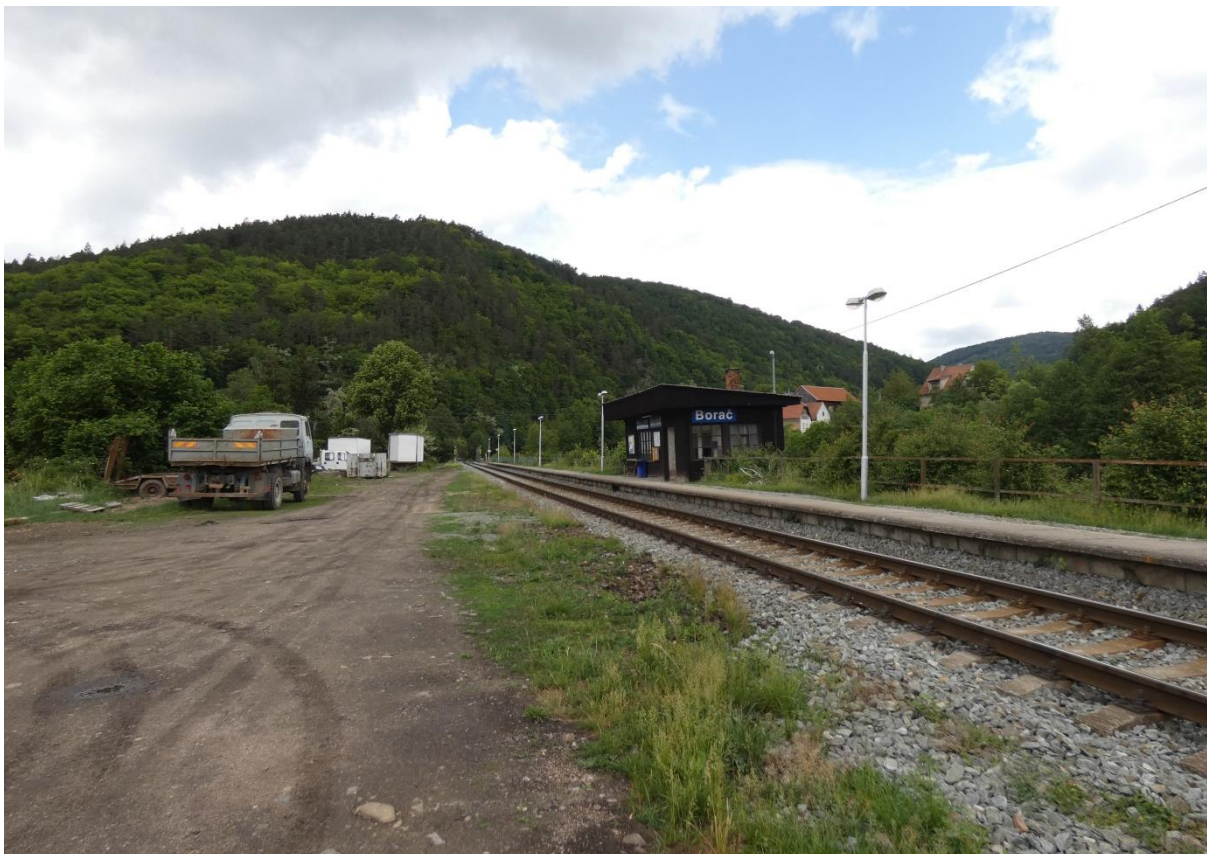
Fotografie 29: Pohled na zastávku Borač od přilehlého železničního přejezdu