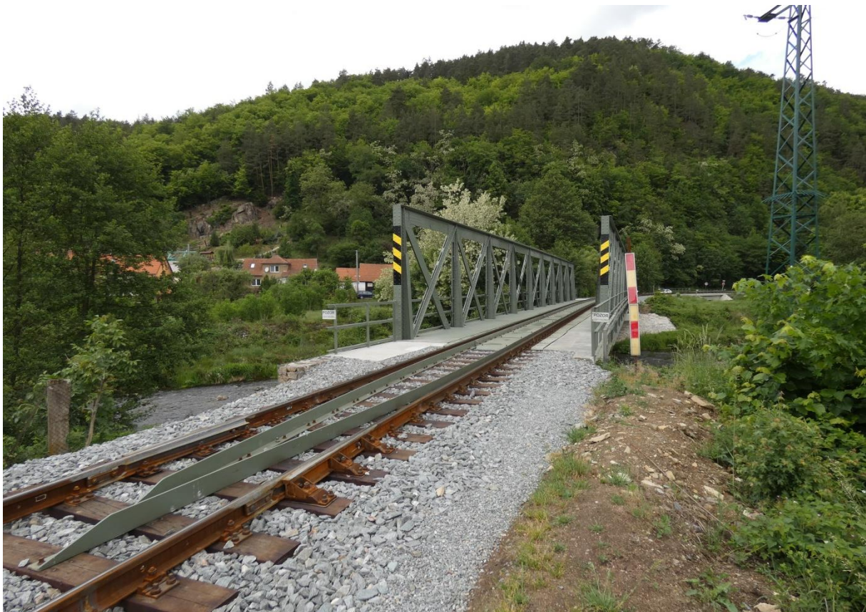
Fotografie 38: Nový železniční most před zastávkou Borač