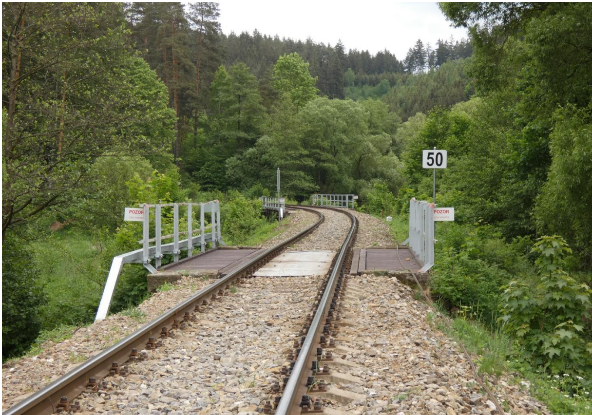
Fotografie 37: Mostní objekty na širé trati před zastávkou Věžná