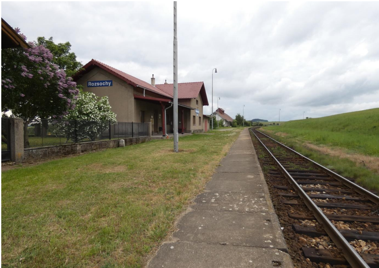
Fotografie 13: Pohled na zastávku Rozsochy