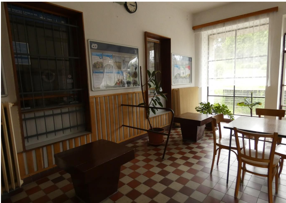
Fotografie 18: Žst. Rožná – interiér VB