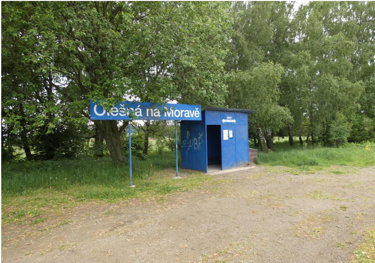
Fotografie 10: Zastávka Olešná na Moravě – zastávkový přístřešek