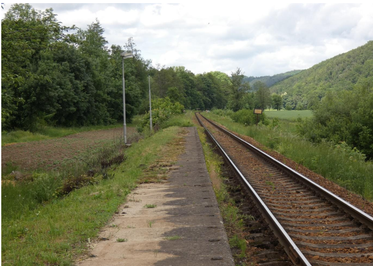
Fotografie 32: Zastávka Štěpánovice – technický stav nástupiště