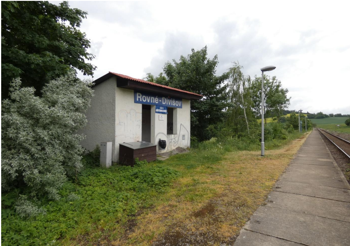
Fotografie 12: Zastávka Rovné – Divišov – zastávkový přístřešek