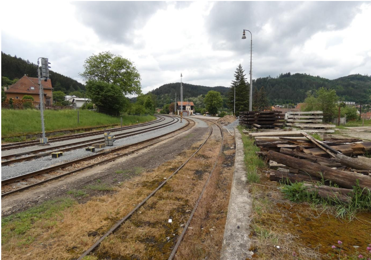
Fotografie 24: Pohled na žst. Nedvědice od jižního zhlaví