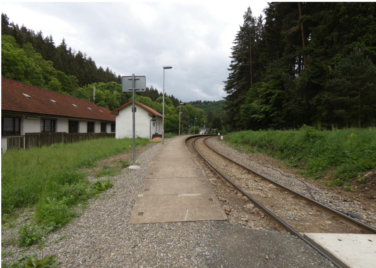
Fotografie 19: Pohled na zastávku Věžná