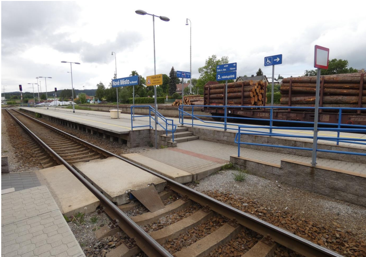
Fotografie 8: Železniční stanice Nové Město na Moravě – centrální úrovněový přechod