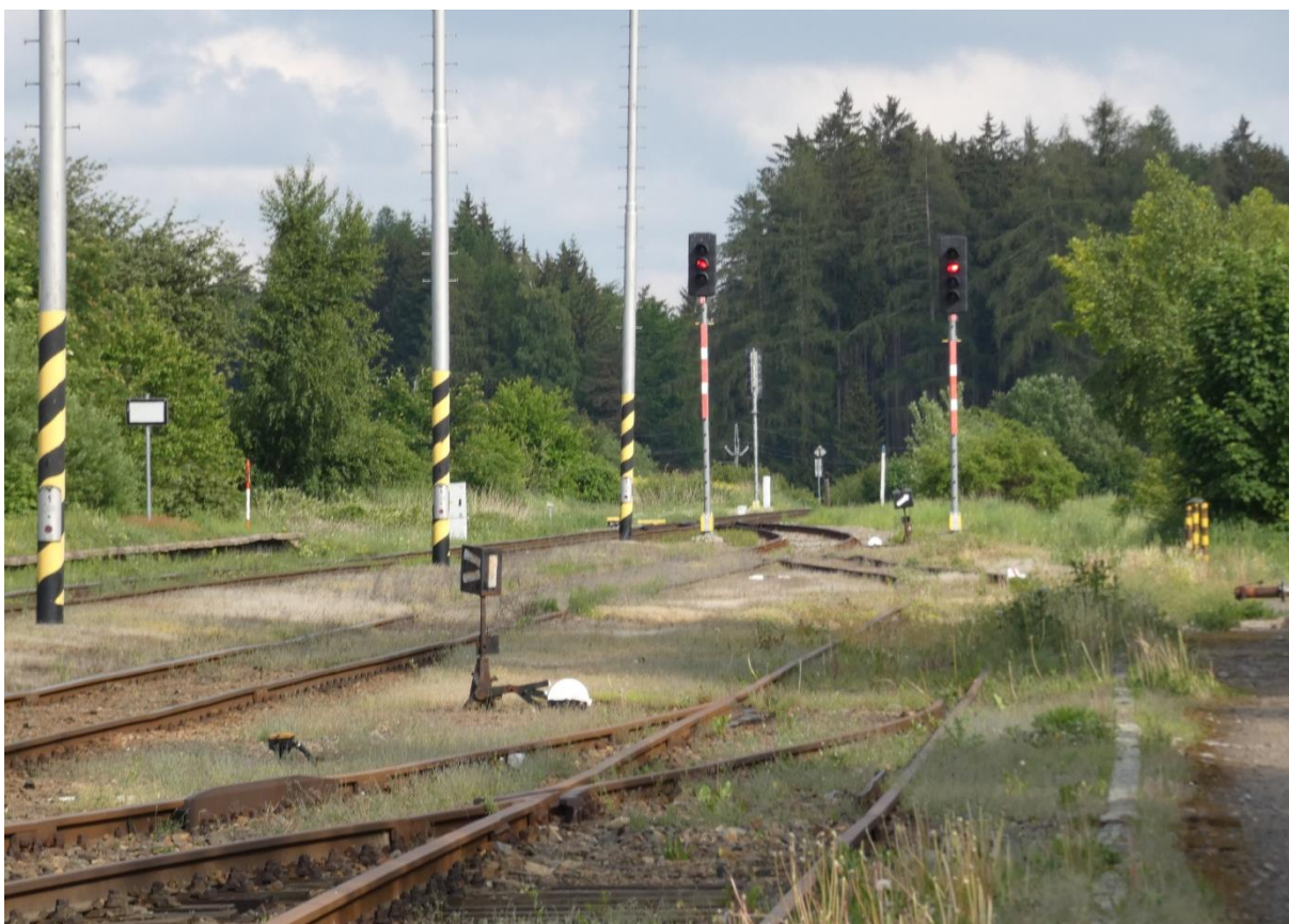
Fotografie 2: Železniční stanice Veselíčko – pohled na zhlaví směrem na Nové Město n. M.