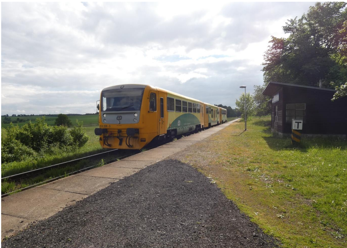
Fotografie 3: Pohled na zastávku Radňovice