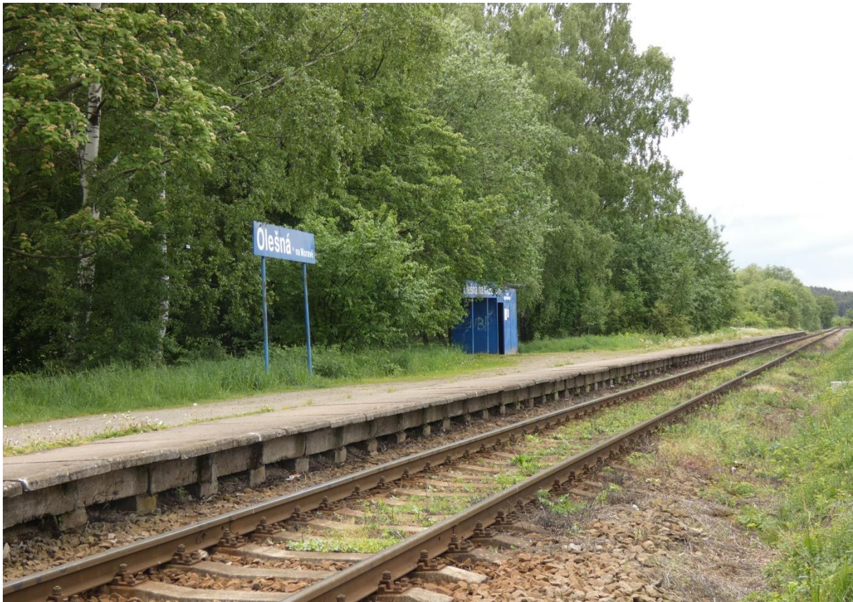
Fotografie 9: Pohled na zastávku Olešná na Moravě