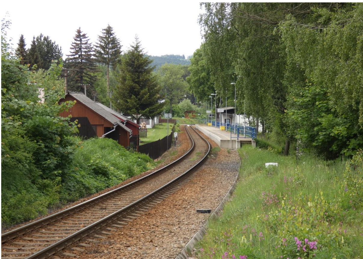
Fotografie 5: Pohled na zastávku Nové Město na Moravě od žst. Veselíčko