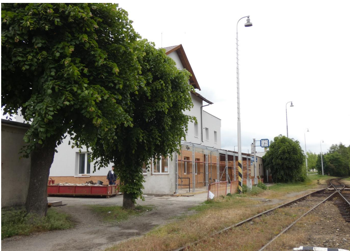
Fotografie 16: Žst. Bystřice nad Pernštejnem – pohled na VB