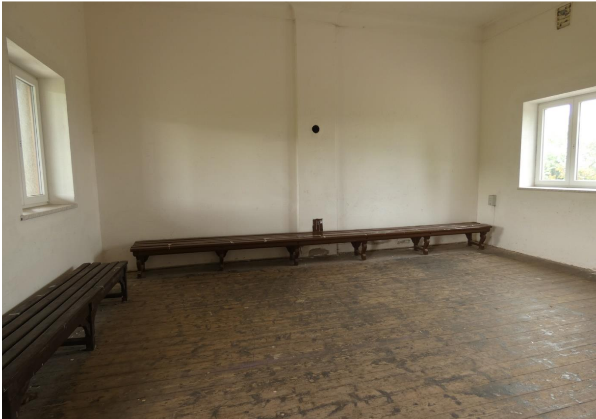
Fotografie 14: Zastávka Rozsochy – interiér bývalé VB