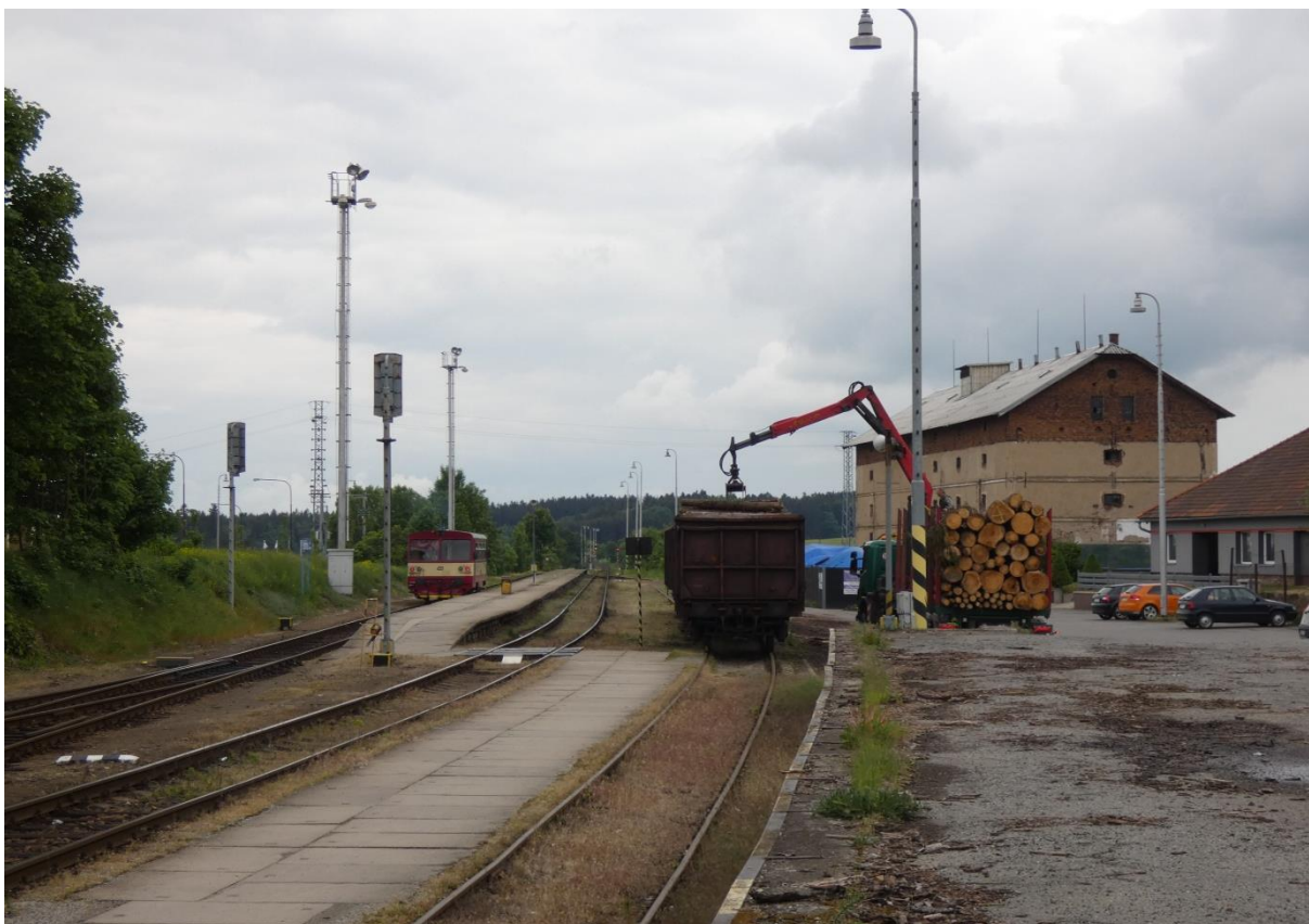
Fotografie 15: Žst. Bystřice nad Pernštejnem – pohled na nástupiště od VB