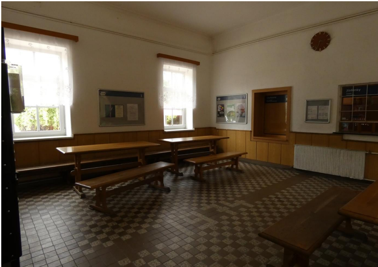
Fotografie 23: Žst. Nedvědice – interiér VB