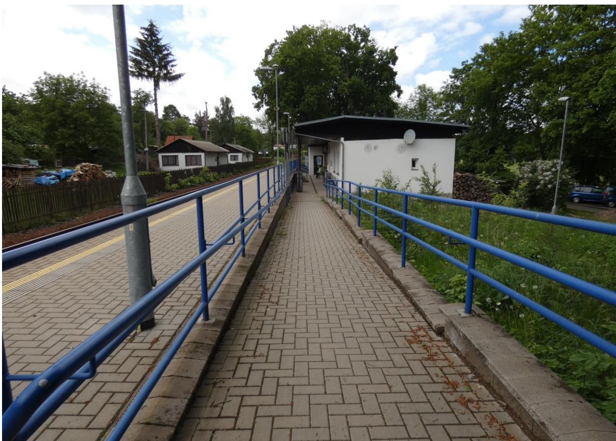
Fotografie 6: Zastávka Nové Město na Moravě - bezbariérový přístup