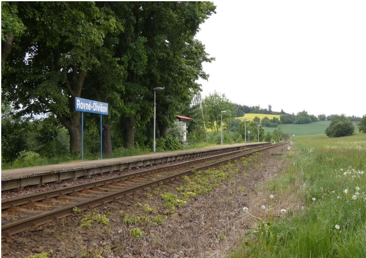
Fotografie 11: Pohled na zastávku Rovné – Divišov