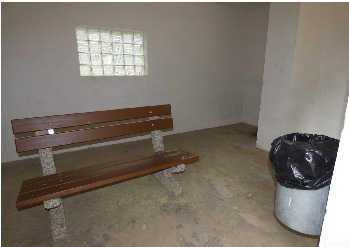
Fotografie 20: Zastávka Věžná – pohled dovnitř zastávkového přístřešku