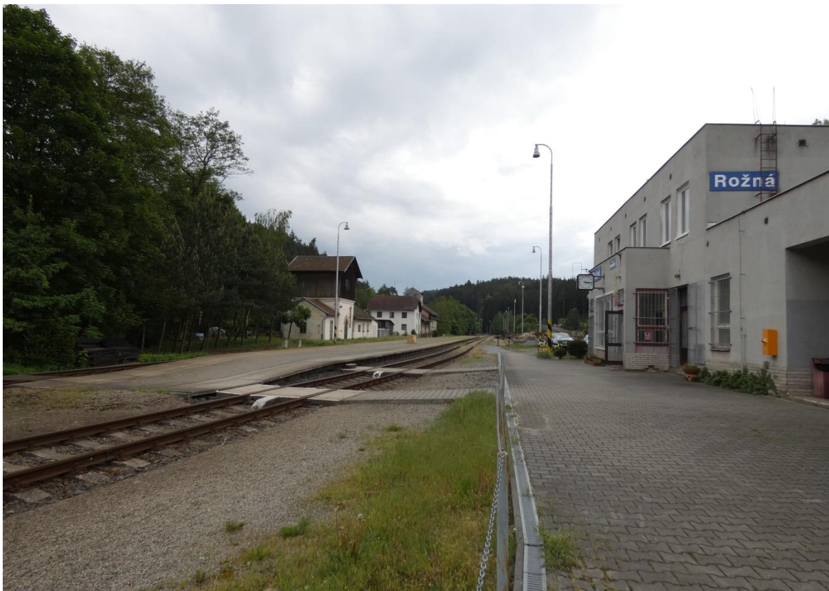
Fotografie 17: Pohled na žst. Rožná