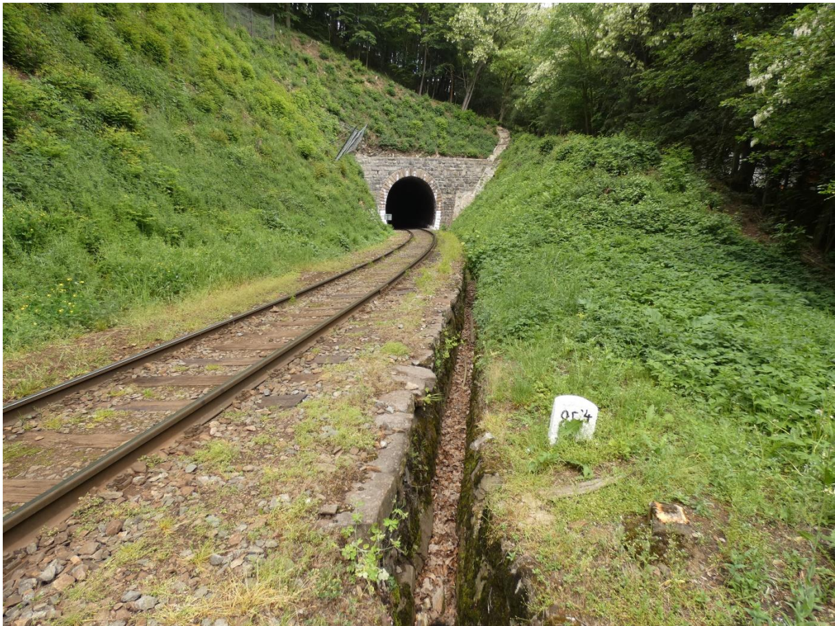
Fotografie 39: Doubravnický tunel – pohled od zastávky Prudká