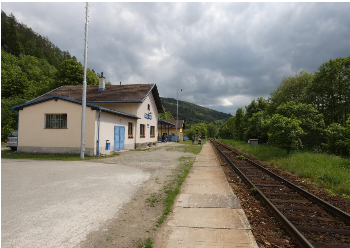
Fotografie 25: Pohled na zastávku Doubravník