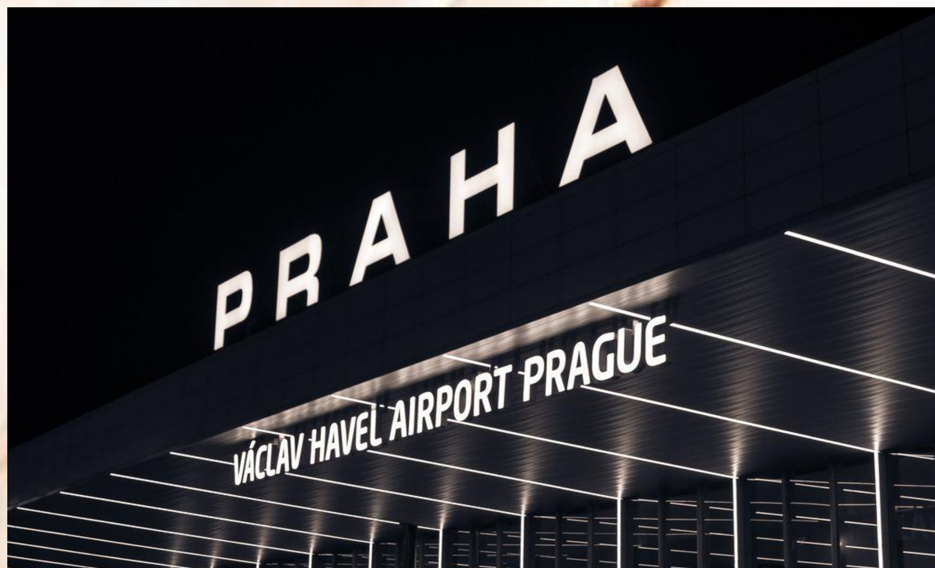
HODNOTA SPOLEČNOSTI LETIŠTĚ PRAHA, A. S.

Cíl práce: stanovení hodnoty společnosti Letiště Praha, a. s., výnosovou metodou k 1. 1. 2019