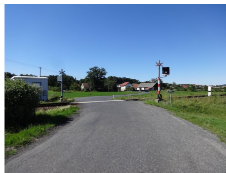
Pohled na směrové vedení pozemní komunikace prosotrem přejezdu