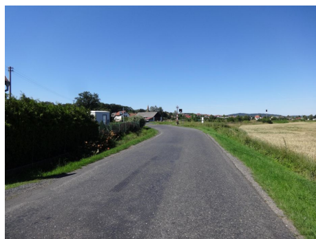
Pohled na samonevysvětlující směrové vedení pozemní komunikace, kdy účastníkům provozu není zcela jasné směrové vedení pozemní komunikace za přejezdem