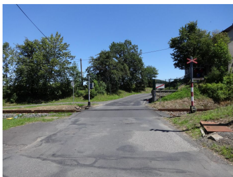
Absence retroreflexního podkladu výstražného kříže SDZ A 32a "Výstražný kříž pro železniční přejezd jednokolejný"