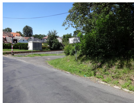
Pohled na křižovatku účelové komunikace s MK, absence výstražníku PZS pro účelovou komunikaci