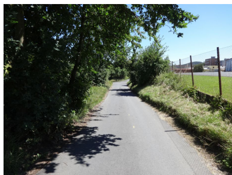
Absence SDZ A 31c "Návěstní deska (80 m)" spolu s A 30 "Železniční přejezd jednokolejný" dále patrná neudržované zeleň