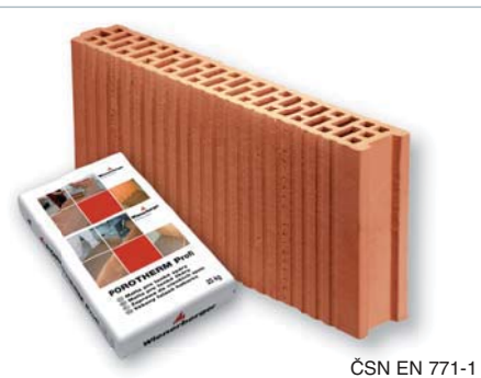
ČSN EN 771-1

Pro založení stěn se dodává požadované množství základací malty Porotherm Profi AM (Anlegemörtel).