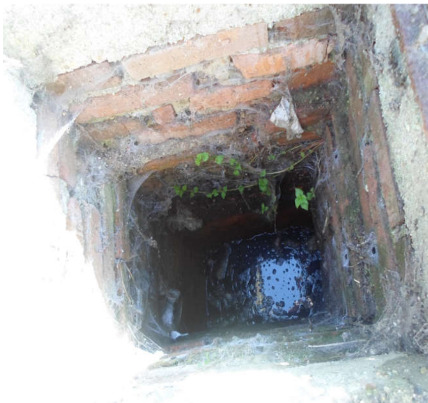
11) par. č. 525/5 a st. 292 – vzájemná poloha stávající jímky a studny (35)