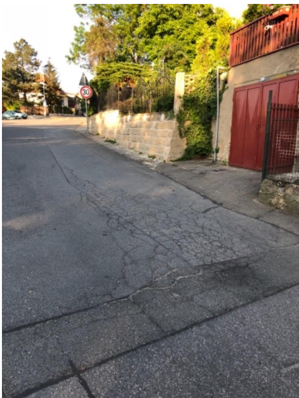
Obr.46 Ulice Kralupská –trhliny na vozovce