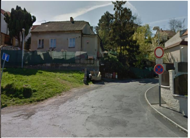
Obr.57 Ulice Nad Manovkou – pohled od ulice Kralupská