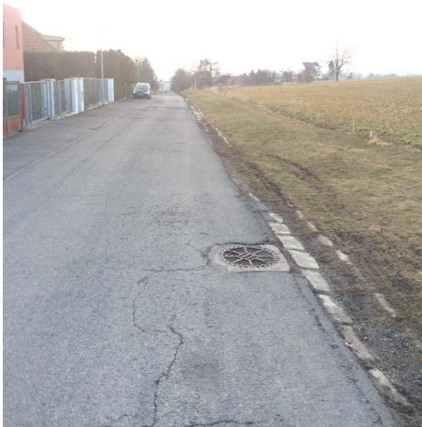
Obr.58 Ulice Nad Višňovkou – pohled od ulice Řepská