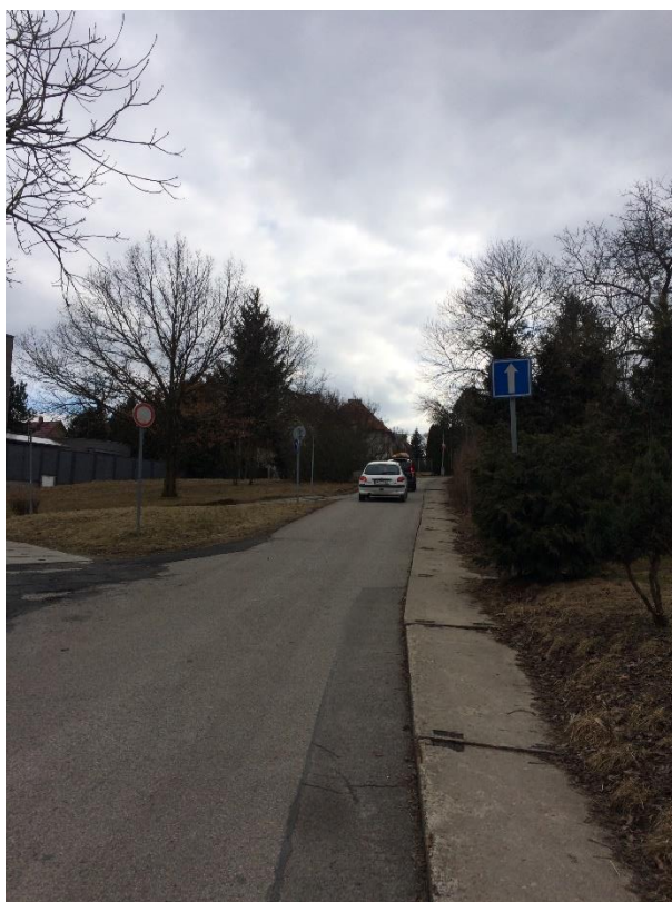
Obr. 13 Ulice Chrástánská – křižovatka s ulicí U Světličky