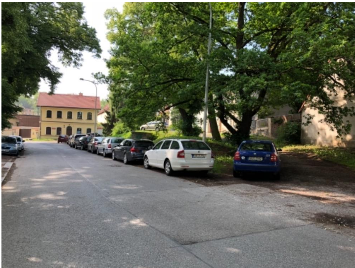
Obr. 90a Ulice Staré náměti – poptávka po parkování přes den