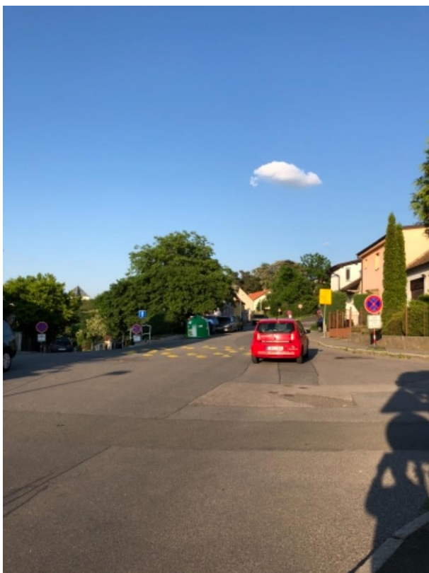
Obr.49 Ulice Kralupská –křižovatka s ulicemi Chomutovská a Dobrovízská