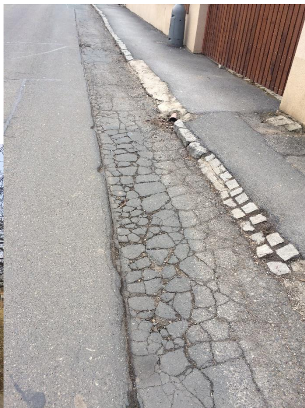
Obr.115 Ulice Zličínská– poruchy vozovky