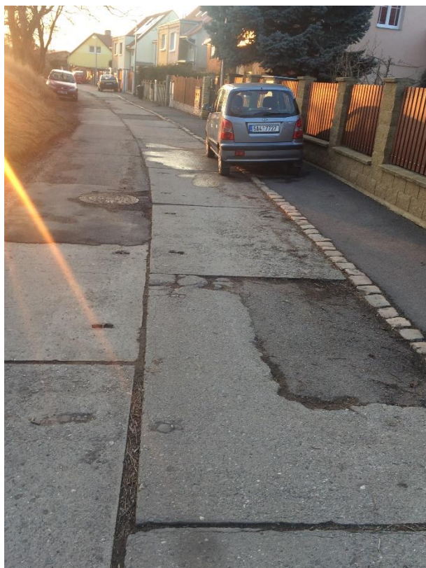
Obr.70 Ulice Pod Mohylou – vozidlo parkující na chodníku