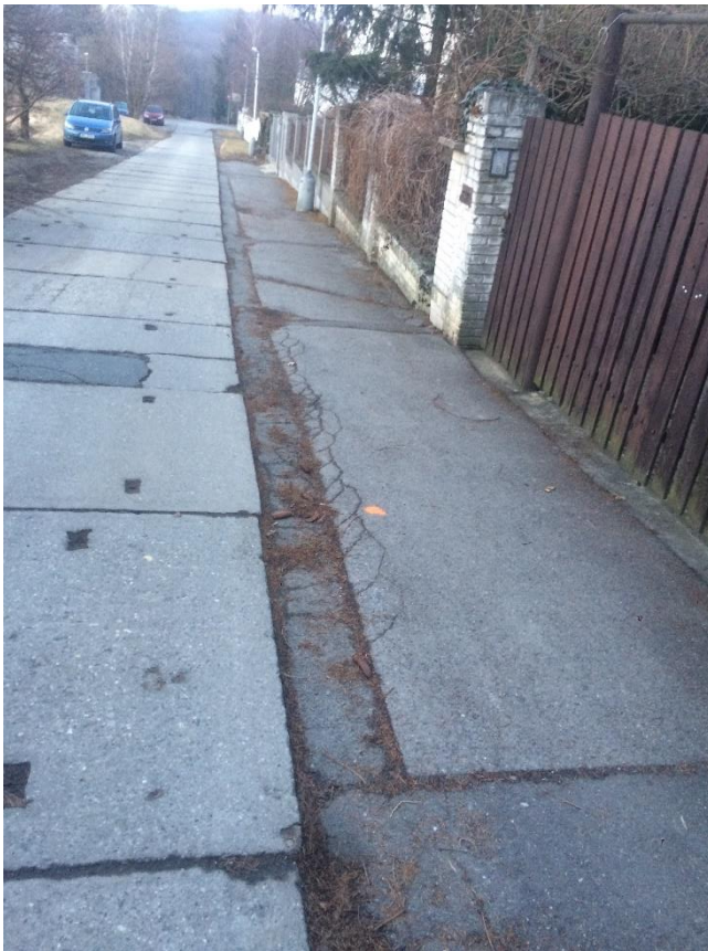
Obr.16a Ulice Chrášťanská – pohled