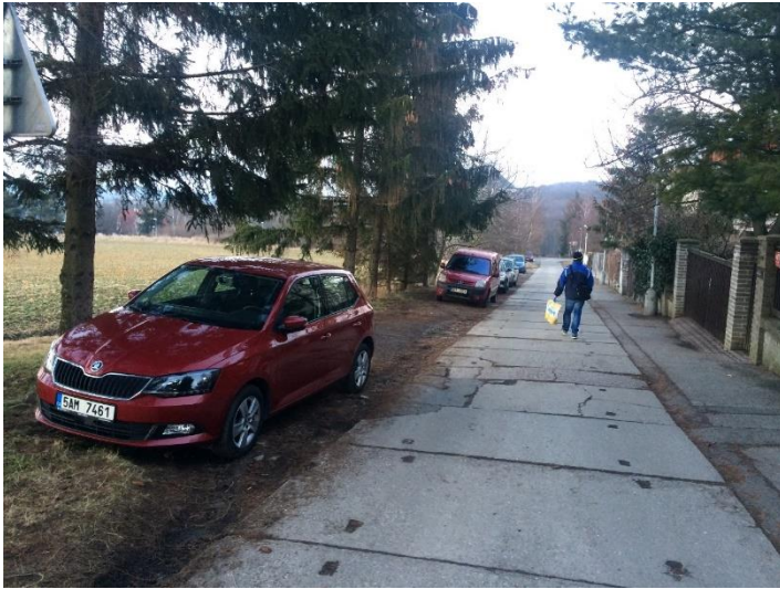
Obr.15 Ulice Chrášťanská – vozidla parkující v silniční vegetaci