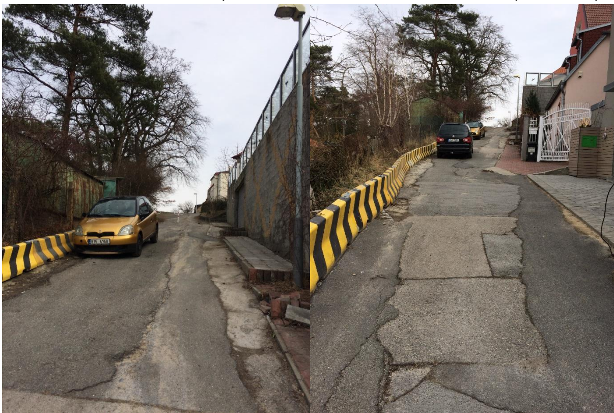
Obr.37 a obr.38 Ulice Huberova – citybloky