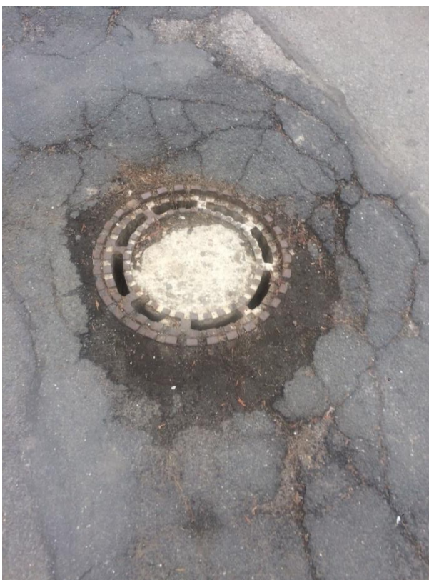
Obr.21 Ulice Chýňská – uliční vpusť