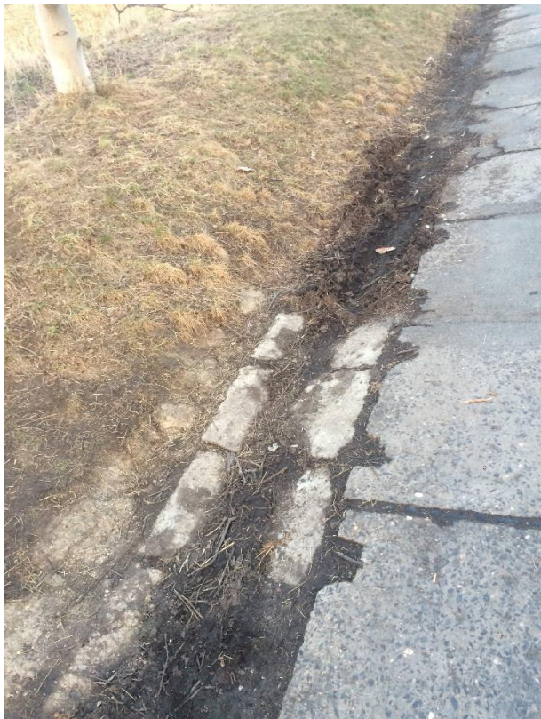
Obr.60 Ulice Nad Višňovkou – rozbitý žlab