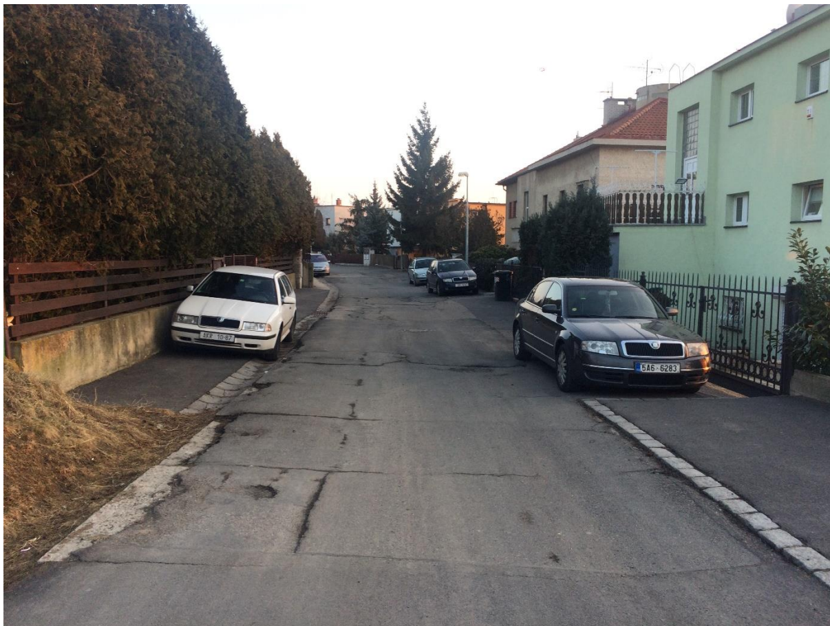
Obr.63 Ulice Nad Višňovkou – konec chodníku