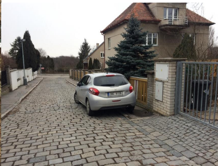
obr. 9 -Ulice Bělocká pohled od ulice A.Č. exulantů