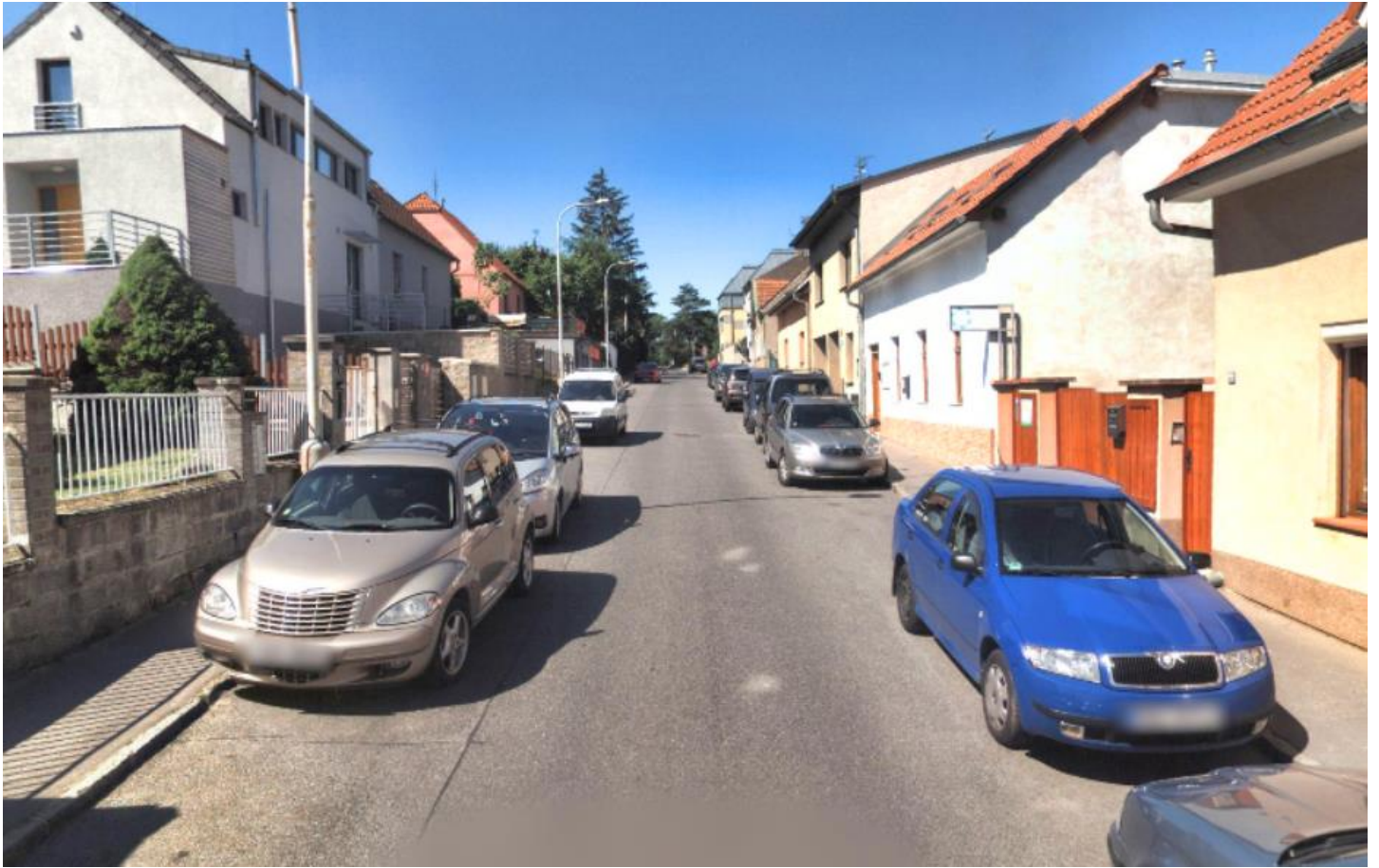
Obr. 42 – Ulice Jinočanská – parkování