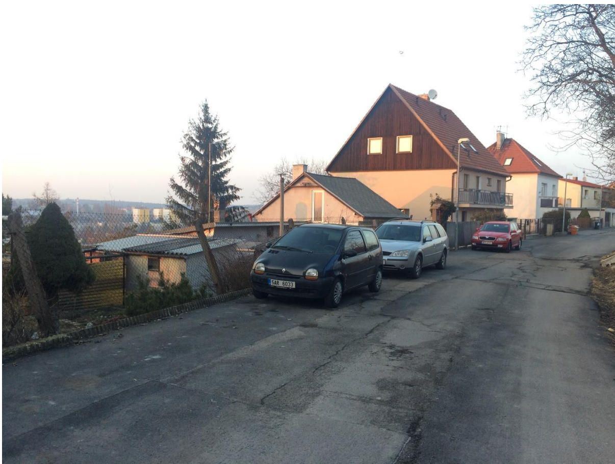
Obr.62 Ulice Nad Višňovkou parkování