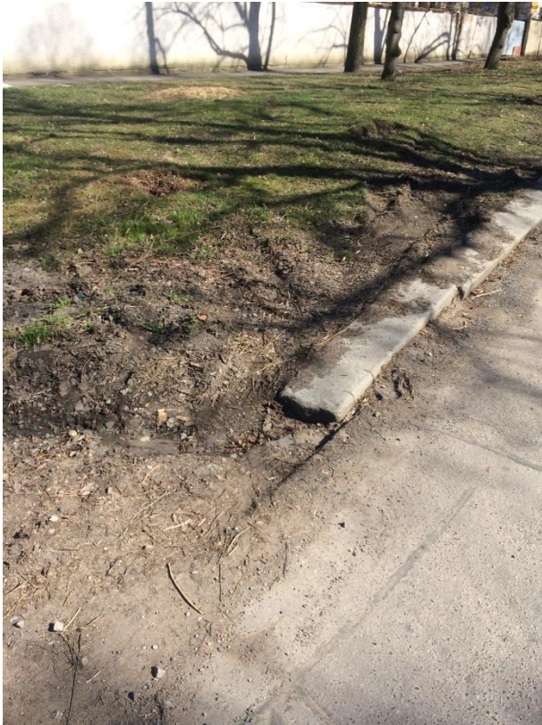
Obr.86 Ulice Staré náměstí – pojížděná zeleň