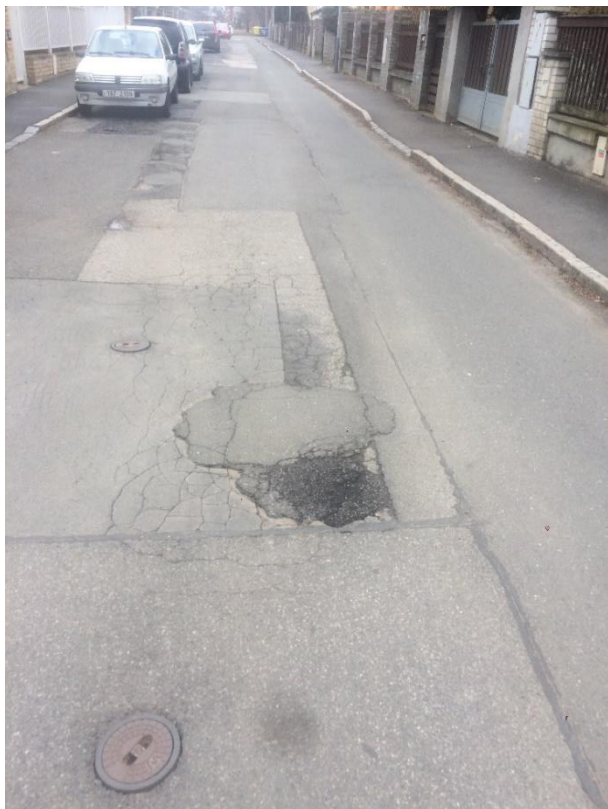
Obr.18 Ulice Chýňská – parkující vozidla