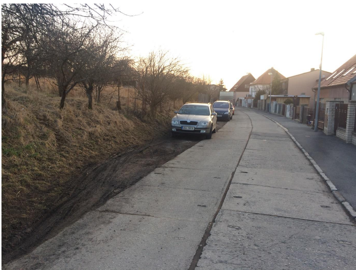
Obr. 71a Ulice Pod Mohylou – pohled od ulice Zahradní