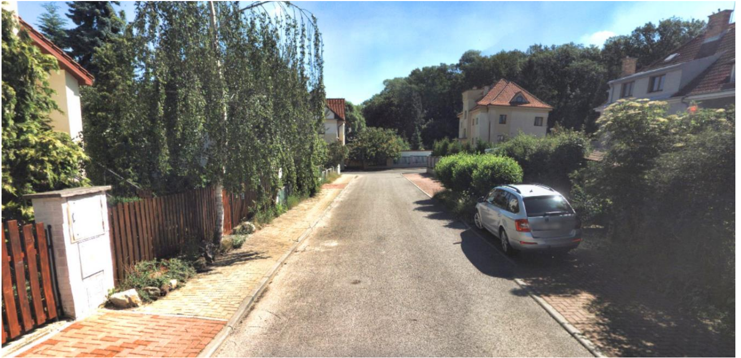
Obr. 53 – Ulice Lounská – pohled od ulice Statenická