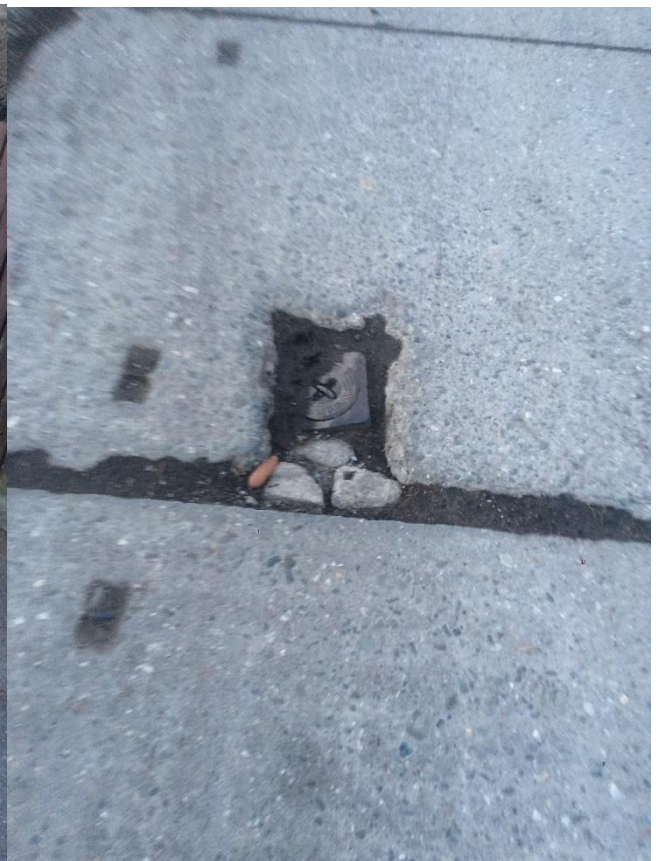
Obr.17 Ulice Chrášťanská – propadlý povrchový znak