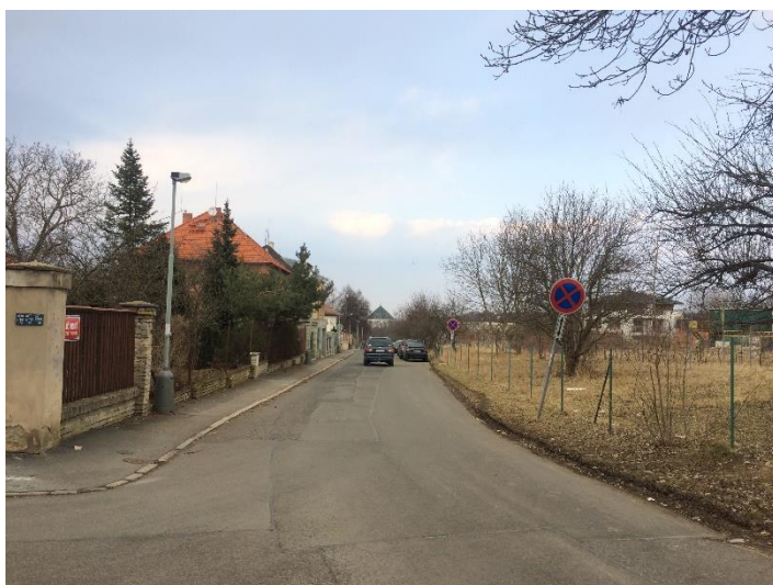
Obr.114 Ulice Zličínská – pohled od ulice Chýňská