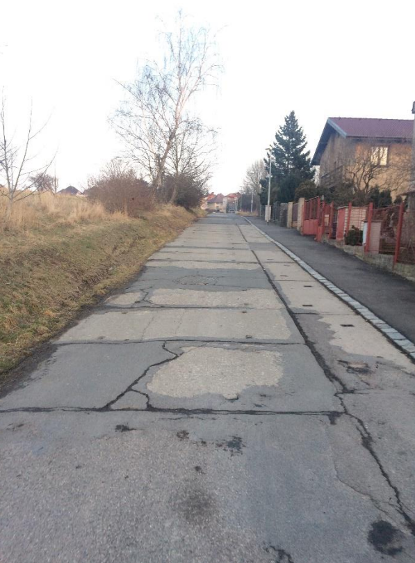
Obr.61 Ulice Nad Višňovkou – poruchy betonových desek