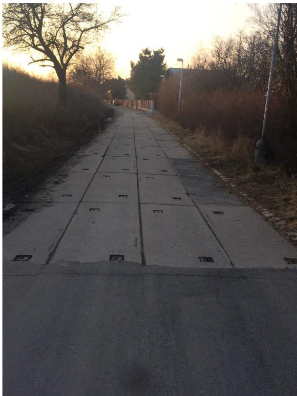
Obr.68 Ulice Pod Mohylou – pohled od ulice Chrášťanská