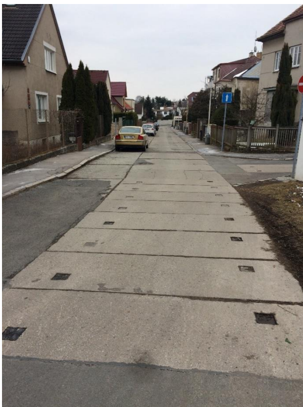
Obr.24 Ulice Duchcovská – pohled od ulice Chrášťanská