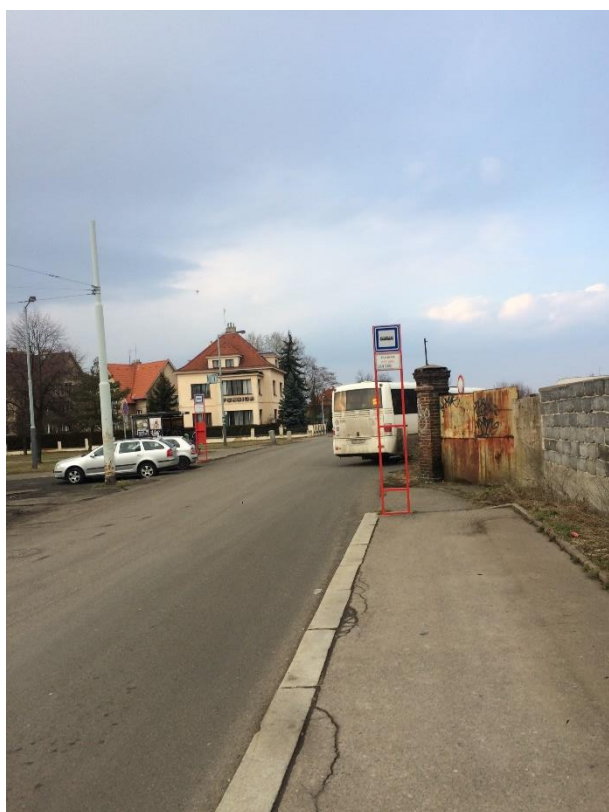
Obr.110 Ulice Zličínská – pohled od ulice Karlovarská