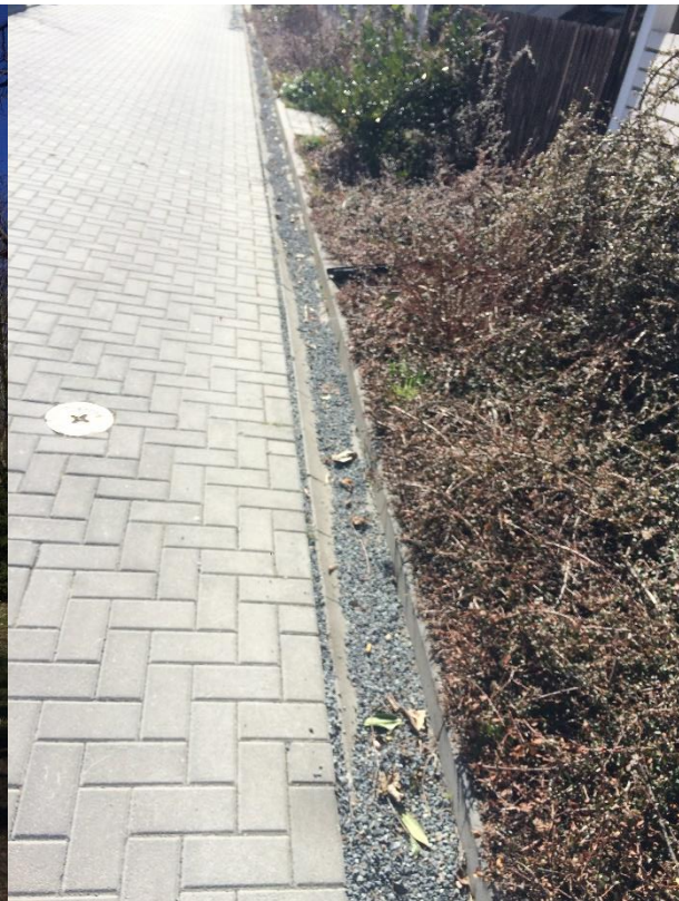
Obr.23 Ulice Chomutovská– zanesený podélný žlab