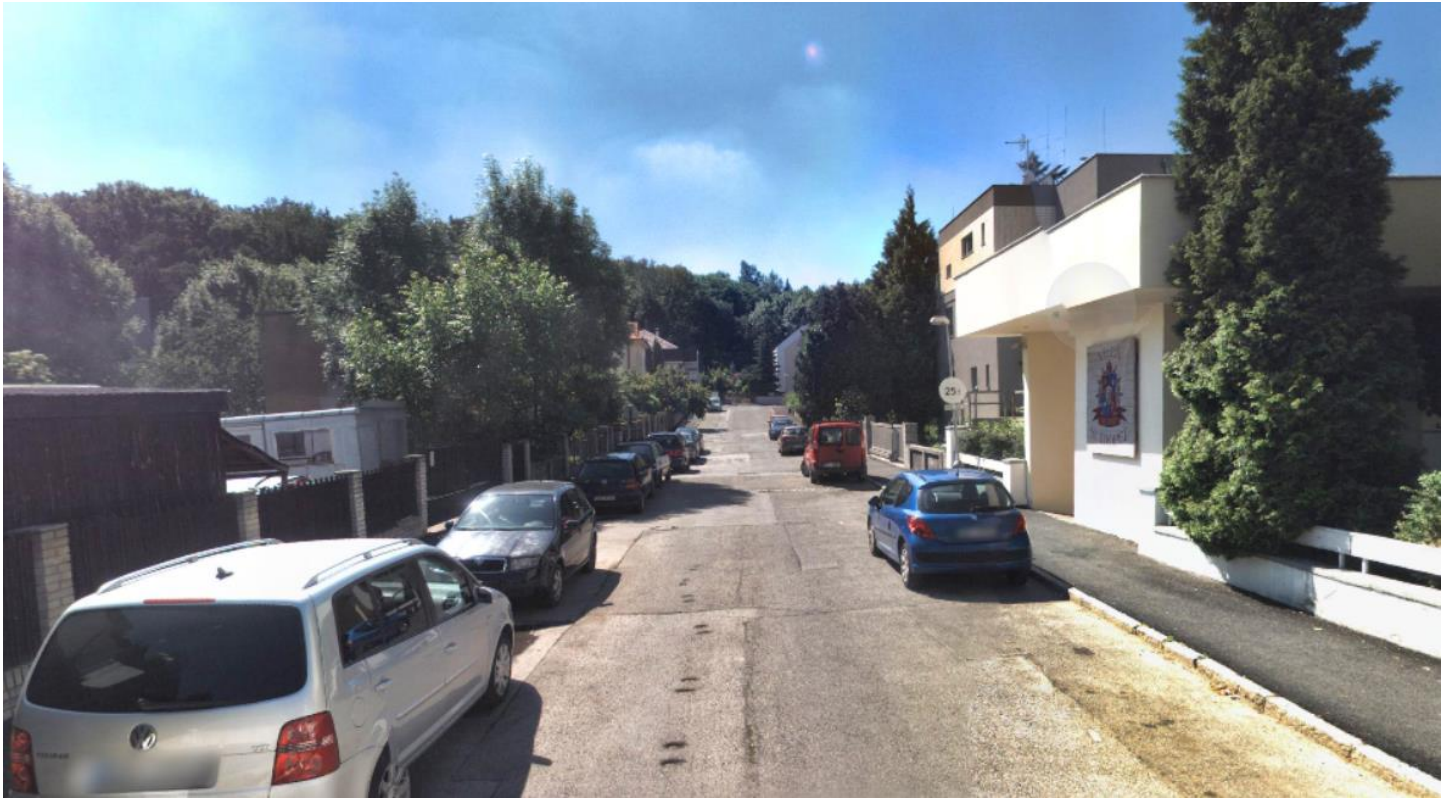
Obr. 72 Ulice Přílepská – pohled od ulice Ruzyňská