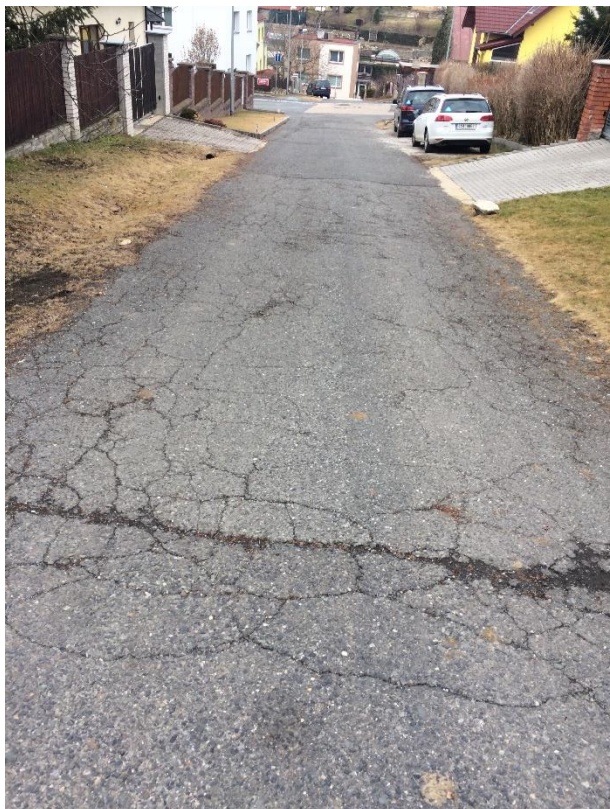
Obr.100 Ulice Ve Skalkách – pohled od ulice Ovocná