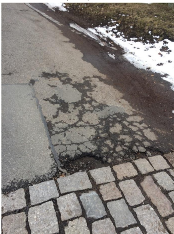
obr. 6 – Výmol ulice Alej Českých exulantů