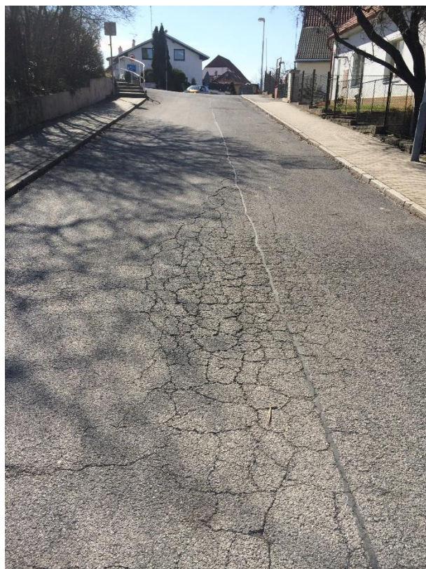
Obr.28 Ulice Dobrovízská – vlasové trhliny