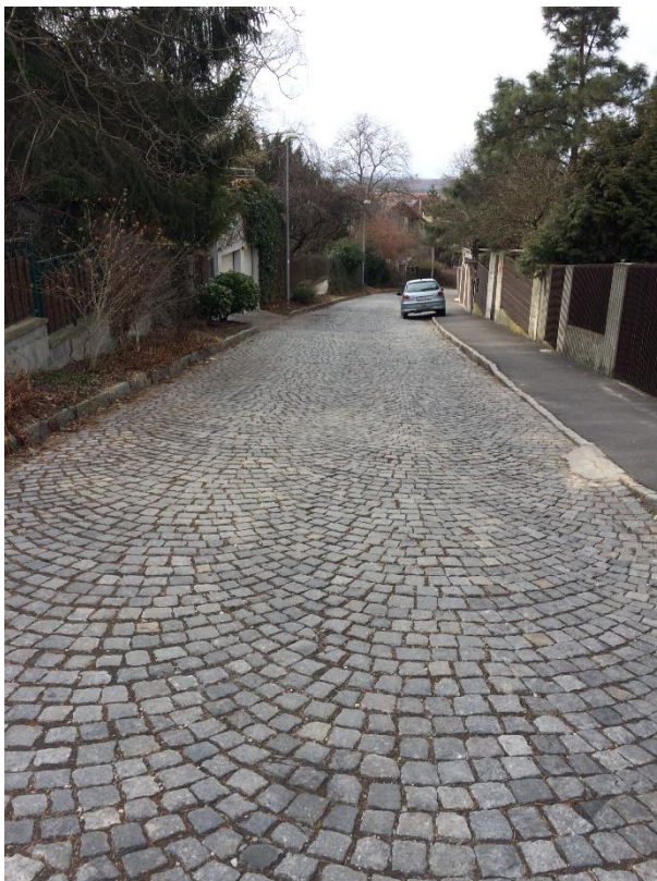
Obr.97 Ve Višňovce – parkování na chodníku