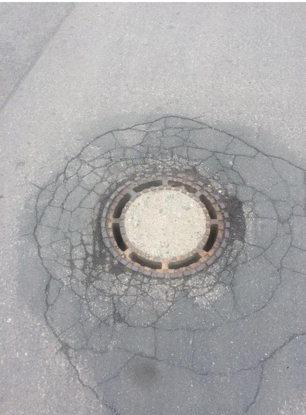
Obr.35 Ulice Holubická – trhliny okolo šachty