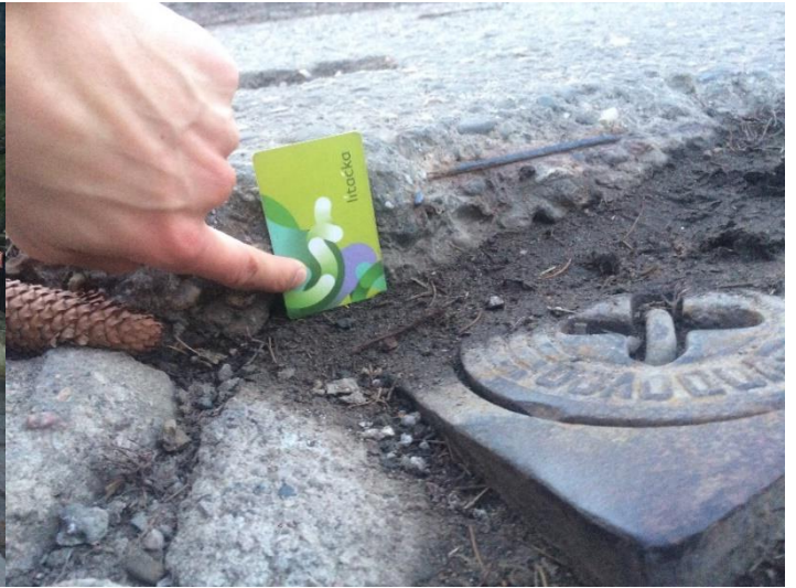
Obr.16 Ulice Chrášťanská – propadlý povrchový znak