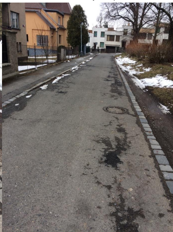
obr. 7– Ulice Alej Českých exulantů