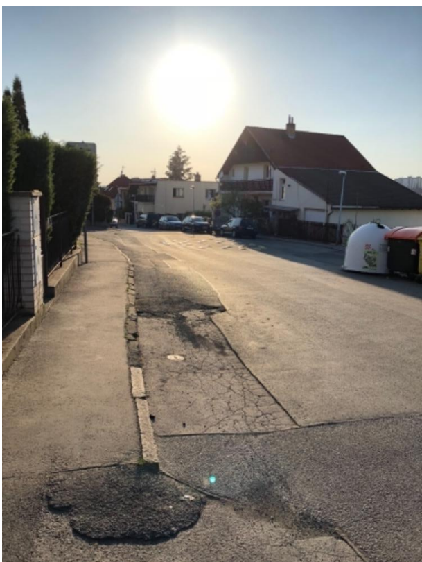
Obr.51 Ulice Kralupská – poruchy vozovky