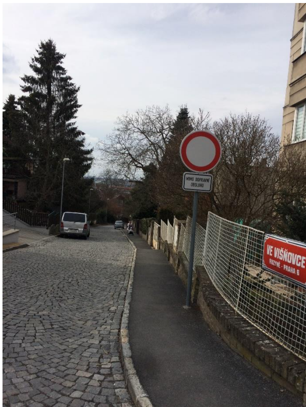
Obr.96 Ulice Ve Višňovce – pohled od ulice K Mohyle