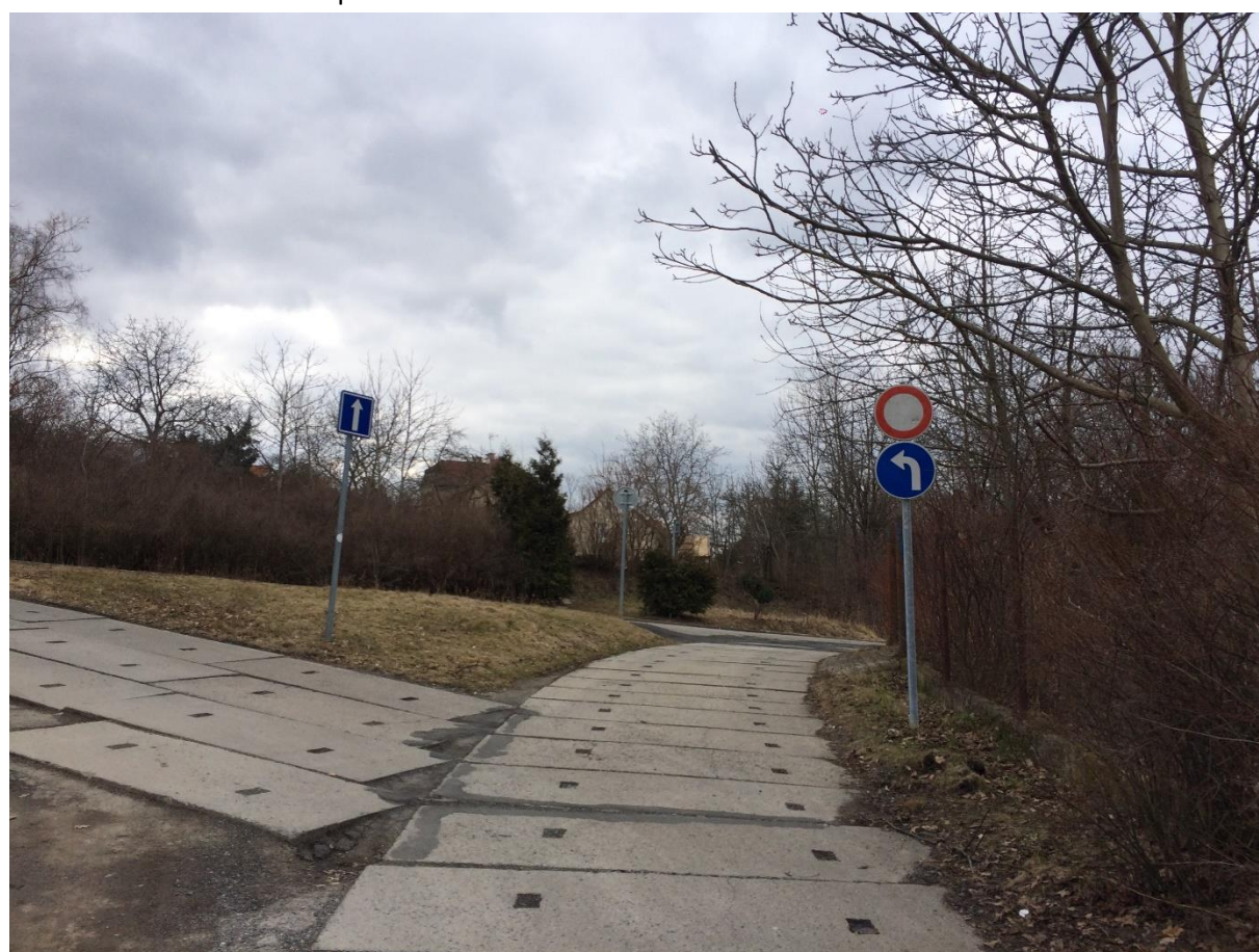
Obr. 95 Ulice U Světličky – pohled na křižovatku s ulicí Chrášťanská