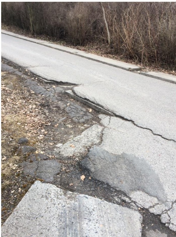
Obr.94 Ulice u Světličky – betonové desky