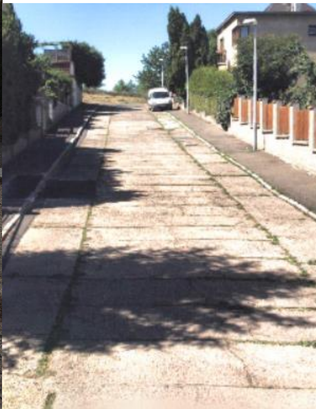
Obr.107 Ulice Zahradní – pohled od ulice Huberova