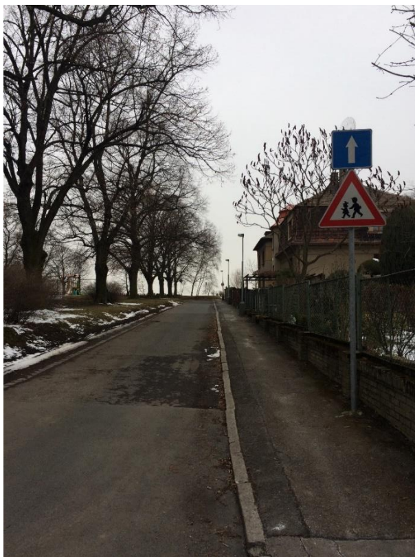
obr. 4 - Ulice Alej Českých exulantů