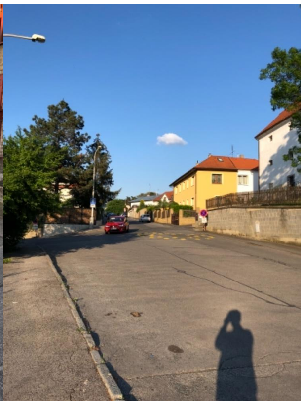
Obr.47 Ulice Kralupská – křižovatka s ulicí Jinočanská