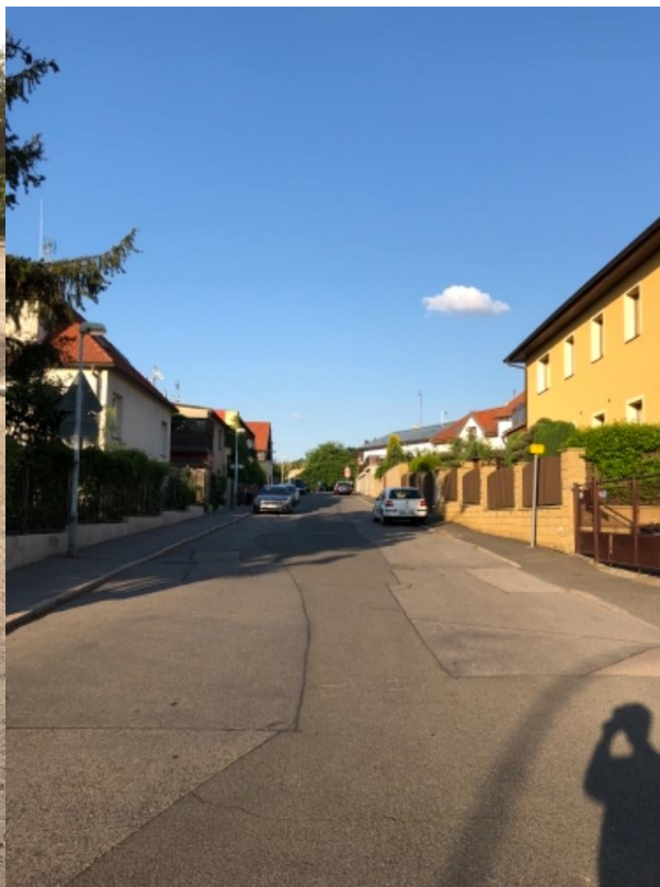
Obr.48a Ulice Kralupská –pohled od ulice Jinočanská směrem k ulici Dobrovízská