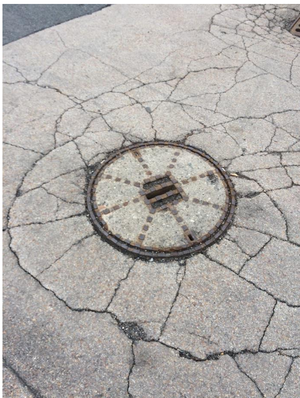
Obr.102 Ulice Ve Skalkách – trhliny okolo šachty