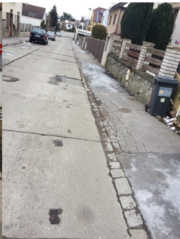
Obr.25 Ulice Duchcovská – trhliny a pokles obrubs chodníku