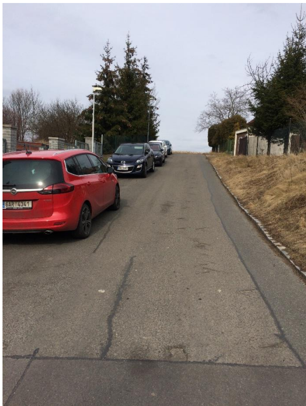
Obr.108 Ulice K Mohyle – pohled od křižovatky s ulicí Ve Višňovce