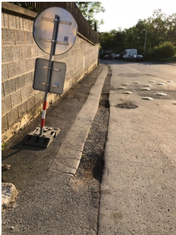
Obr.48 Ulice Kralupská –poruchy vozovky