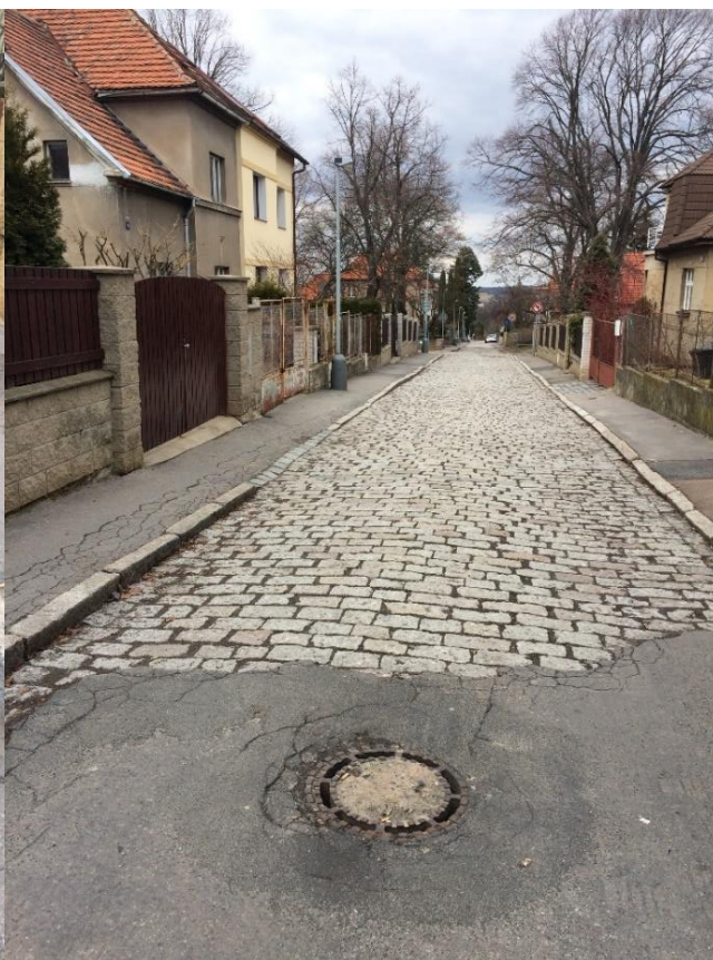
obr. 11 – Ulice Bělocká – přechod asfalt – dlažba žulová