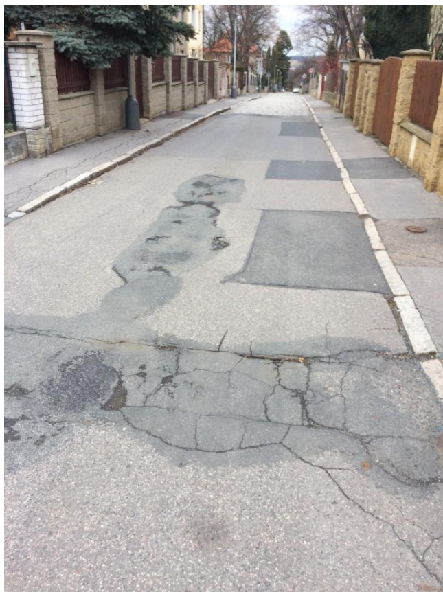
obr. 10 – Ulice Bělocká – trhliny v asfaltu