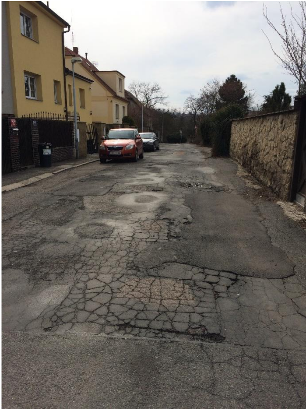
Obr.56 Ulice Nad Manovkou – poruchy vozovky