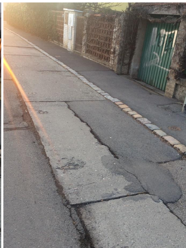
Obr.70a Ulice Pod Mohylou – poruchy betonových desek