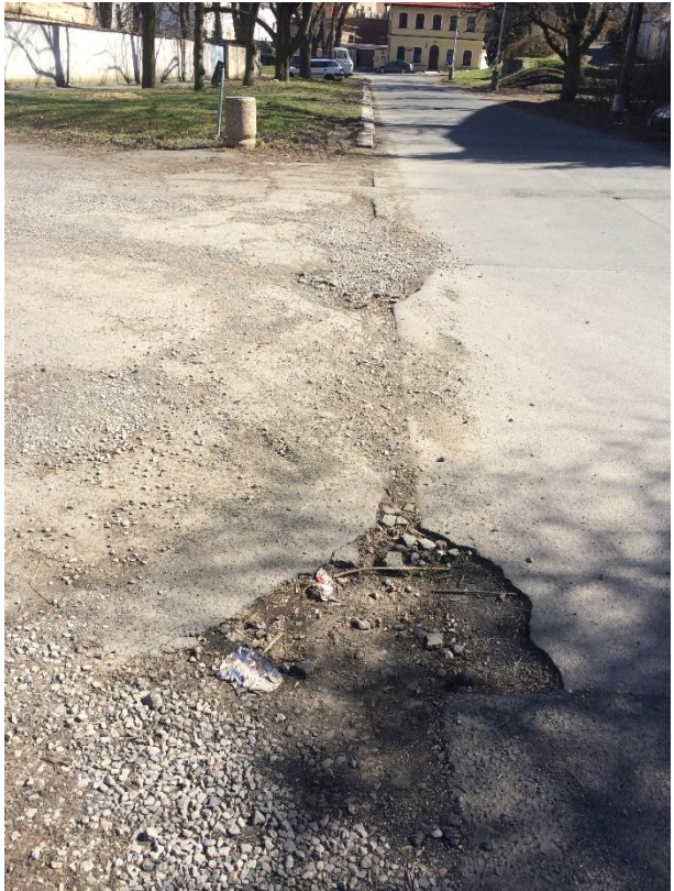
Obr.87 Ulice Staré náměstí - výmoly