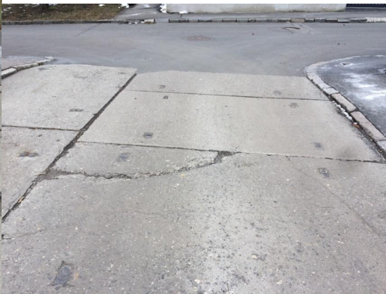
Obr. 26 a 27 Ulice Duchcovská – poruchy vozovky a chodníku