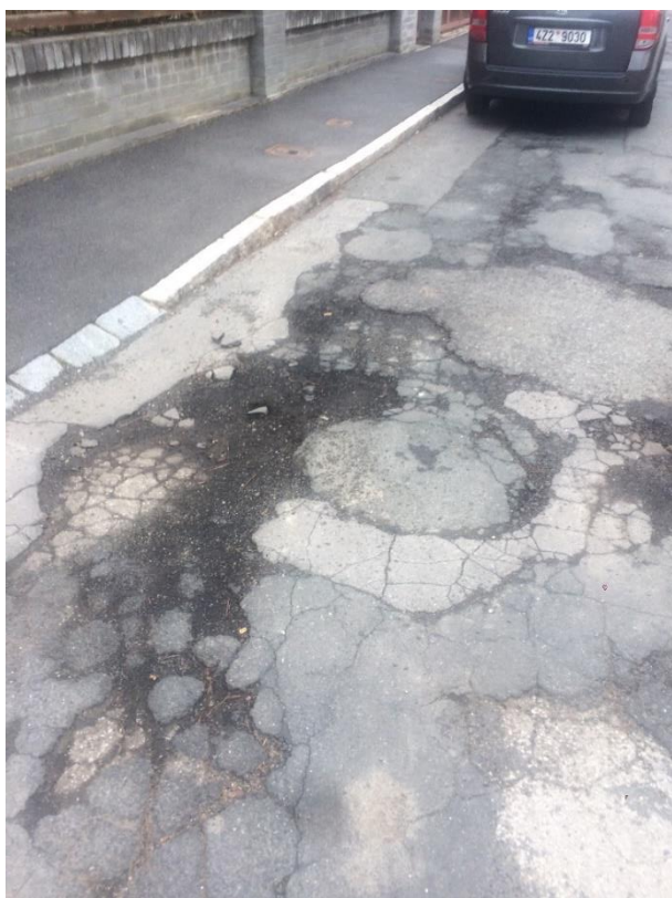
Obr.20 Ulice Chýňská – trhliny a výmoly