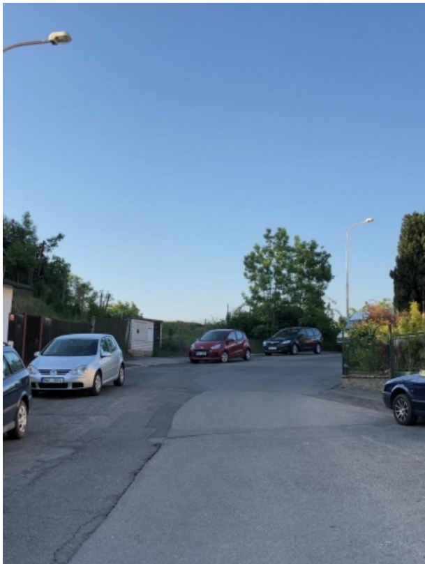
Obr.44 Ulice Kralupská –zúžení před domem č. 40/45