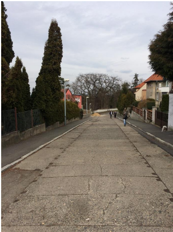
Obr.104 Ulice Zahradní – pohled od ulice Pod Mohylou