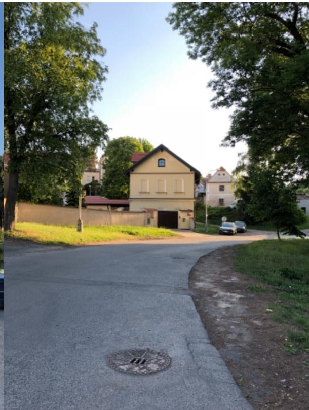
Obr.45 Ulice Kralupská – začátek ulice navazující na ulici Staré náměstí