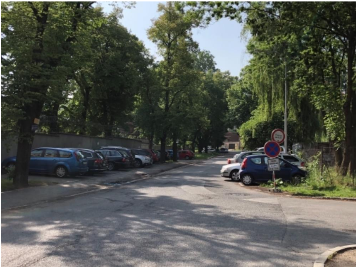
Obr. 88 Ulice Staré náměstí– pohled od věžeňské vrátnice – poptávka po parkování přes den