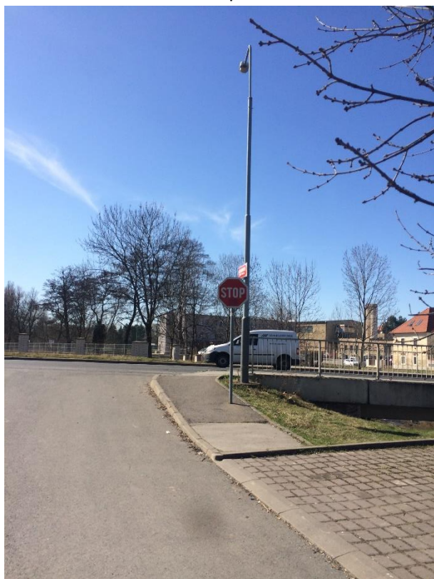
Obr.84 Ulice Staré náměstí – křižovatka u hotelu