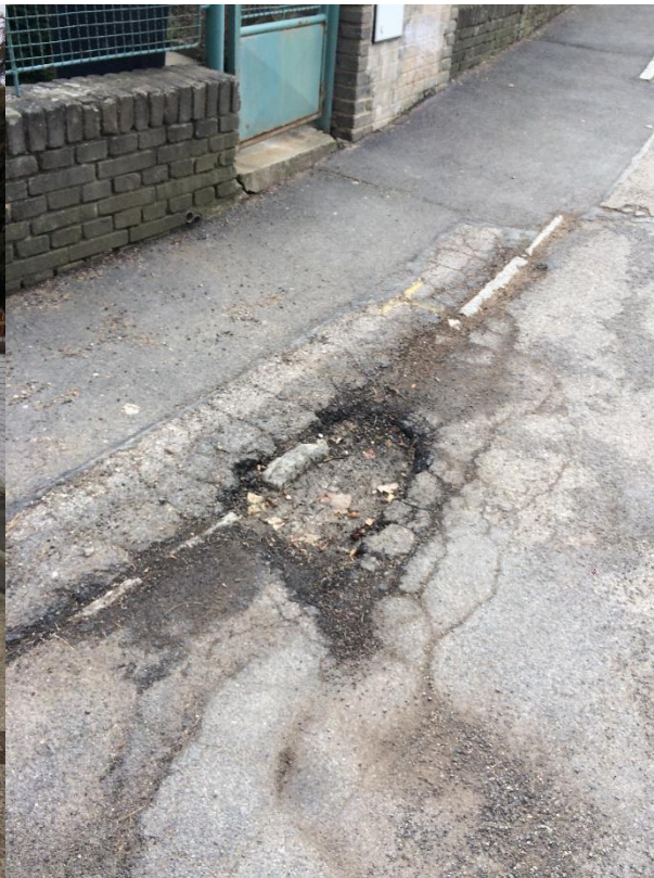
Obr.105 Ulice Zahradní – výmol