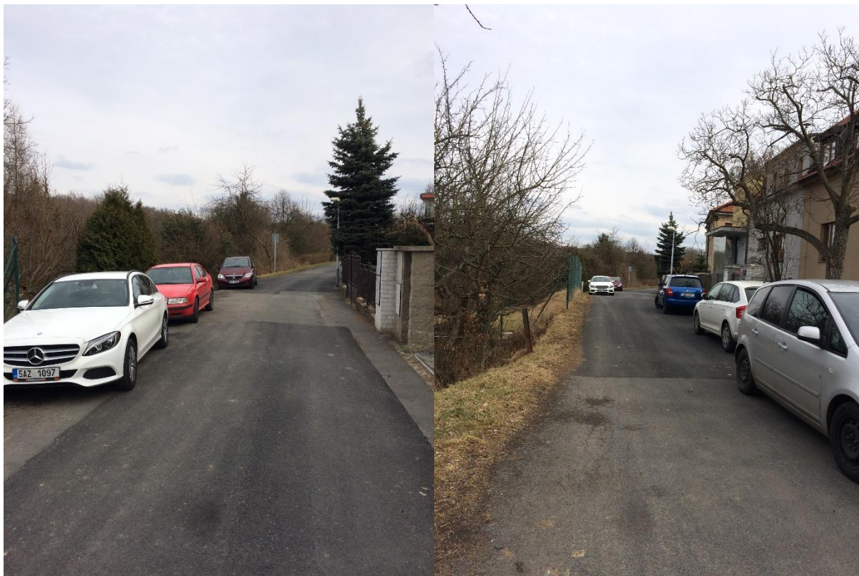
Obr.38 a obr.39 – Ulice Huberova