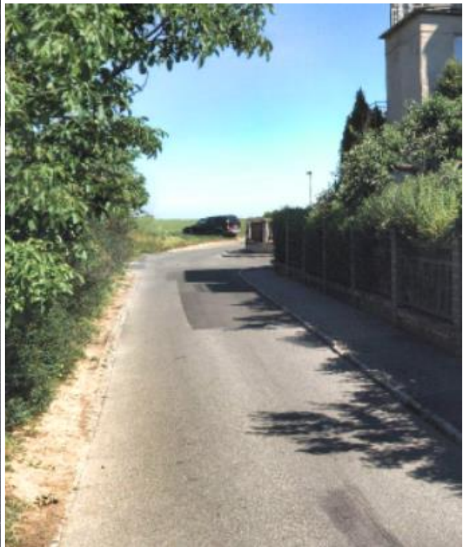
Obr.74 Ulice Řepská – pohled od ulice Zbečenská