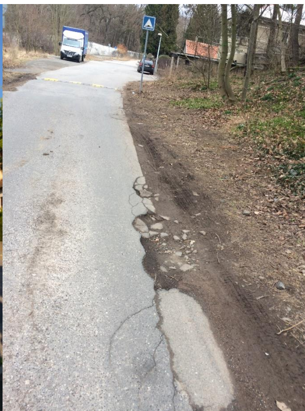
Obr.49a Ulice Kralupská –pohled od domu č. 494/17