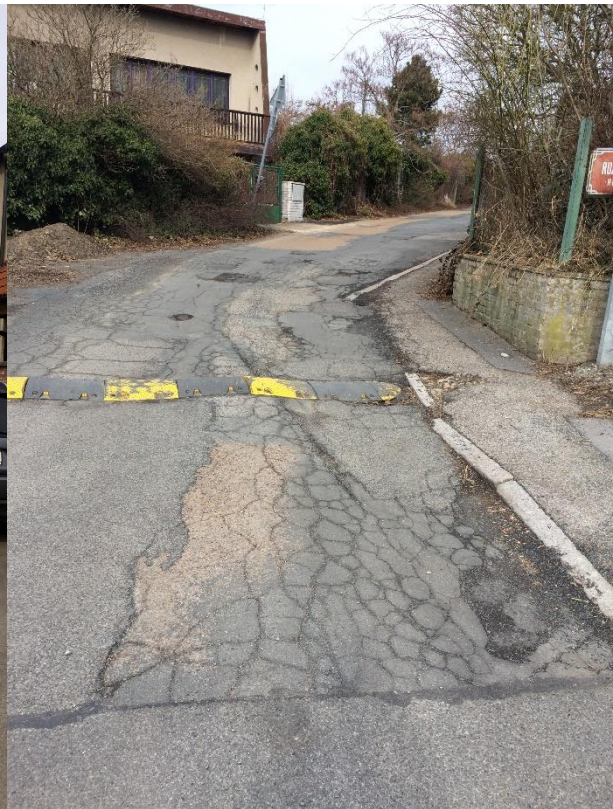
Obr.55 Ulice Nad Manovkou – poruchy vozovky