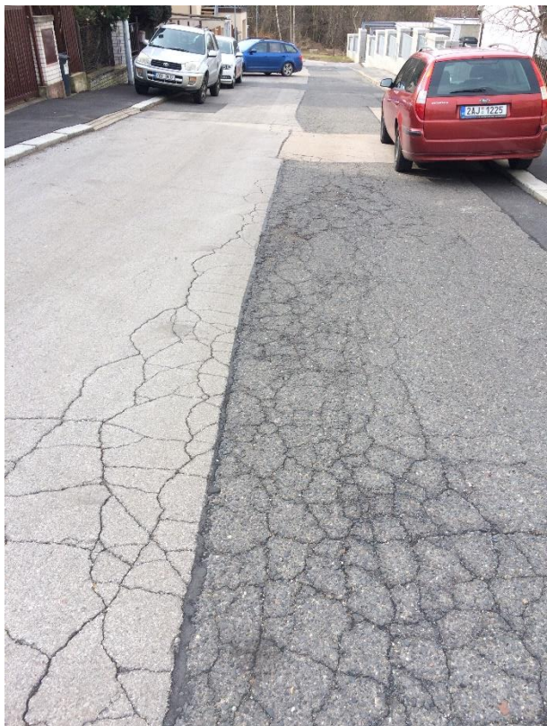
Obr.82 Ulice Sadová – parkování na chodníku