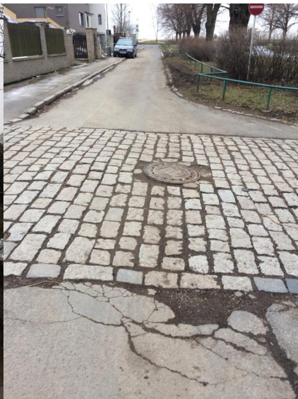
obr. 5 - Křižovatka ulic Alej Českých exulantů - Bělocká