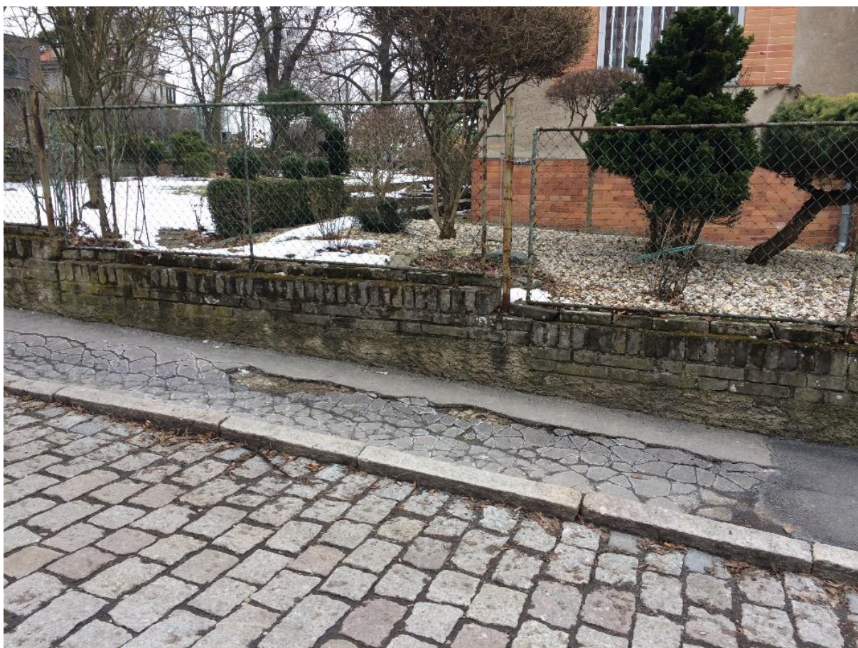
Obr. 12 – ulice Bělocká – propadlý chodník