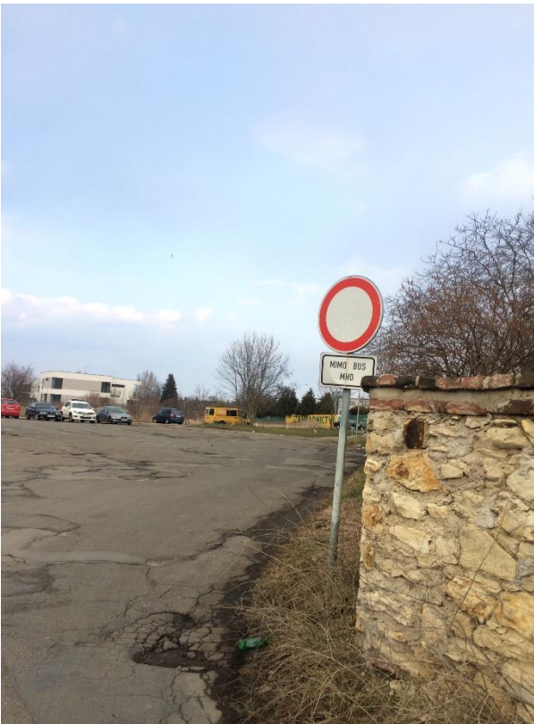
Obr. 112 a 113 Ulice Zličínská pohled na obratiště autobusu