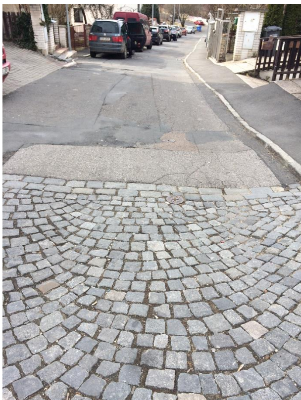
Obr.98 Ulice Ve Višňovce – detail dlažba – asfalt