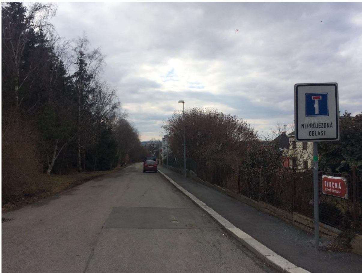
Obr. 66 Ulice Ovocná pohled od ulice K Mohyle