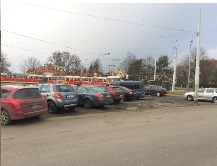
Obr.111 Ulice Zličínská – točna tramvají