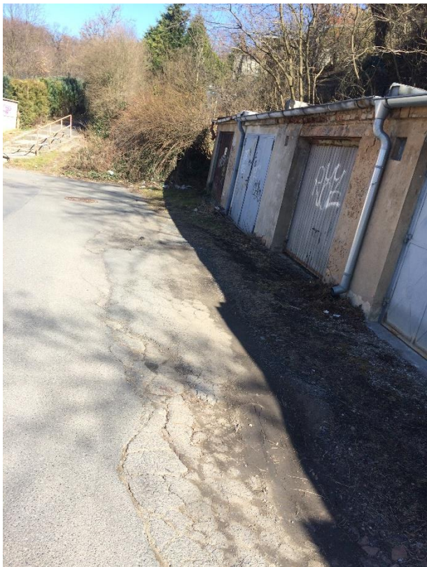
Obr.30 Ulice Dobrovízská – trhliny úsek před garážemi