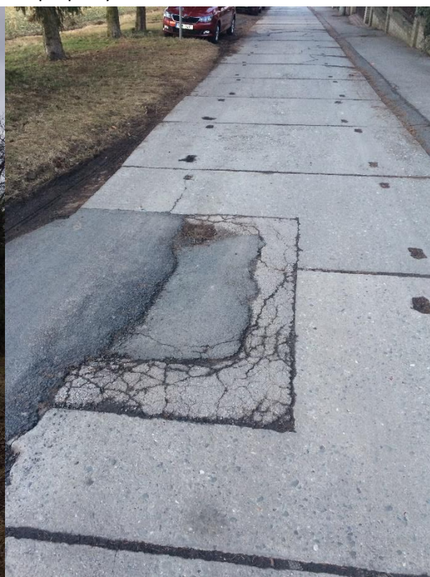
Obr. 14 – Ulice Chrástánská – povrch vozovky