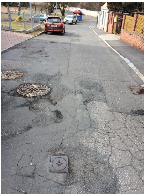
Obr.99 Ve Višňovce – poruchy asfaltové vozovky