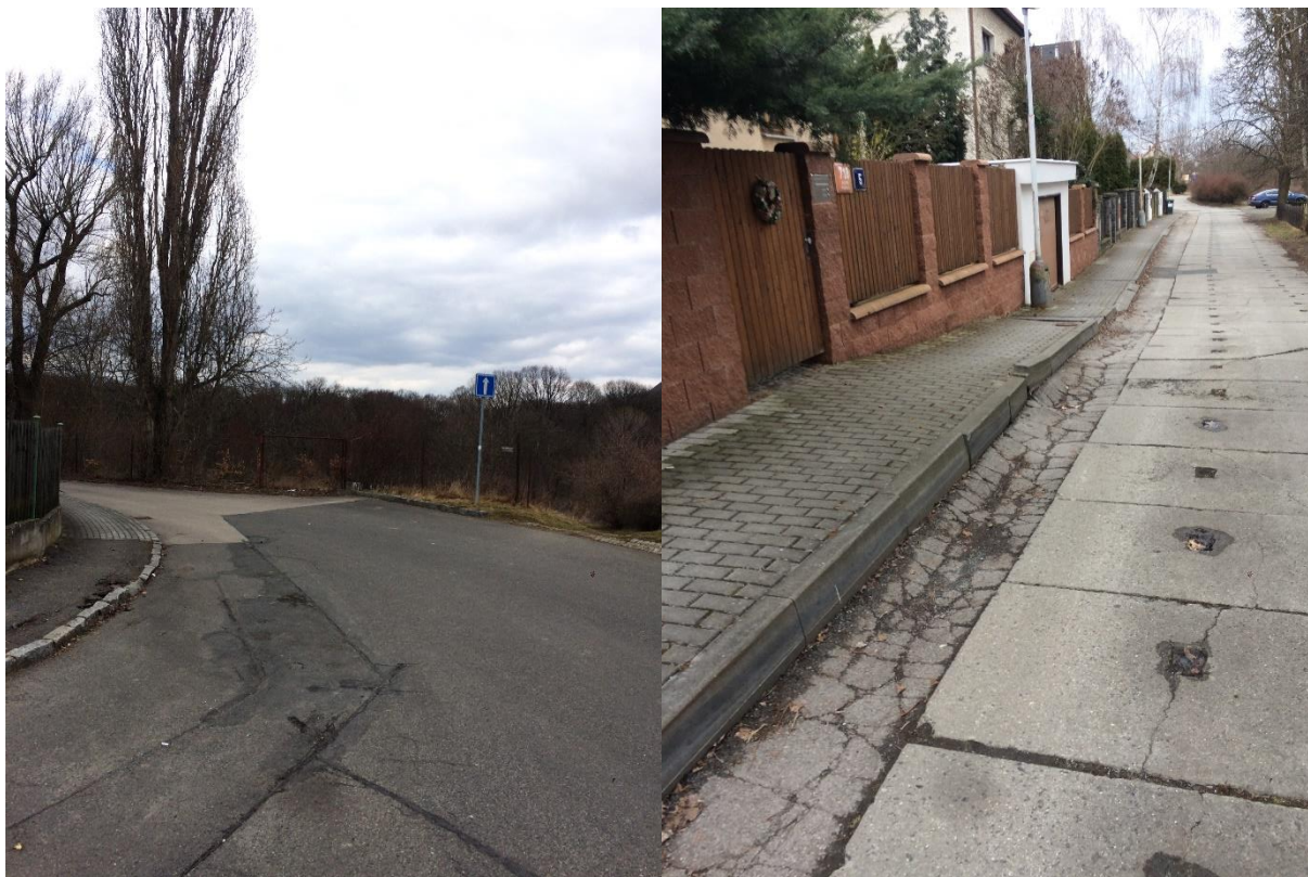
Obr.91 Ulice U Světličky– pohled o křižovatky s ulicemi Moravanů a Zličínská