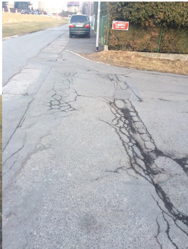
Obr.59 Ulice Nad Višňovkou – křižovatka s ulicí K Mohyle