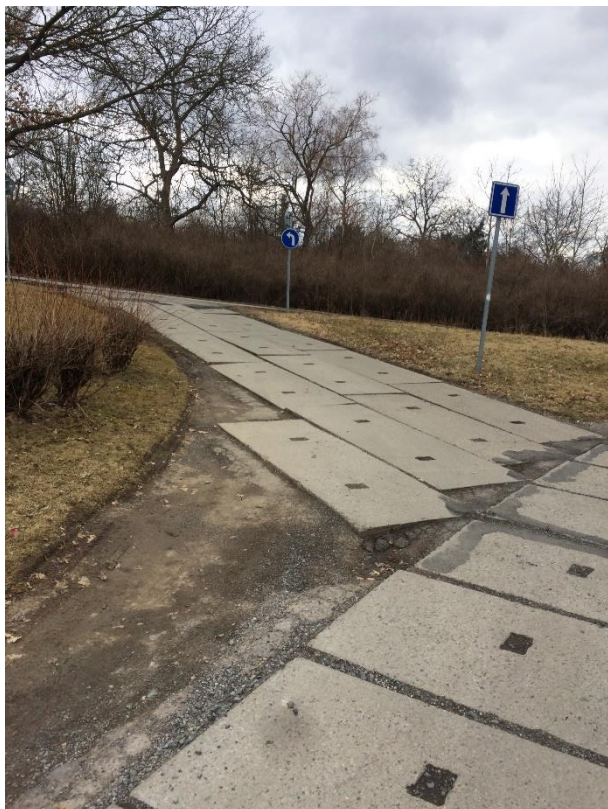
Obr.93 Ulice U Světličky– křižovatka s ulicí Kralupská