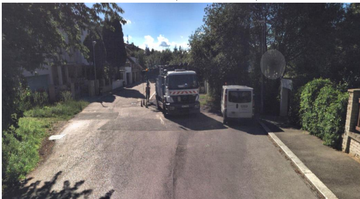
Obr. 67 Ulice Ovocná – zúžení ulice před domem č. 454/22