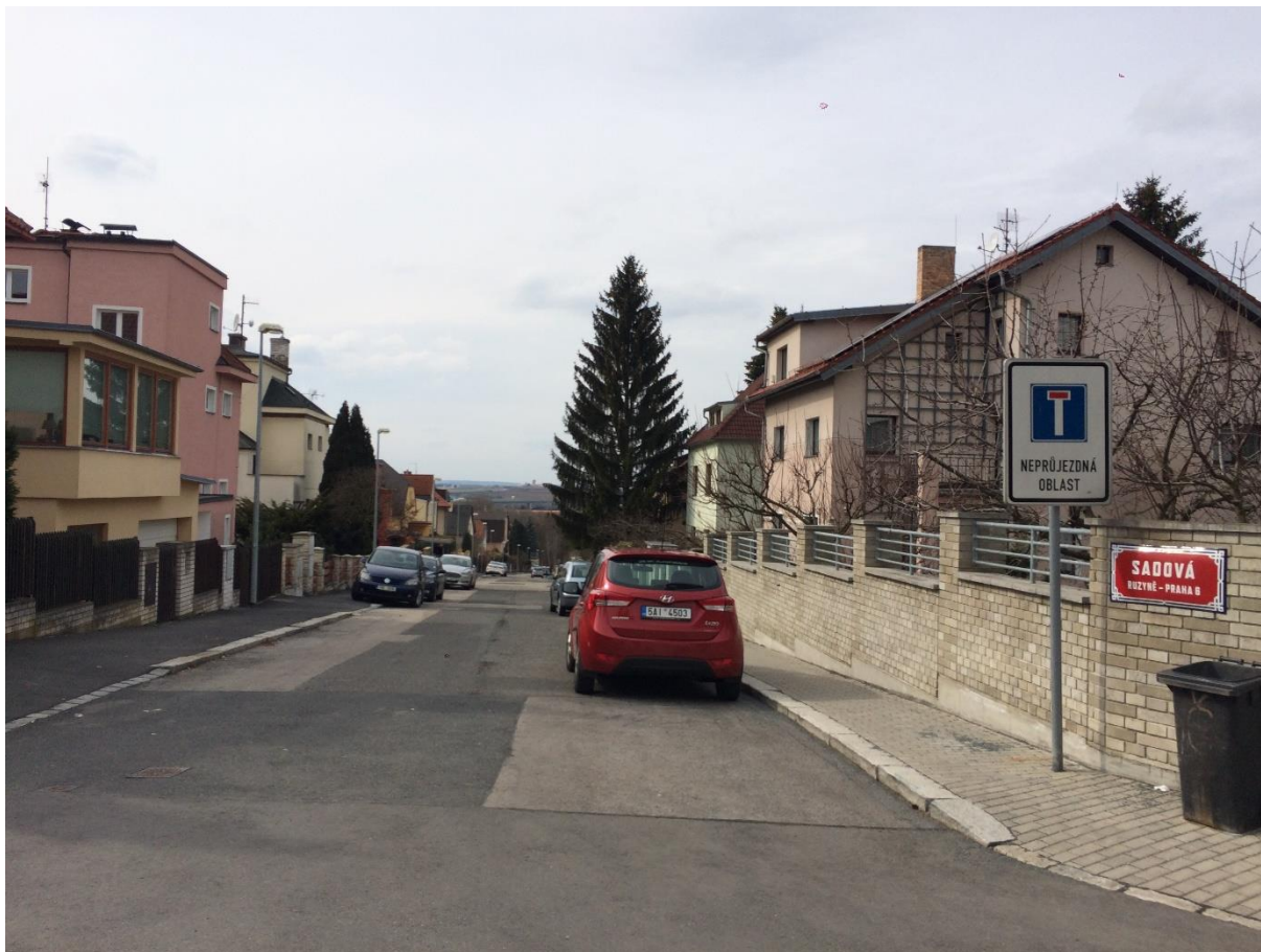
Obr. 79 Ulice Sadová – pohled od ulice K Mohyle