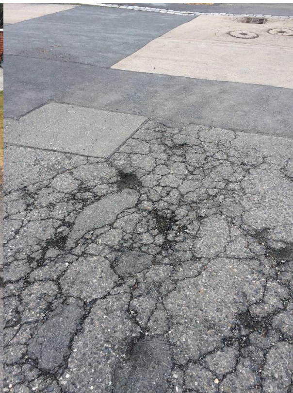
Obr.101 Ve Skalkách – výmoly