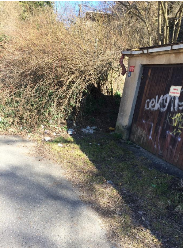
Obr.31 Ulice Dobrovízská – zarůstající komunikace před garážemi