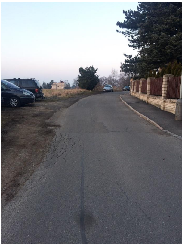
Obr.73 Ulice Řepská– pohled od ulice Pod Mohylou