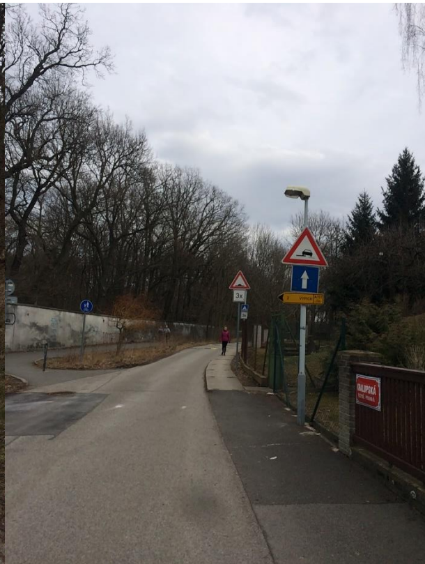
Obr.50a Ulice Kralupská –křižovatka s cyklotrasou A157