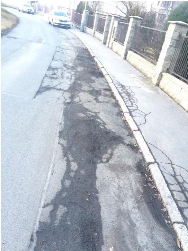
Obr.75 Ulice Řepská– poruchy vozovky