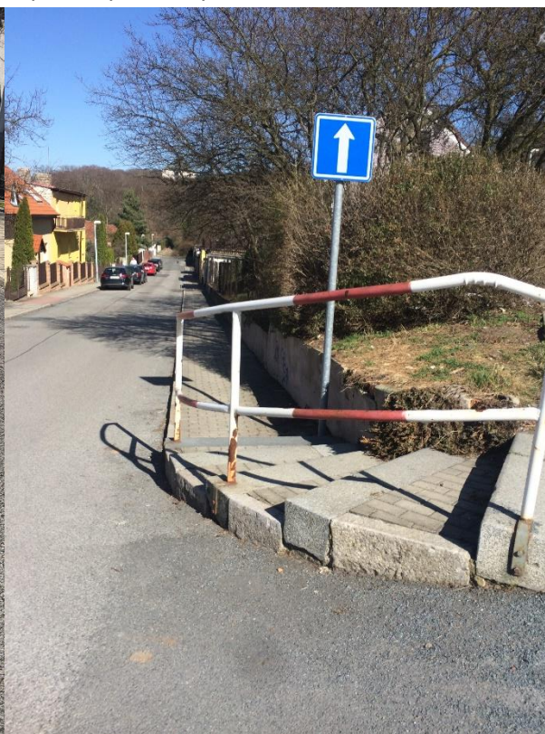
Obr.29 Ulice Dobrovízská – korodující zábradlí