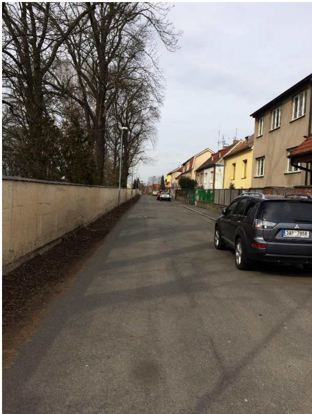
Obr.54 Ulice Nad Manovkou