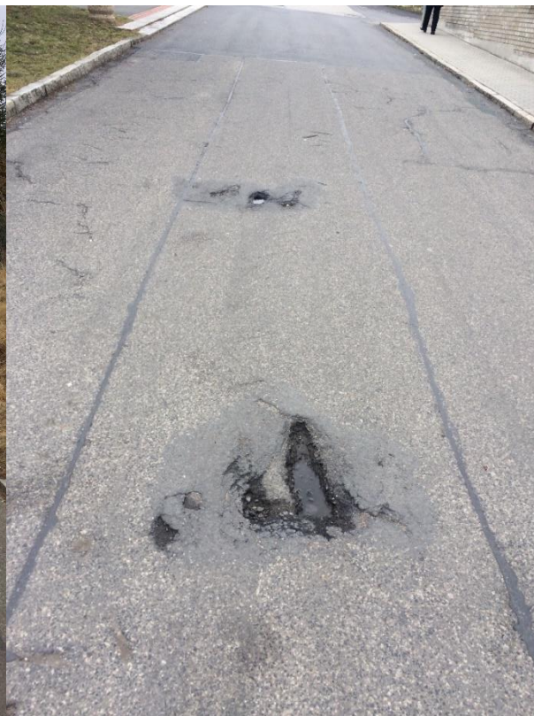
Obr.109 Ulice K Mohyle – výmoly