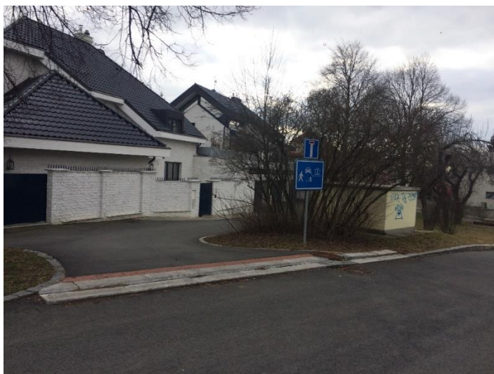
Obr.64 a 65 Ulice Na Višňovce – obytná zóna před domem č. 964/13