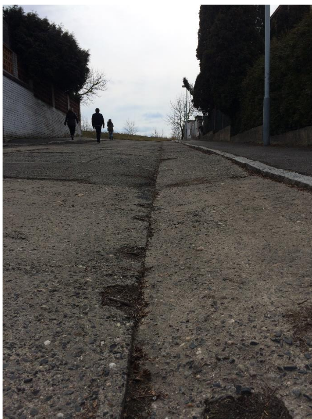
Obr.106 Ulice Zahradní – stav betonových desek