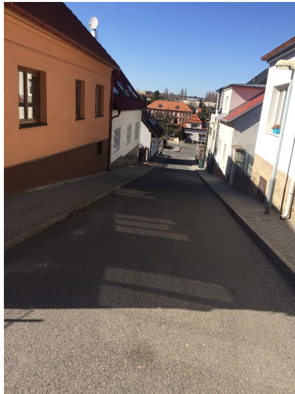
Obr. 43 – Ulice Krušovická