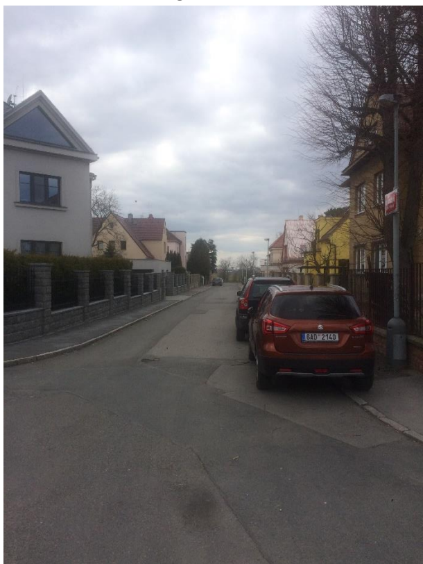
Obr.32 Ulice Holubická – pohled od ulice Chýňská