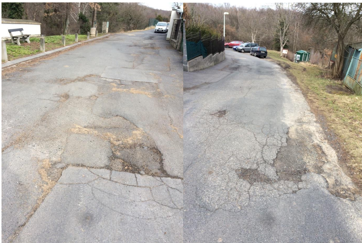
Obr.40 a obr.41 – Ulice Huberova – poruchy vozovky