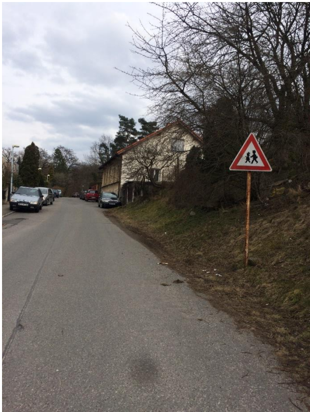
Obr.50 Ulice Kralupská –pohled od ulice Huberova směrem k ulici Chrástanská