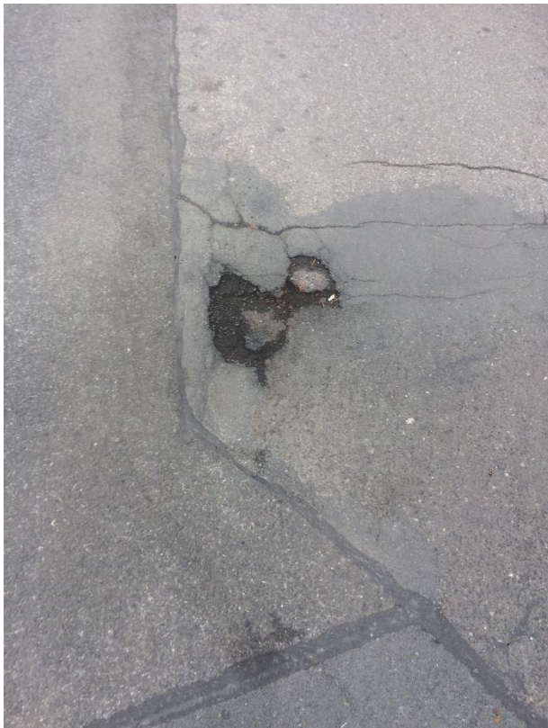
Obr.34 Ulice Holubická – výmol