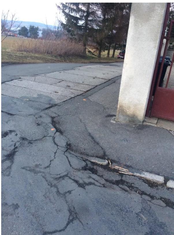
Obr.78 Ulice Řepská –zničený chodník na rohu s ulicí Chrástěanská