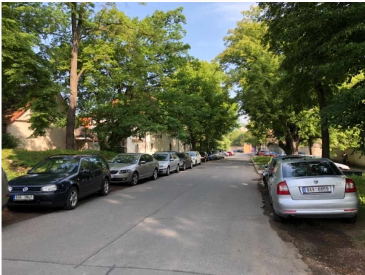
Obr. 89 Ulice Staré námětí— poptávka po parkování přes den