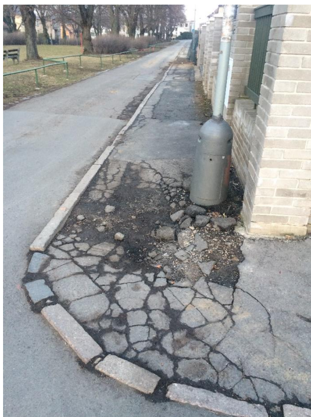
Obr.77 Ulice Řepská– zničený chodník na rohu s ulicí Alej Českých exulantů