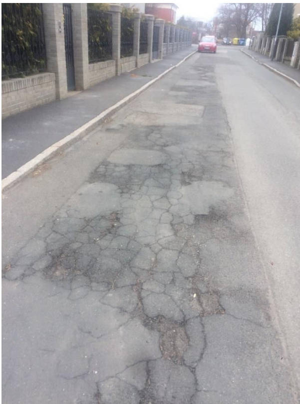
Obr.19 Ulice Chýňská – vlasové trhliny