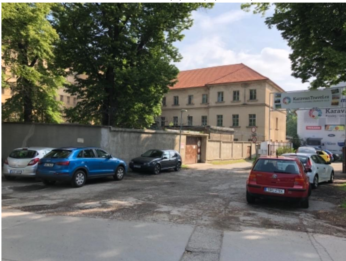
Obr. 90 Ulice Staré námětí – poptávka po parkování přes den