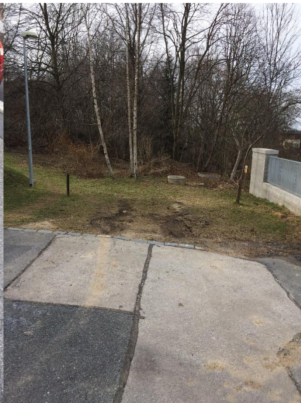
Obr.83 Ulice Sadová – konec ulice