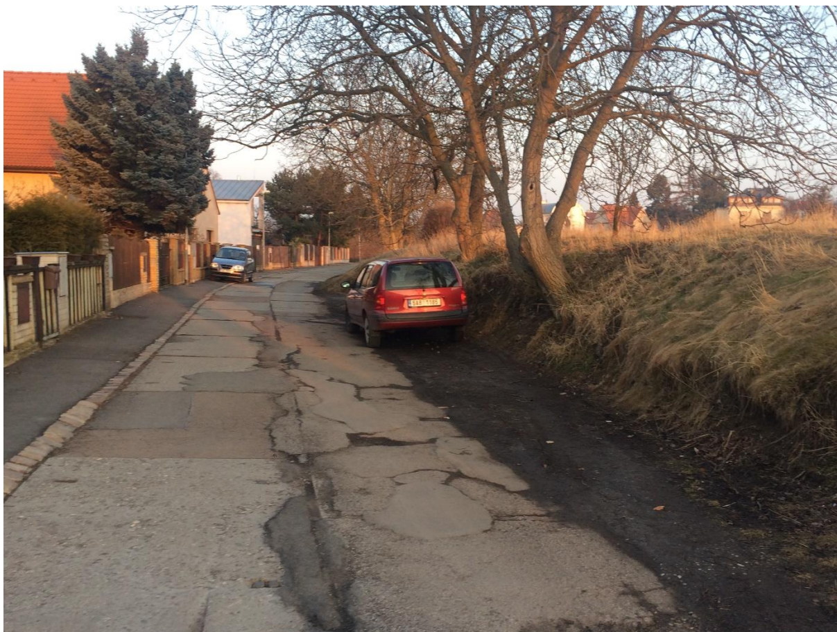
Obr. 71 Ulice Pod Mohylou - úsek mezi ulicemi Huberova a Zahradní