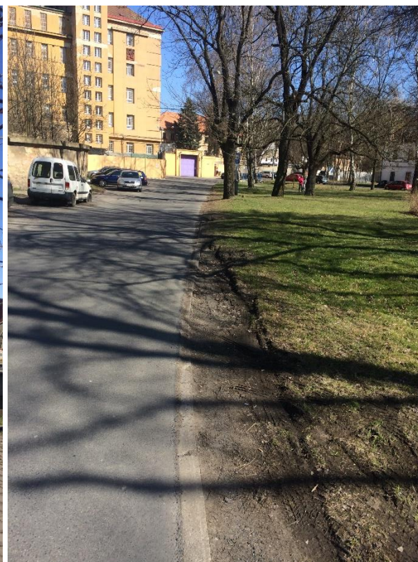
Obr.85 Ulice Staré náměstí – pohled směrem k věznici