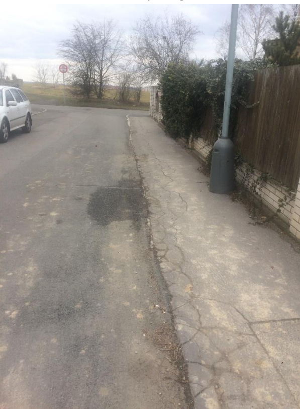
Obr.33 Ulice Holubická – trhliny a chybějící obrubníky