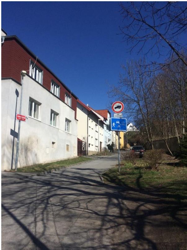
Obr.22 Ulice Chomutovská – vjezd