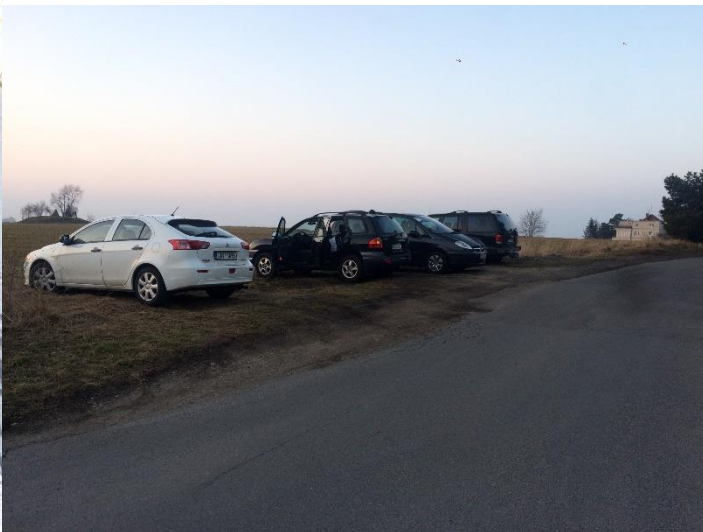
Obr.76 Ulice Řepská –kolmé parkování domem č. 436/4