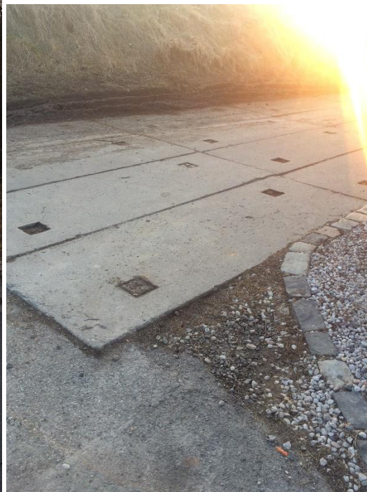
Obr.69 Ulice Pod Mohylou – křižovatka s ulicí Huberova