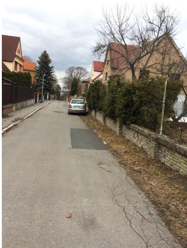
obr. 8 - Ulice Bělocká – pohled od křižovatky Chýňská – Holubická