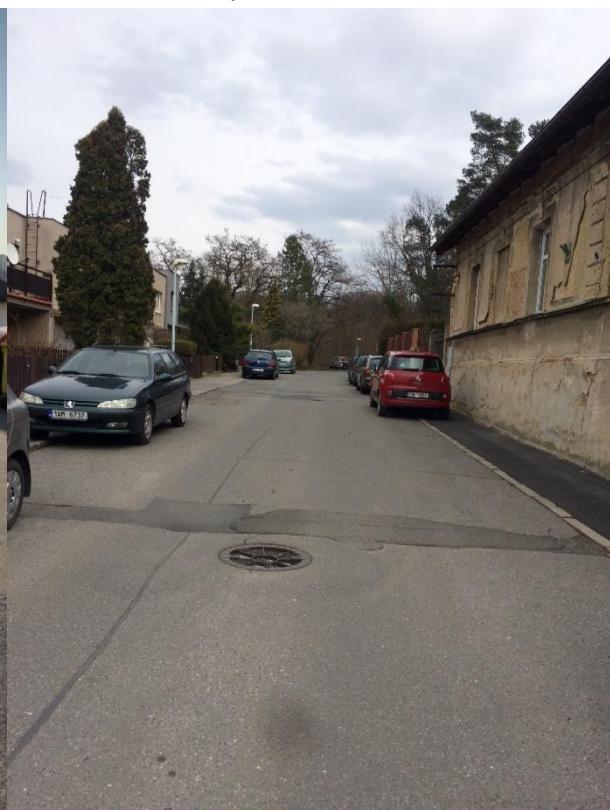
Obr.52 Ulice Kralupská –pohled před domem č. 924/14