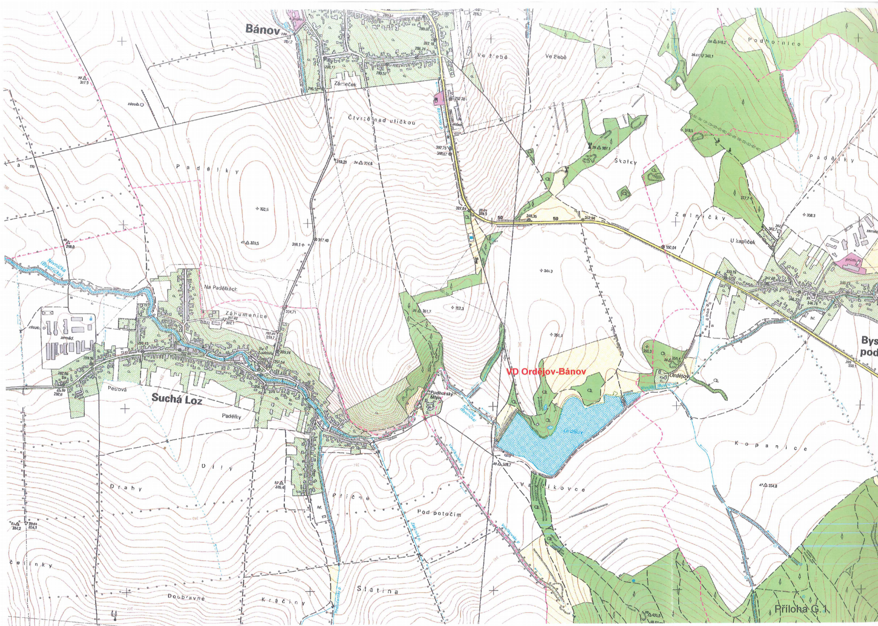
Příloha A: Situace [2]