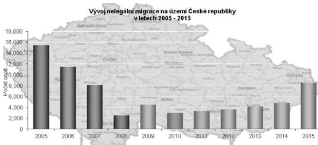
Obrázek 1 Vývoj nelegální migrace na území České republiky v letech 2005-2015 [33]

Od roku 2008 jsou na území České republiky sledovány dvě základní kategorie nelegální migrace. Nelegální překročení vnější schengenské hranice České republiky a Nelegální pobyt. V kategorii nelegálního překročení vnější schengenské hranice České republiky jsou sledovány osoby (cizinci a občané České republiky), které nedovoleně překročily nebo se pokusily o nedovolené překročení vnější schengenské hranice (ML) České republiky. V kategorii nelegálního pobytu se vykazují cizinci zjištění na území České republiky, včetně tranzitního prostoru na letištích, kteří porušují zákonem předepsané podmínky pro pobyt cizince. Ačkoli vývoj v posledních letech ukazuje, že pro mnohé cizince se Česká republika stává zemí cílovou, je nadále využívána cizinci k nelegální migraci do dalších evropských zemí. Jelikož vnější schengenskou hranici tvoří pouze vzdušná hranice, jsou osoby při nelegální migraci přes vnější schengenskou hranici vykazovány jen u ŘSCP, kam bylo v roce 2008 organizačně začleněno 5 inspektorátů cizinecké policie na mezinárodních letištích. V rámci hodnocení dlouhodobého vývoje nelegální migrace po vstupu České republiky do schengenského prostoru k 21. 12. 2007 byl v roce 2015 vykázán dosud nejvyšší roční počet neregulérních migrantů. [33]