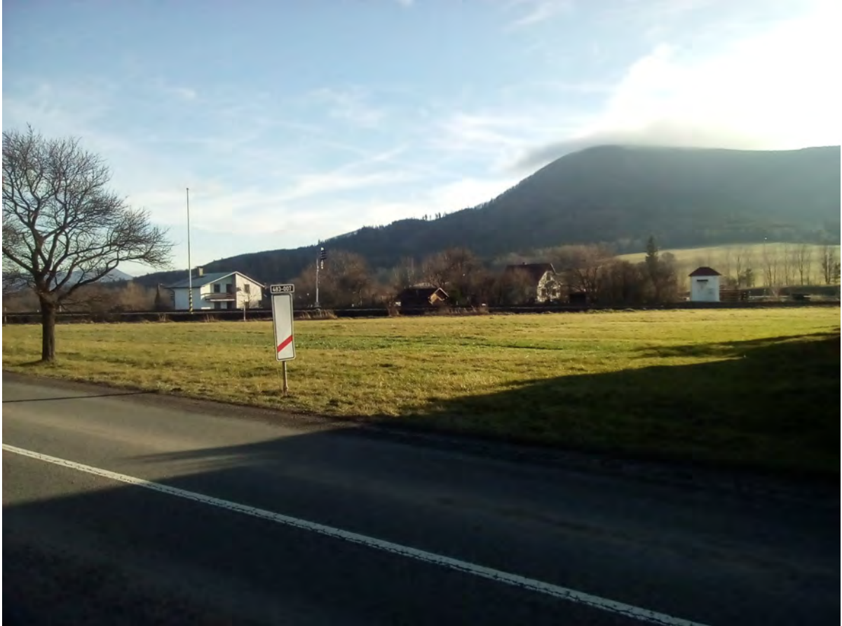
Foto 22: pohled na směrové oblouky zaústění regionální trati č. 328