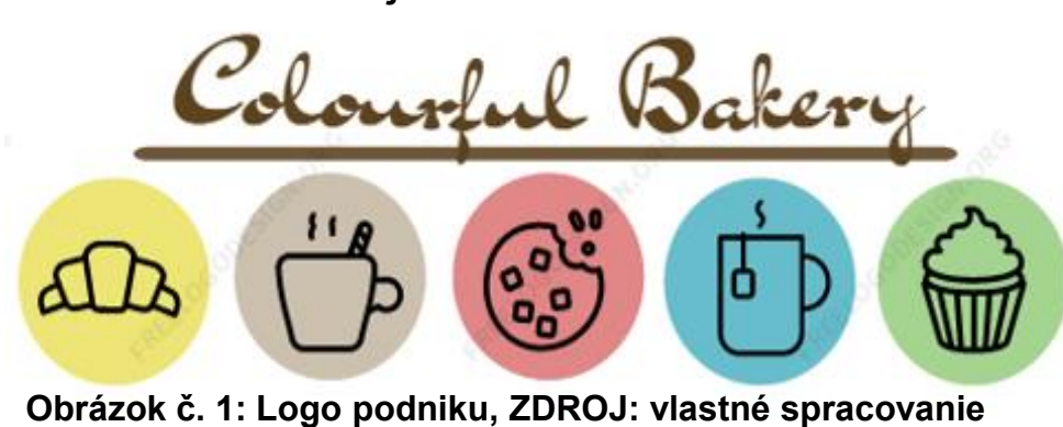
Obrázok č. 1: Logo podniku

Predmetom práce je podnik Colourful Bakery . Predstavuje rozšírený koncept pekárne a z formálneho hľadiska patrí do skupiny remeselných živností, na ktorú je potrebné živnostenské oprávnenie v hostiteľskej činnosti.