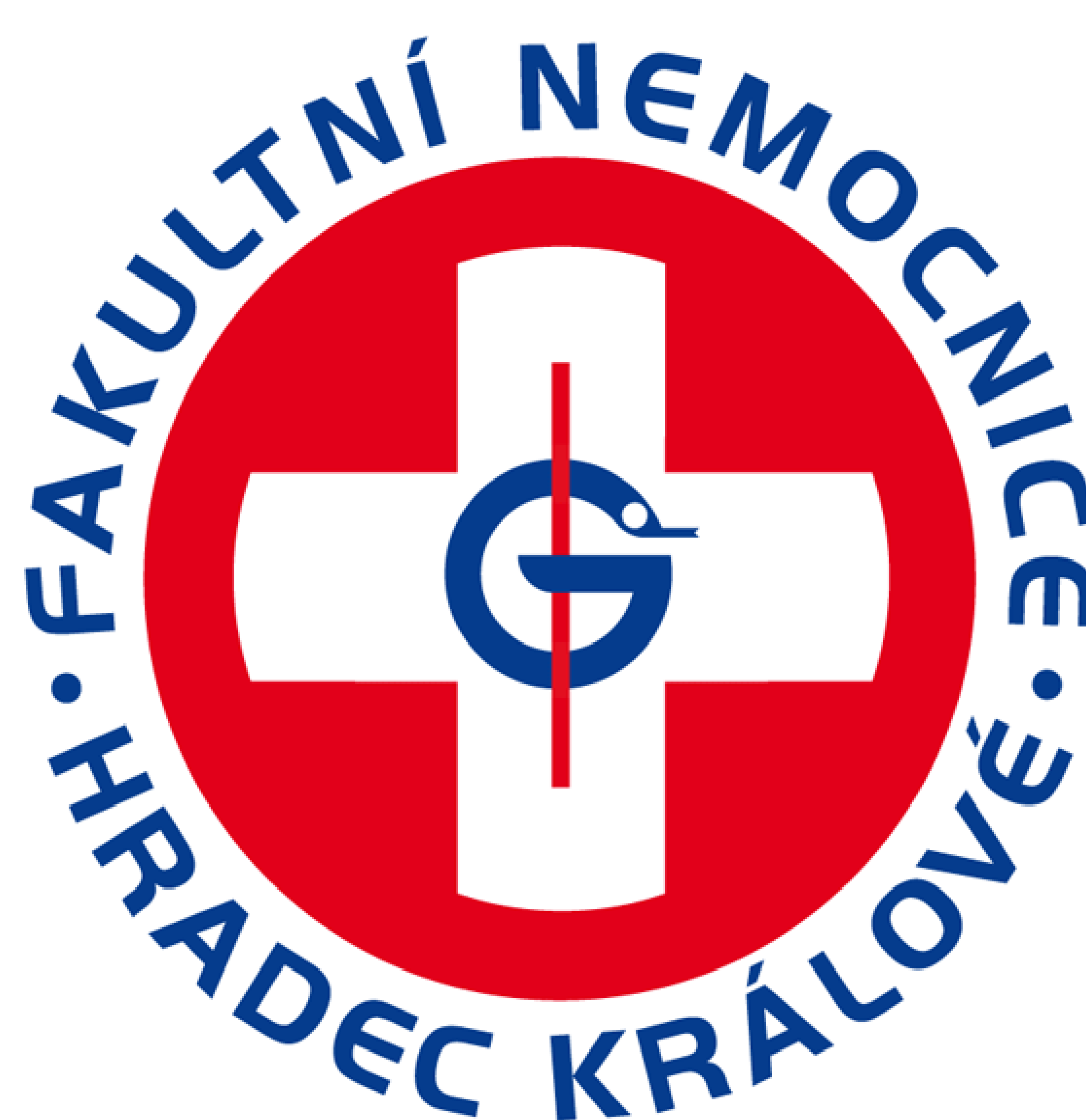
Obrázek 2 Logo FNHK [1]