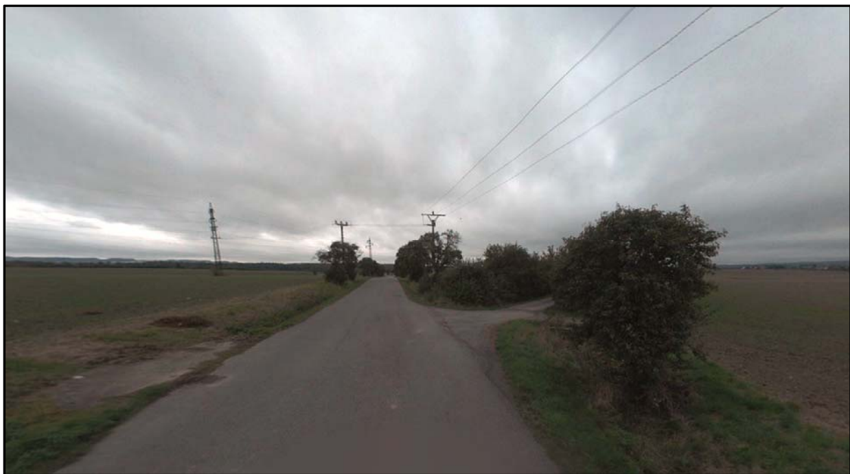
Obr.3 Pohled na stávající napojení polní cesty