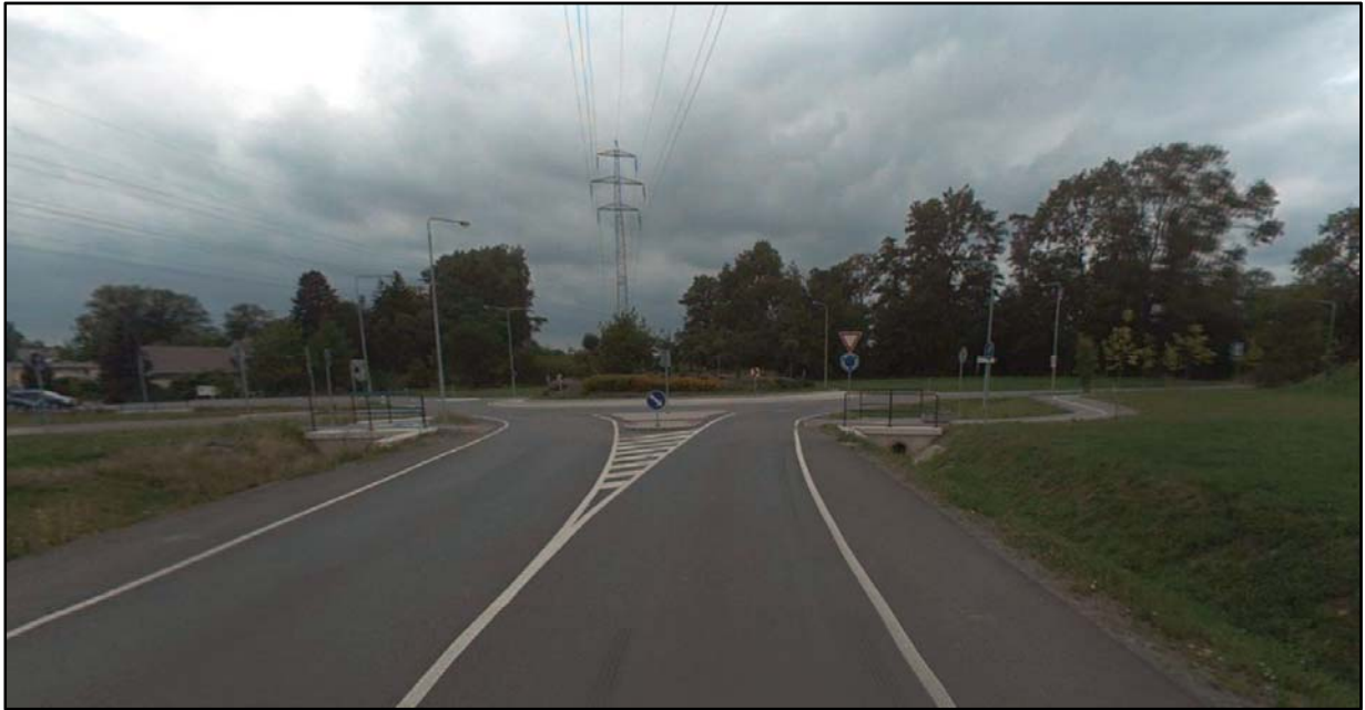
Obr.1 Pohled na stávající okružní křižovatku (začátek úseku )