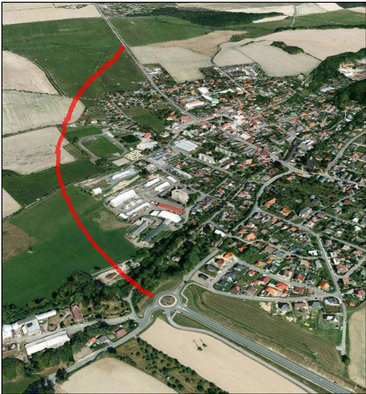
Obr.7 Celkový pohled na město Solnice ( znázornění budoucího obchvatu )