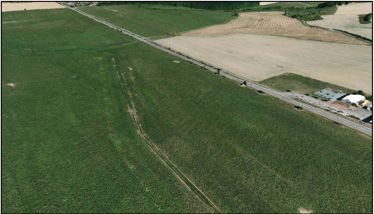
Obr.6 Pohled na konec úseku (budoucí napojení na konci úseku )