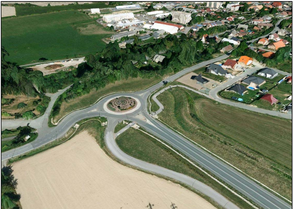
Obr.2 Pohled na stávající okružní křižovatku (začátek úseku )