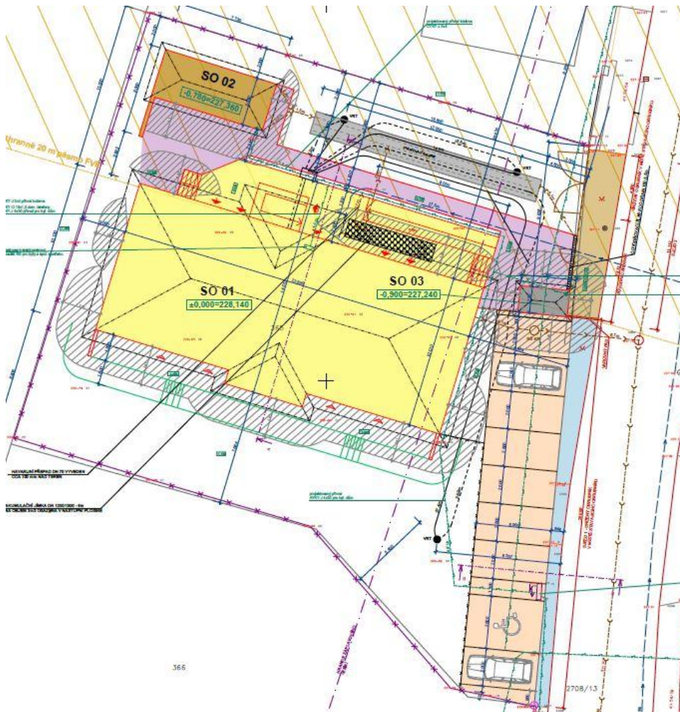
Obr. 8- Stavební objekty