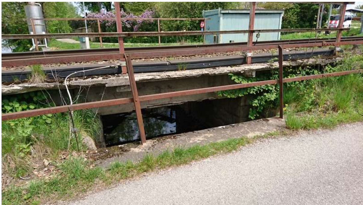
(most v km 12,827 – přeliv Obecního rybníka)