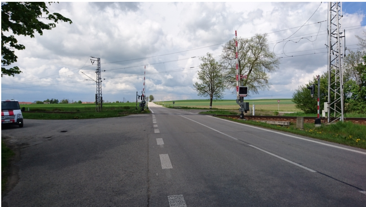
(přejezd silnice I/23 v km 7,383 od V)