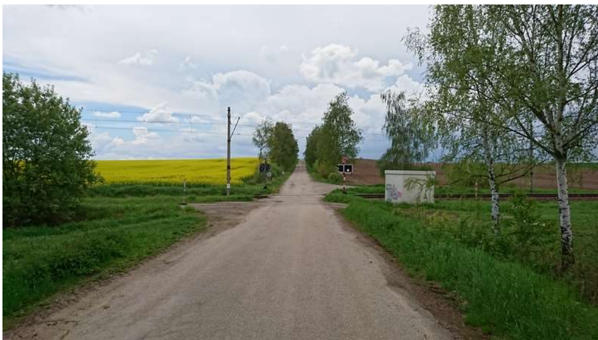
(pohled na přejezd v km 9,867 od S – místo budoucího nadjezdu)