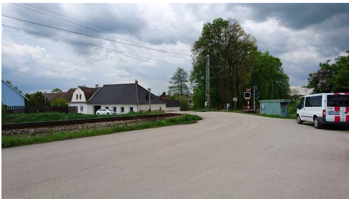
(přejezd v km 12,846 od V)