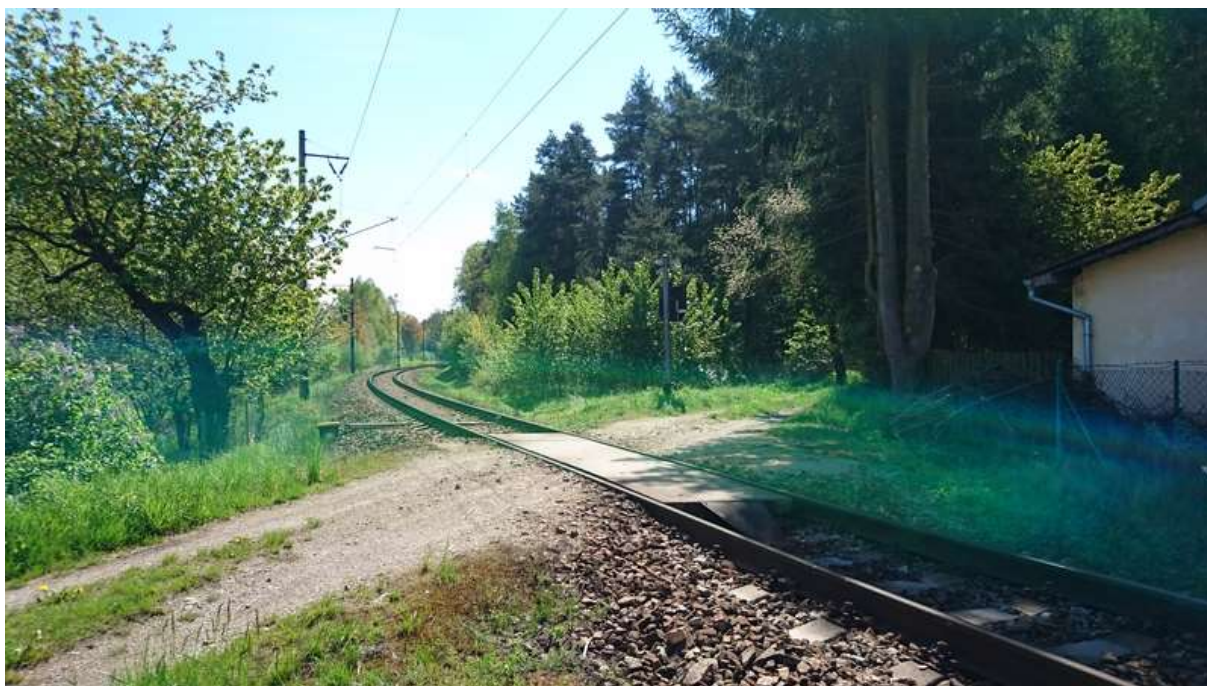
(pohled na přejezd v km 3,253 po směru staničení)