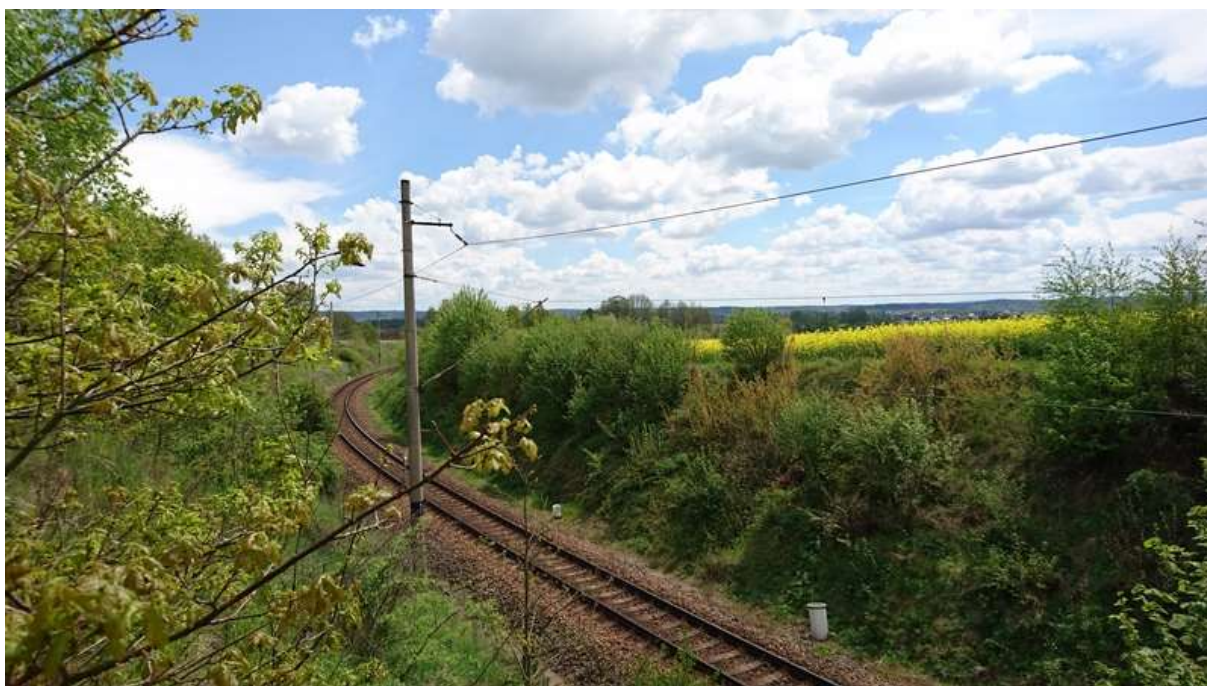
(zářez v km 10,4 ve směru staničení)