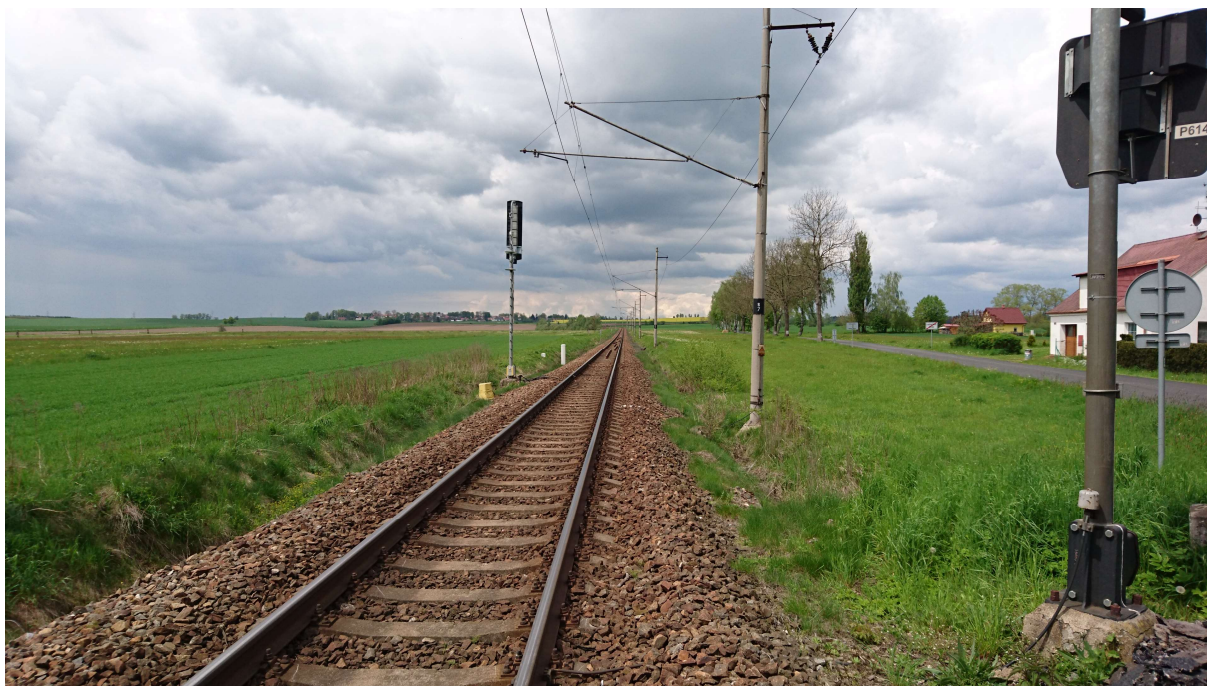
(pohled od přejezdu v km 12,659 proti směru staničení)