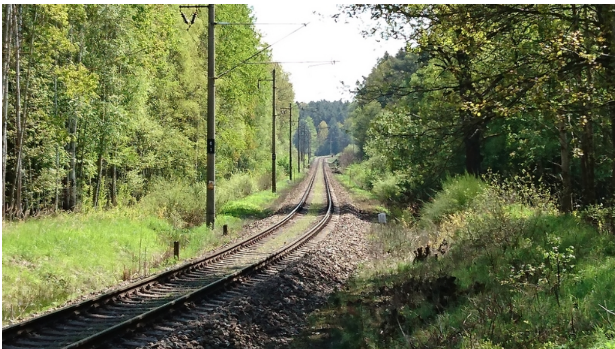
(pohled v km 3,6 ve směru staničení)