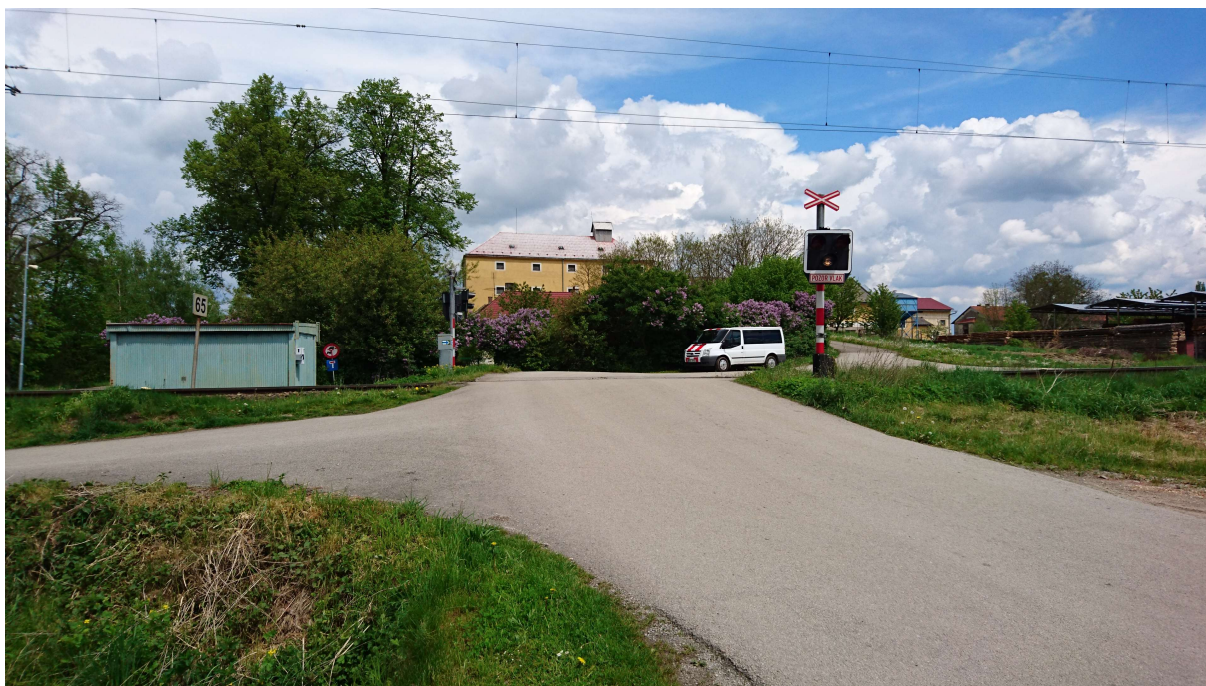
(přejezd v km 12,846 od JZ)