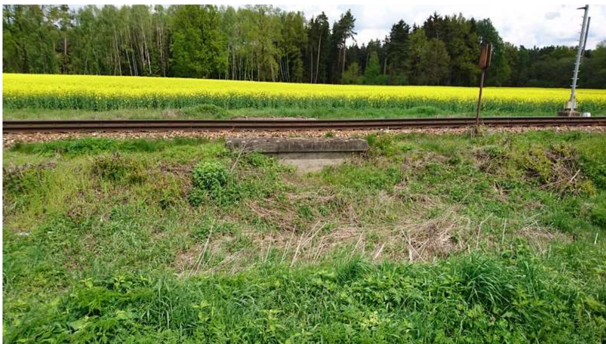
(zanesený propustek v km 8,485)