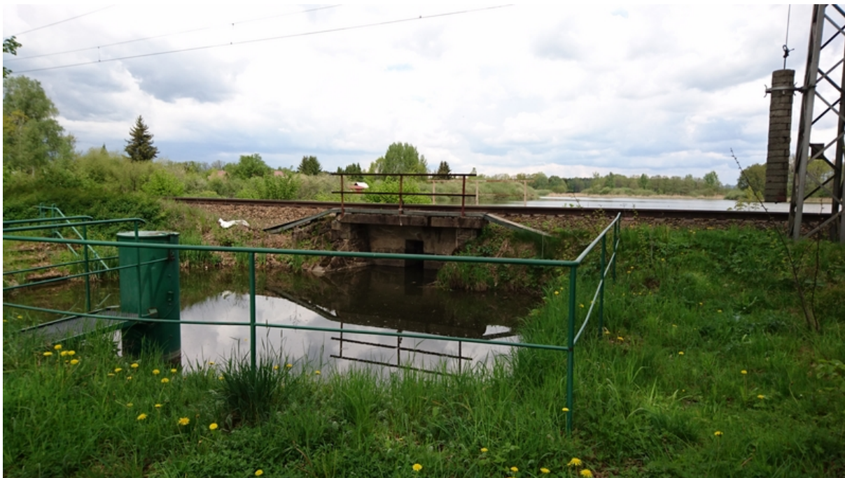
(propustek v km 12,763 – hráz Obecního rybníka)