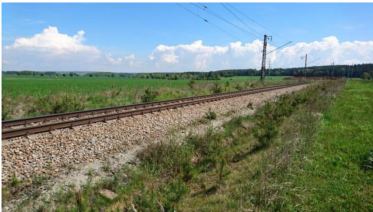
(obnovená PTŽS v km 2,9)