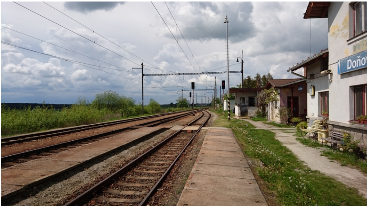
(pohled od dopravní kanceláře proti směru staničení)