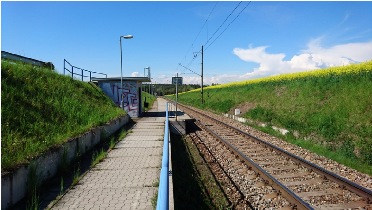
(zast. Řípec proti směru staničení)