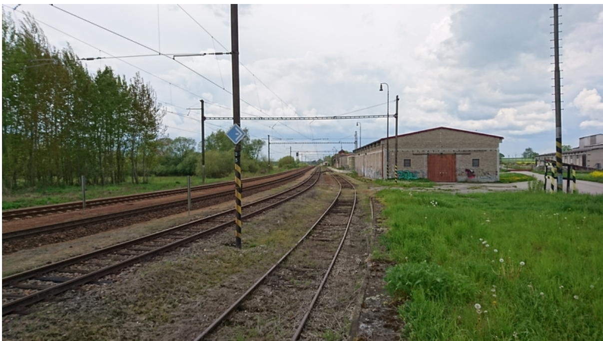
(pohled z nákladové rampy směrem k Z proti směru staničení)