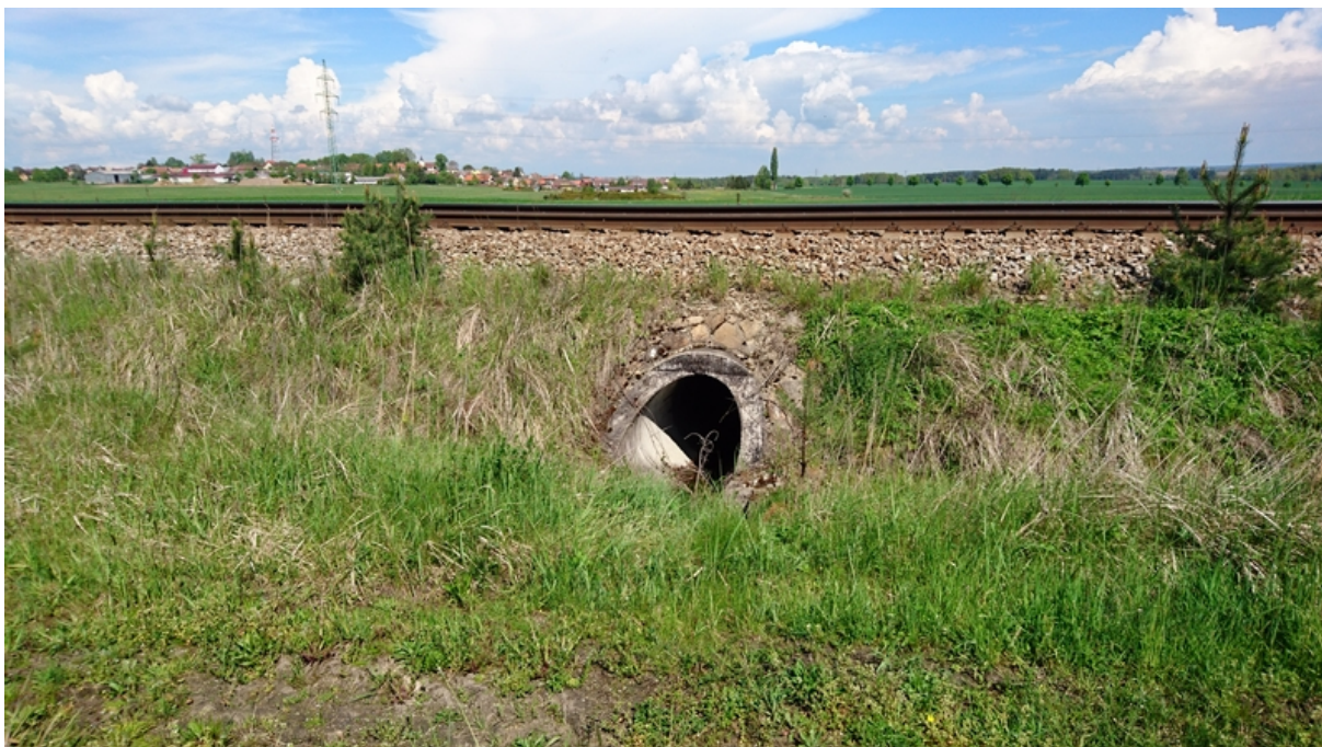
(trubní propustek v km 3,126)