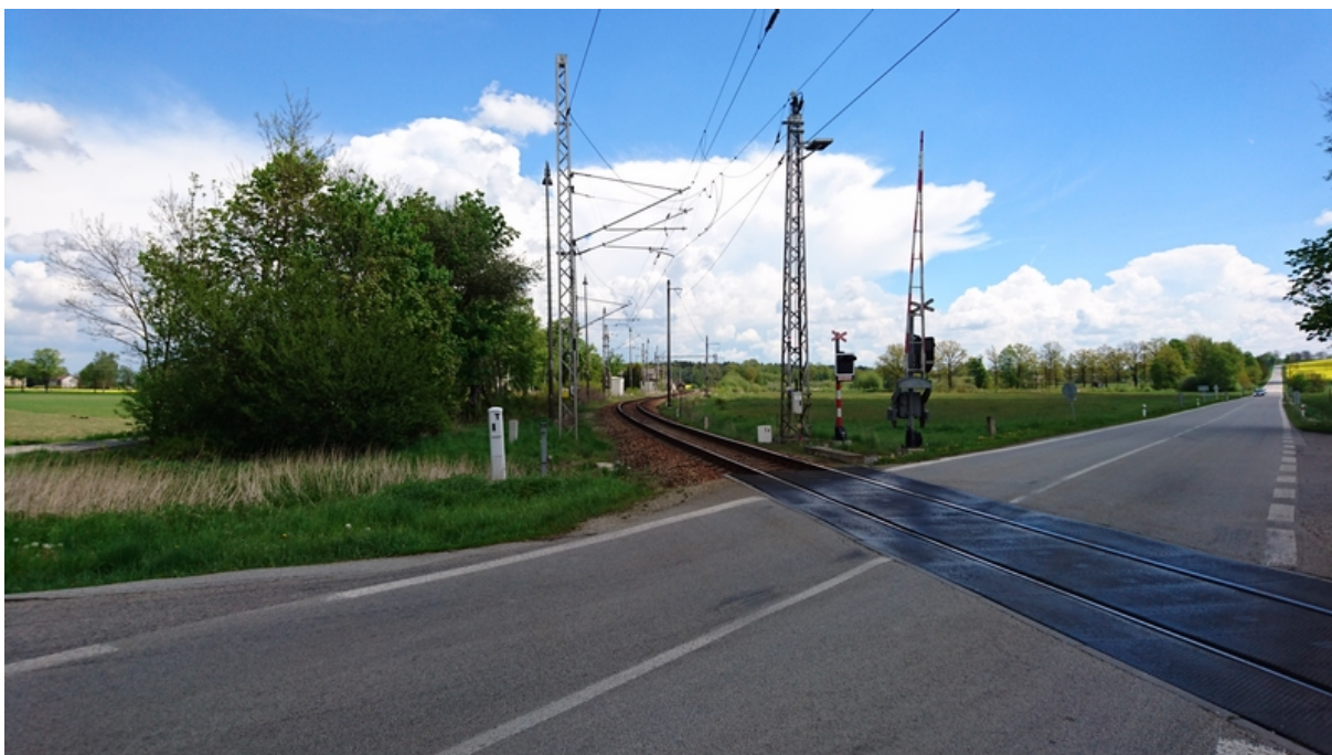
(pohled od přejezdu silnice I/23 v km 7,383 směrem k žst. Doňov)