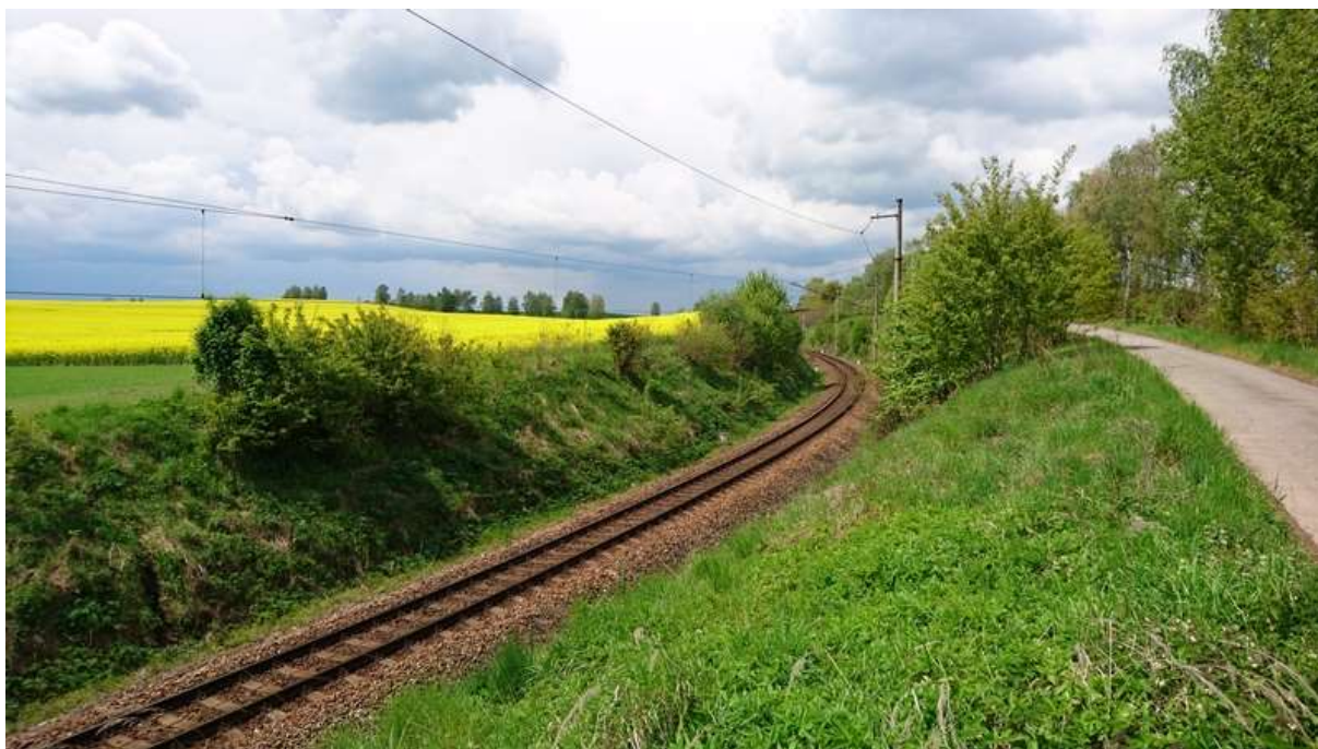
(zářez v km 10,4 proti směru staničení)