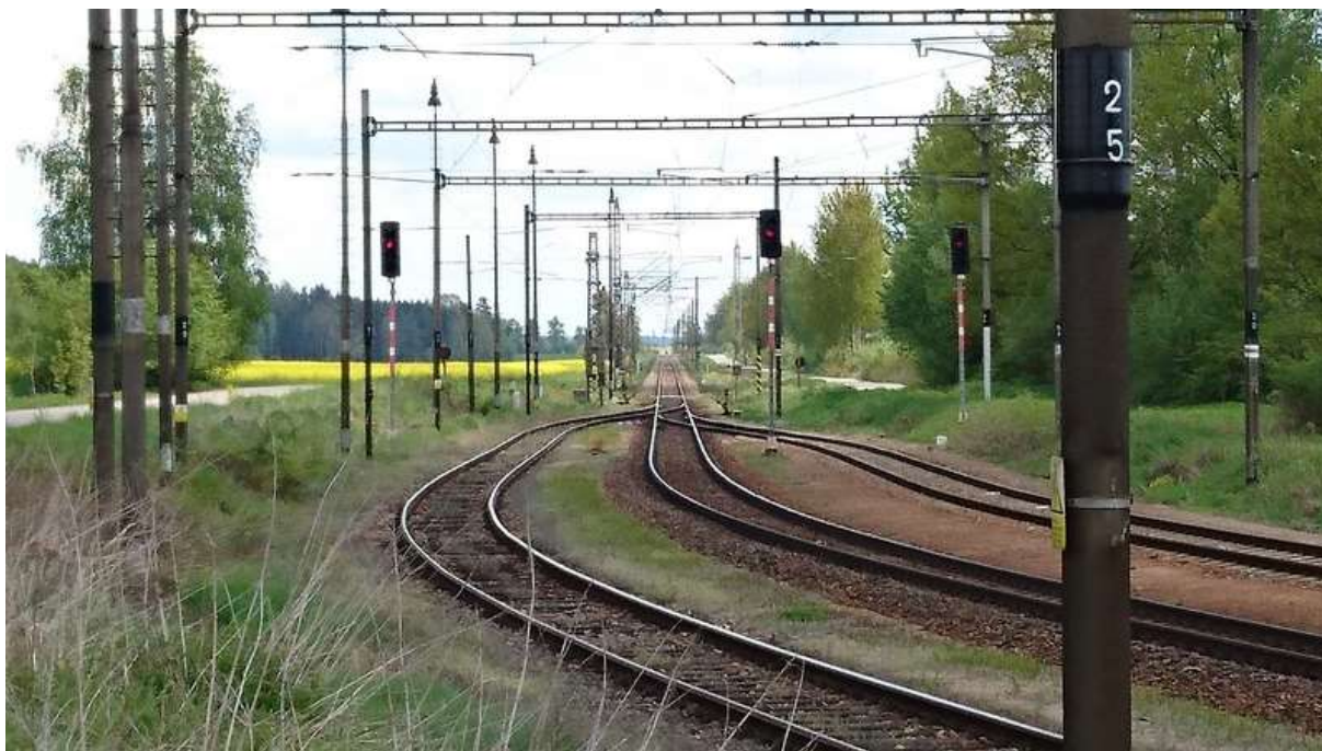
(pohled přes zhlaví žst. Doňov směrem ke Kardašově Řečici)