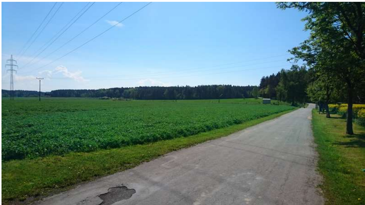
(pohled od S k přejezdu v km 2,218 v místě přeložky – nadjezd a zast. Řípec v nové poloze)