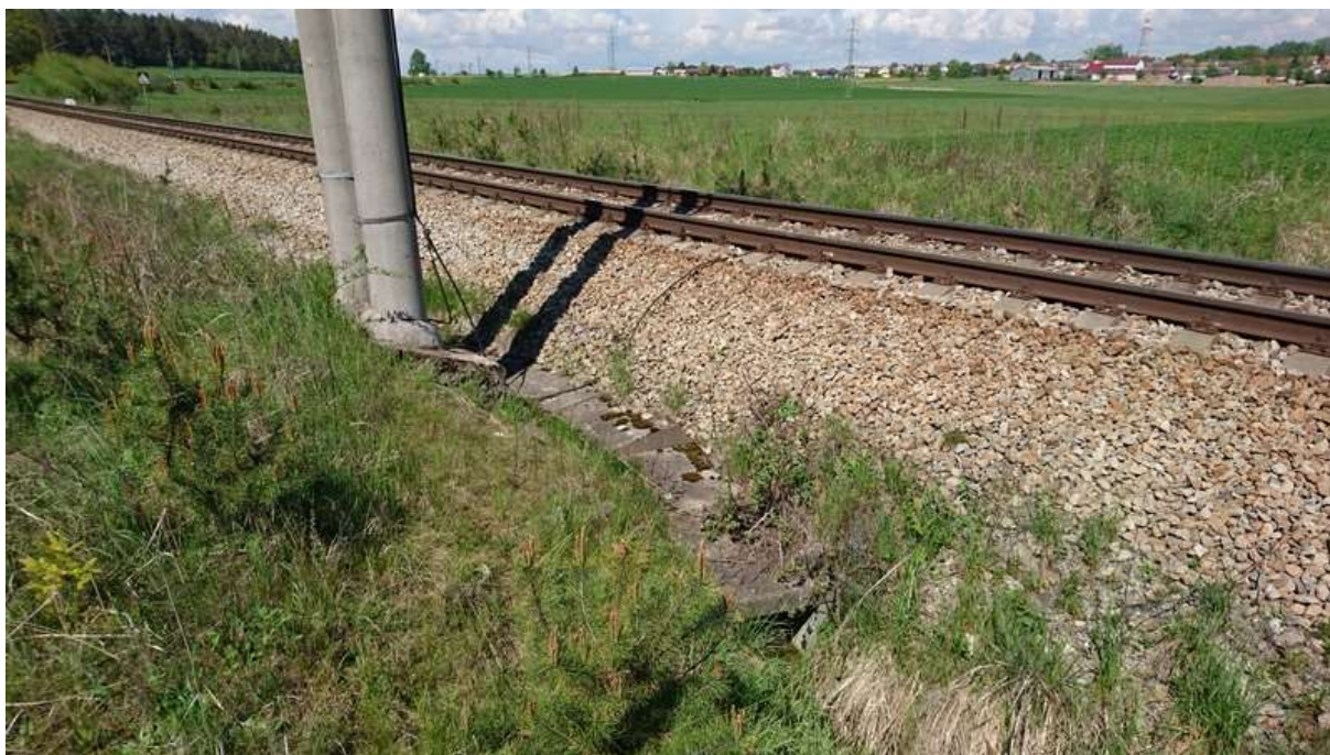
(zakrytý příkop obcházející sloup TV)