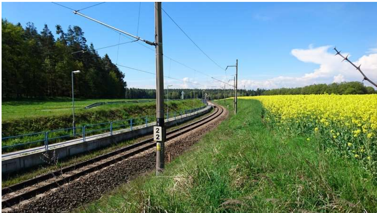
(pohled od přejezdu v km 2,218 proti směru staničení k zast. Řípec)