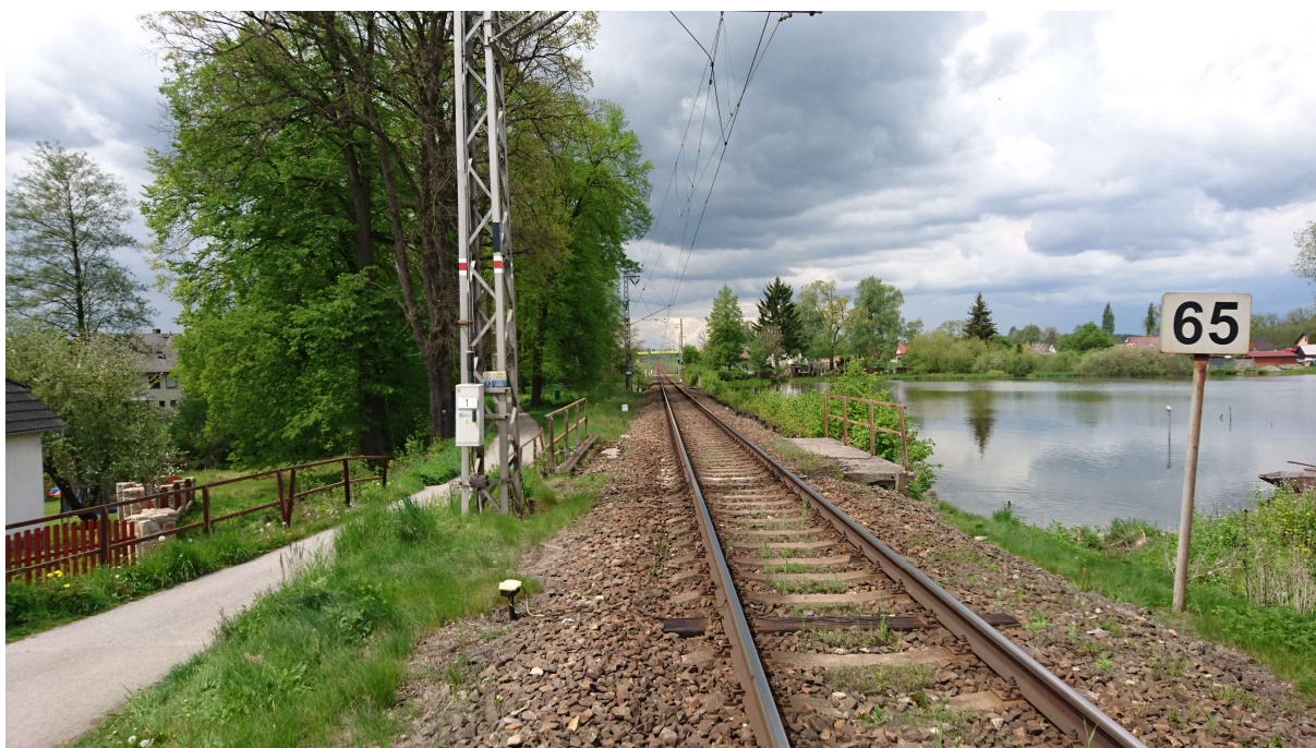
(pohled od přejezdu v km 12,846 proti směru staničení – hráz Obecního rybníka)