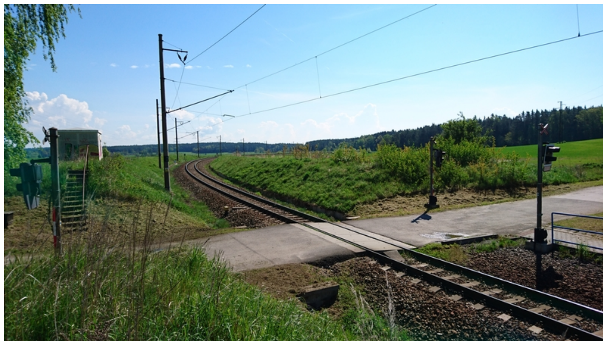
(pohled od přejezdu v km 2,218 po směru staničení)