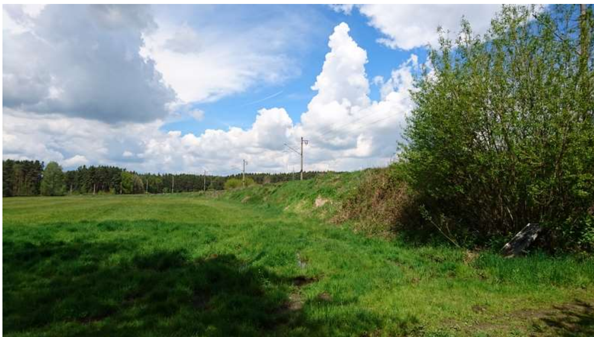
(oblouk v km 4,2 proti směru staničení)