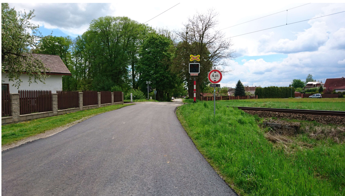
(přejezd v km 12,659 od S)