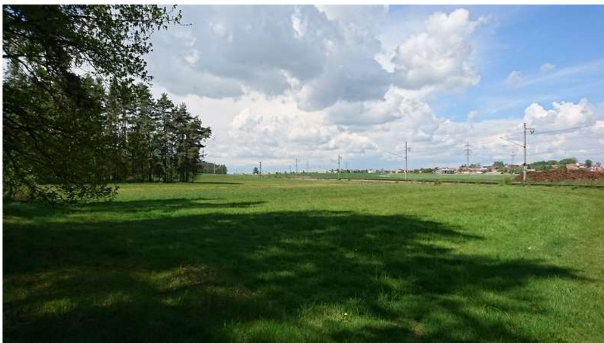
(pohled proti směru staničení přeložky v km 3,15 – přímá od zast. Řípec))