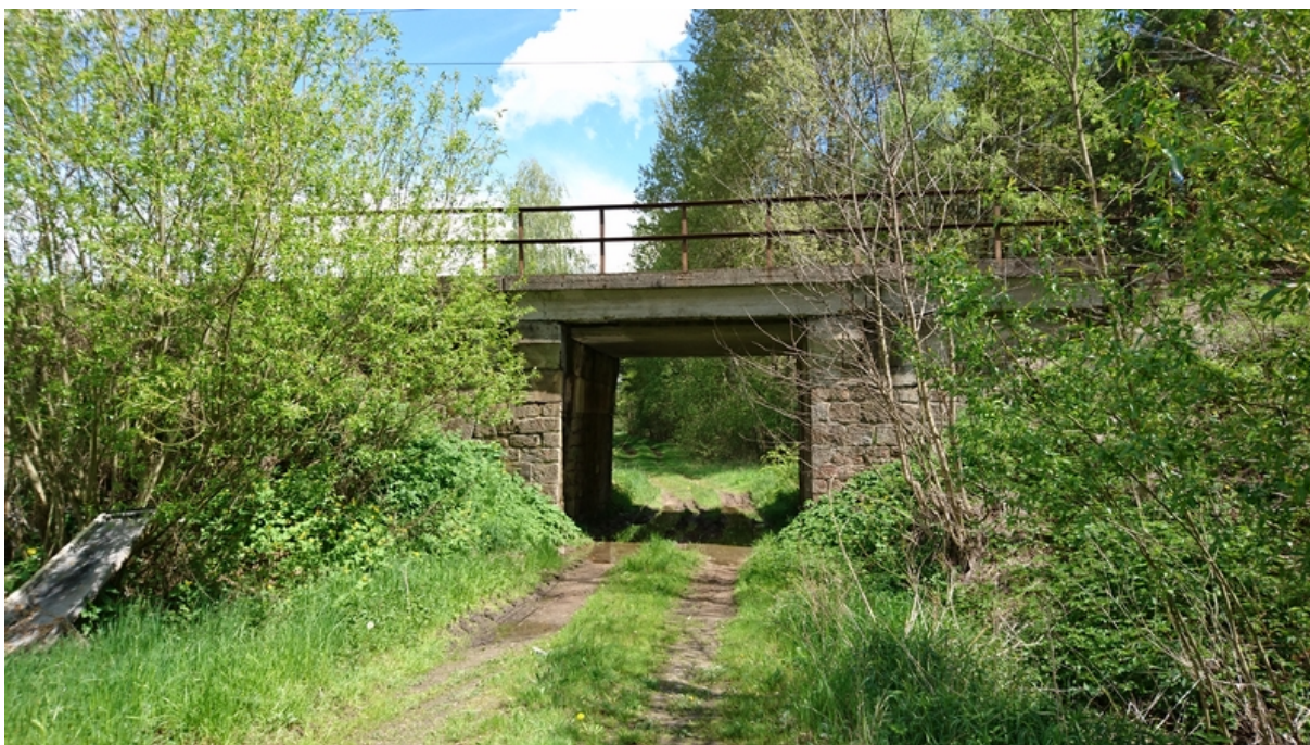
(most v km 4,392)