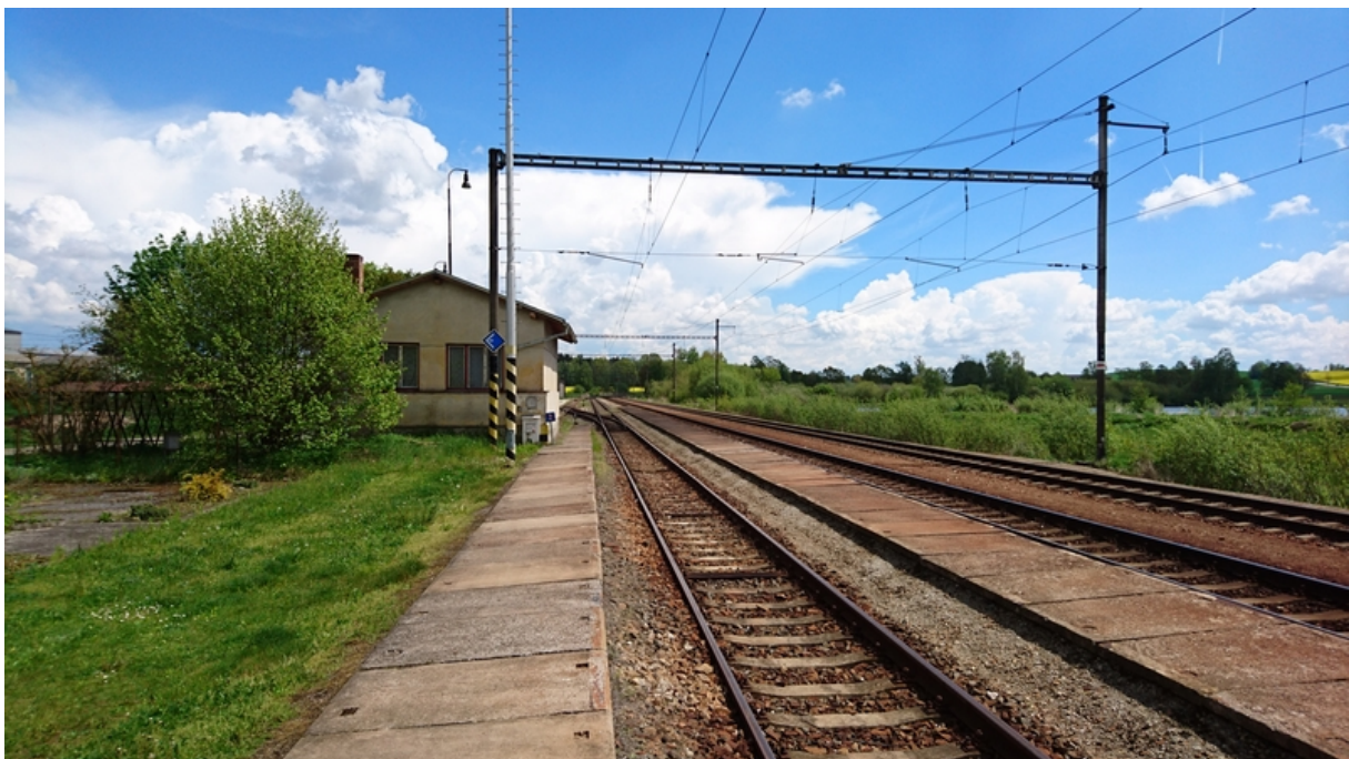
(pohled od dopravní kanceláře ve směru staničení)