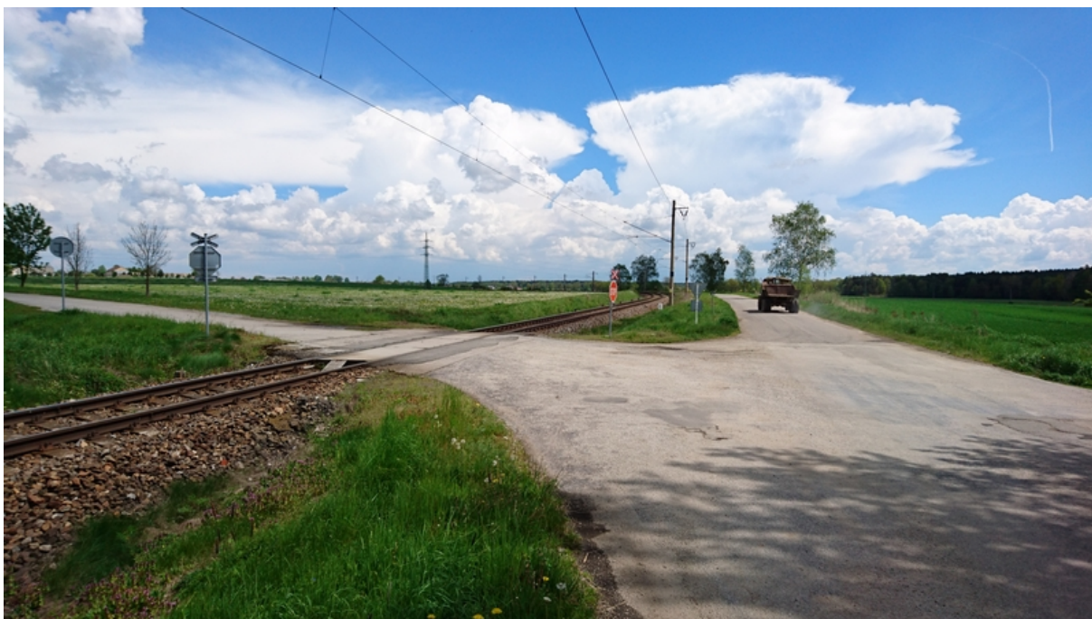
(nechráněný přejezd v km 5,958)