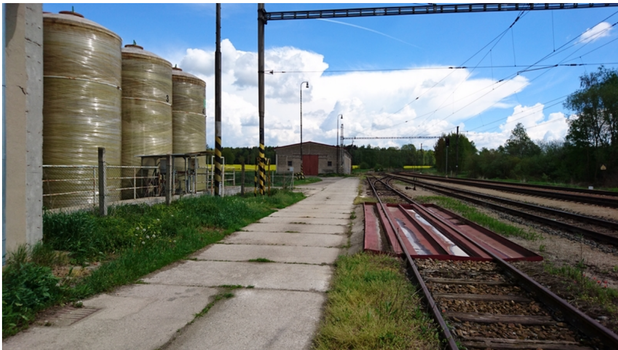
(vykládkové místo v manipulační koleji č. 5)