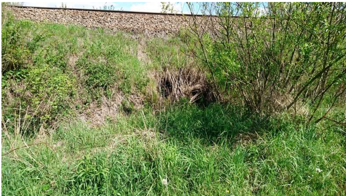
(zarostlý trubní propustek v km 2,765)