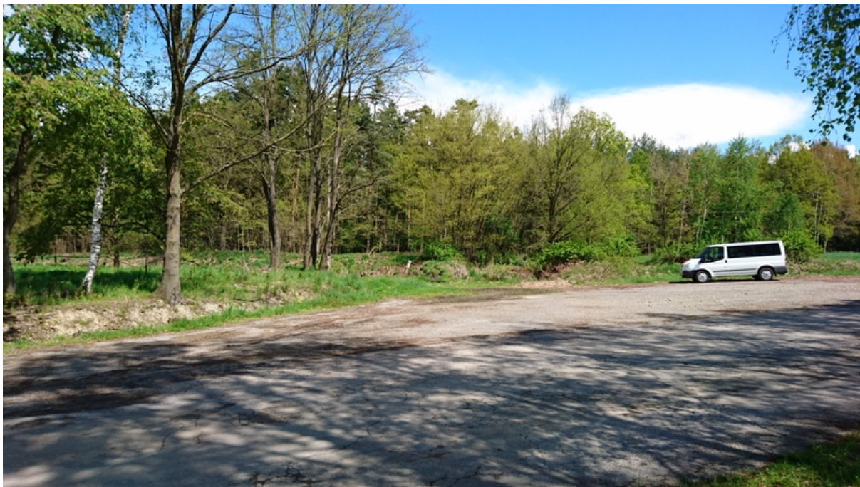
(místo budoucího nadjezdu v km 4,75 – kolmo k ose trati)