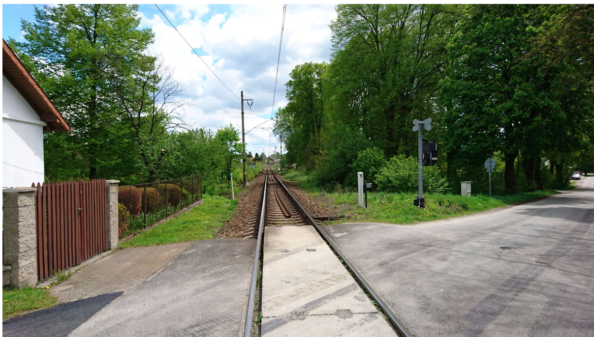
(pohled od přejezdu v km 12,659 po směru staničení)