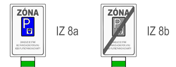
DETAIL DZ IZ 8a A IZ 8b