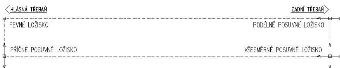
Obrázek 2 - Ložiska

Specifikace ložisek – návrhové parametry jsou součástí statického výpočtu.