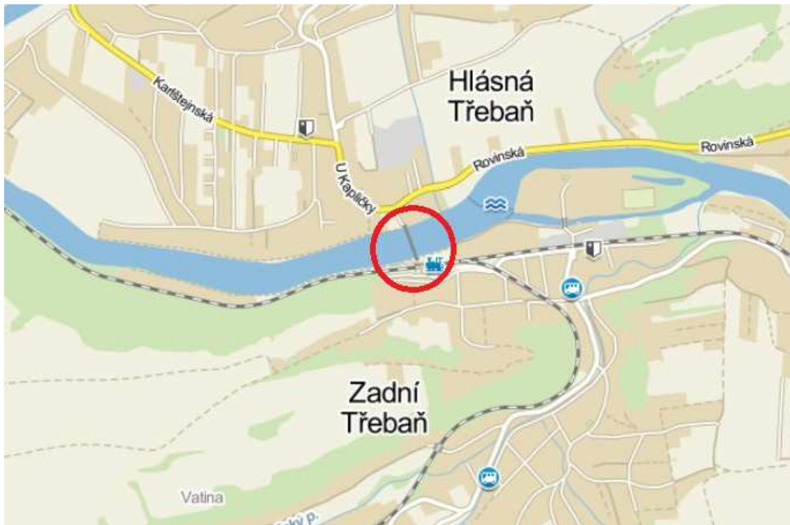
Obrázek 1 - Umístění lávky na mapě