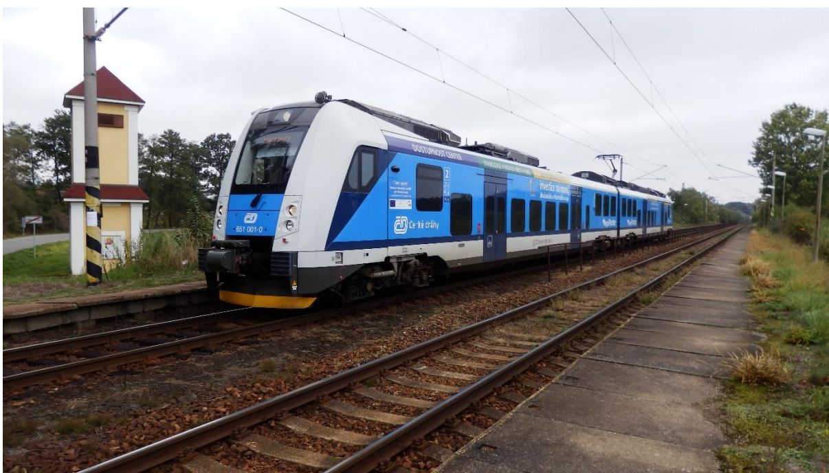
Obrázek 4 - Osobní vlak v zastávce Záblatičko