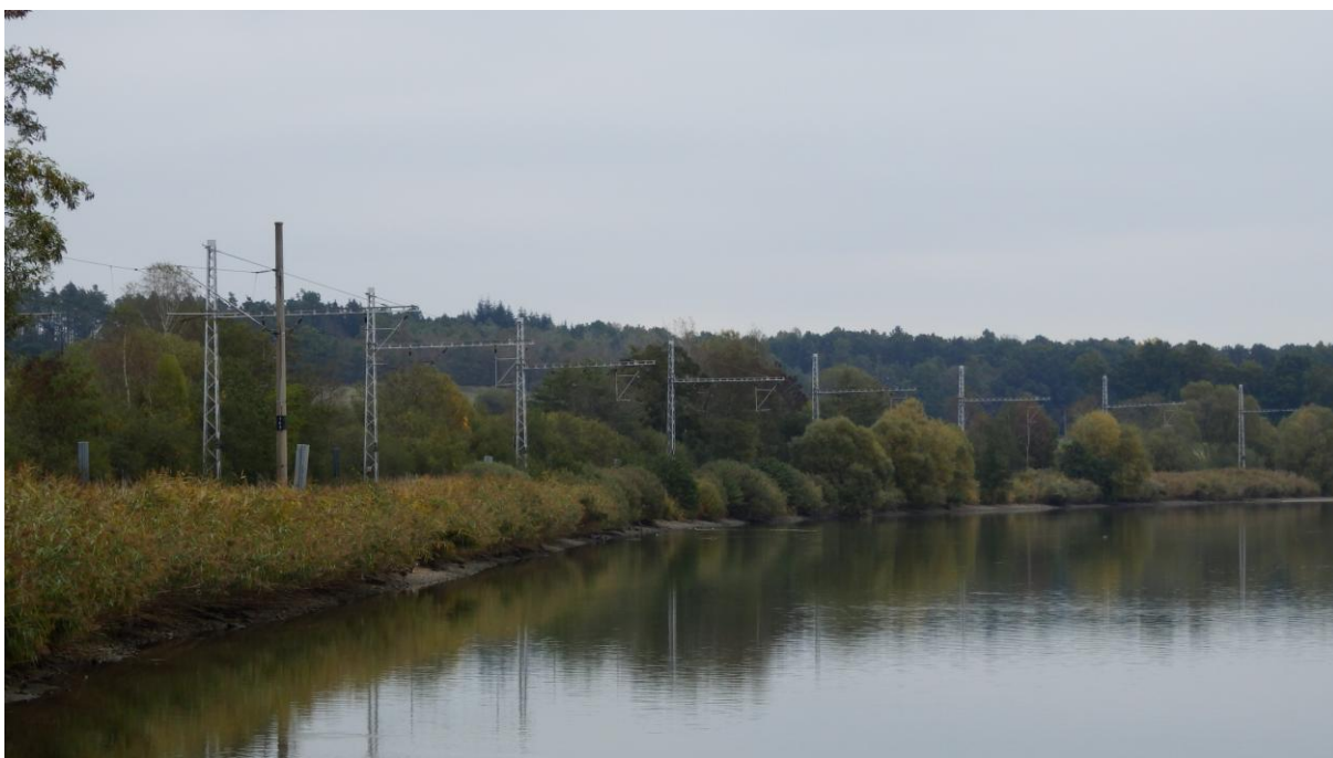
Obrázek 10 - Železniční trať č. 190 vedoucí po břehu Strpského rybníka