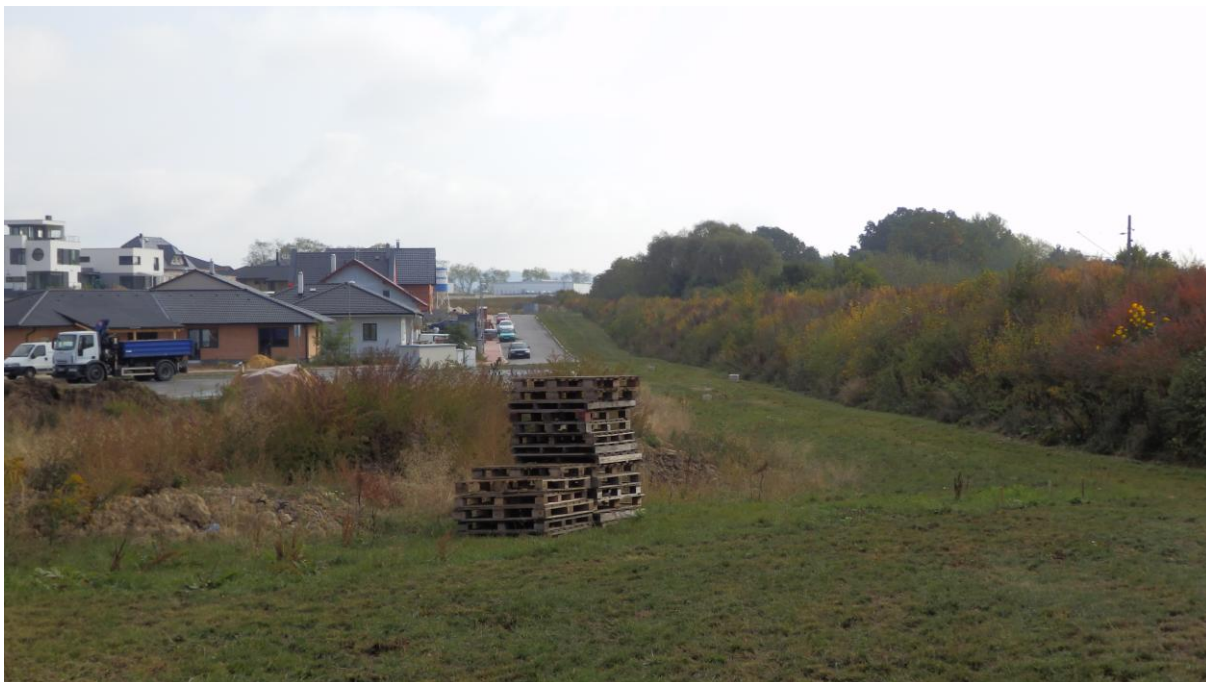
Obrázek 7 - Nová zástavba bránící zvýšení traťové rychlosti před žst. Zliv