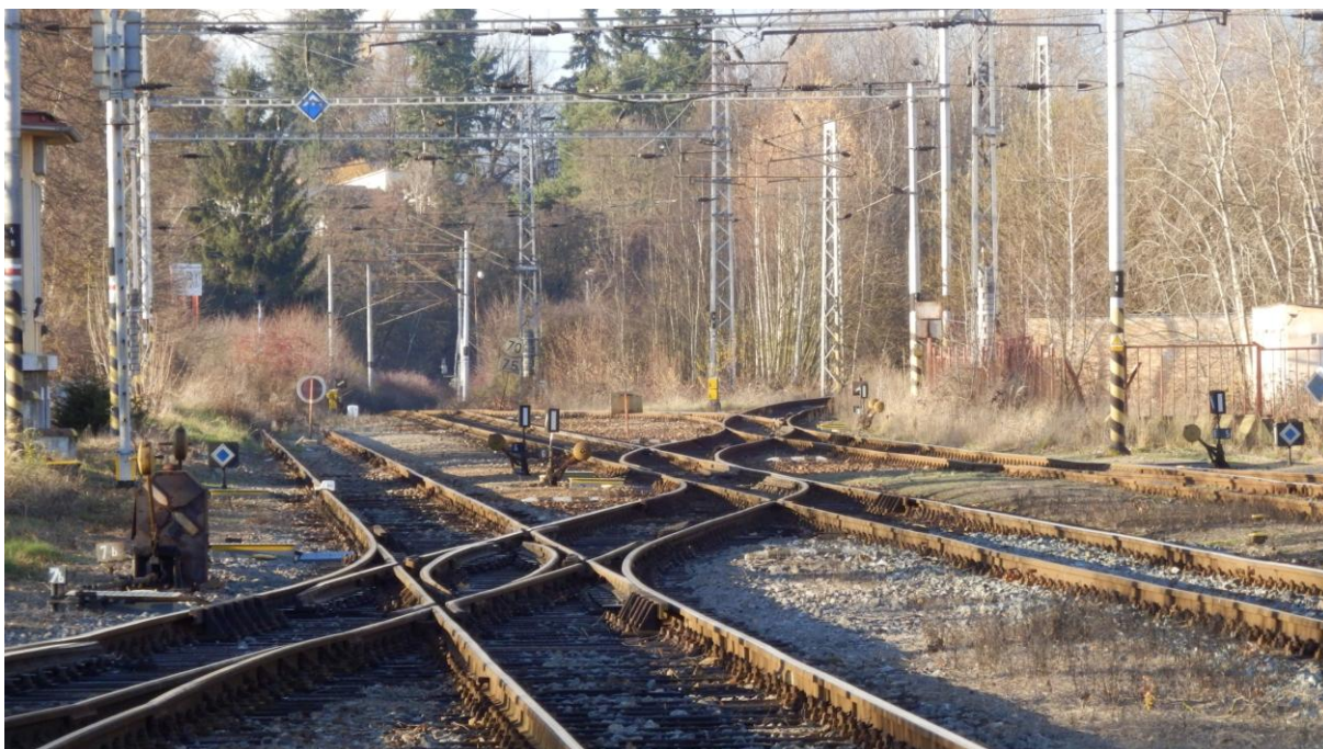
Obrázek 18 - Pohled na čížovské zhlaví v žst. Písek Rovně vede trať č. 200 směrem do Zdic, vpravo trať č. 201 směrem do Tábora