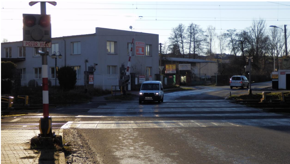
Obrázek 19 - Železniční přejezd v žst. Písek přes 6 kolejí