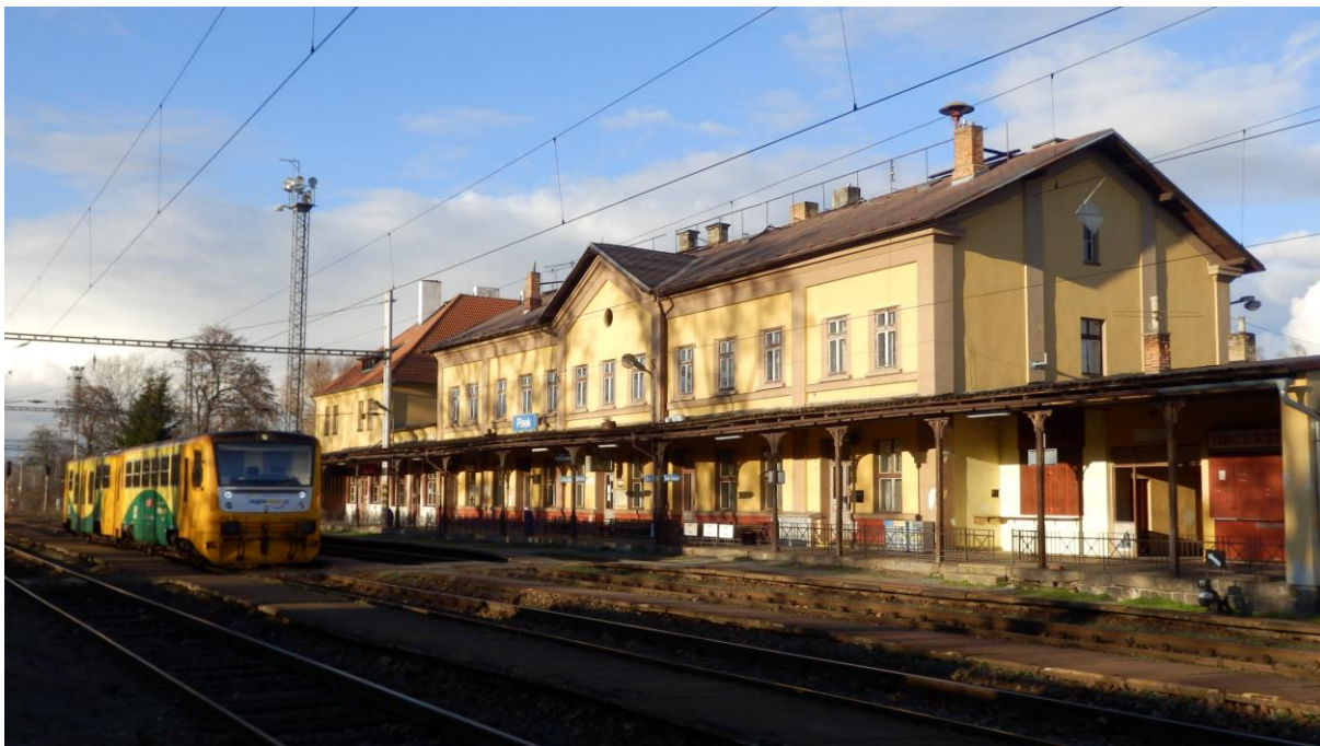
Obrázek 21 - Výpravní budova žst. Písek