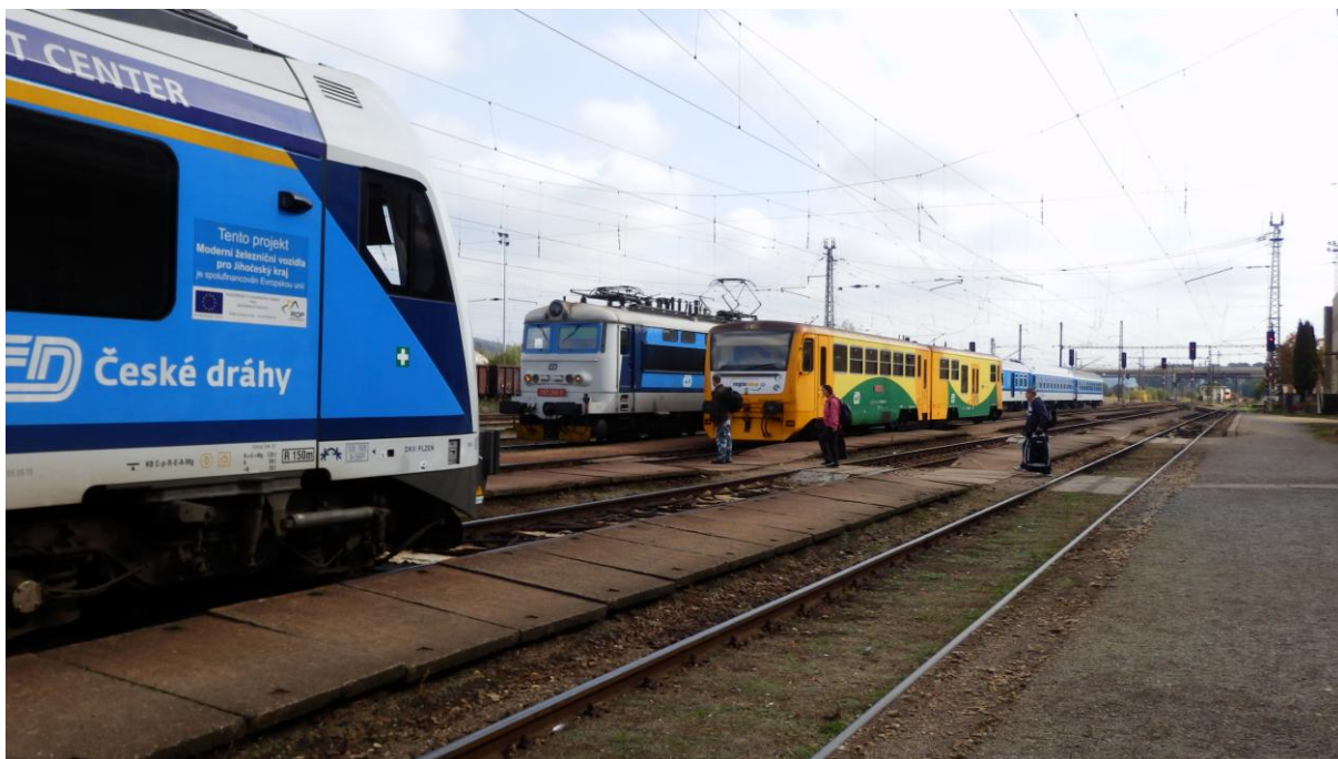
Obrázek 1 - Křižování vlaků v žst. Protivín