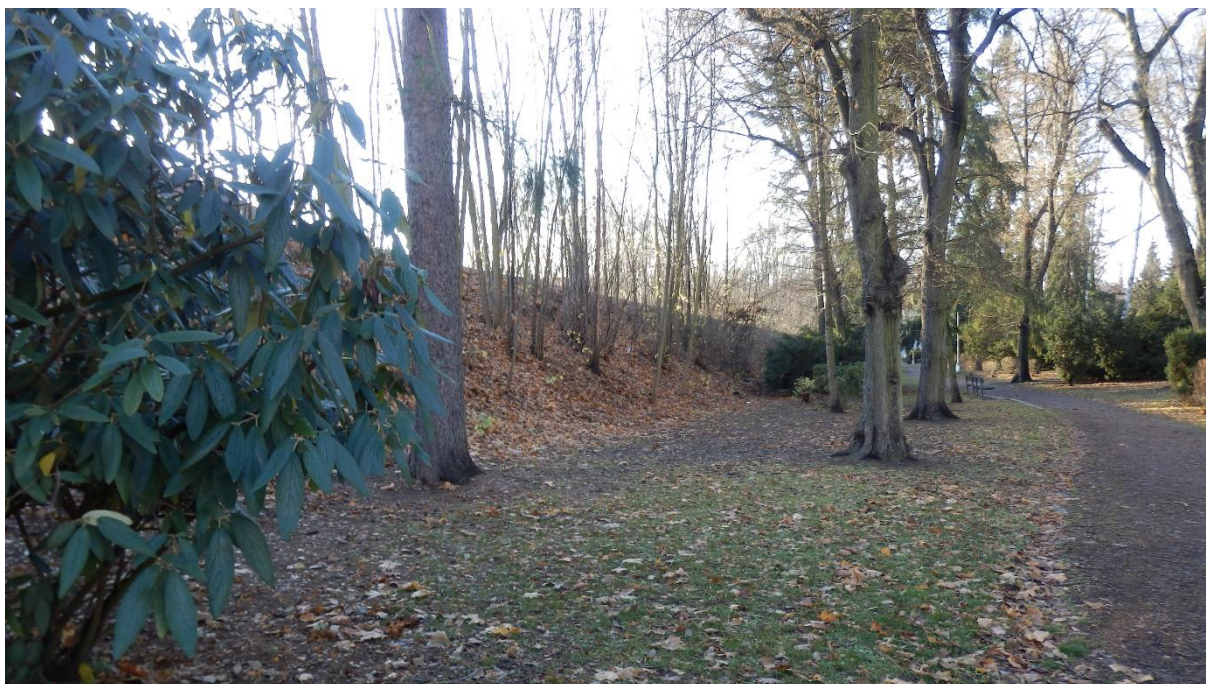
Obrázek 17 - Prostor pro novou zastávku Písek střed Železniční trať vede na náspu