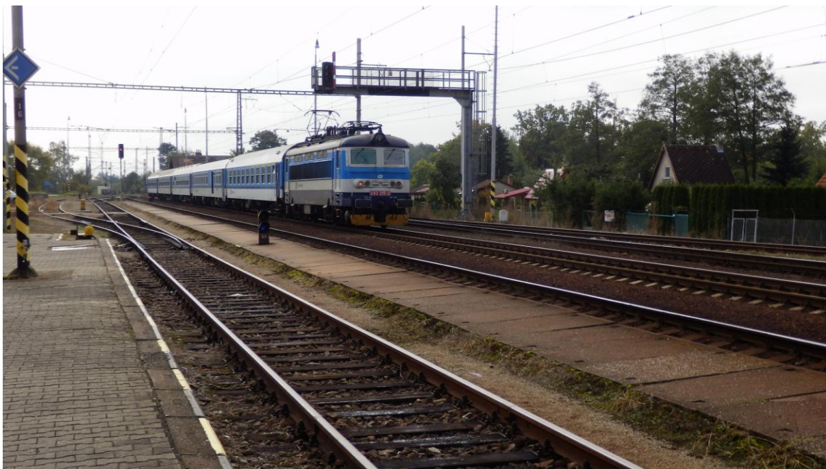
Obrázek 3 - Rychlík 624 Hejtman v žst. Zlív