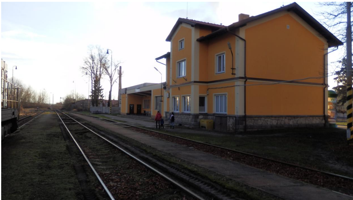
Obrázek 15 - Pohled na nástupiště v žst. Písek město