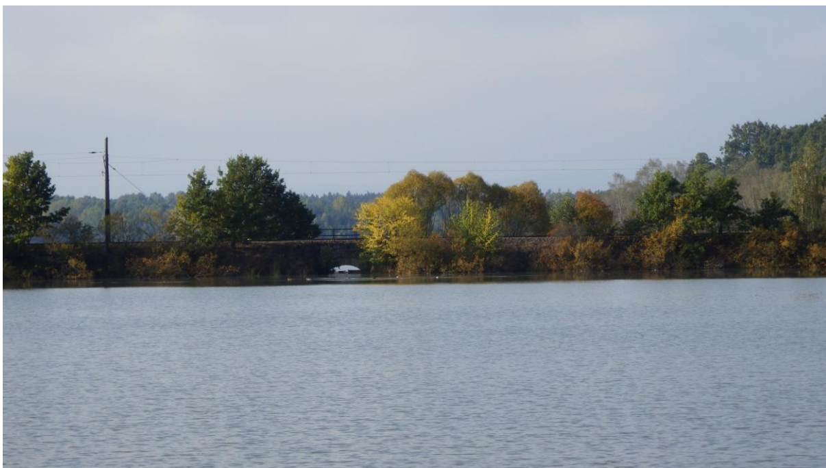
Obrázek 9 - Pohled na železniční trať č. 190 přes rybník Bezdrývka