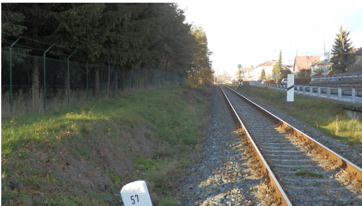
Obrázek 16 - Prostor pro novou zastávku Písek nemocnice (vlevo od koleje)