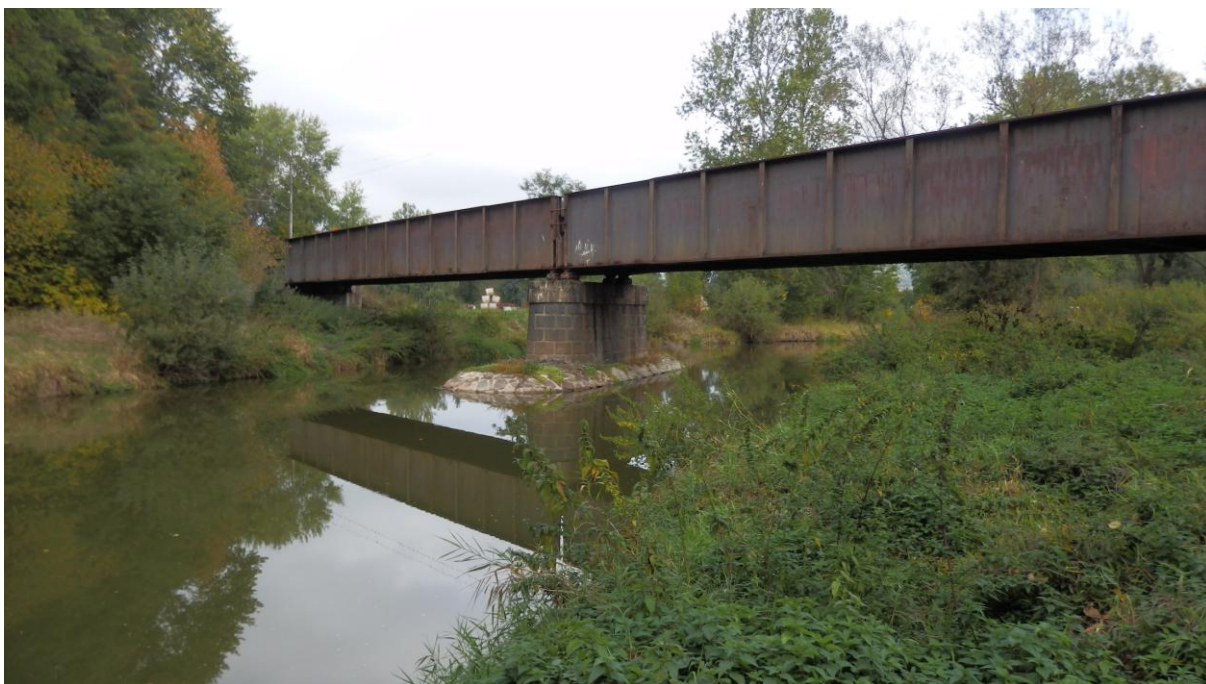
Obrázek 12 - Most přes Blanici v Protivíně