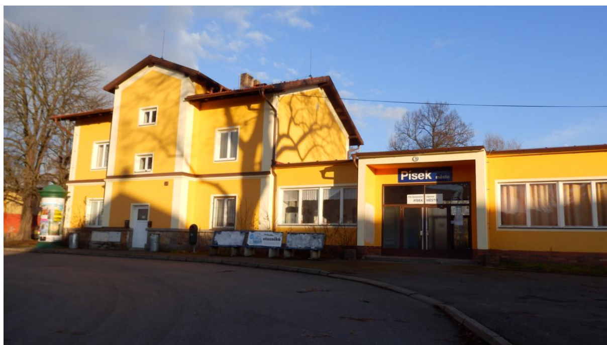
Obrázek 14 - Pohled na výpravní budovu žst. Písek město