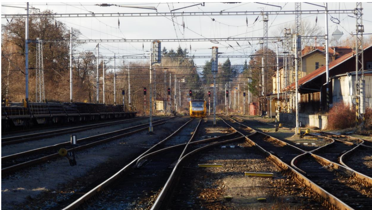
Obrázek 20 - Pohled na žst. Písek