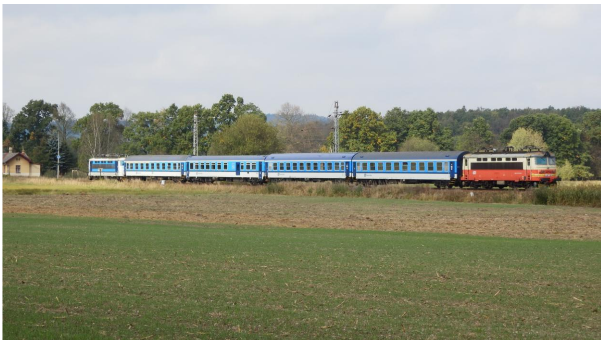
Obrázek 2 - Rychlík 668 Rožmberk ve výlukovém řazení v úseku Protivín – Putim