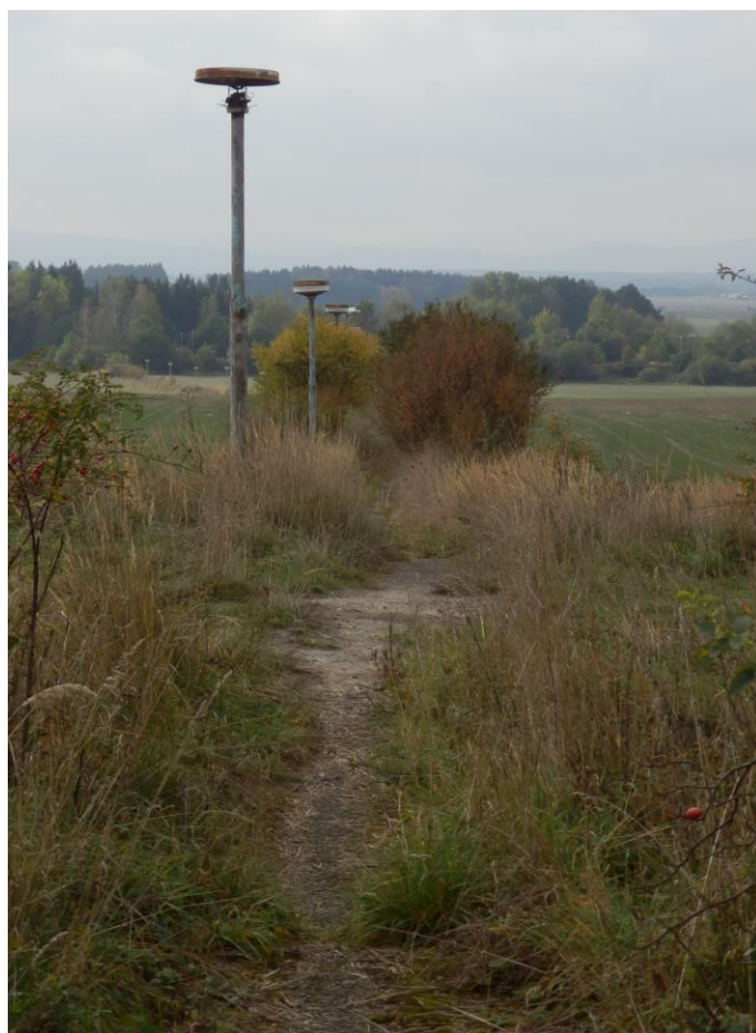
Obrázek 8 – Zanedbaná přístupová cesta k zastávce Zbudov