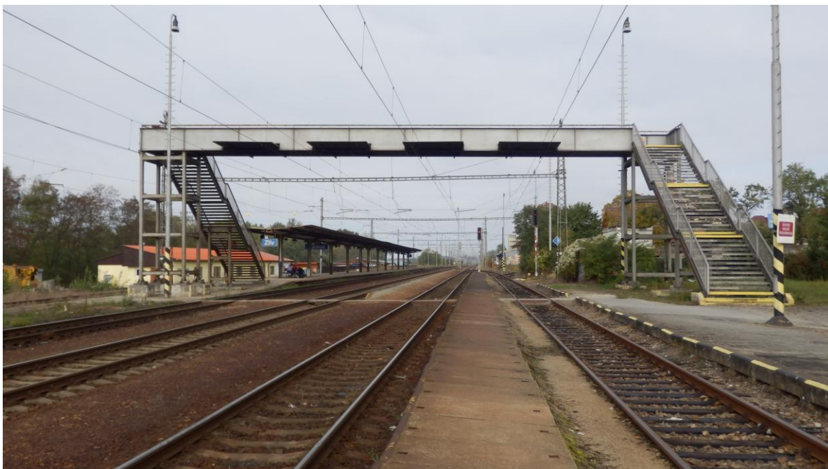
Obrázek 5 - Téměř nevyužívaný nadchod na ostrovní nástupiště v žst. Zliv