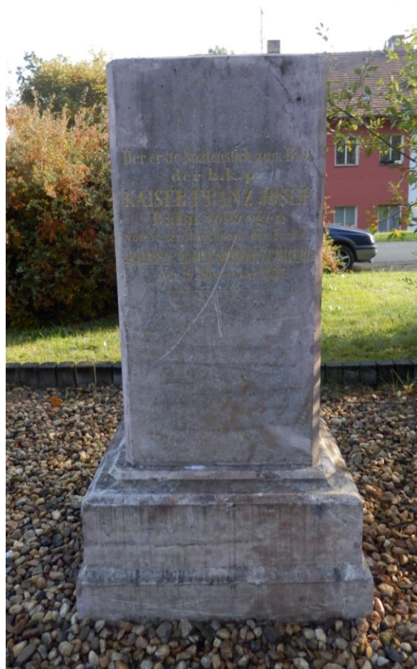
Obrázek 22 - Památník zahájení výstavby železniční trati ČB – Plzeň