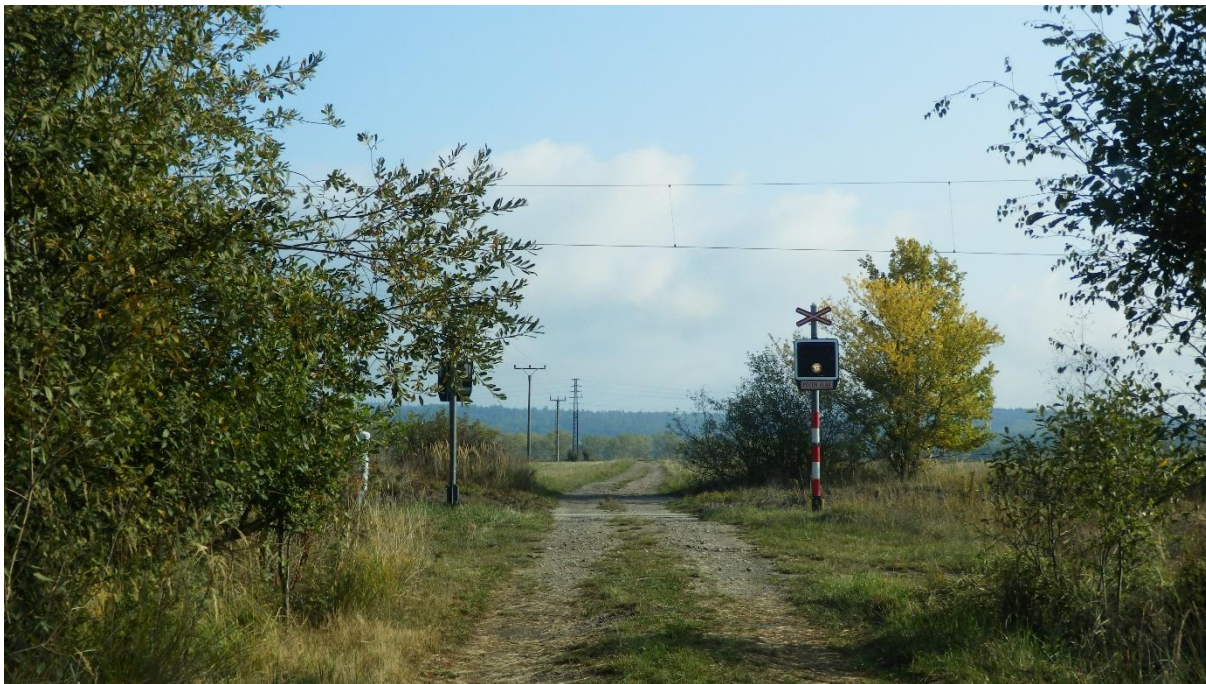
Obrázek 11 – Železniční přejezd na polní cestě nedaleko obce Zliv