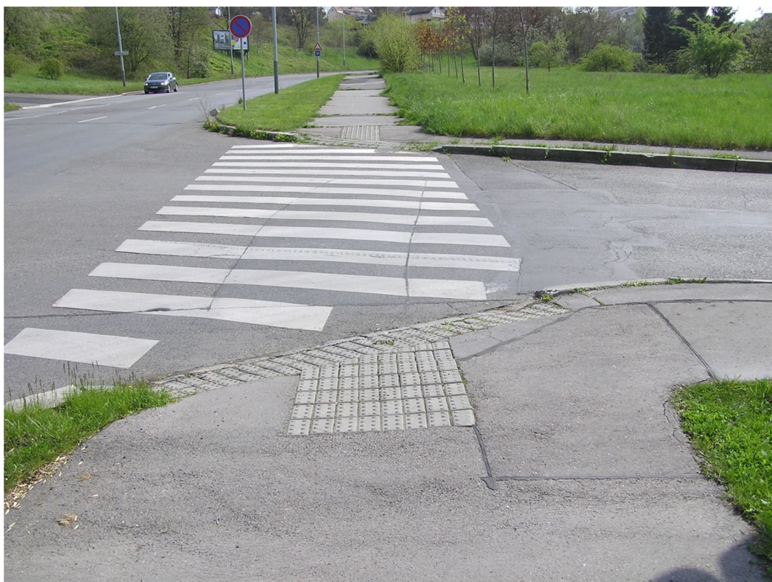
Obrázek 6 Pohled na přechod přes ulici Písková od severu