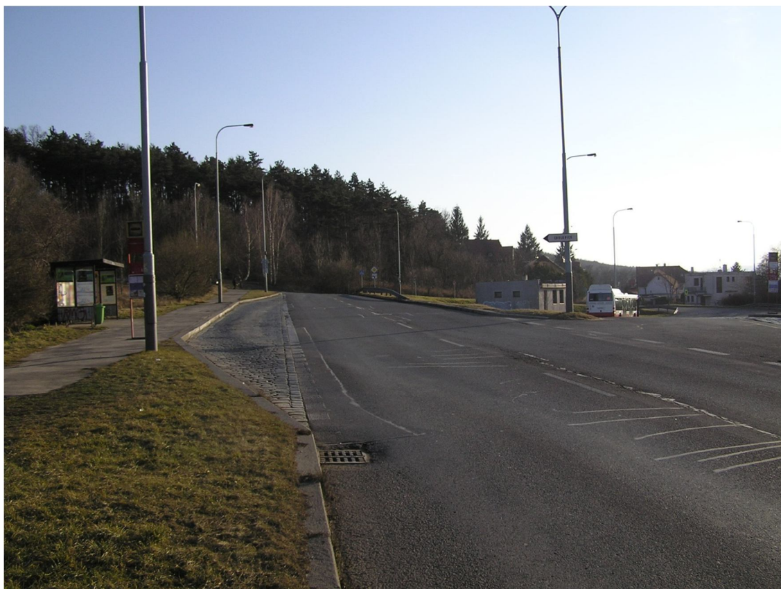
Obrázek 40 Vlevo zastávka Na Beránku, vpravo stejnojmenné autobusové obratiště