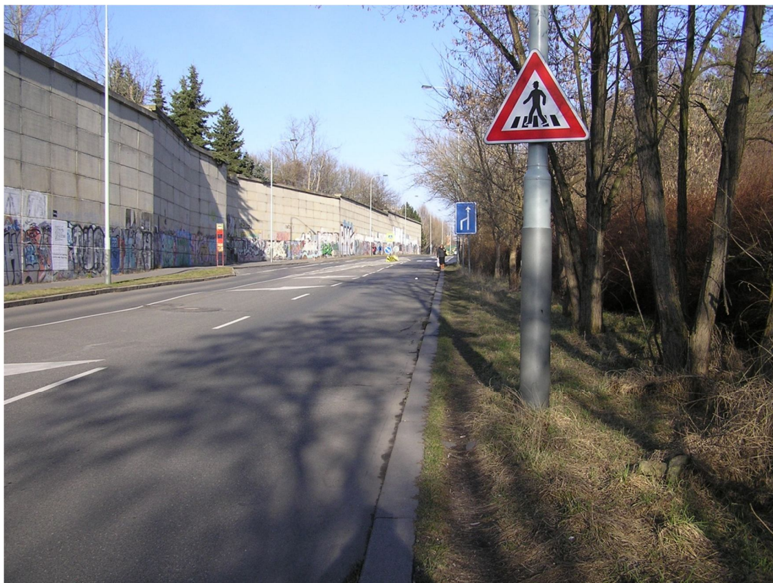
Obrázek 25 Místo, kudy v současnosti chodí chodci