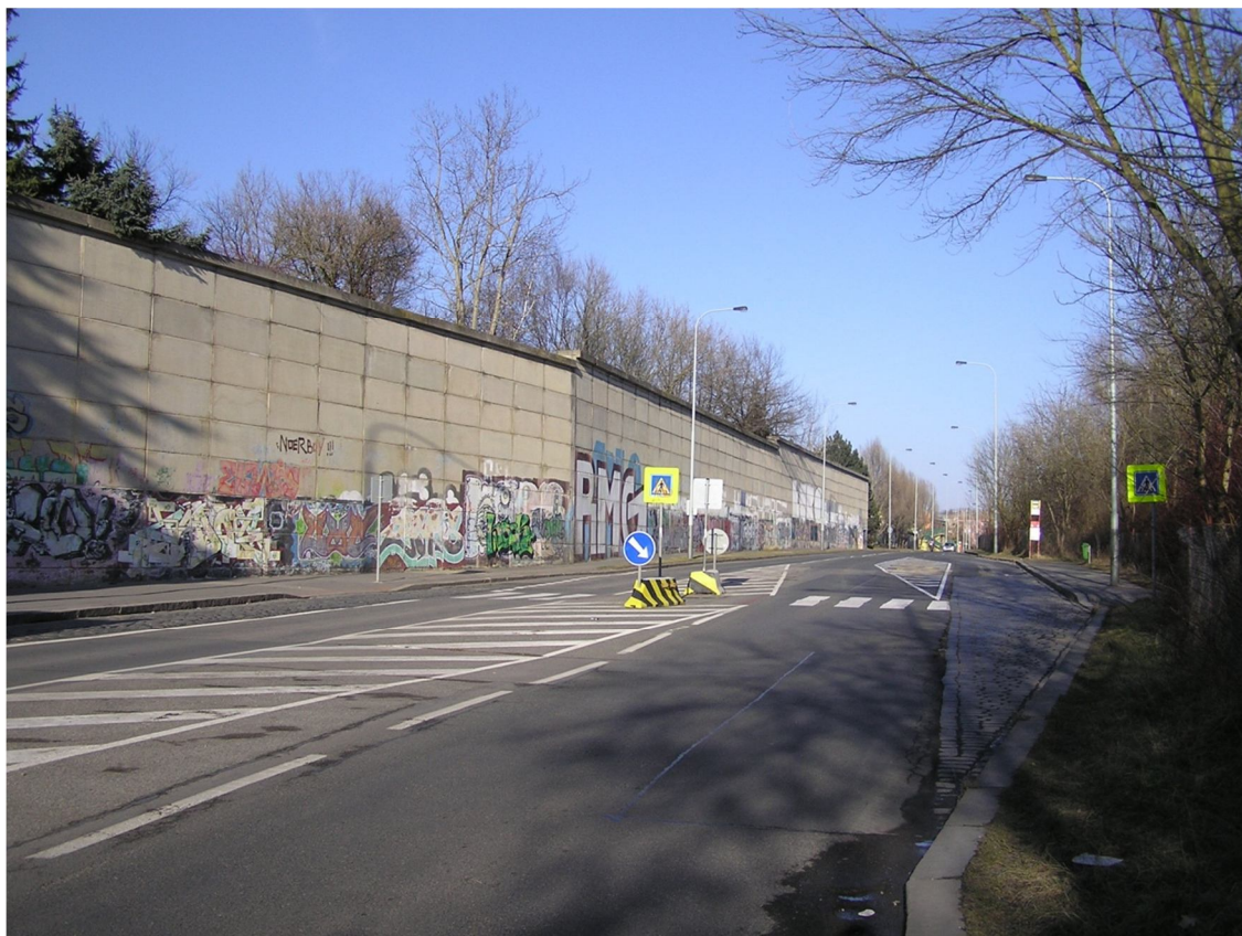
Obrázek 27 Pohled na autobusovou zastávku Petržilova