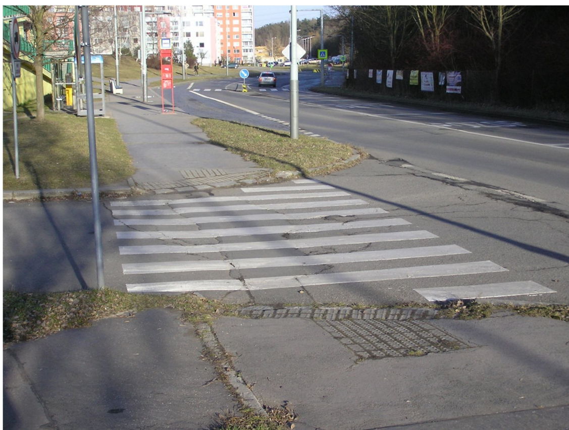
Obrázek 32 Výjezd z parkoviště