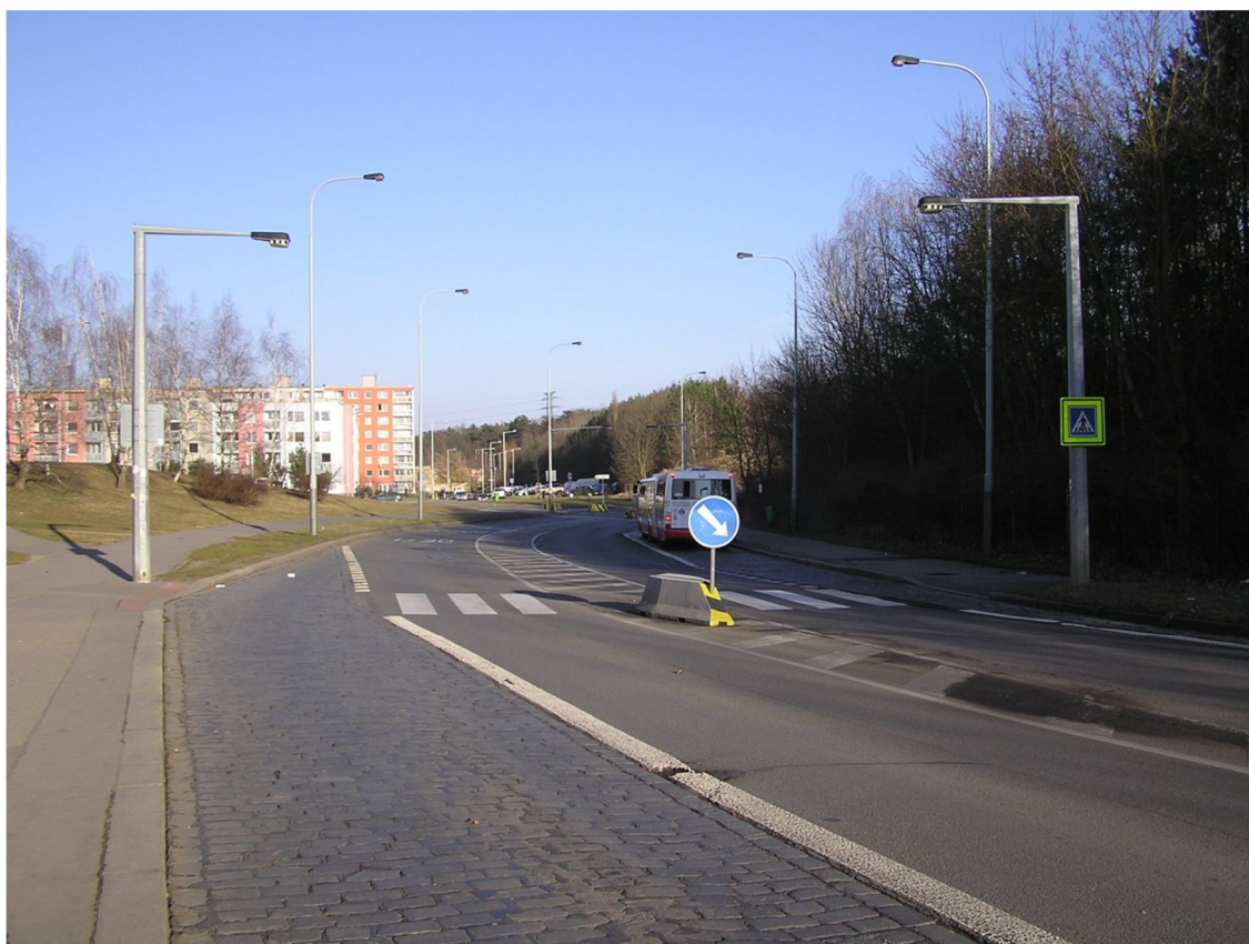
Obrázek 33 Přejchod u zastávky Pavelkova