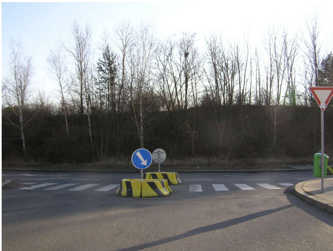
Obrázek 35 Pohled do křižovatky z ulice Pavelkova