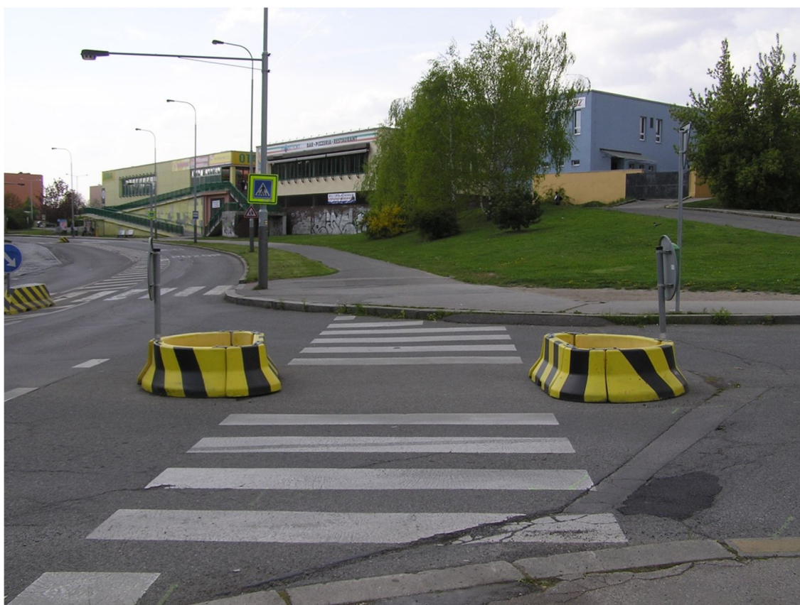
Obrázek 36 Přečhod přes ulici Pavelkova