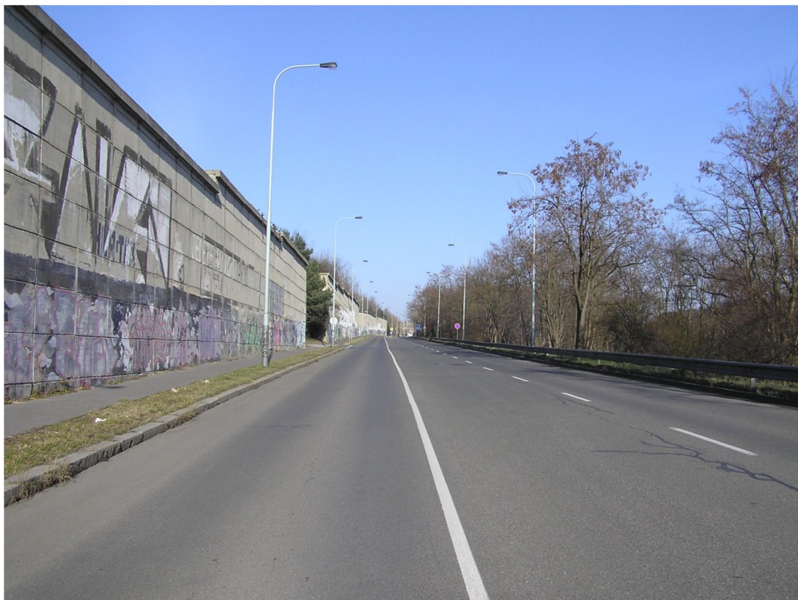
Obrázek 21 Pohled na ulici Československého exilu směrem z centra