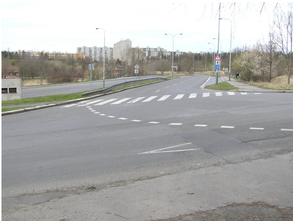
Obrázek 45 Pohled do ulice Československého exilu