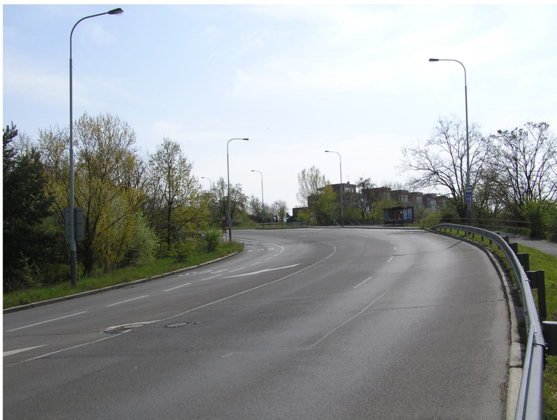
Obrázek 12 Pohled na autobusovou zastávku Platónova (směr z centra)