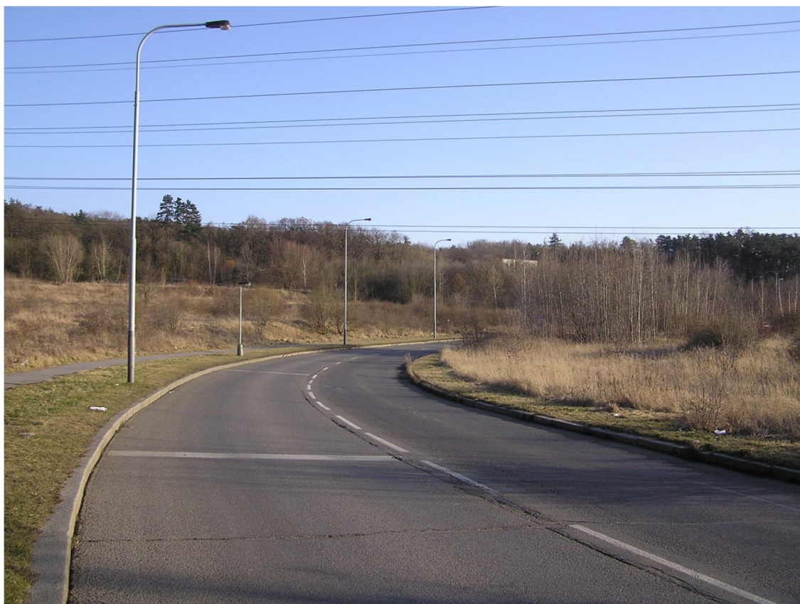
Obrázek 38 Pohled na ulici Československého exilu směrem z centra