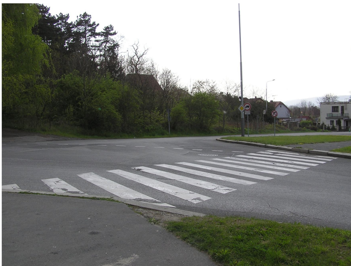
Obrázek 42 Přečhod přes ulici Československého exilu u křižovatky s Hornocholupickou