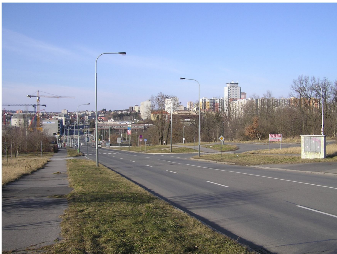
Obrázek 10 Pohled na křižovatku s ulicemi Písková a Na Hupech od jihu