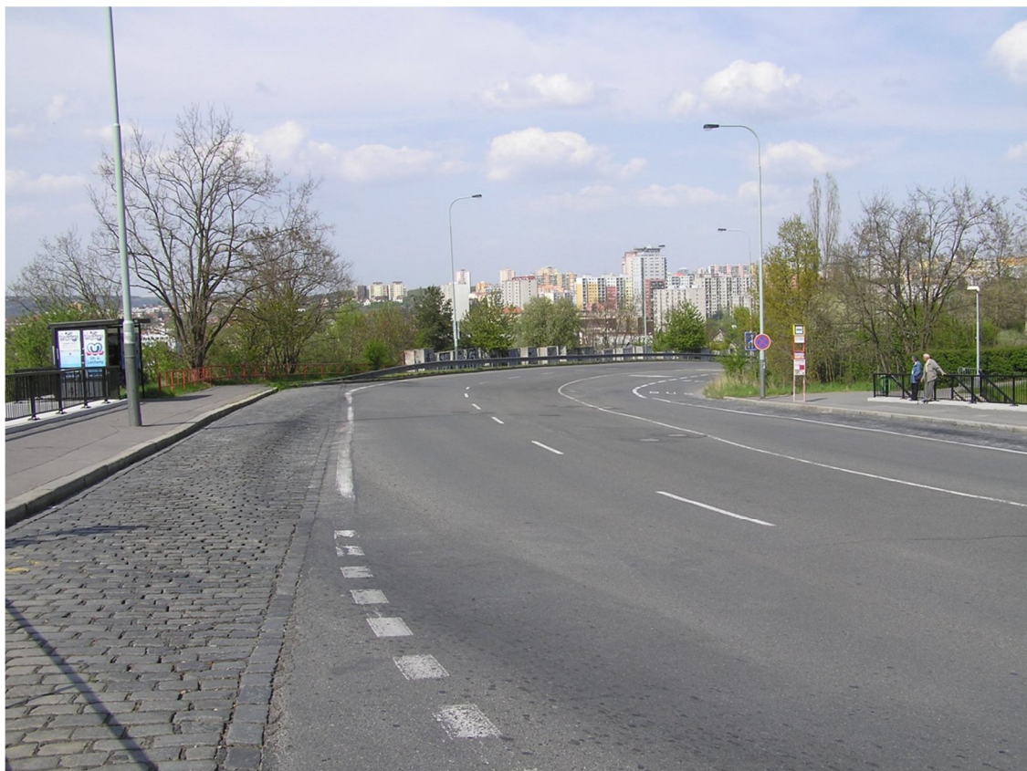
Obrázek 15 Pohled na autobusovou zastávku Platónova