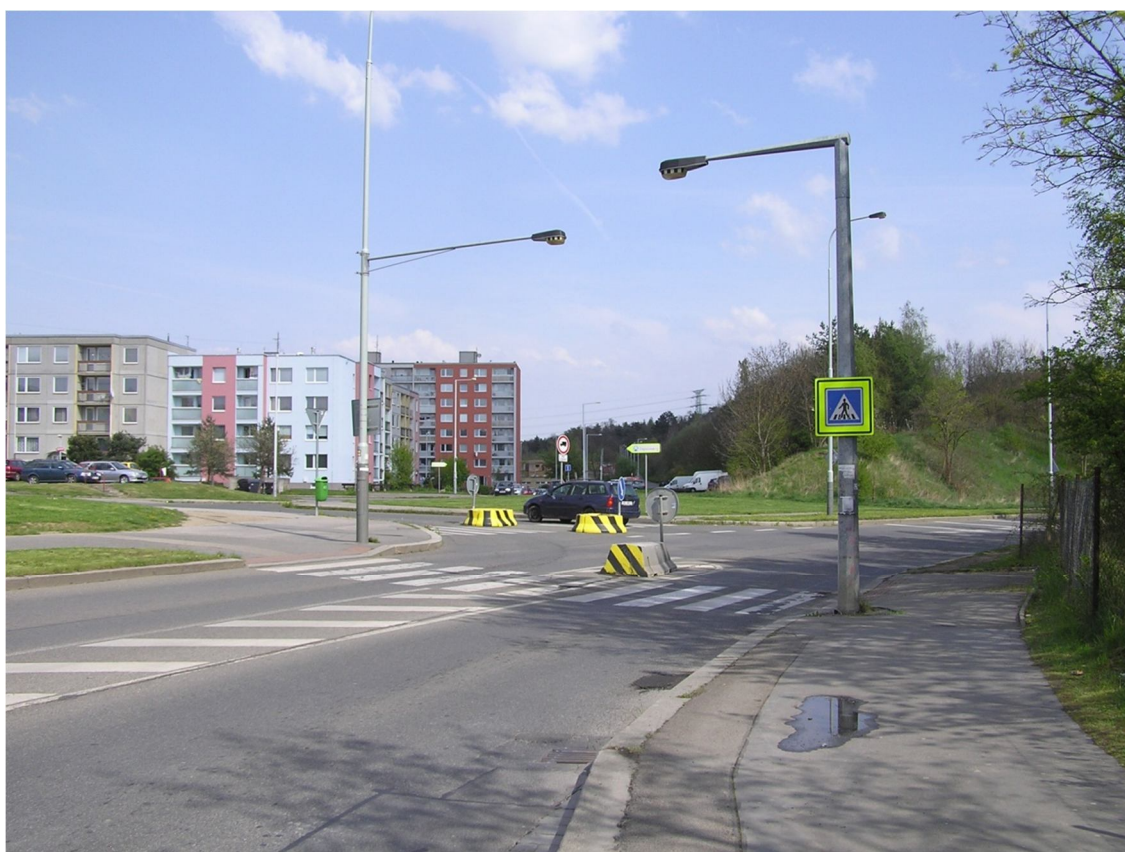
Obrázek 34 Přejchod u křižovatky s ulicí Pavelkova