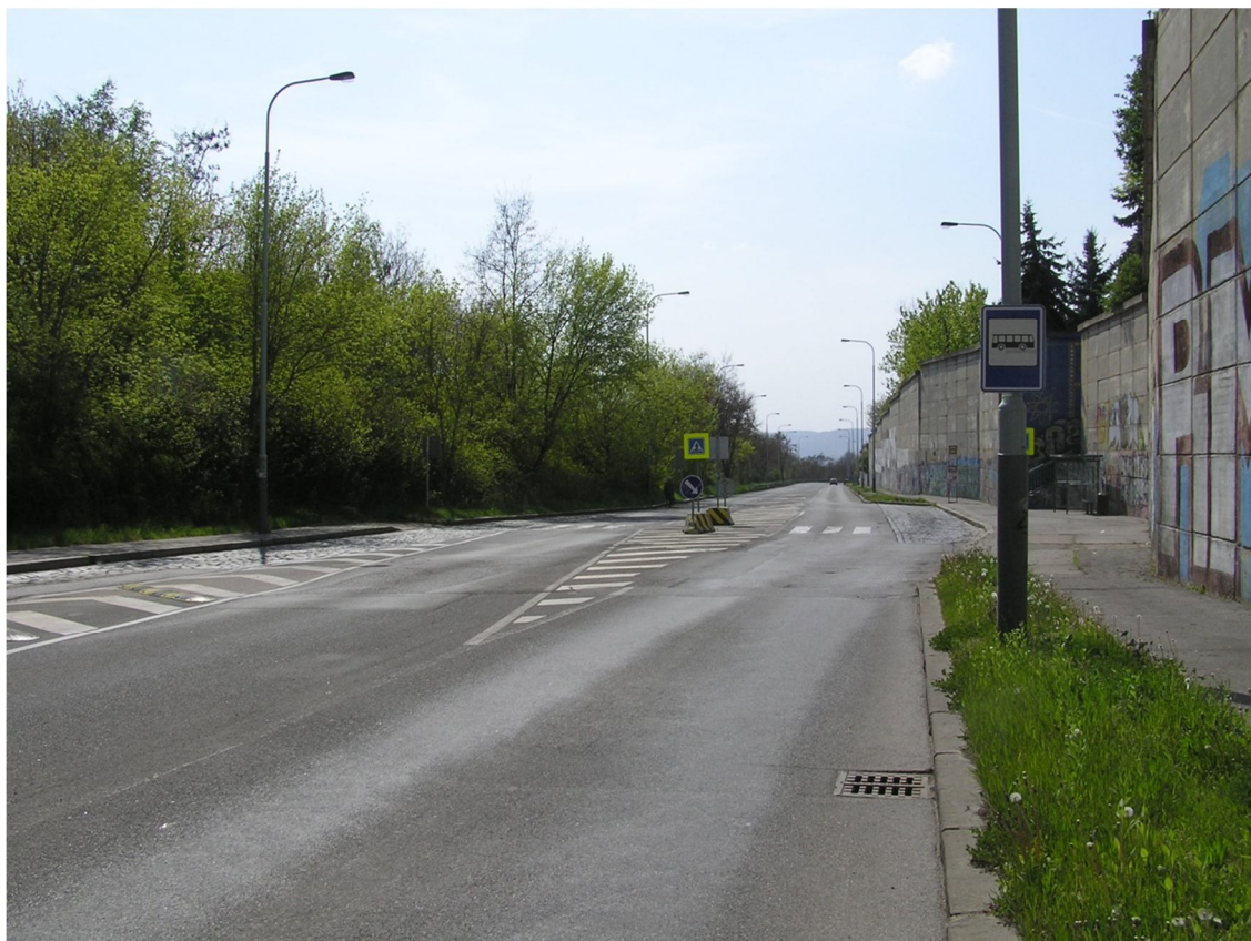
Obrázek 29 Pohled na autobusovou zastávku Petržilova