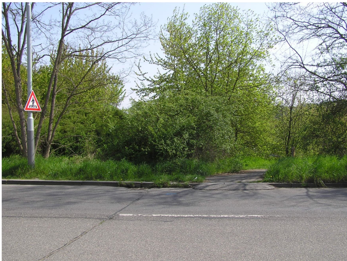
Obrázek 23 Vyústění chodníku od osady Na Beránku