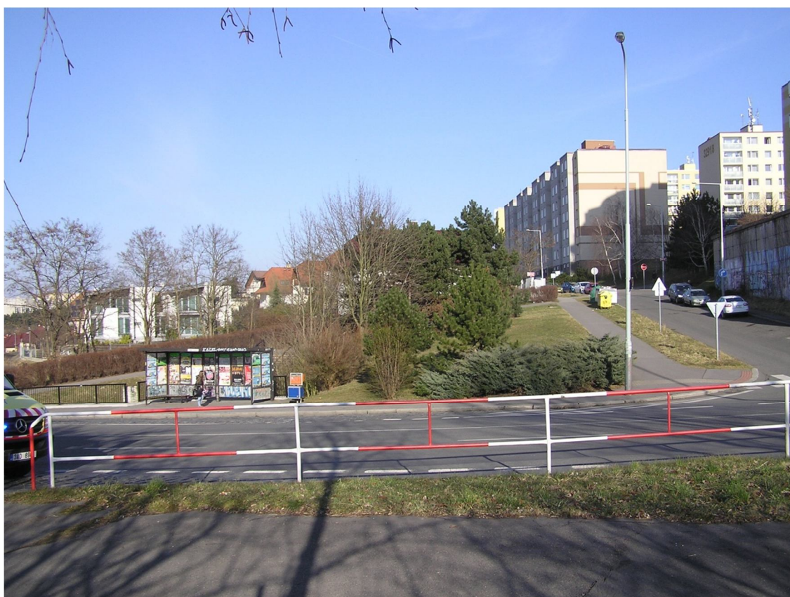
Obrázek 16 Pohled na místo navrhovaného přechodu