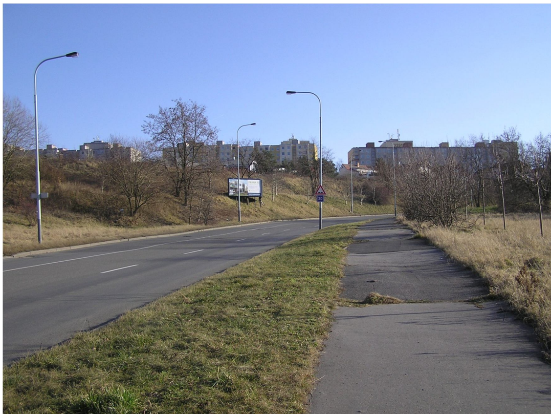
Obrázek 11 Pohled na ulici Československého exilu ve směru staničení