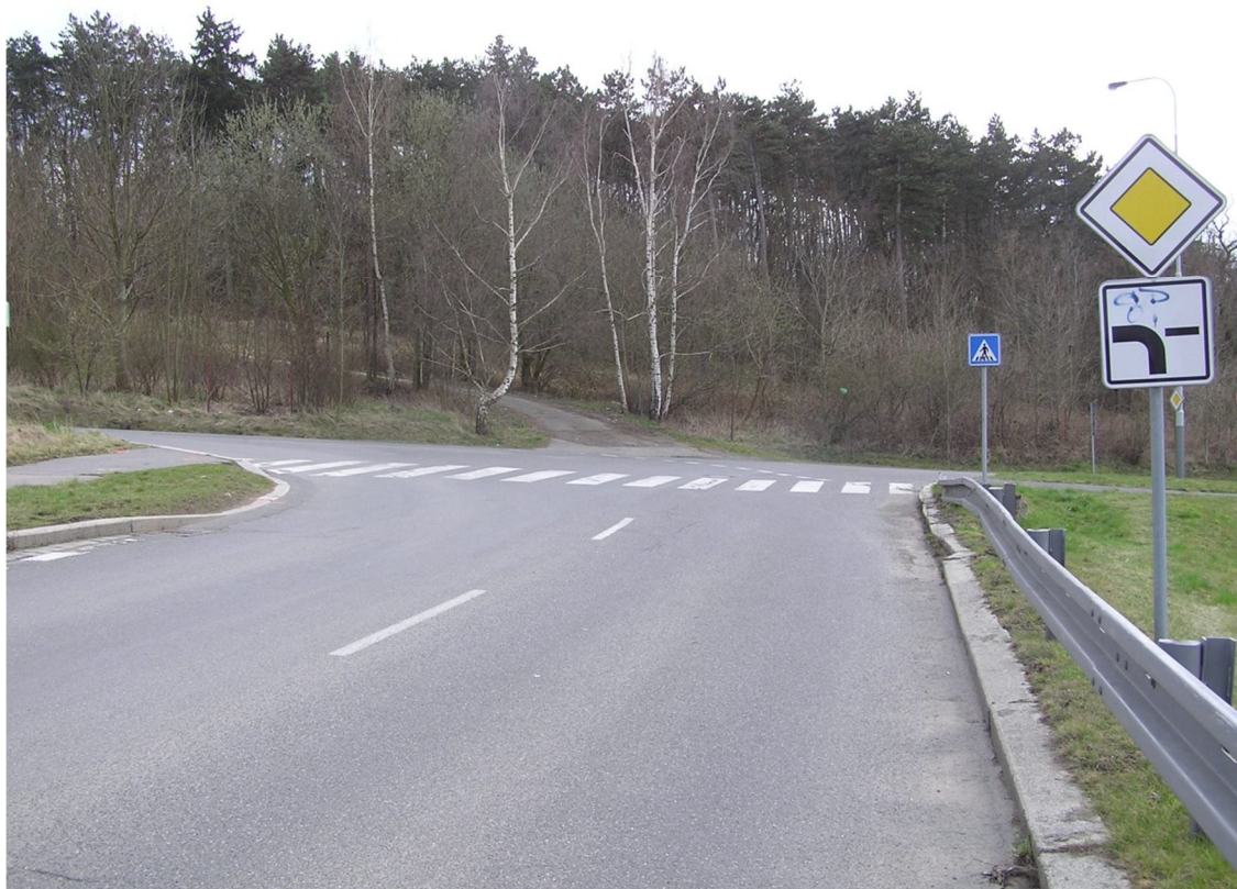
Obrázek 43 Pohled na křižovatku s ulicí Hornocholupická z ulice Československého exilu