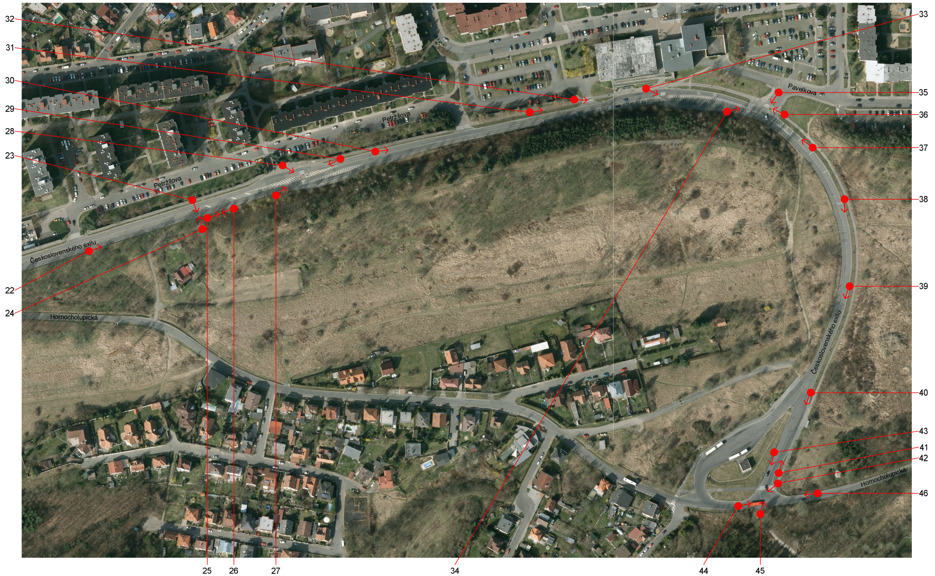
Ulice Československého exilu Orientační pomůcka ke snímkům č. 21 - 45