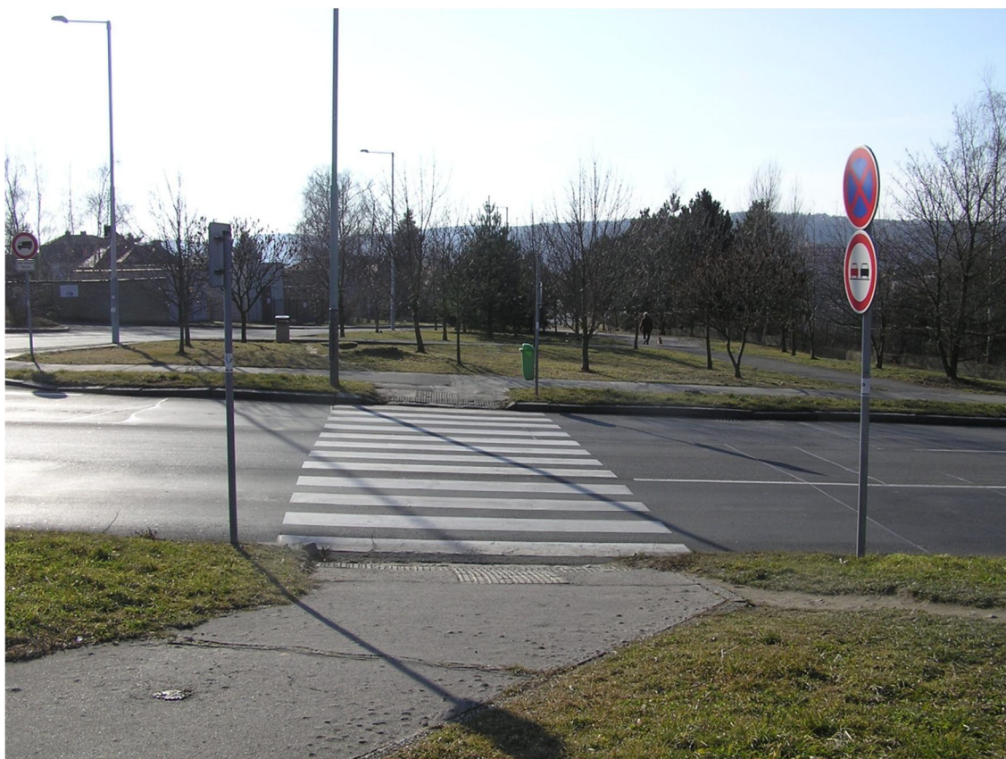
Obrázek 5 Tentýž přechod jako na obrázku 4 z druhé strany