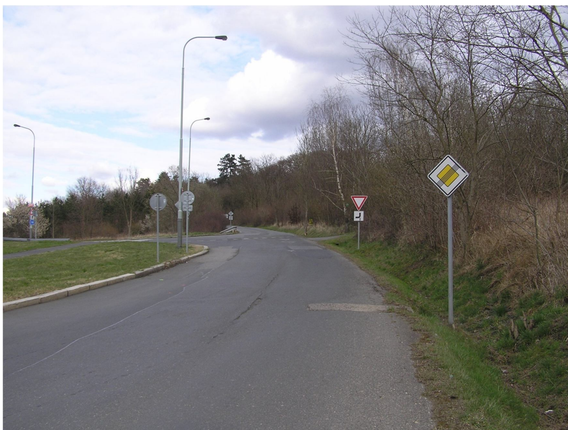
Obrázek 44 Pohled na křižovatku z ulice Hornocholupická směrem od Beránku