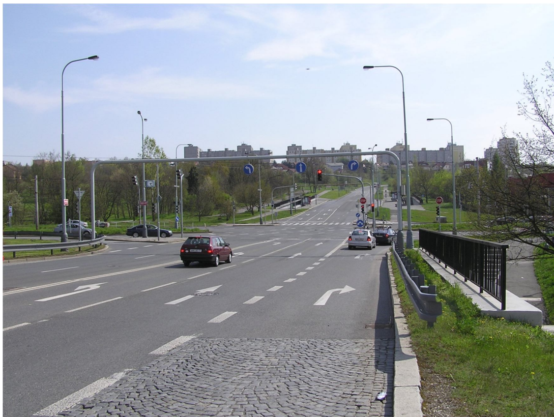
Obrázek 1 Pohled na křižovatku s ulicí Generála Šišky od severu