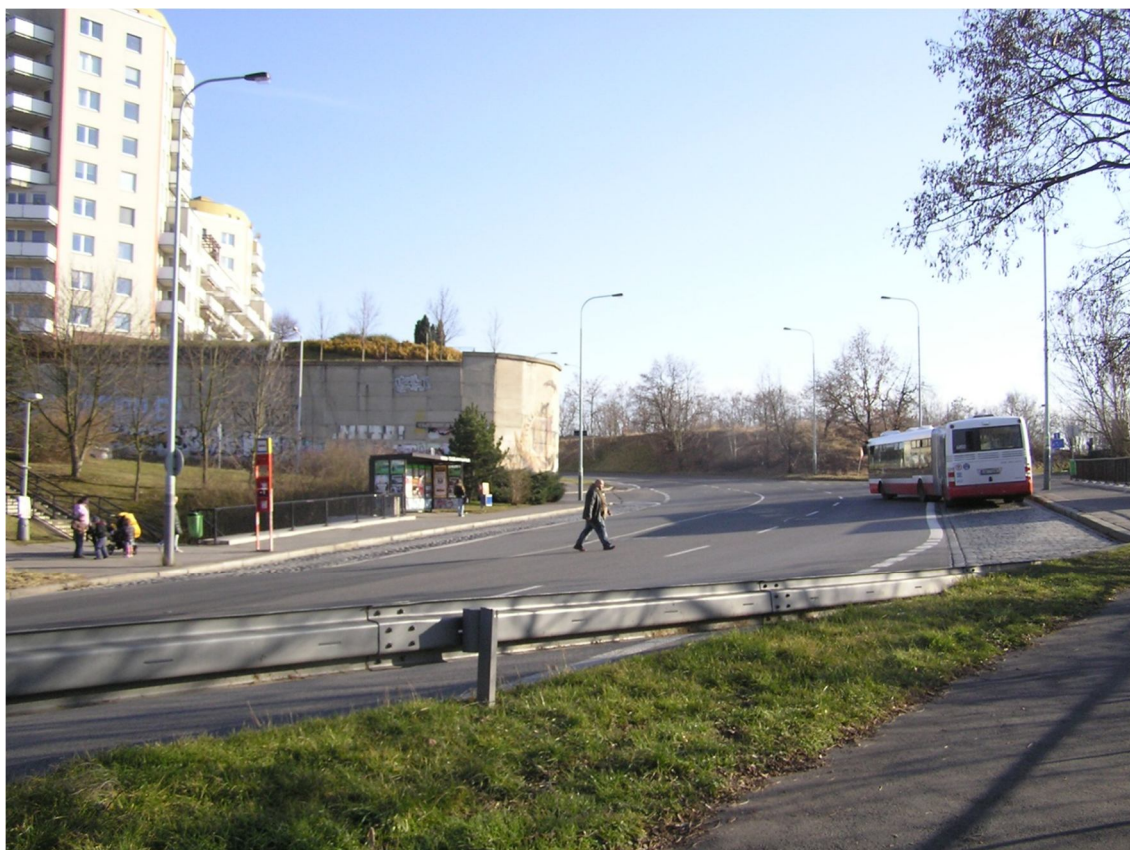
Obrázek 14 Pohled na autobusovou zastávku Platónova