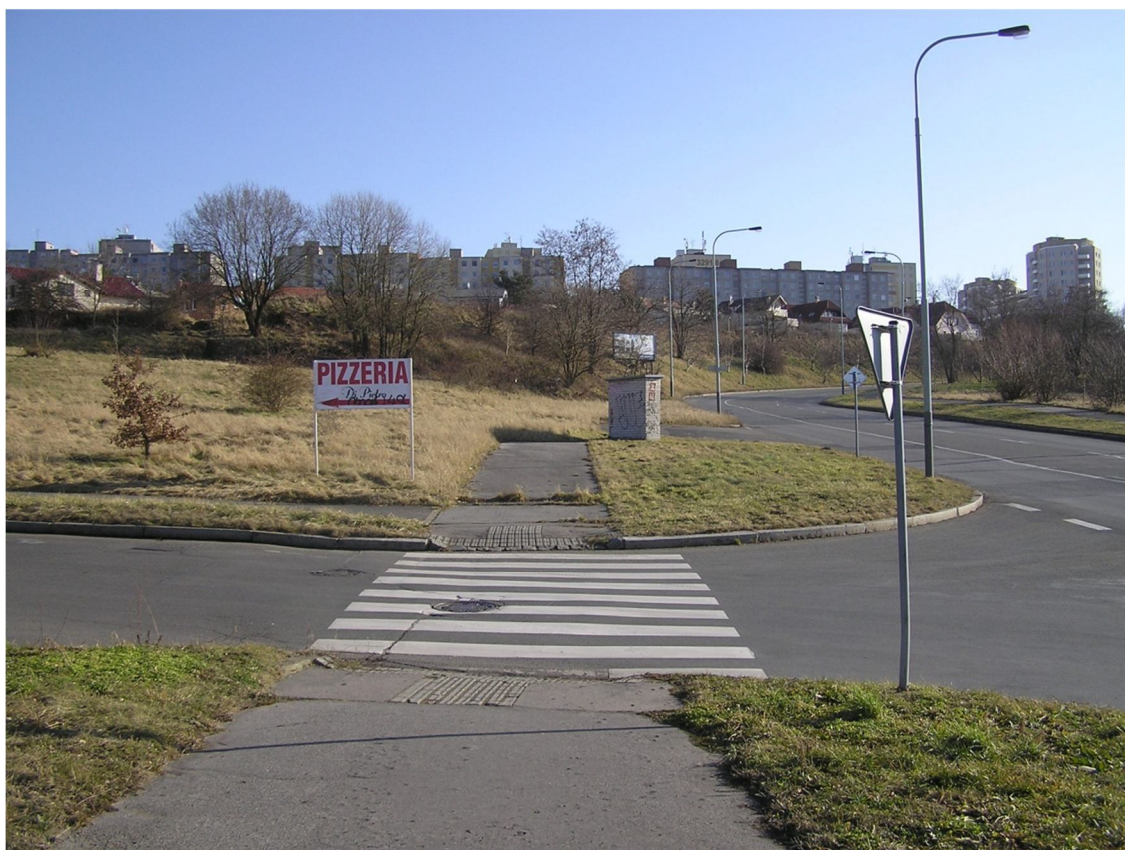
Obrázek 7 Pohled na přechod přes ulici Na Hupech od severu