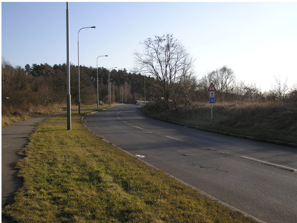
Obrázek 39 Pohled na ulici Československého exilu směrem z centra