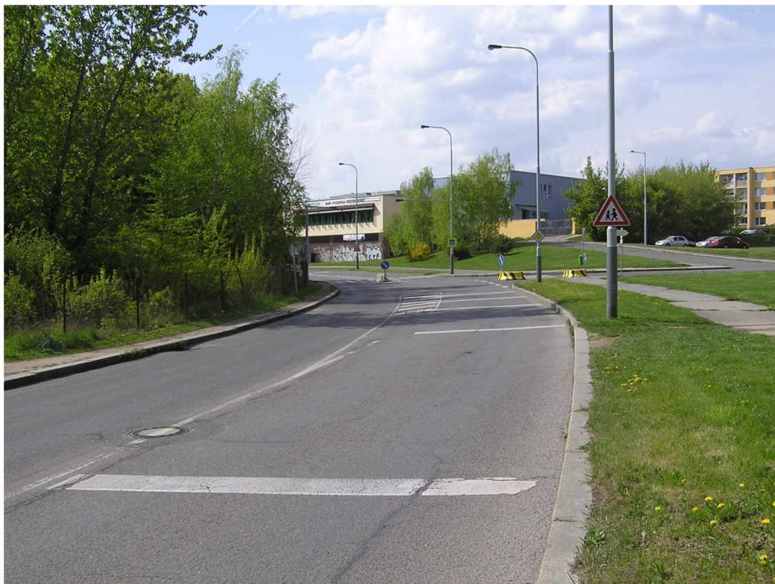
Obrázek 37 Optická psychologická brzda před křižovatkou s ulicí Pavelkova