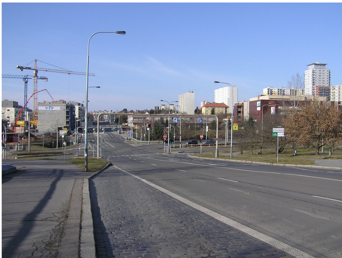
Obrázek 2 Pohled na křižovatku s ulicí Generála Šišky od jihu