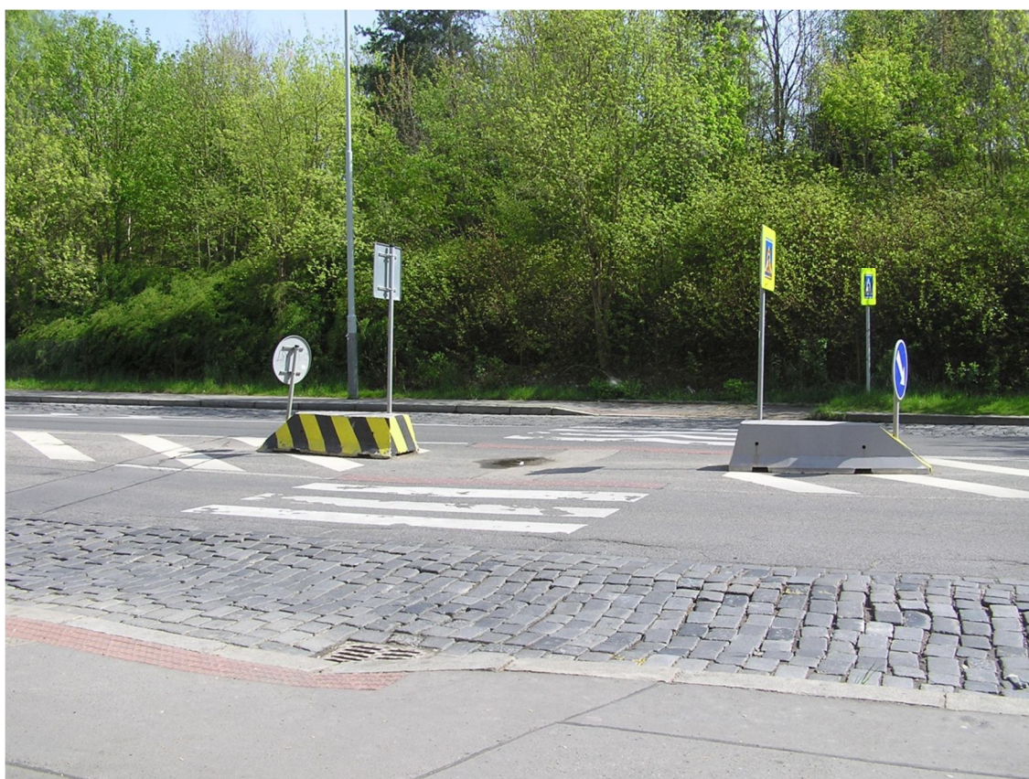
Obrázek 28 Přečhod u zastávky Petržilova