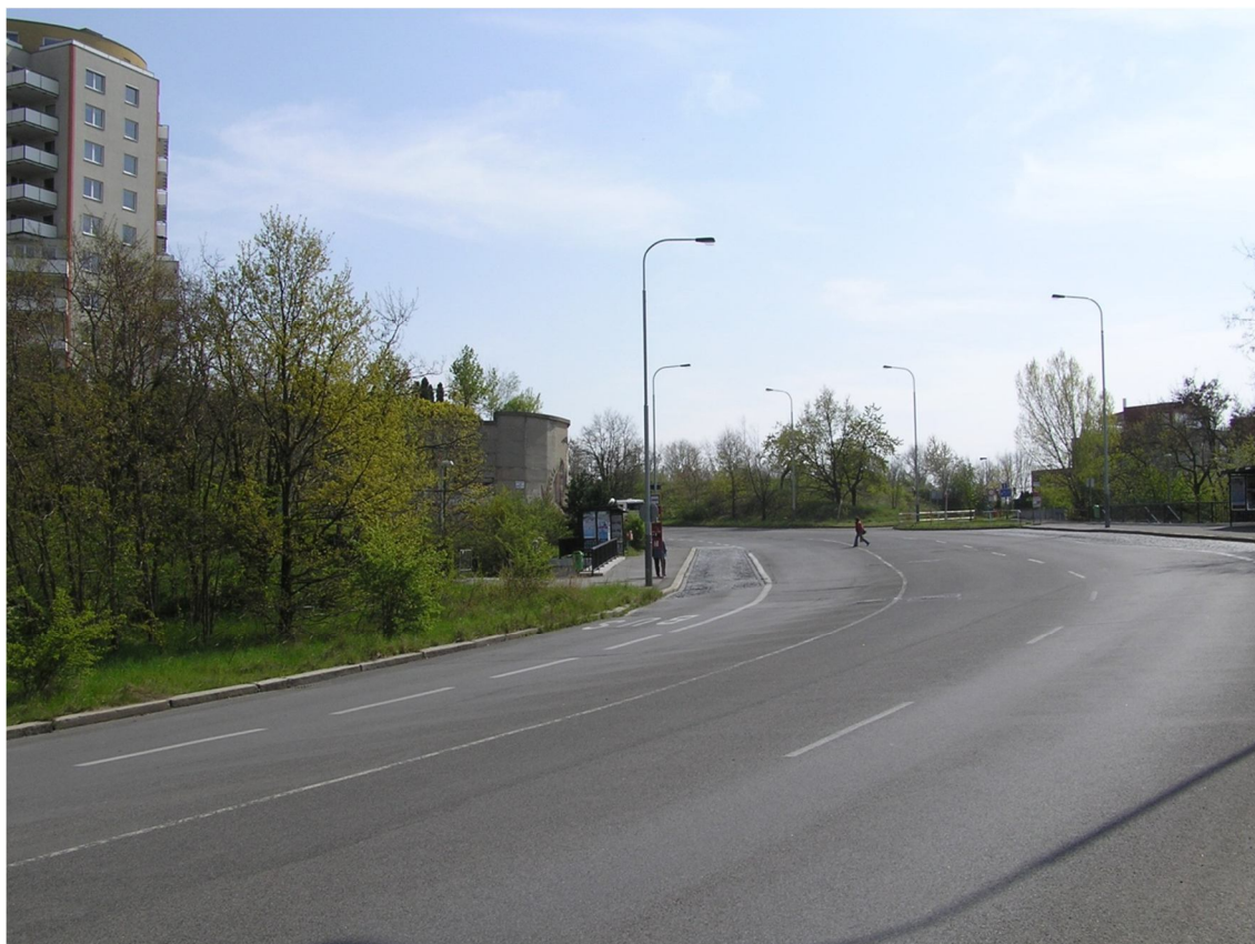
Obrázek 13 Pohled na autobusovou zastávku Platónova