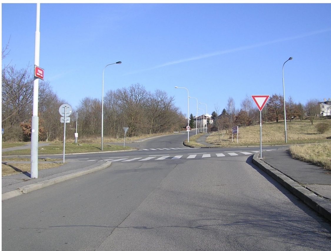
Obrázek 8 Pohled na křižovatku z ulice Písková