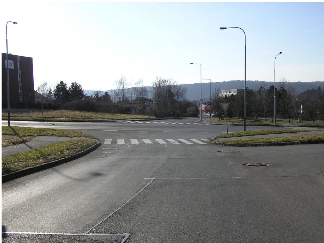
Obrázek 9 Pohled na křižovatku z ulice Na Hupech