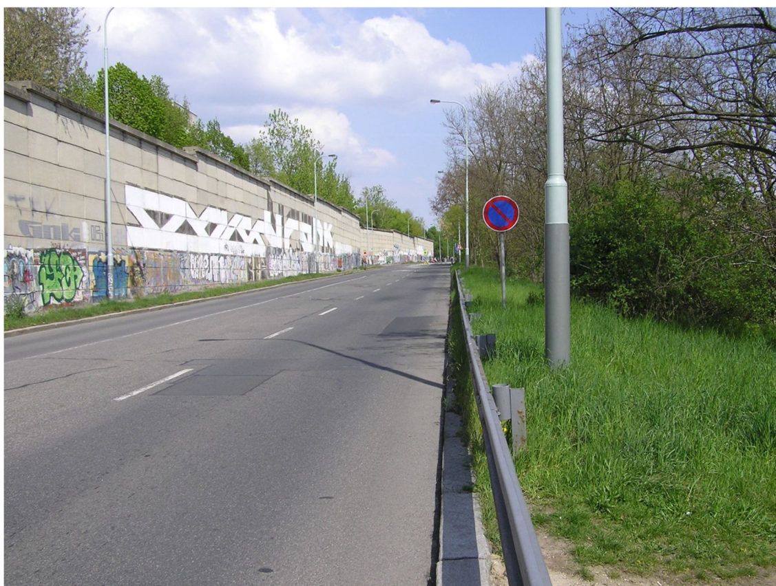
Obrázek 22 Pohled na ulici Československého exilu směrem z centra