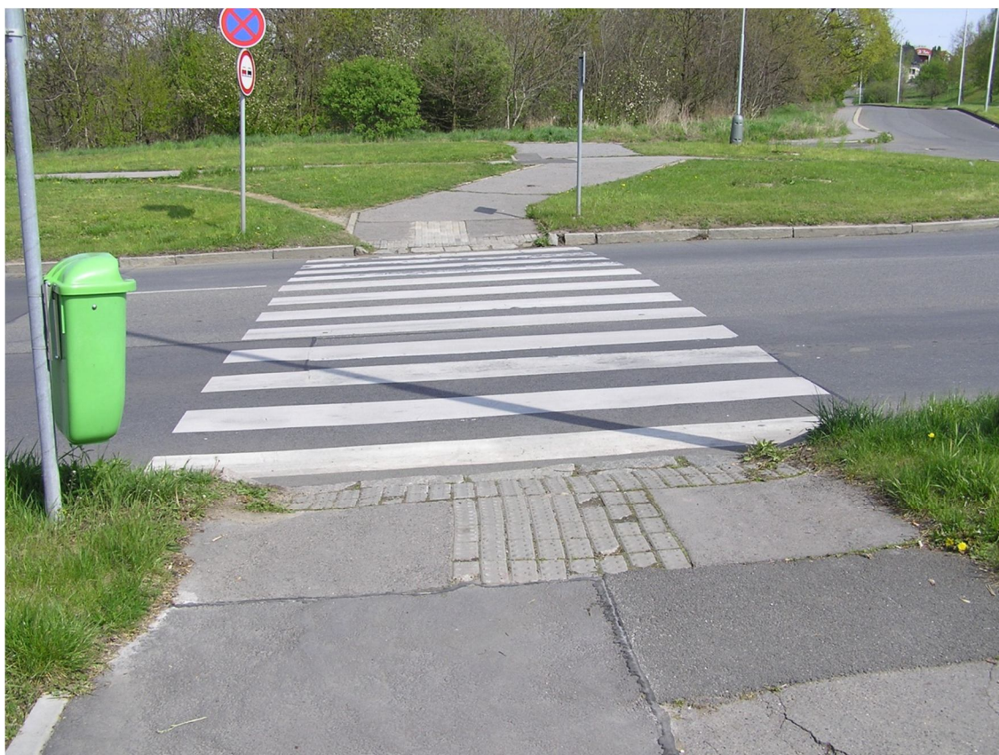
Obrázek 4 Přečhod přes ulici Československého exilu u křižovatky s ulicemi Písková a Na Hupech