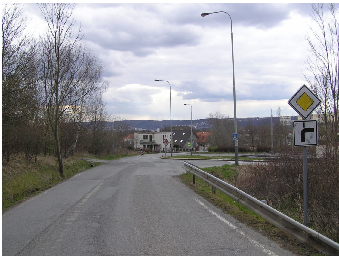
Obrázek 46 Pohled na křižovatku z ulice Hornocholupická směrem od Cholupic