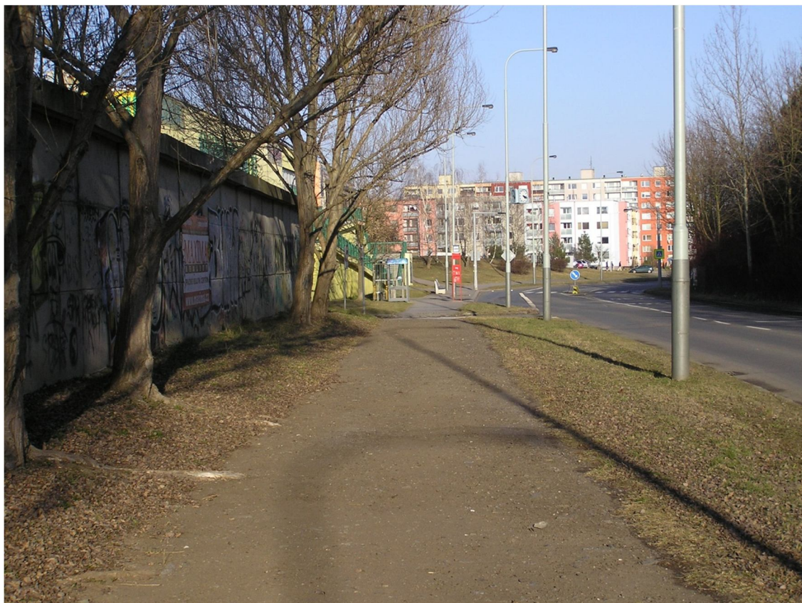
Obrázek 31 Chodník se štěrkovým povrchem, v pozadí zastávka Pavelkova