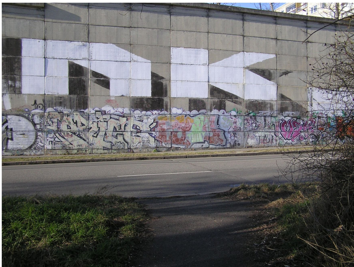
Obrázek 24 Vyústění chodníku od osady Na Beránku