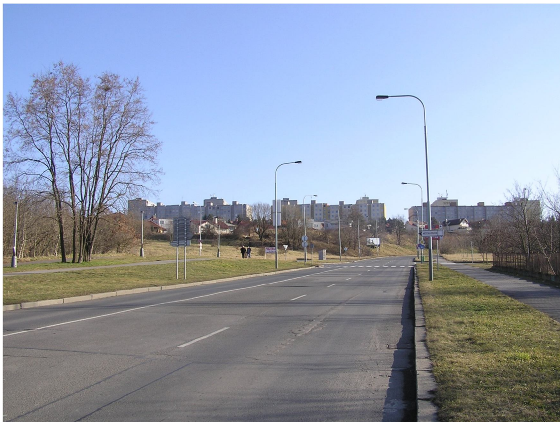
Obrázek 3 Pohled na ulici Československého exilu ve směru staničení