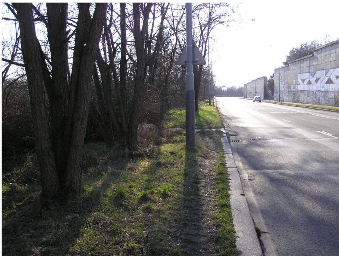
Obrázek 26 Místo, kudy v současnosti chodí chodci