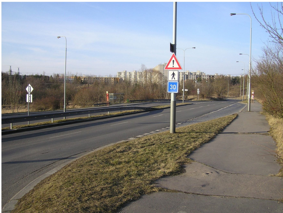
Obrázek 41 Pohled na zastávku Na Beránku