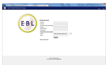
Registrace v EBL