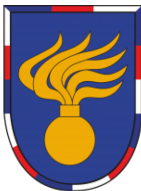
Obrázek 1 - Znak HlVeVP [1]