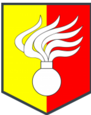
Obrázek 2 - Znak VeOSVP Praha [4]