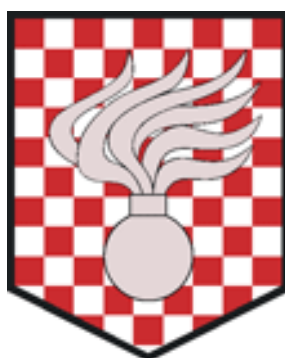
Obrázek 4 - Znak VeVP Olomouc [6]

Pohotovostní oddělení VeVP Olomouc může na základě rozhodnutí NVP plnit také úkoly i mimo výše vymezená území.