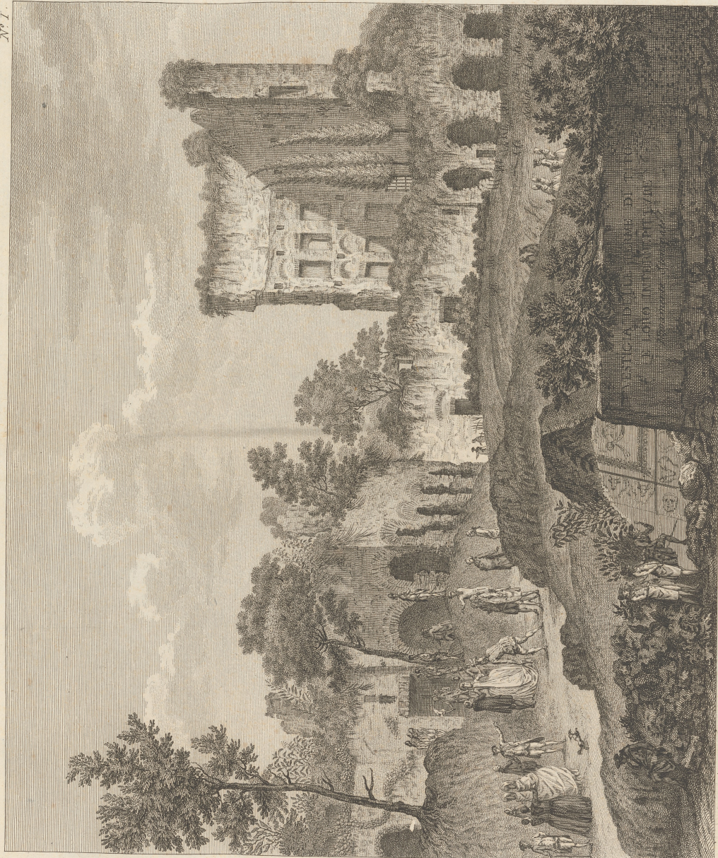
Vue d'une des Exedres des Thermes de Titus Et de l'entrée des Chambres souterraines

ČES. UYS. SKOLA ARCHITEKTURY A POZEMNÍHO STAVITELSTVÍ V PRAZE ARCHITEKTURA I.