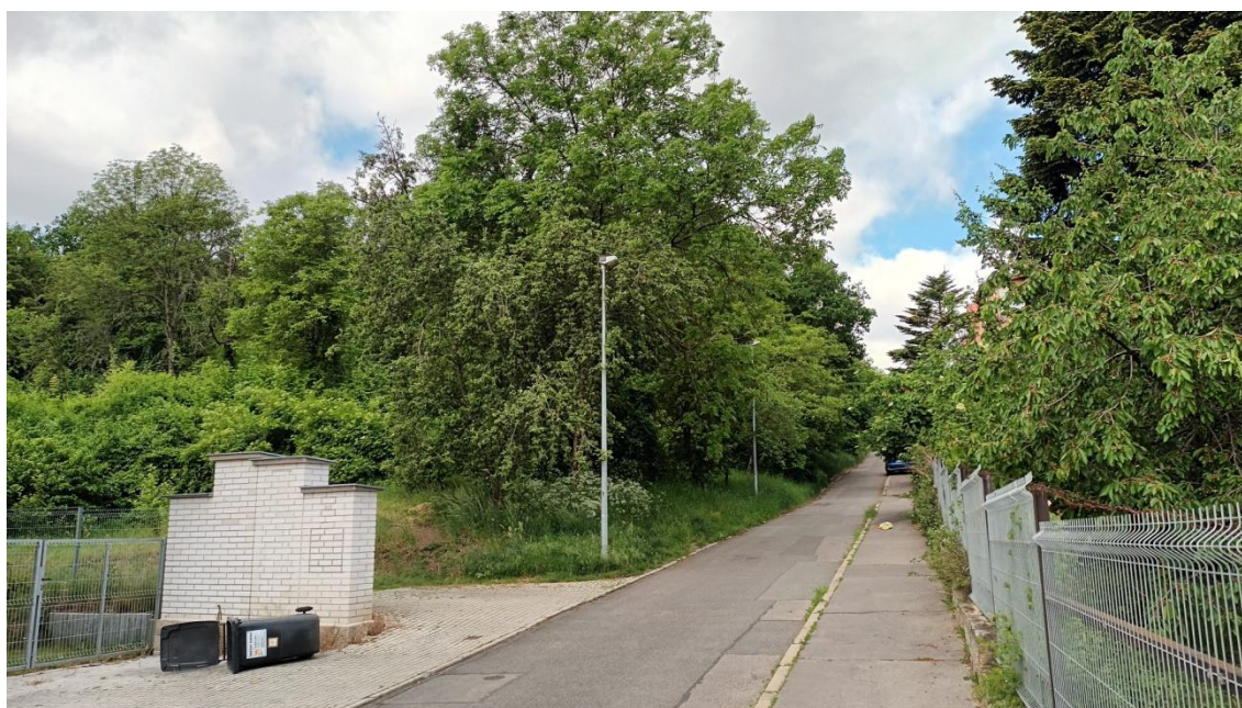
Fotografie 4 Lokality „Na Hutmance-západ a východ“ (severní strana)