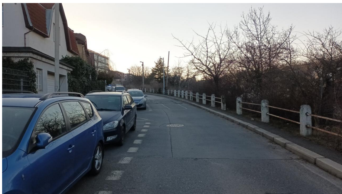
Fotografie 22 Východní pohled do Puchmajerovy ulice