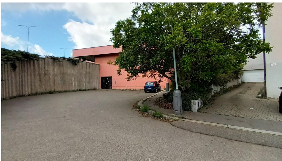
Fotografie 18 Plocha před provozní budovou metra a vjezd do soukromých garáží (vpravo)