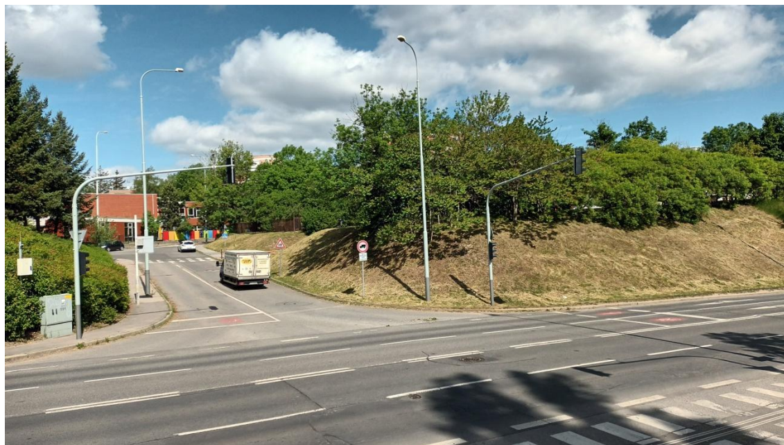
Fotografie 9 Lokality „Univerzita“ a „Radlická-západ“ (pohled z Radlické ul.)