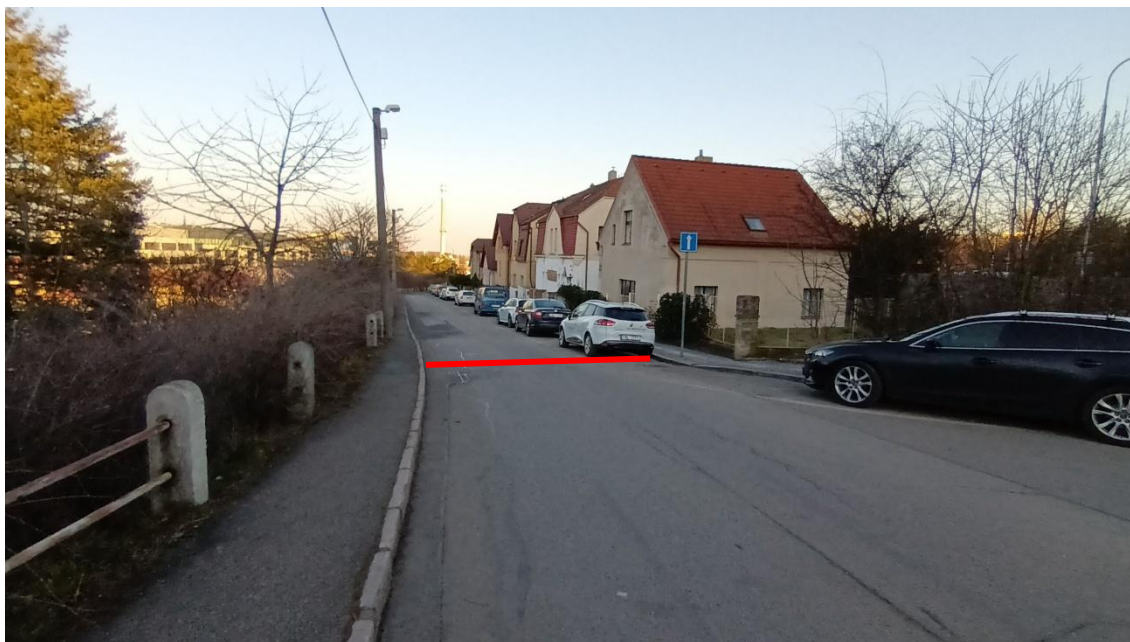
Fotografie 23 Západní pohled do Puchmajerovy ulice (nejužší profil)