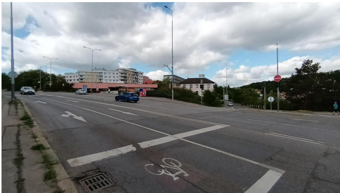
Fotografie 1 Lokalita „Vestibul“ (+„Puchmajerova“)