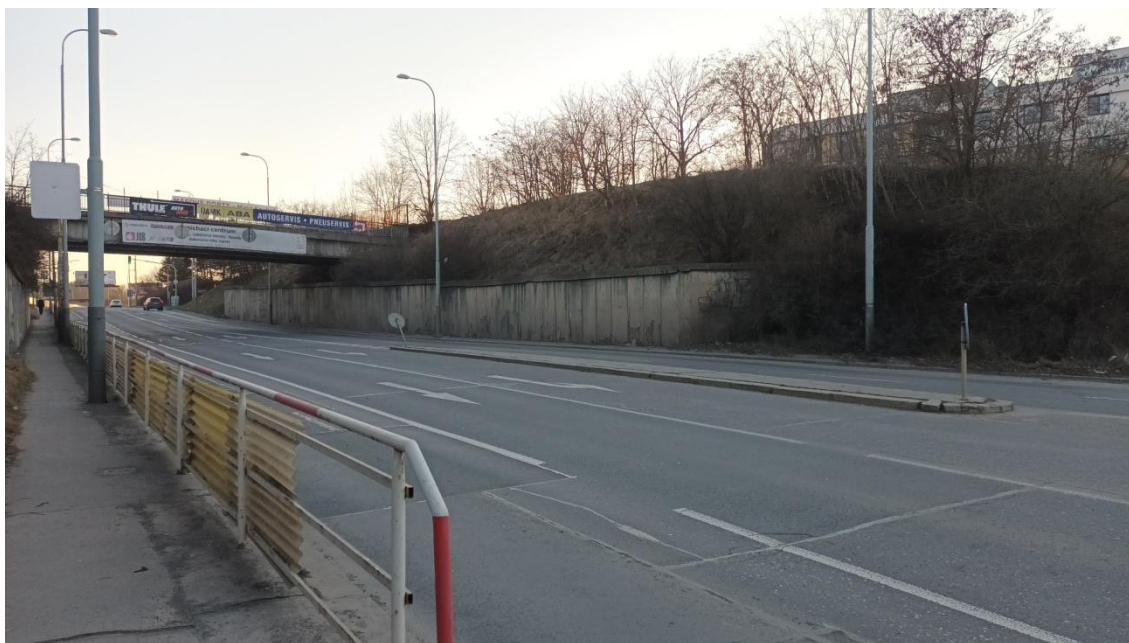
Fotografie 6 Lokality „Radlická-střed“ a Radlická-západ“