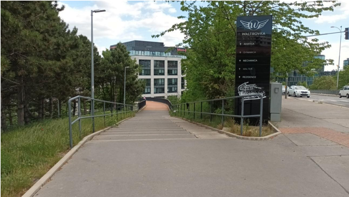
Fotografie 27 Lávka spojující rezidenci Waltrovka s okolím stanice metra