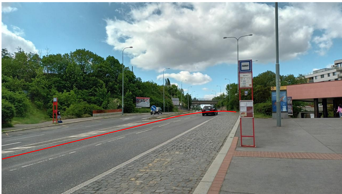
Fotografie 13 Prostor zvolený pro umístění výstupní zastávky tramvaje (ulice Radlická)