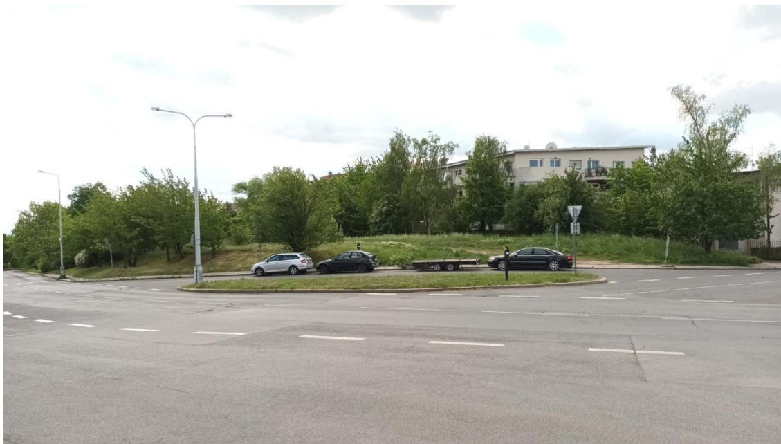
Fotografie 5 Lokalita „Vidoule“