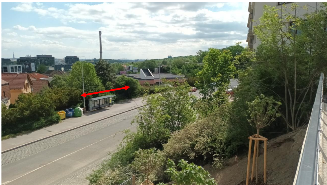
Fotografie 17 Pohled na prostor mezi zástavbou v Puchmajerově ulici a budovou metra