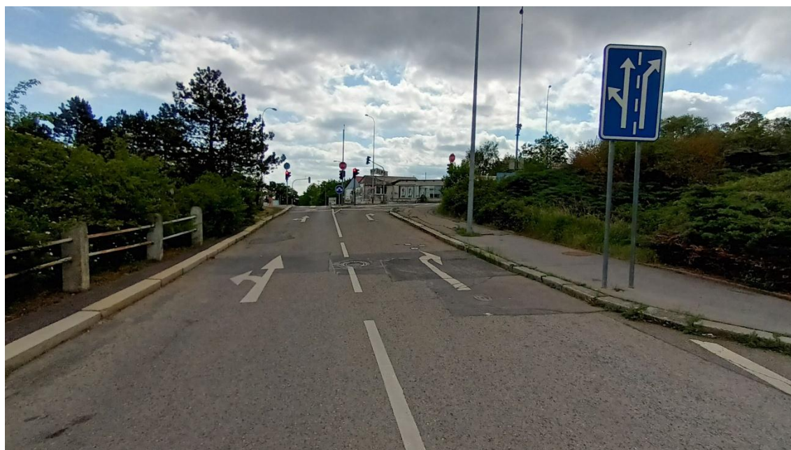
Fotografie 21 Křižovatka ulic Puchmajerova - Radlická