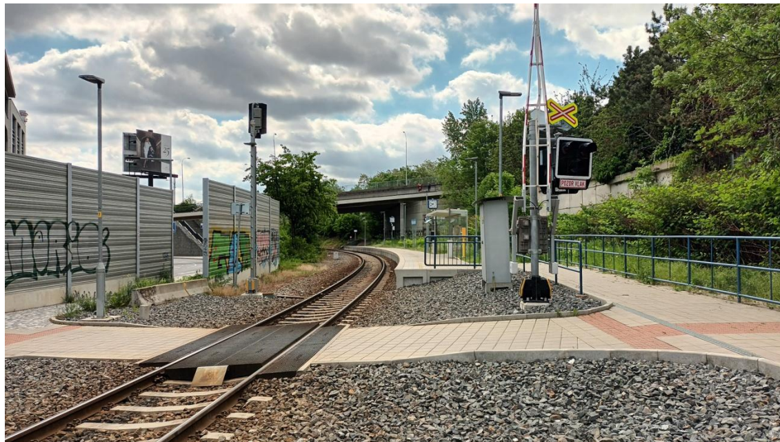
Fotografie 25 Železniční zastávka Praha-Jinonice, v pozadí lávka a most přes železniční trať