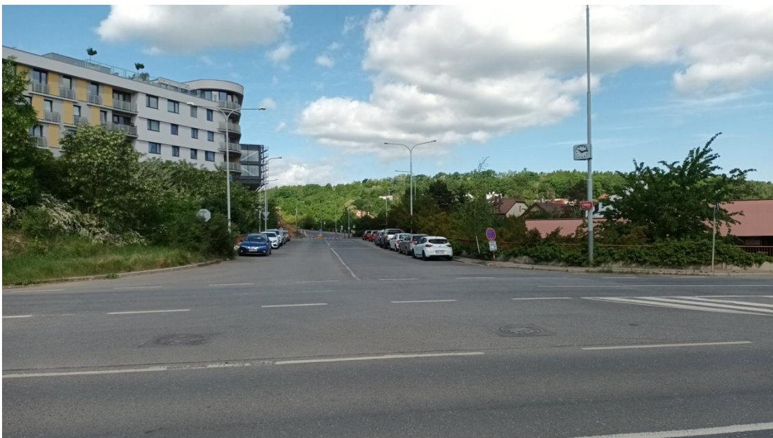
Fotografie 16 Ulice V Zářezu (pohled z Radlické ulice)