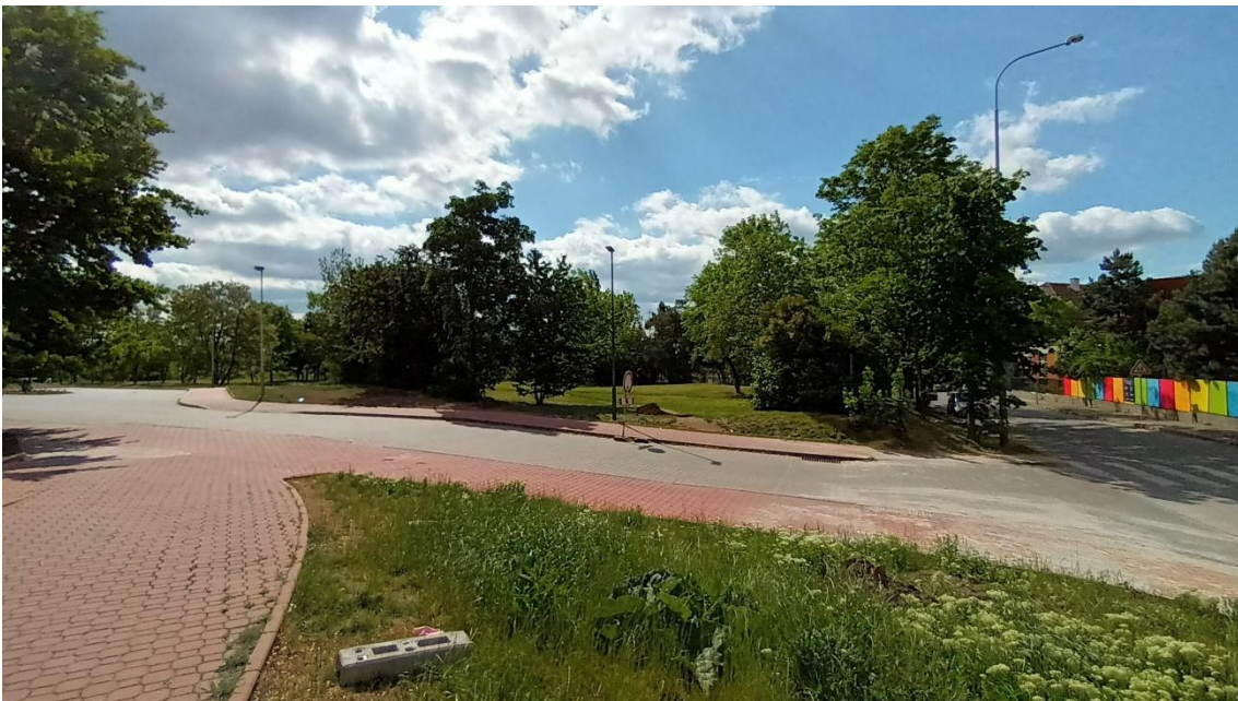
Fotografie 8 Lokalita „Univerzita“