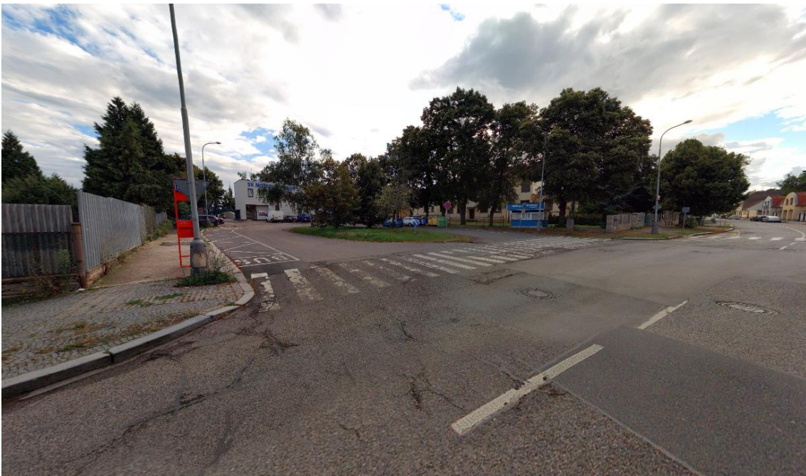
Fotografie 28 Zastávka Butovická (možná konečná pro linku 908)