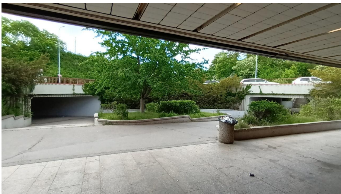
Fotografie 24 Pohled na podchody pod ulicemi Radlická a V Zářezu