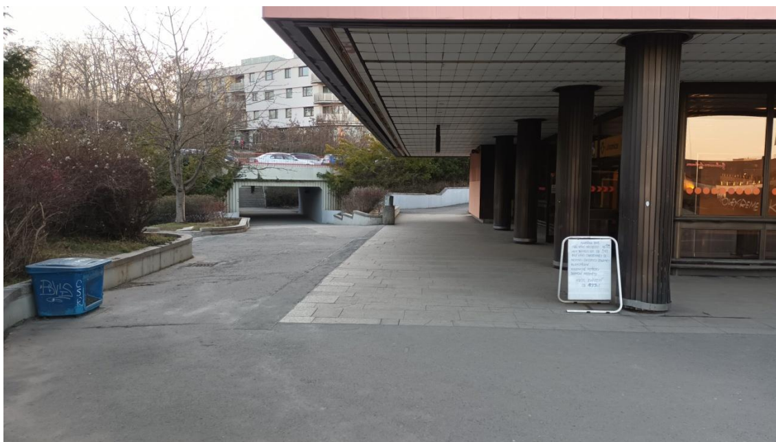
Fotografie 14 Předprostor vestibulu stanice metra a podchod v ulici V Zářezu