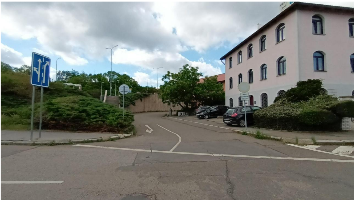
Fotografie 20 Komunikace sloužící obsluze provozní budovy metra