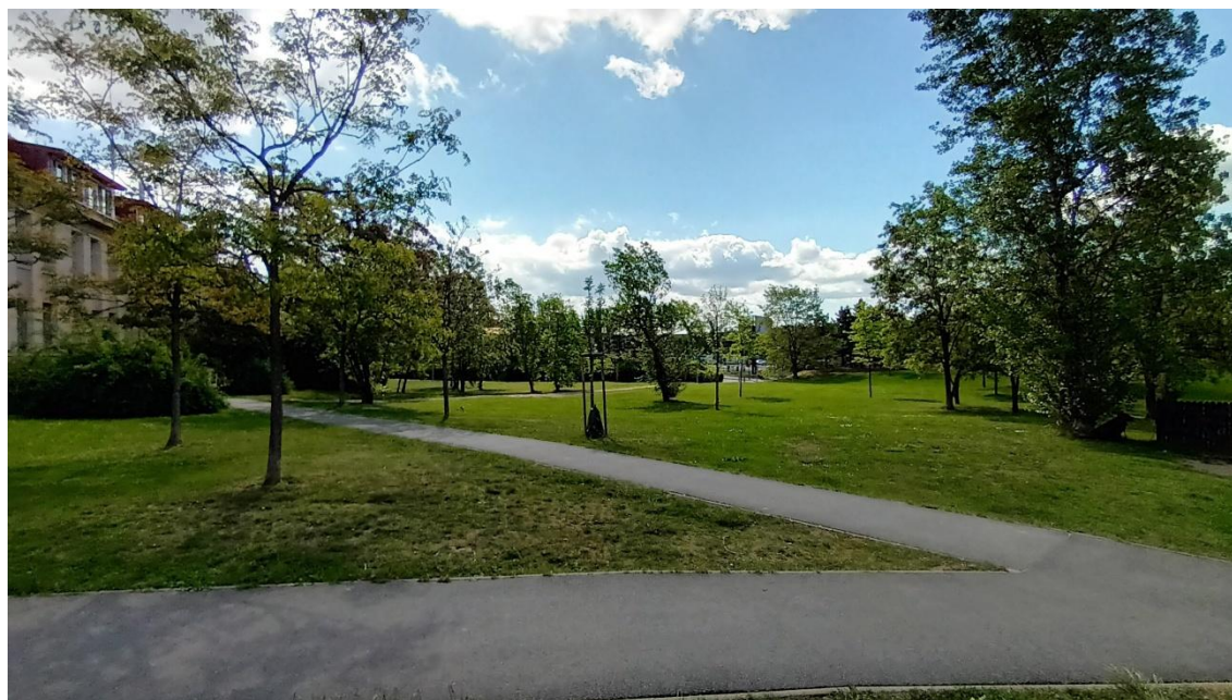
Fotografie 10 Lokalita „Škola“