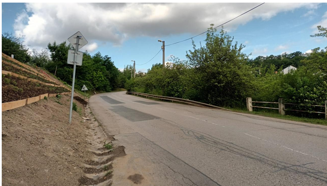
Fotografie 3 Lokality „Na Hutmance-západ a východ“ (jižní strana)