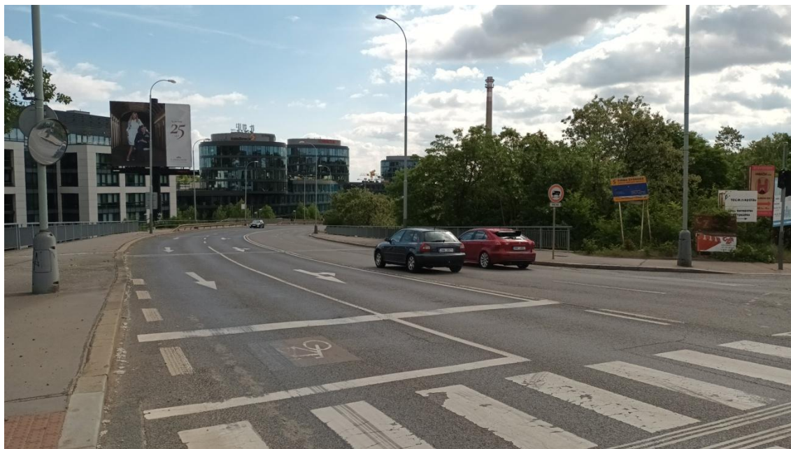
Fotografie 11 Ulice Radlická - most přes železniční trať v místě začátku staničení (platí pro všechny varianty)