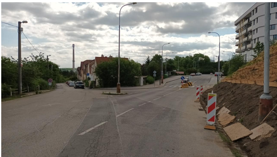
Fotografie 2 Lokalita „Puchmajerova“ (křižovatka Puchmajerova - V Zářezu)