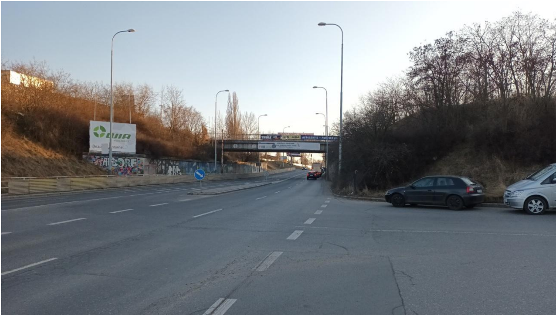
Fotografie 7 Lokality „Radlická-východ“, Radlická-střed“, („Radlická-západ“)