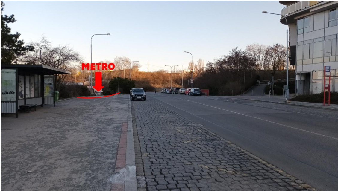
Fotografie 15 Ulice V Zářezu v místě stávající autobusové zastávky (s vyznačením směru přístupu do metra a směru vedení osy koleje)