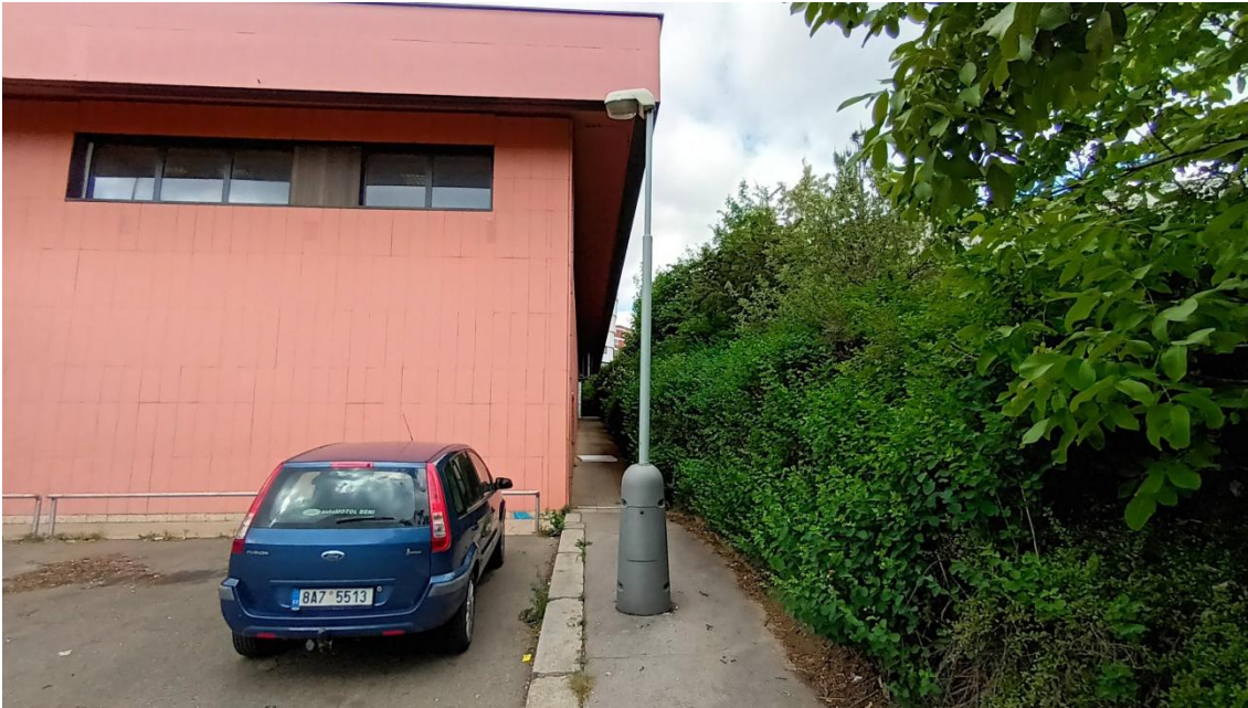
Fotografie 19 Proluka mezi budovou metra a zástavbou v Puchmajerově ul.