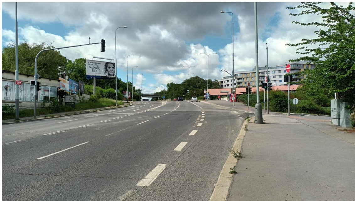
Fotografie 12 Ulice Radlická v místě začátku staničení (pohled ve směru staničení)