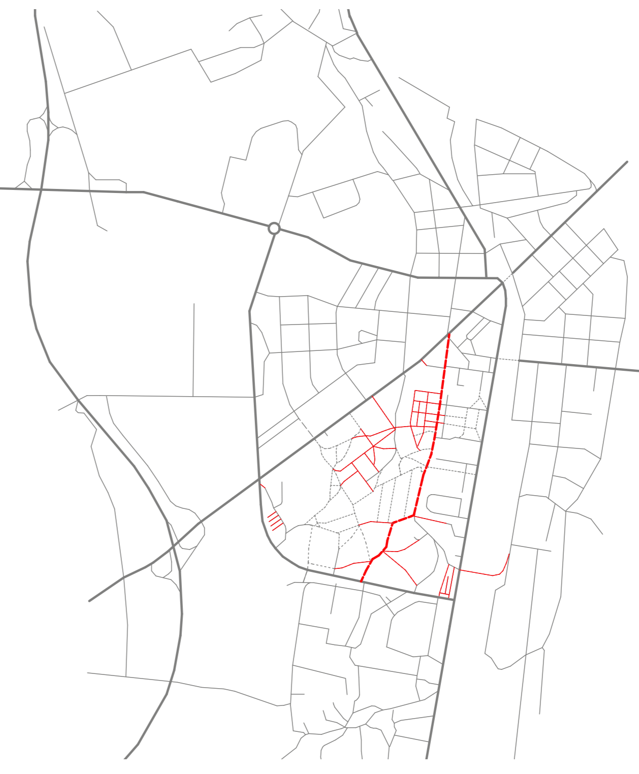
doplňení cestní sítě