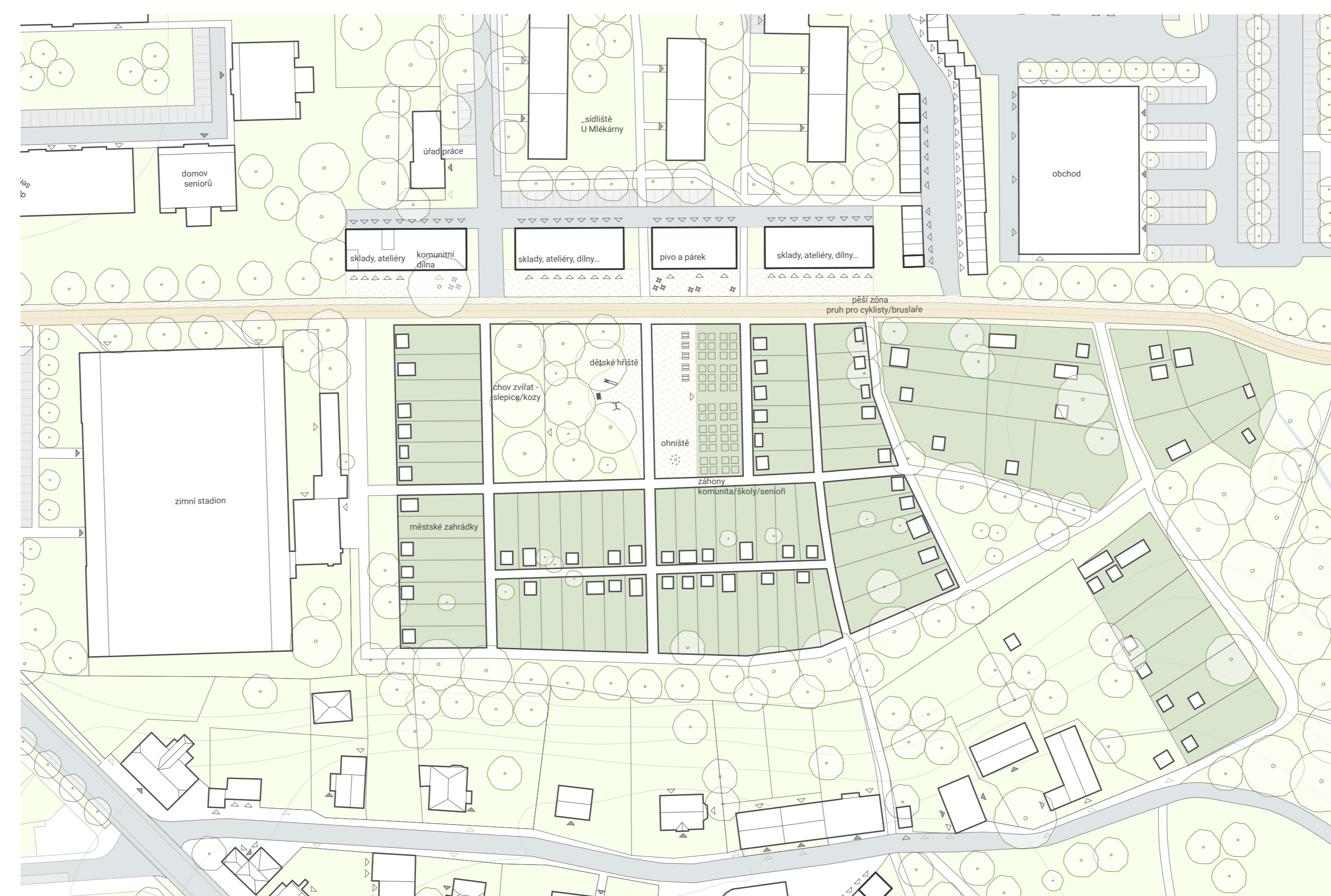
DETAIL II - MĚSTSKÉ ZAHŘÁDKY 1:1000