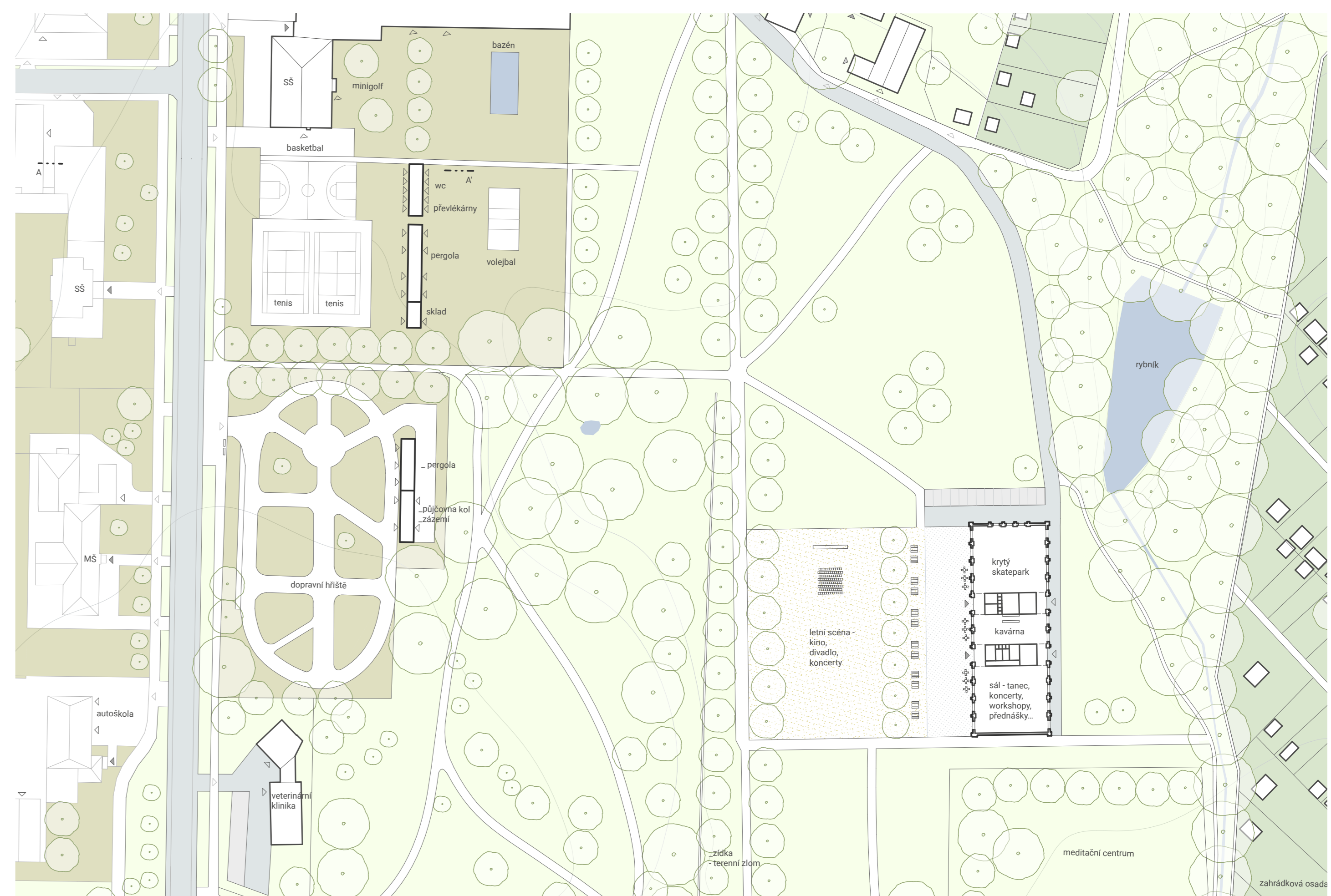
DETAIL III - KOMUNITNÍ CENTRUM OHELNÁ - 1:1000