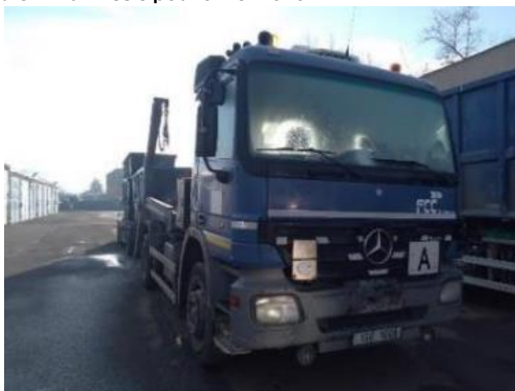
Vozidlo Mercedes Actros