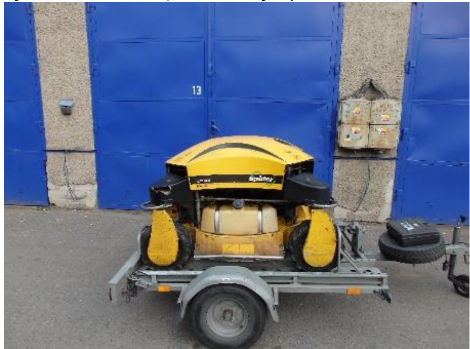
Přívěs Vario se sekačkou Spider