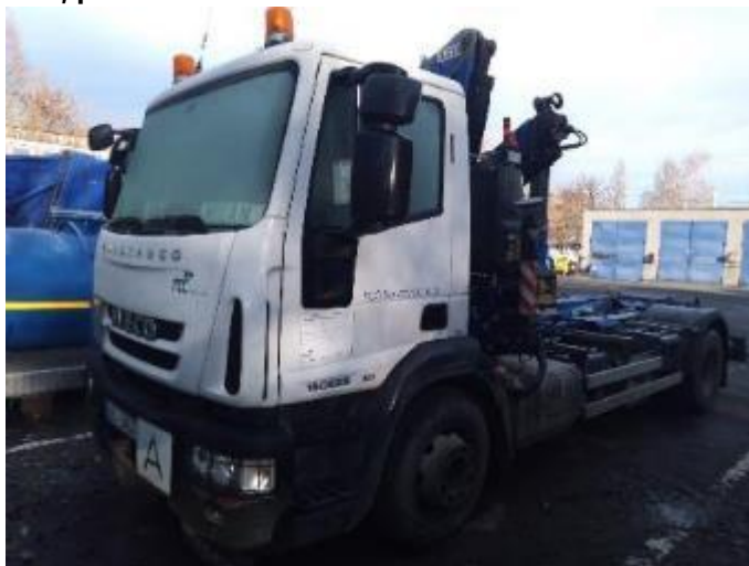
Vozidlo Iveco Eurocargo