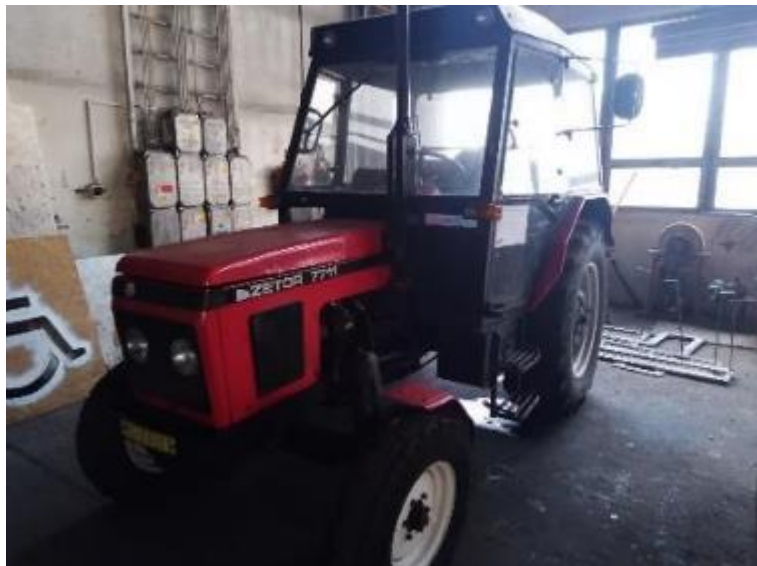
Traktor Zetor 7711