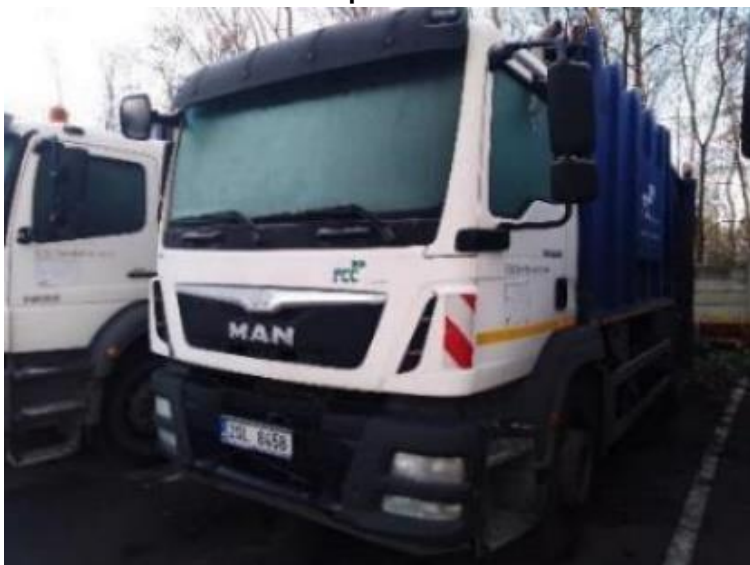
Vozidlo Man TGM