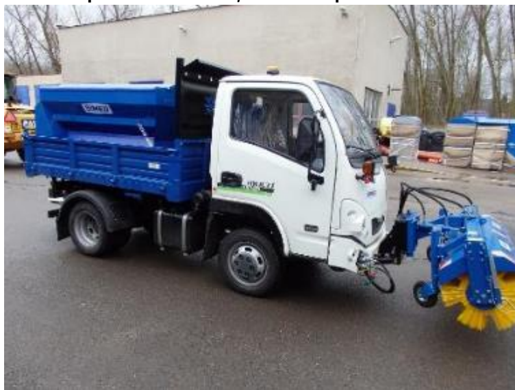
Vozidlo Durso Multimobil