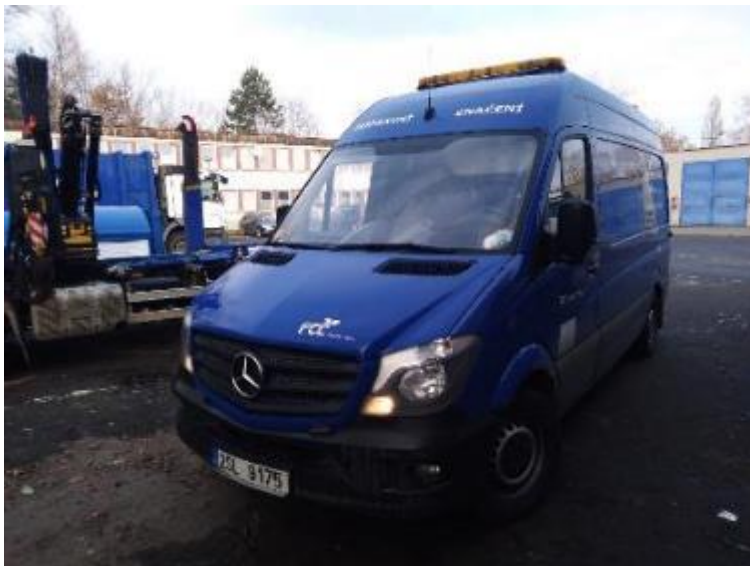
Vozidlo Mercedes Sprinter