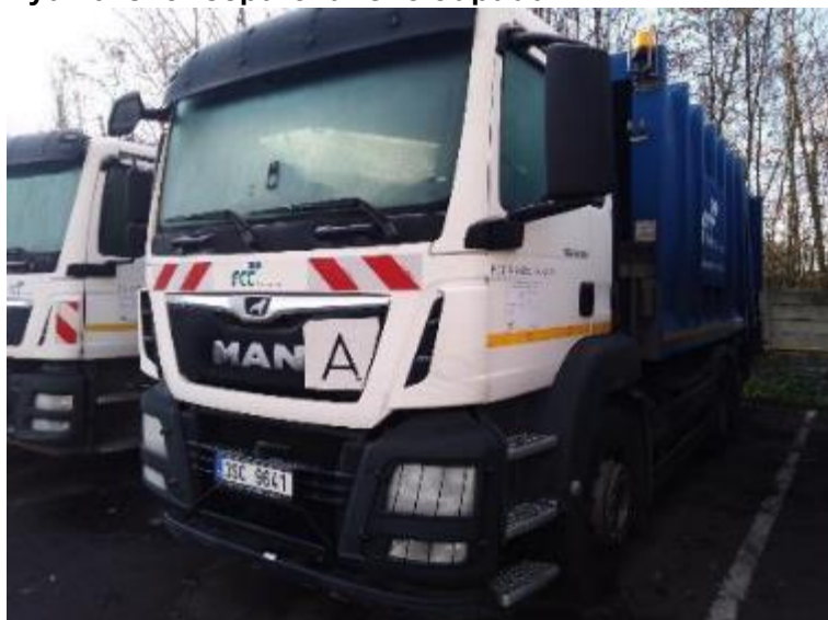
Vozidlo Man TGS (2)