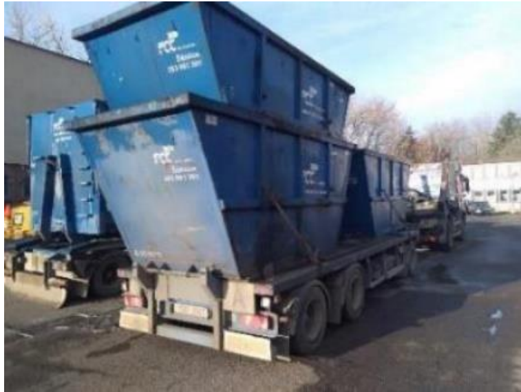
Vlek DOOS POKV 24