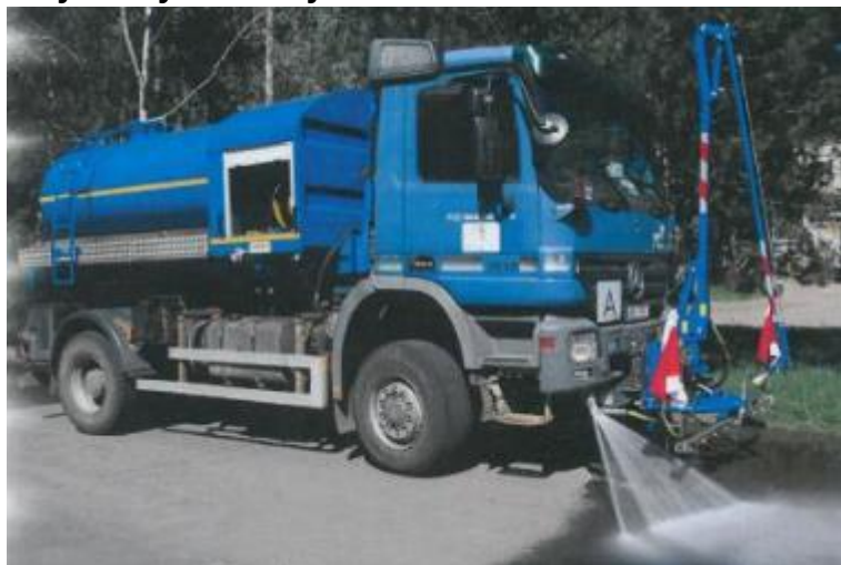
Vozidlo Mercedes Actros