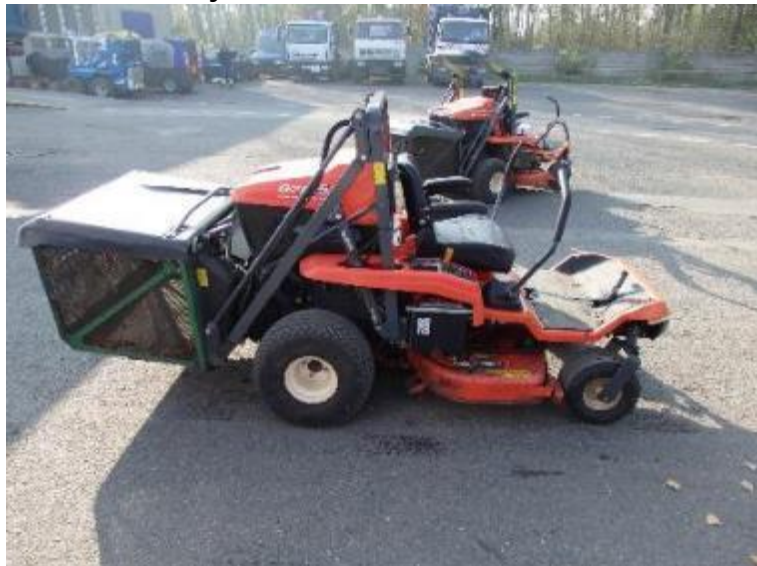
Sekačka Kubota GZD