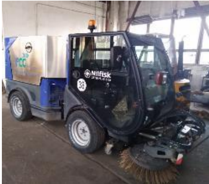
Vozidlo Nilfisk City Ranger 3500