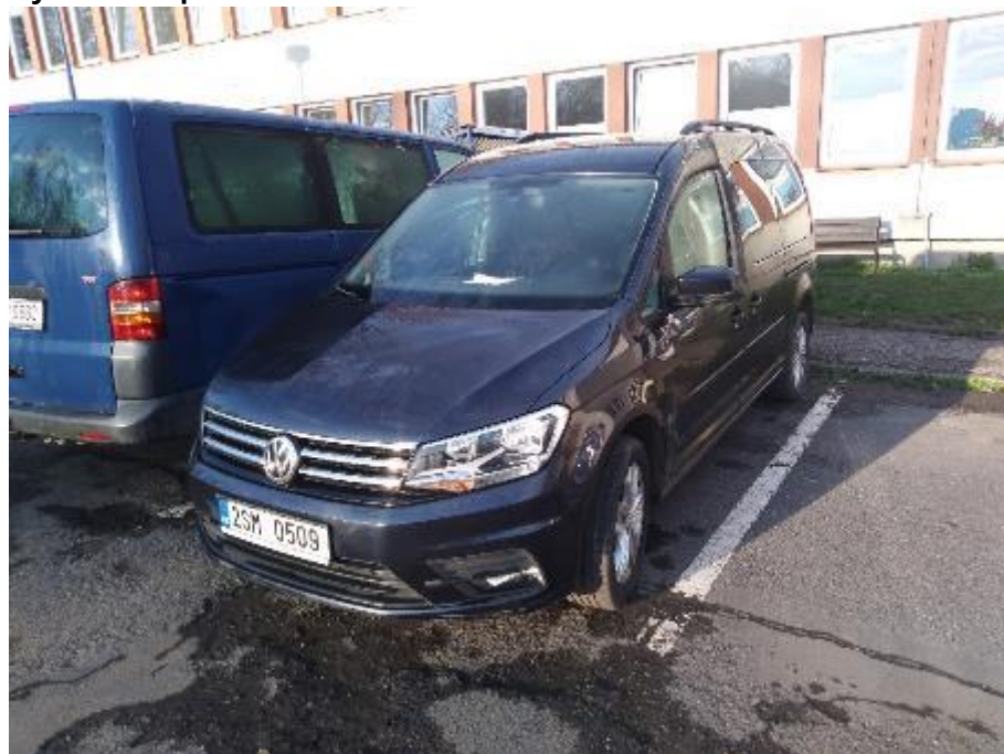
Vozidlo Volkswagen Caddy