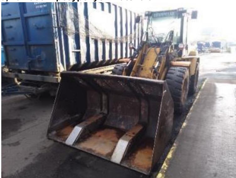
Nakladač Caterpillar IT14G