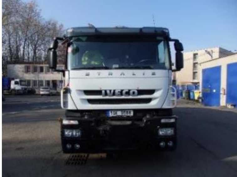
Vozidlo Iveco Stralis