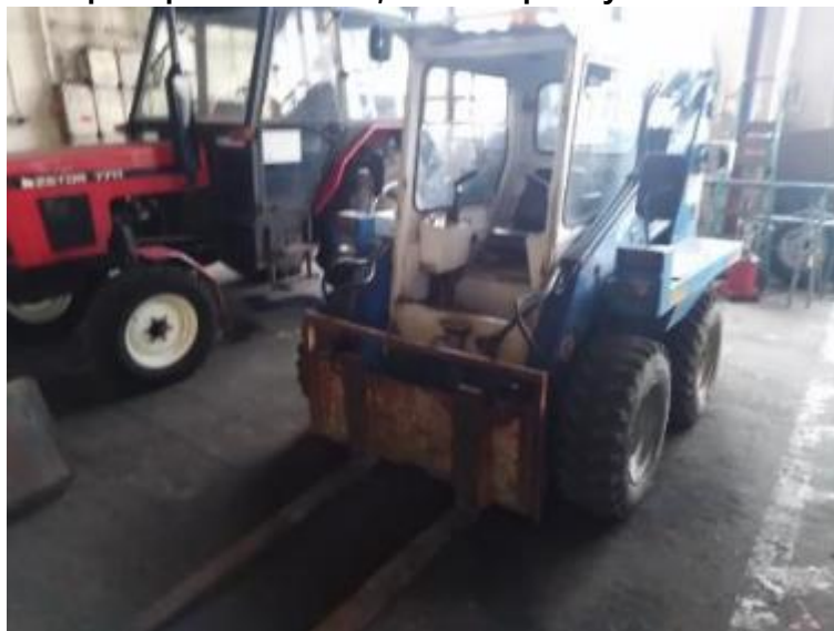
Smykový nakladač UNC 060