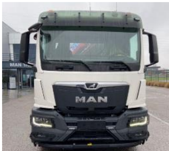
Vozidlo Man TGS (3).