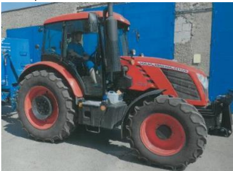
Traktor Zetor Proxima