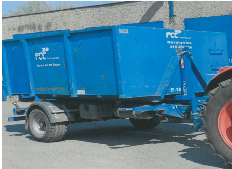
Traktorový návěs CTS Charvát