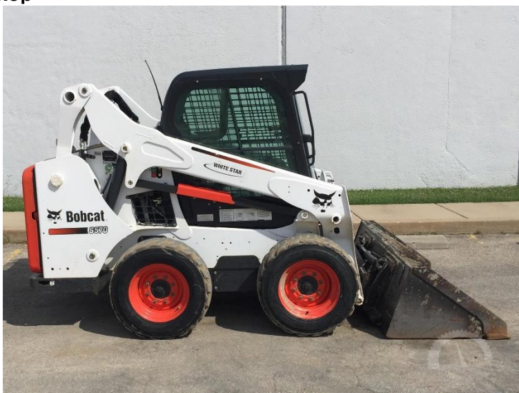
Nakladač Bobcat S570