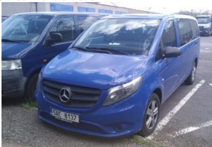
Vozidlo Mercedes Vito