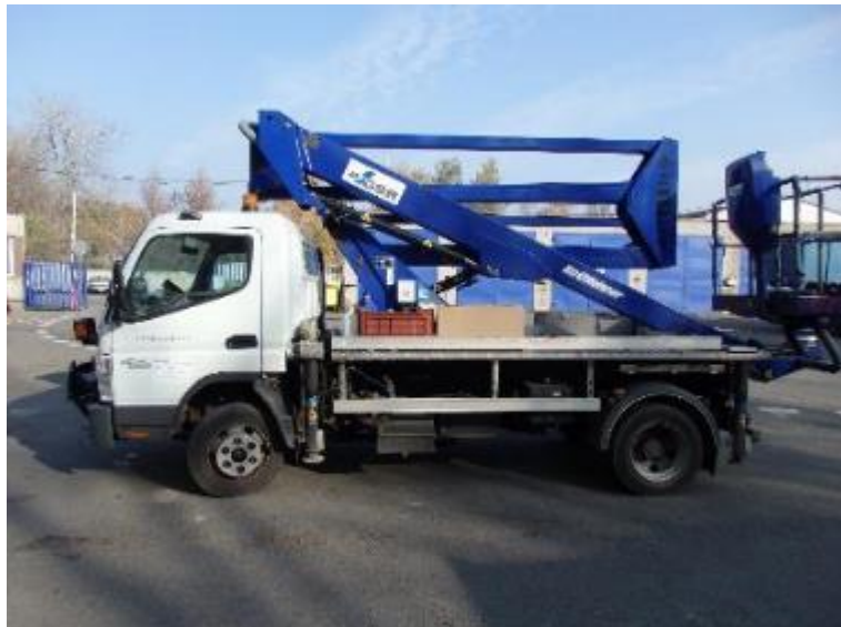
Vozidlo Mitsubishi Fuso Canter 7,5t