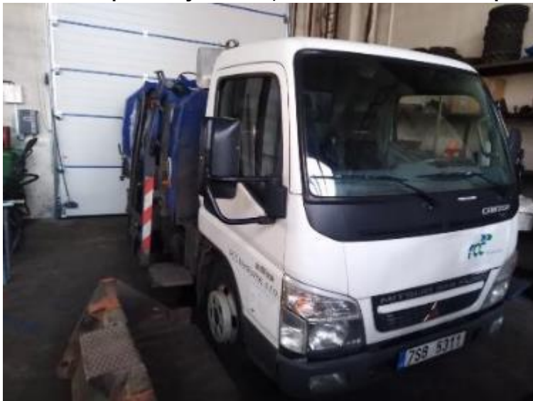
Vozidlo Mitsubishi Fuso Canter 3,5t