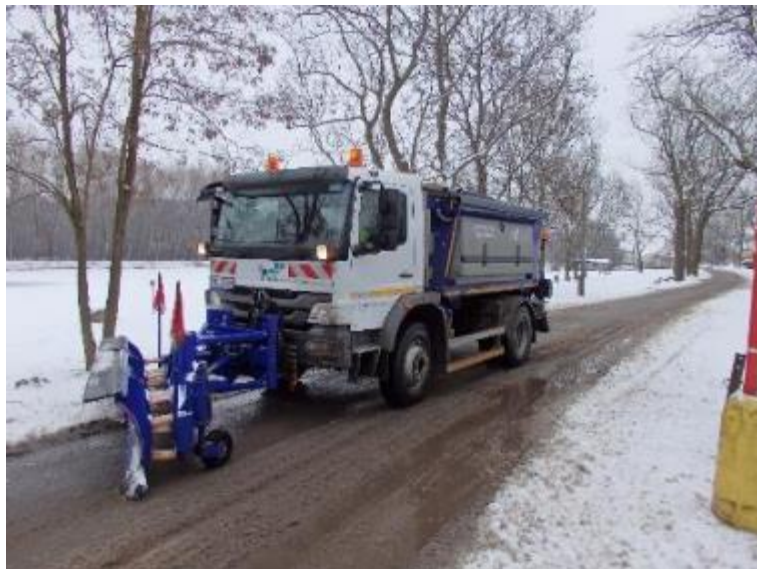
Vozidlo Mercedes Atego