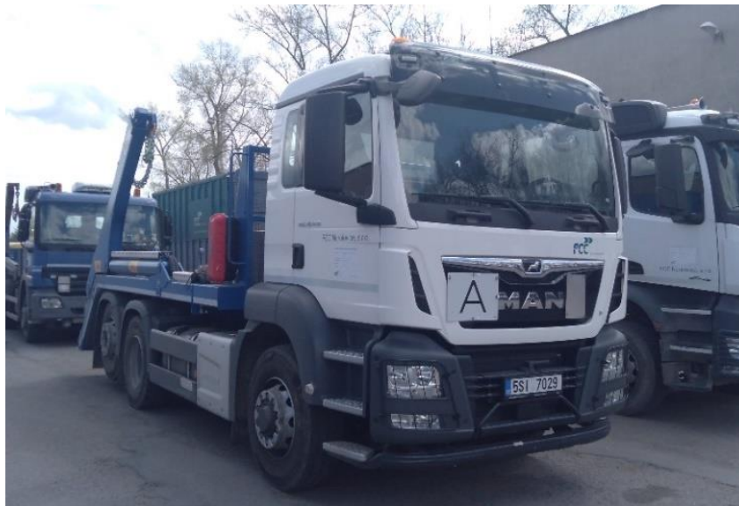
Vozidlo Man TGS