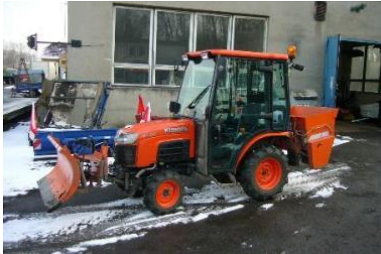
Minitraktor Kubota B2530