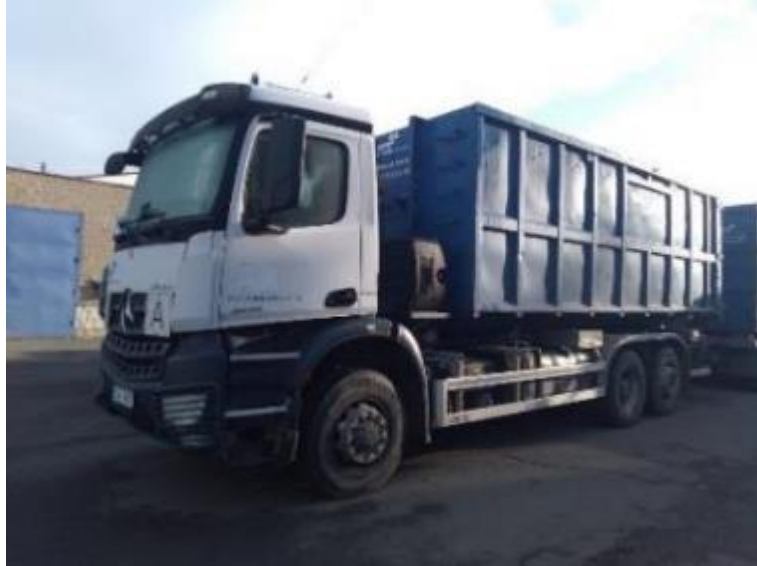
Vozidlo Mercedes Arocs