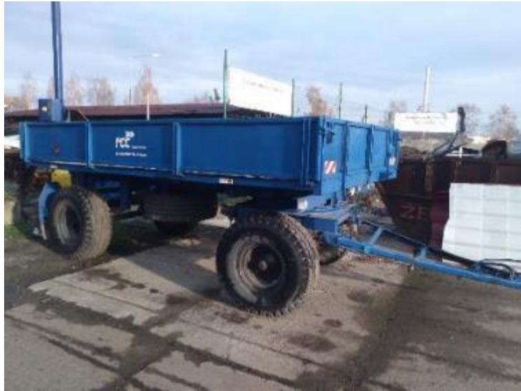
Traktorový vlek BSS 8