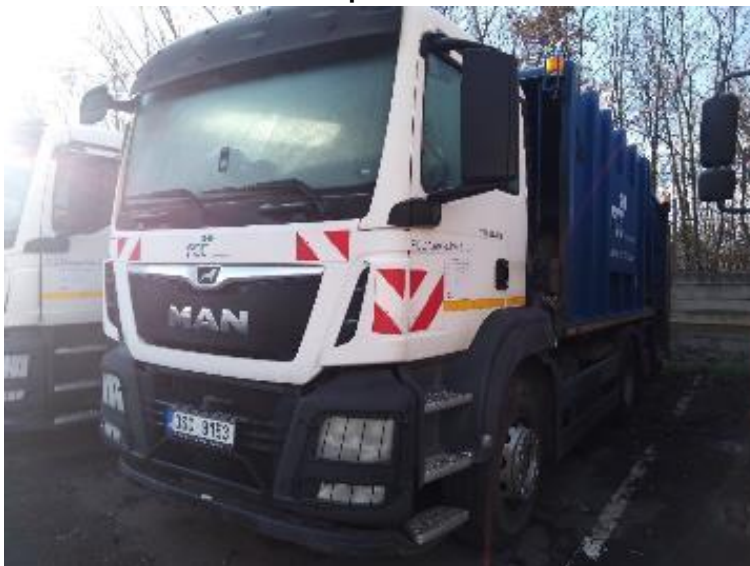
Vozidlo Man TGS (1)

Man TGM s nástavbou Haller 15 s děleným universálním vyklápěčem Delta 300