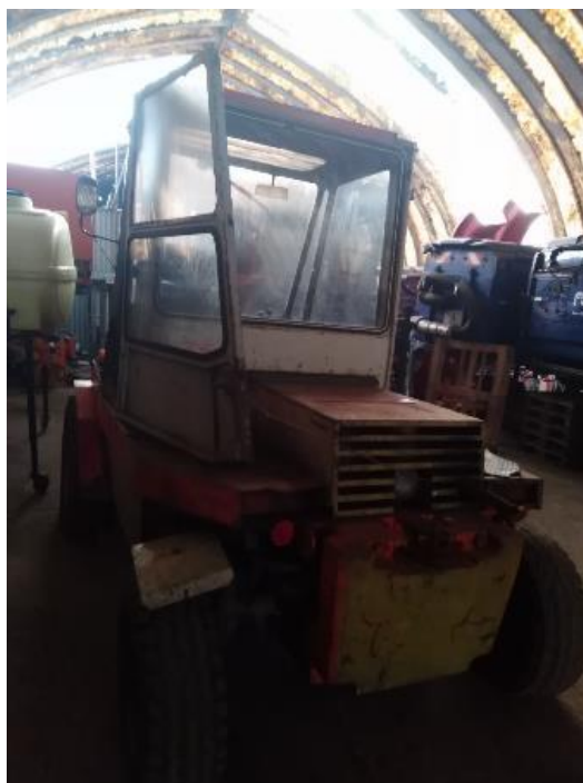
Vysokozdvížený vůz Desta