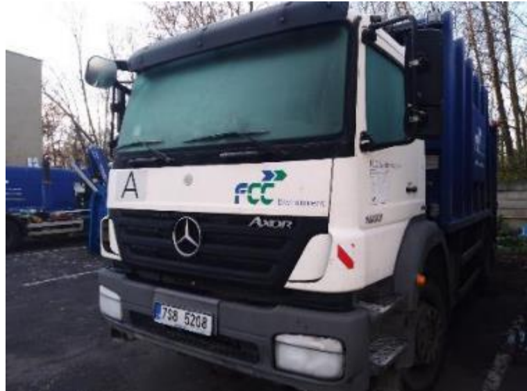
Vozidlo Mercedes Axor