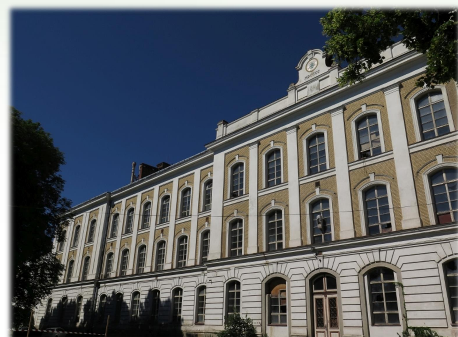
Pohled na hlavní budovu areálu. Jedinečný architektonický komplex v centru města Tachov je momentálně bez využití.