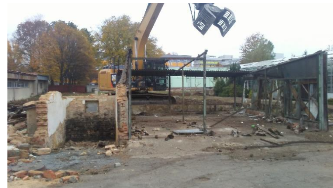
Demolice ŽB oplocení