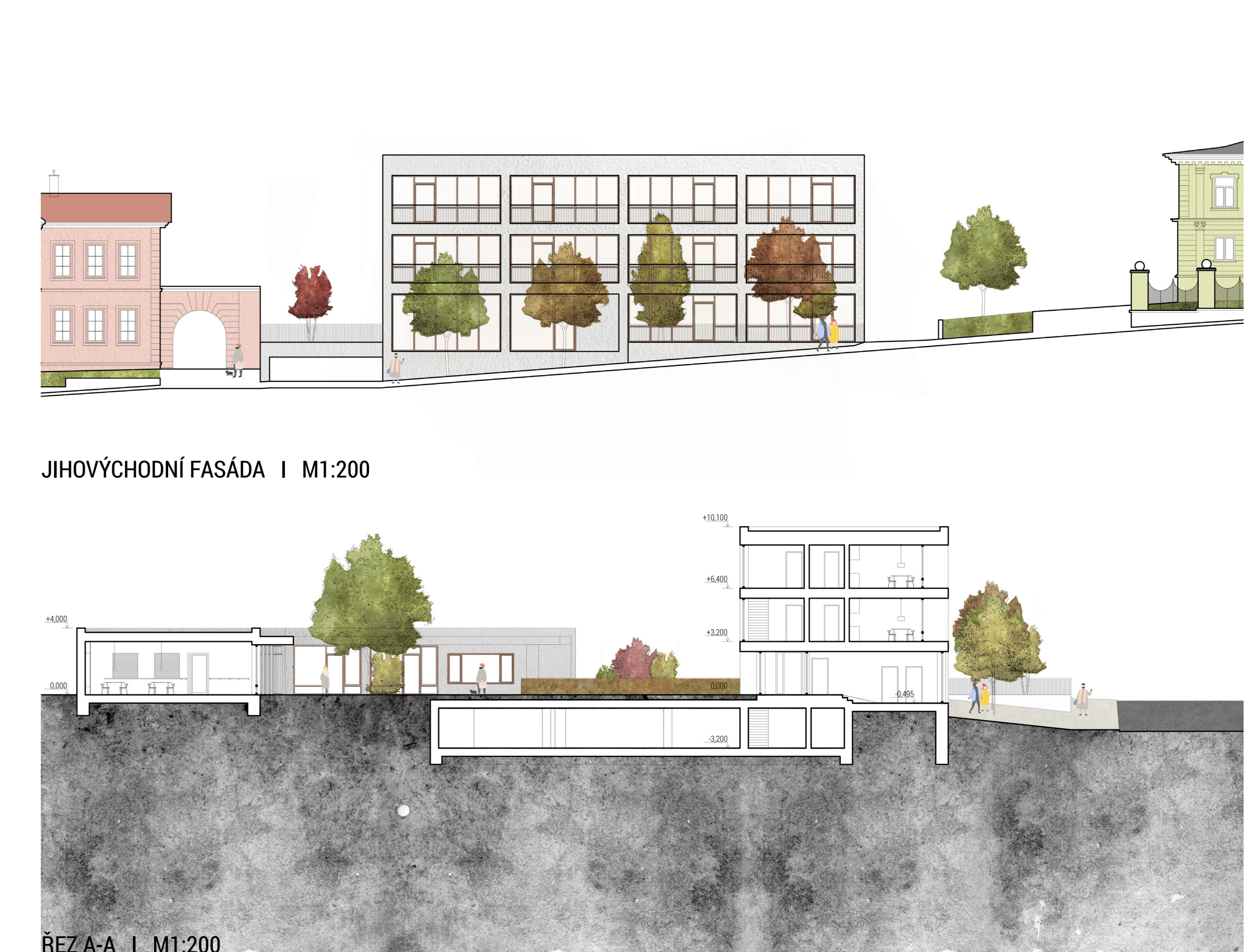
JIHOVÝCHOVNÍ FASÁDA | M1:200

ZAHADY Zahady jsou řešeny na úrovni terénu. V zahradě je umístěn stacionář a bytový dům. Zahady jsou řešeny na úrovni terénu. V zahradě je umístěn stacionář a bytový dům. Zahady jsou řešeny na úrovni terénu. V zahradě je umístěn stacionář a bytový dům.