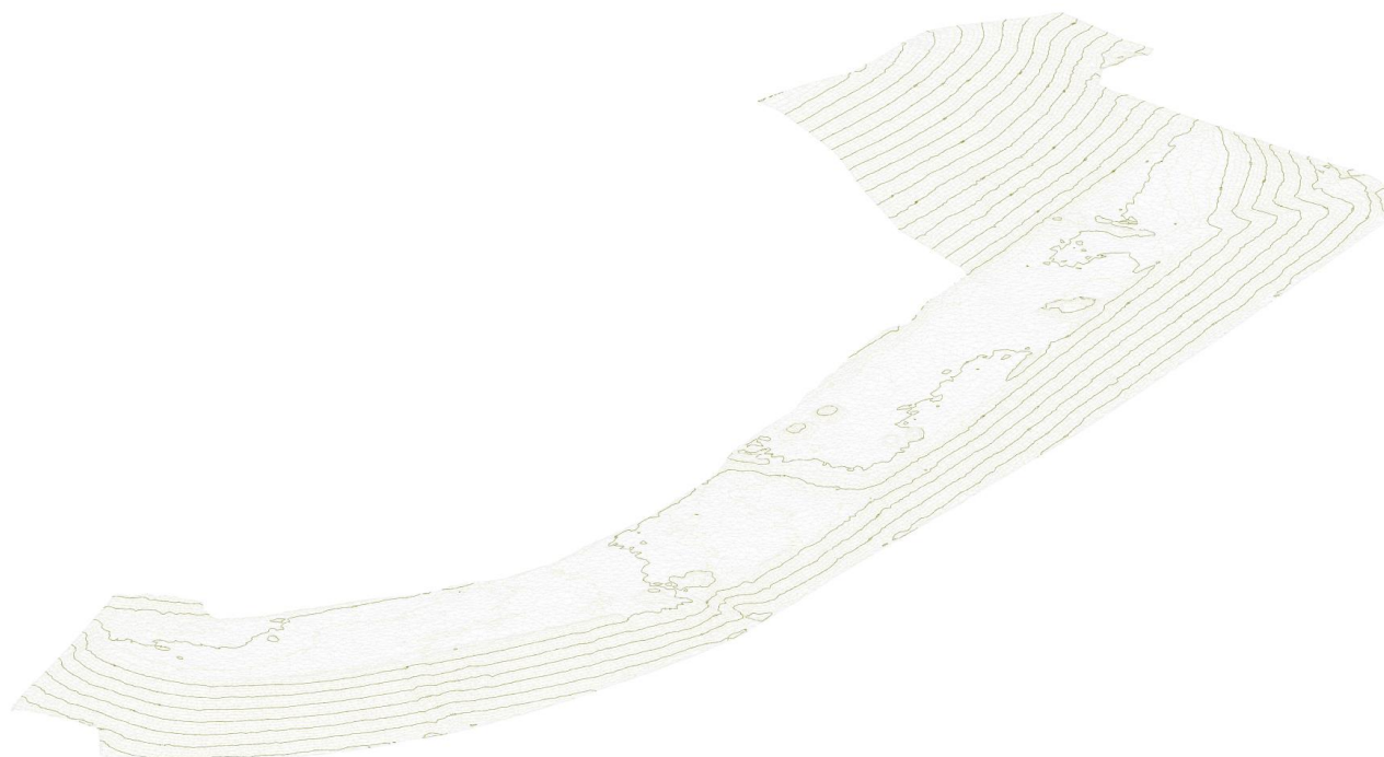
3D MODEL DMT – POHLED Z – 20.2.2020