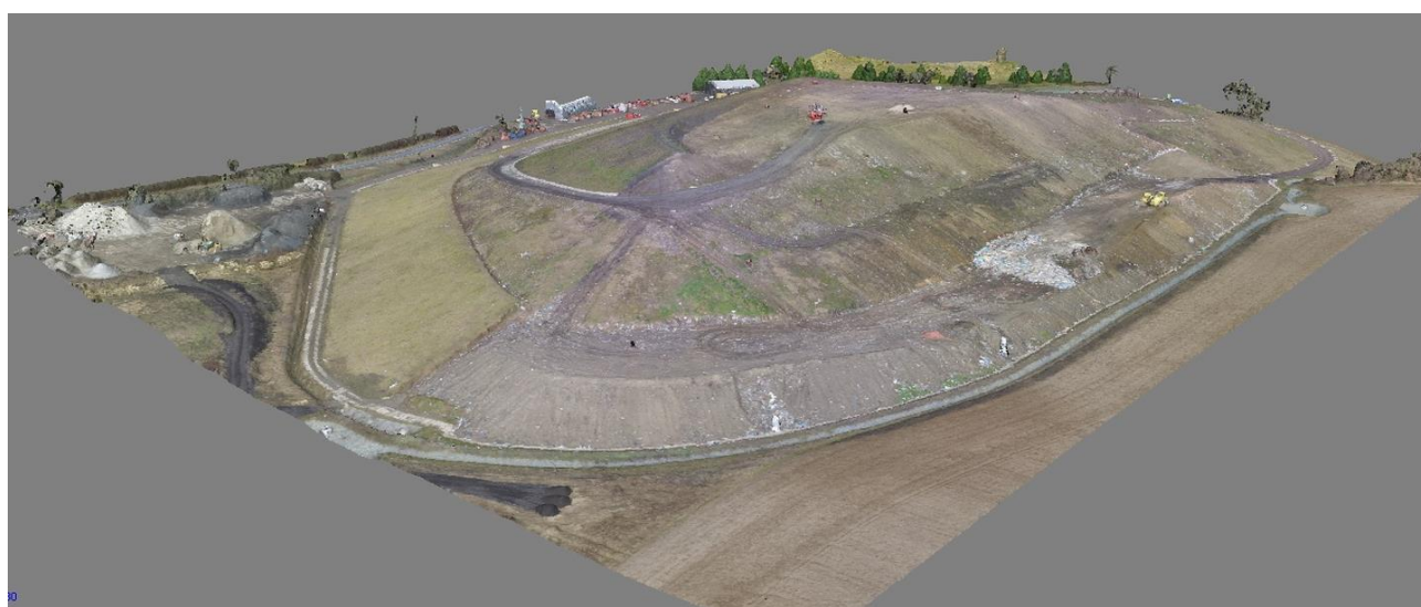
MRAČNO BODŮ – 20.2.2020 –Z POHLED