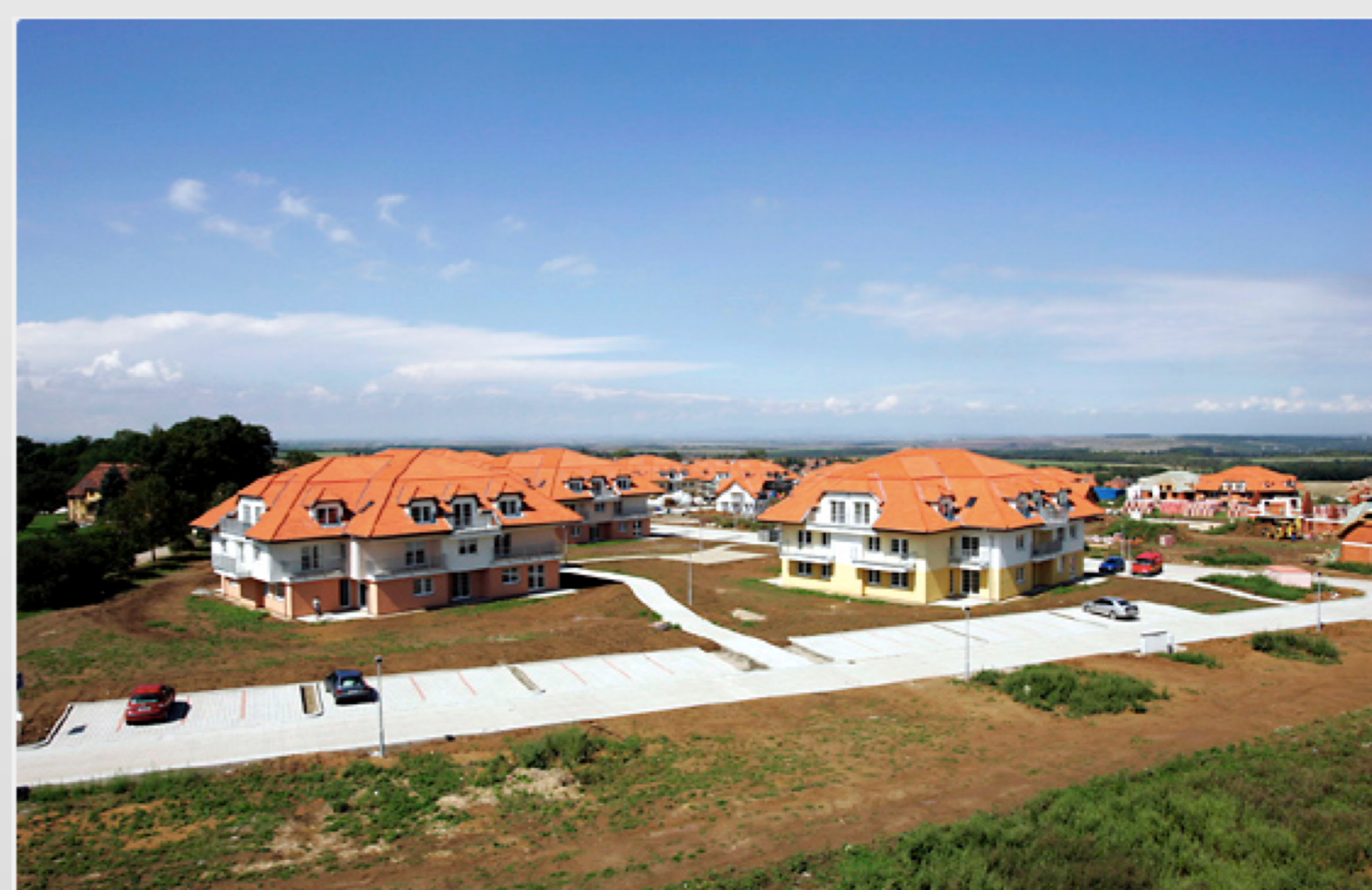
Lokalita Holubí háj