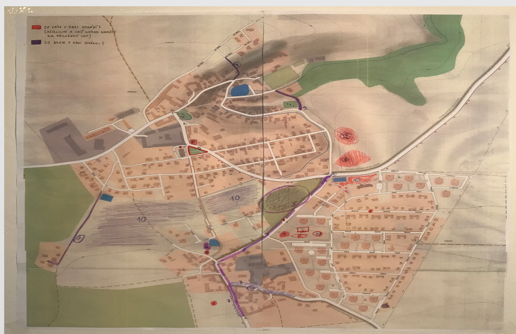
Průzkum veřejného mínění - ukázka metody pocitových map