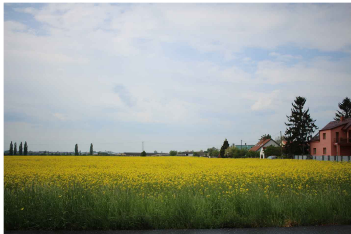
Obr. 5: Pohled od okružní křižovatky proti směru staničení projektované přeložky komunikace II/331