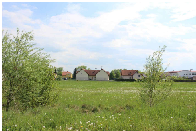
Obr. 2: Pohled do ulice Krajní proti směru staničení projektované přeložky komunikace II/331