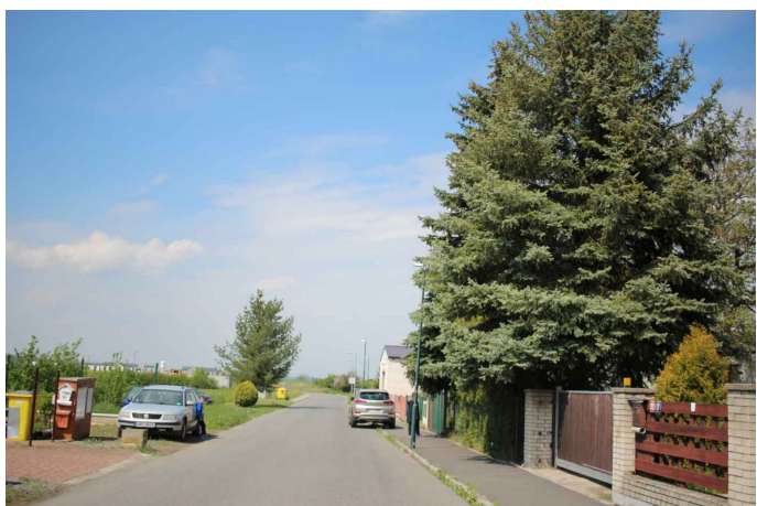
Obr. 3: Pohled z ulice Krajní po směru staničení projektované přeložky komunikace II/331