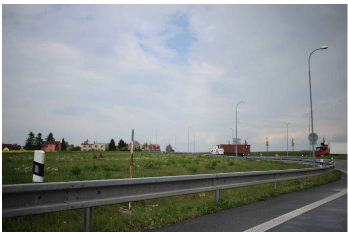
Obr. 6: Plánované zaústění přeložky do okružní křižovatky