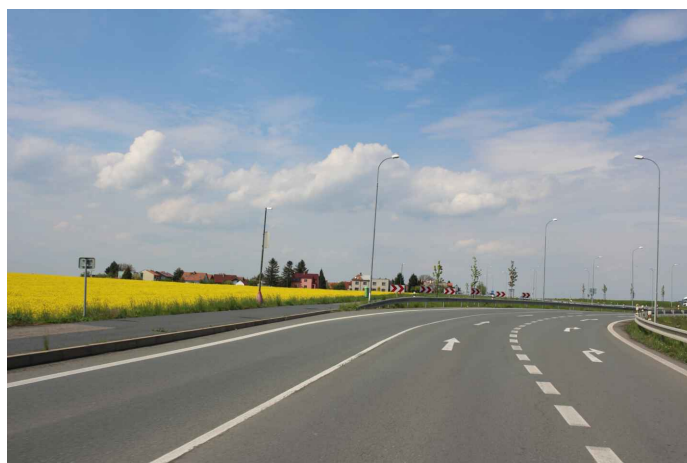
Obr. 4: Okružní křižovatka na konci projektovaného úseku, výjezd z města Nymburk