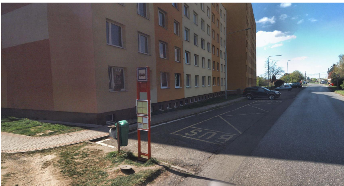
Původní stav autobusové zastávky Brandýs nad Labem, Brázdímská