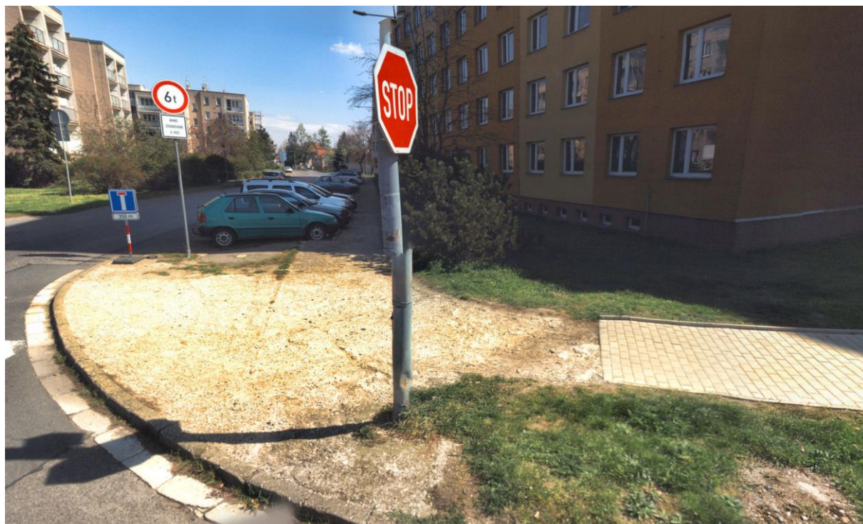
Původní stav nároží a chodníku u křižovatky Brázdímská x Neratovická x Kralupská