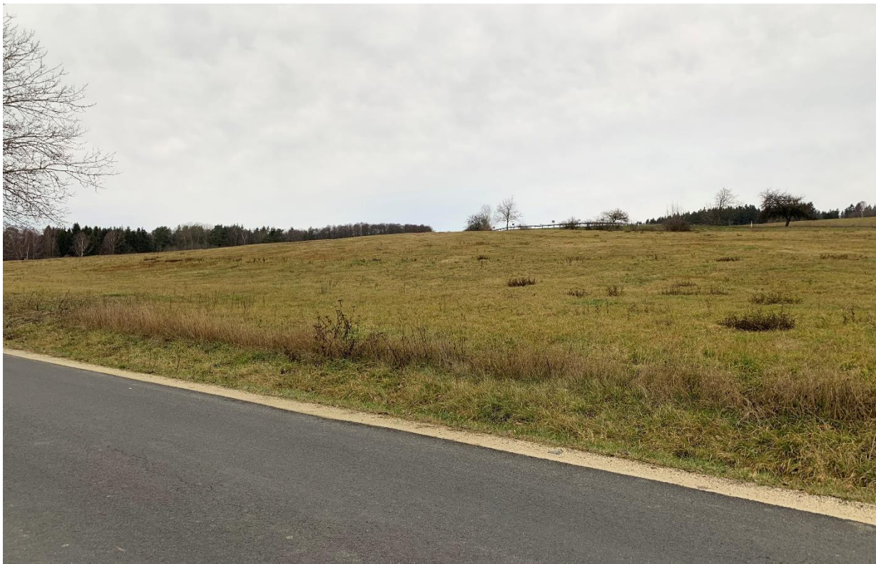
Obr.12 Místo nového křížení nového obchvatu se silnicí III/21315 varianta 1,2,3,4 (pohled ve směru staničení)