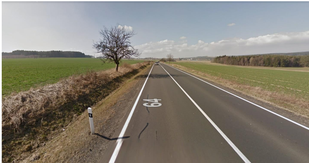
Obr.1 Místo odpojení nového obchvatu od stávající I/64 varianta 1,2,3