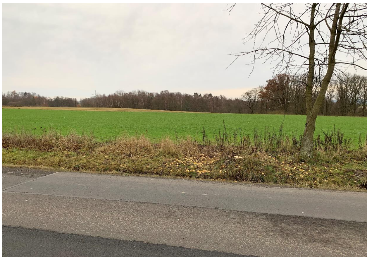
Obr.4 Místo křížení nového obchvatu se silnicí II/213 varianta 1,3 (pohled ve směru staničení)