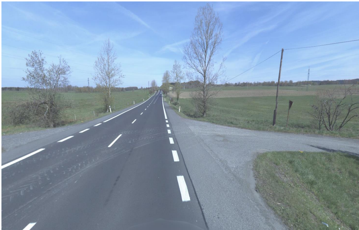
Obr.16 Místo odpojení nové přeložky I/64 od stávající silnice I/64