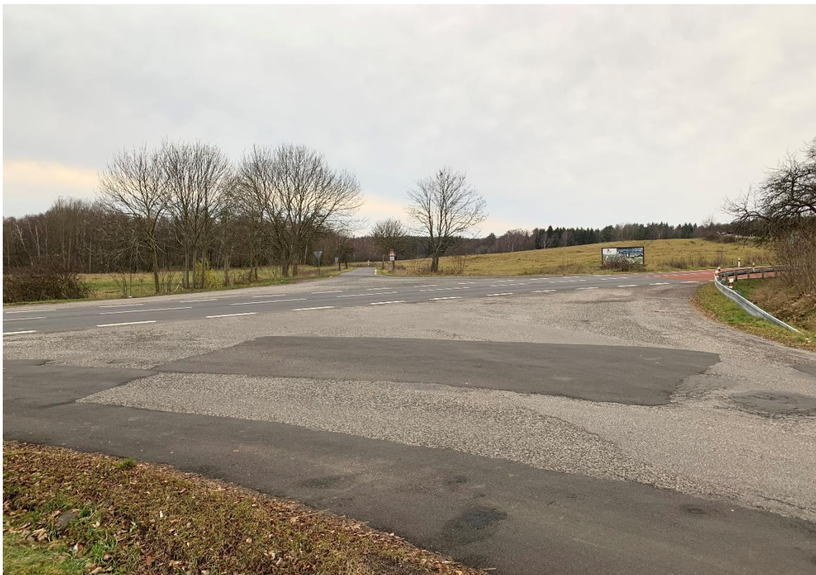
Obr.9 Místo křížení stávající silnice I/64 se silnicí II/213