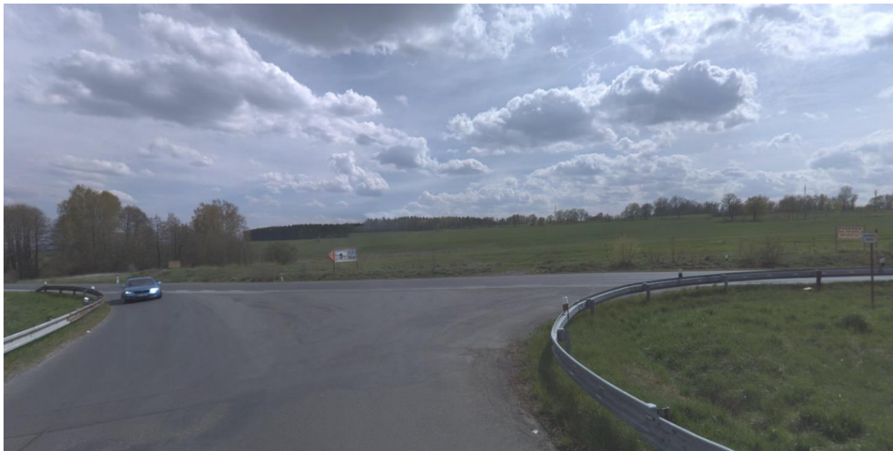
Obr.14 Místo napojení nového přivaděče nového obchvatu varianta 1,2,3