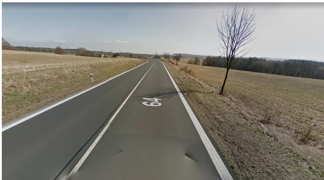
Obr.13 Místo napojení nového obchvatu na stávající silnici I/64 varianta 1,2,3,4