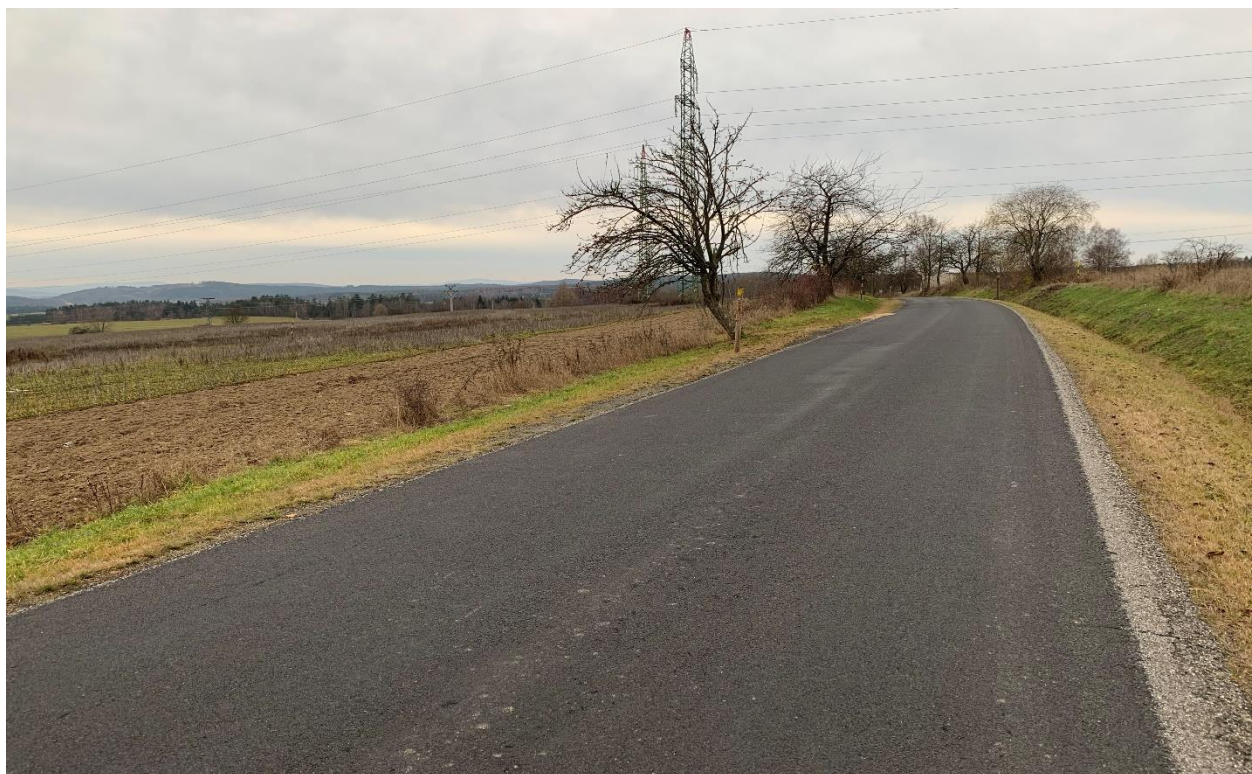
Obr.17 Místo napojení nové přeložky I/64 na stávající III/21315