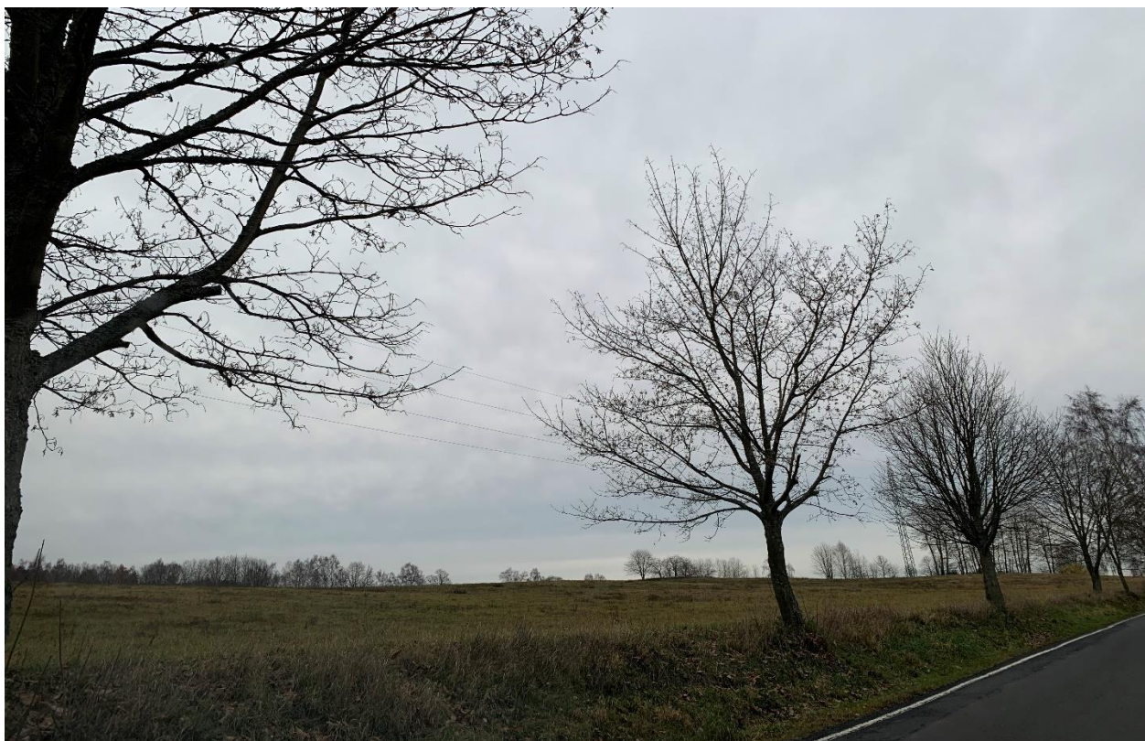
Obr.8 Místo křížení nového obchvatu se silnicí II/213 varianta 2 (pohled ve směru staničení)