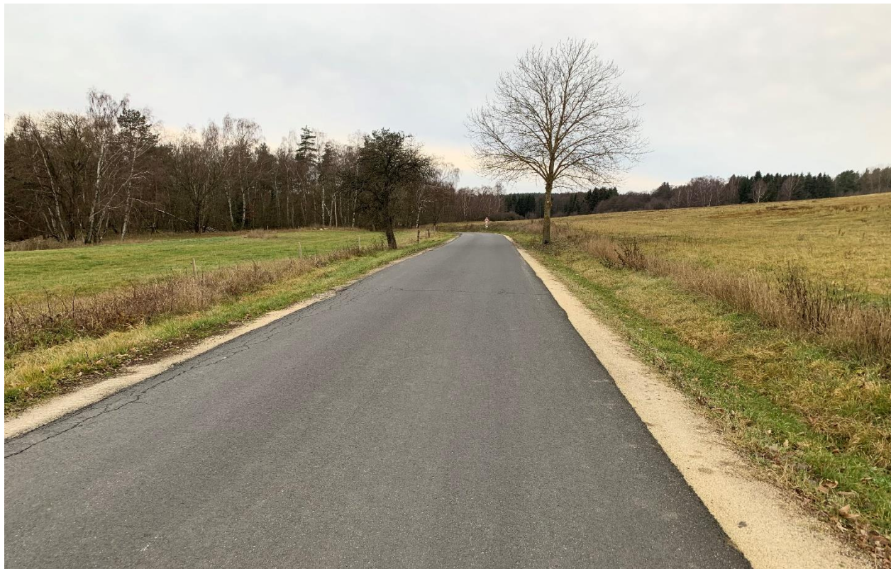
Obr.10 Místo nového křížení nového obchvatu se silnicí III/21315 varianta 1,2,3,4