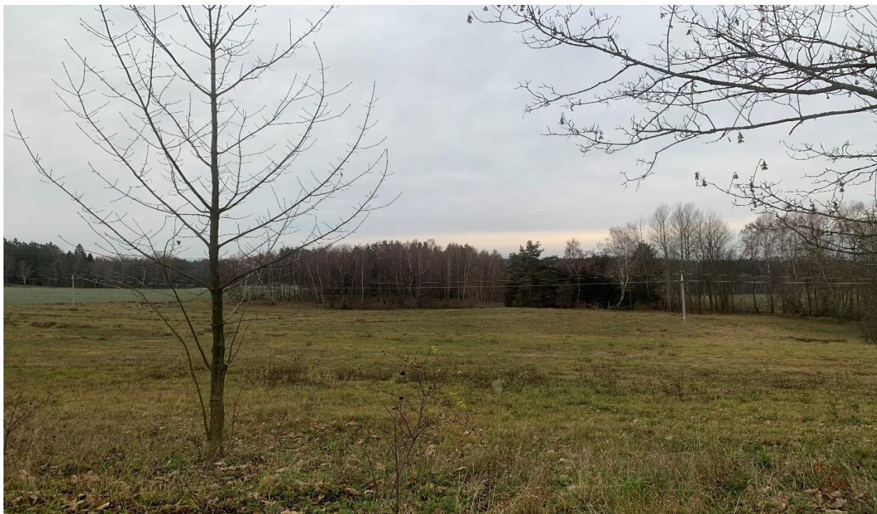
Obr.7 Místo křížení nového obchvatu se silnicí II/213 varianta 2 (pohled proti směru staničení)