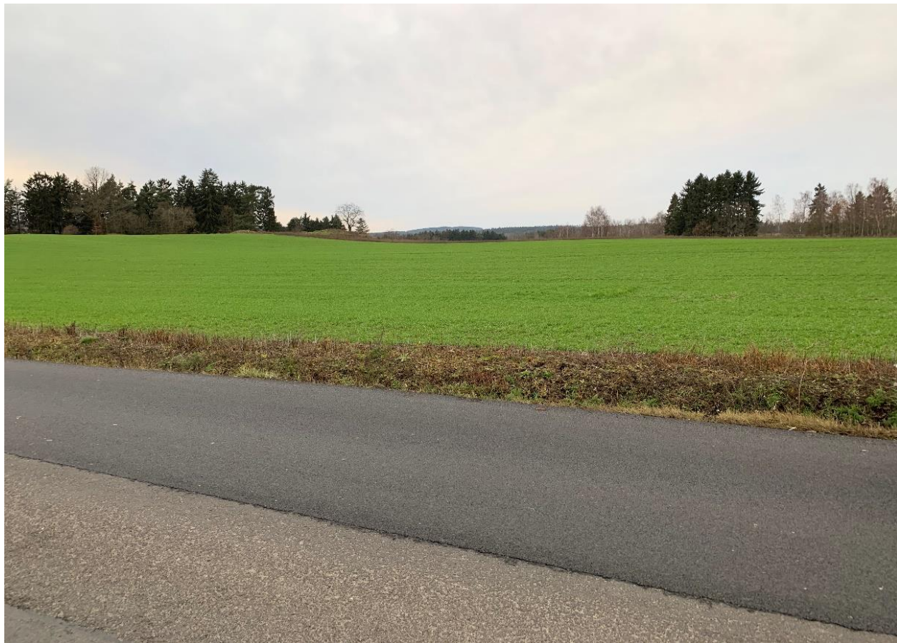
Obr.5 Místo křížení nového obchvatu se silnicí II/213 varianta 1,3 (pohled proti směru staničení)