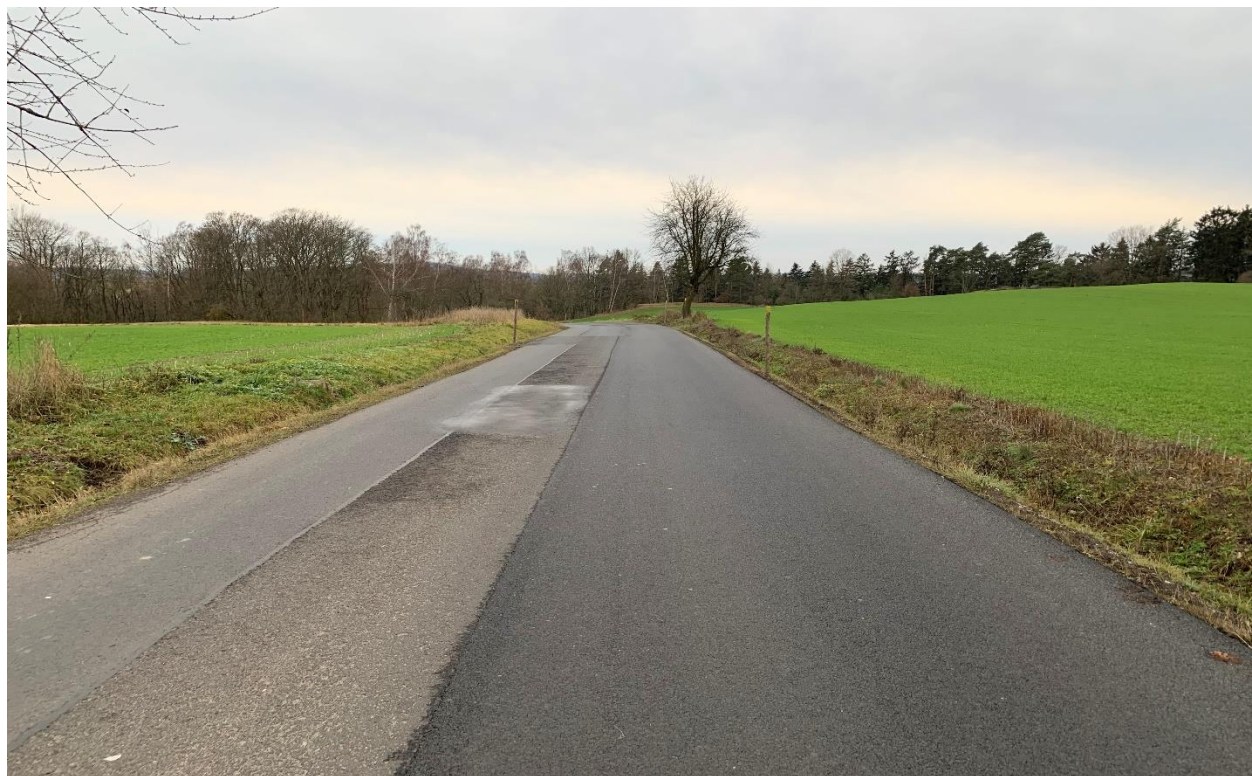
Obr.3 Místo křížení nového obchvatu se silnicí II/213 varianta 1,3