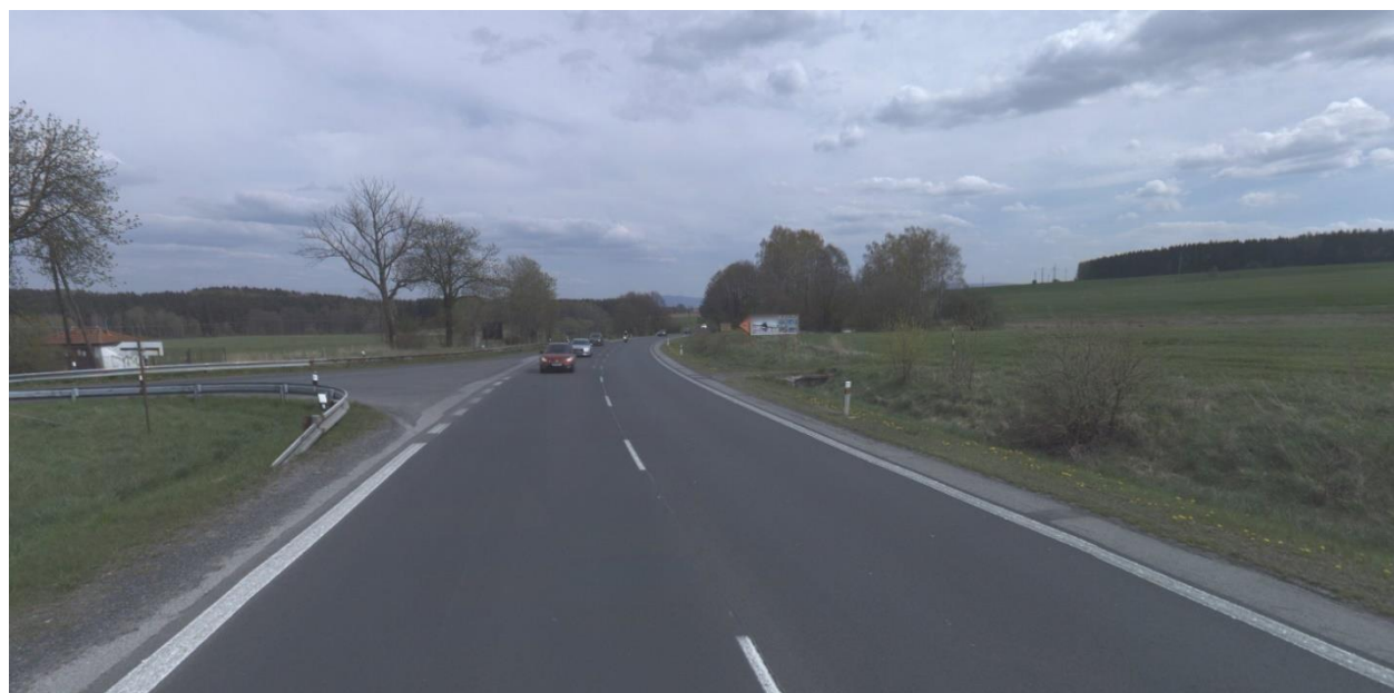
Obr.15 Místo napojení nového přivaděče nového obchvatu varianta 1,2,3