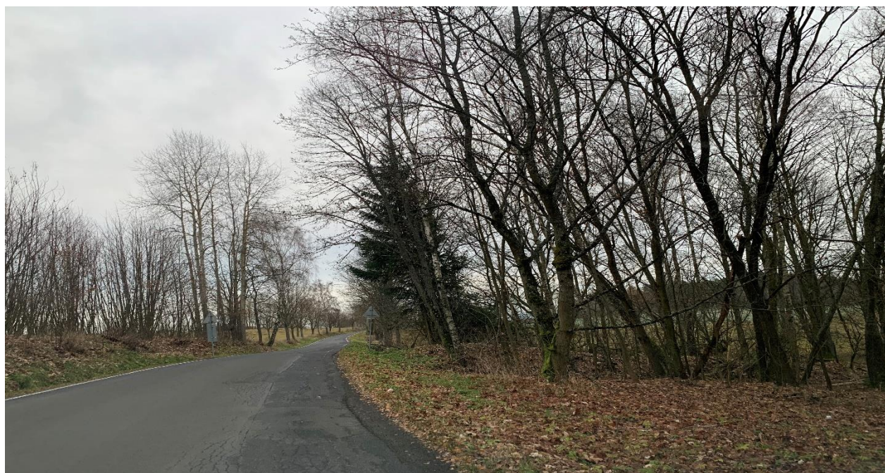
Obr.6 Místo křížení nového obchvatu se silnicí II/213 varianta 2