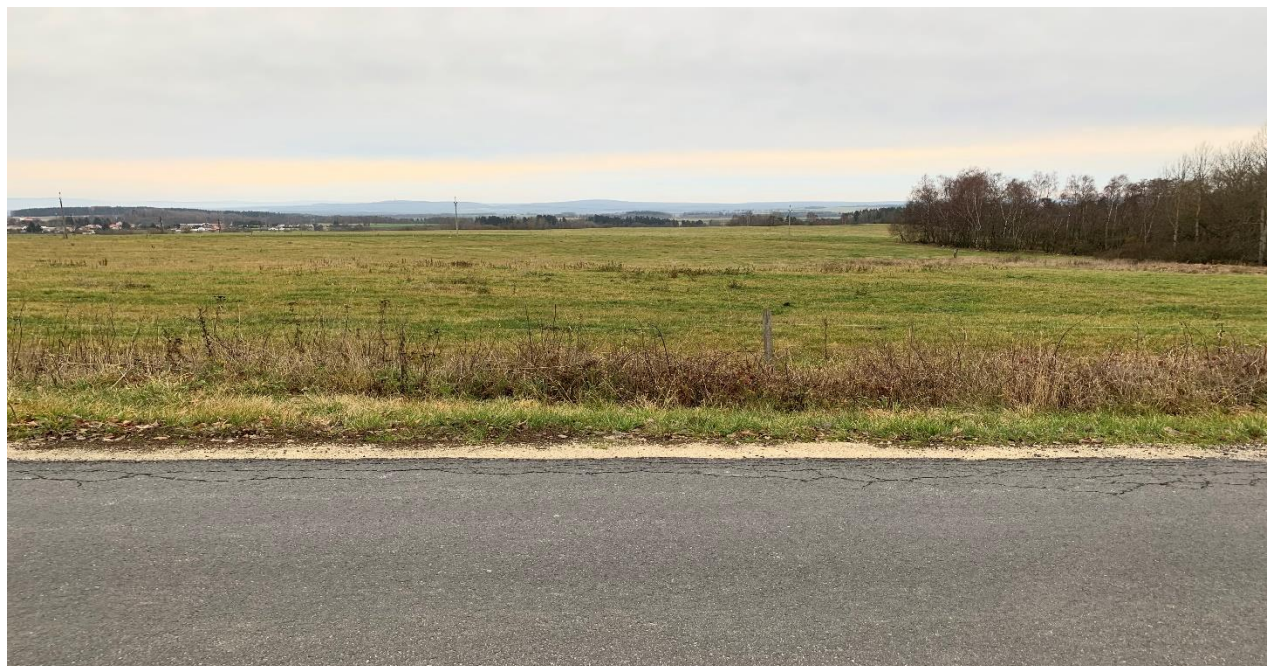
Obr.11 Místo nového křížení nového obchvatu se silnicí III/21315 varianta 1,2,3,4 (pohled proti směru staničení)