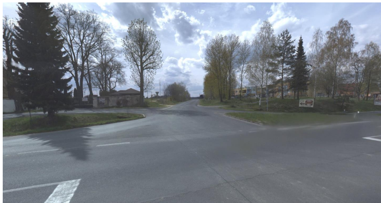
Obr.2 Místo nové okružní křižovatky a začátek varianty 4