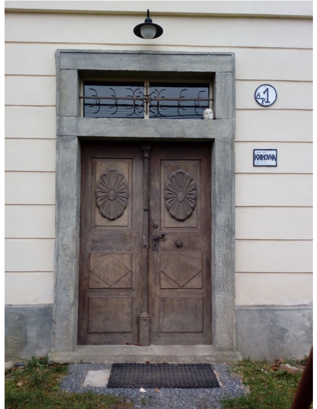
Malešov - muzeum a knihovna, č.p. 1