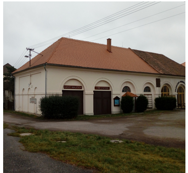
Malešov - hasičská zbrojnice, č.p. 49