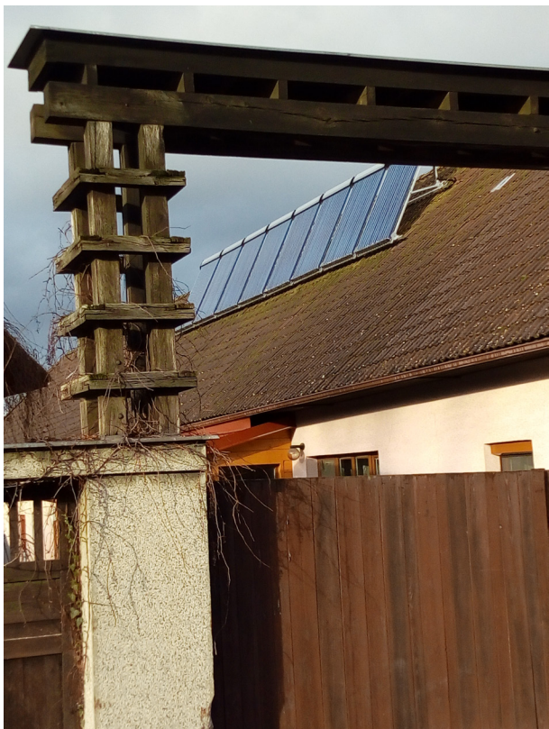
Vlkov - fototermické kolektory