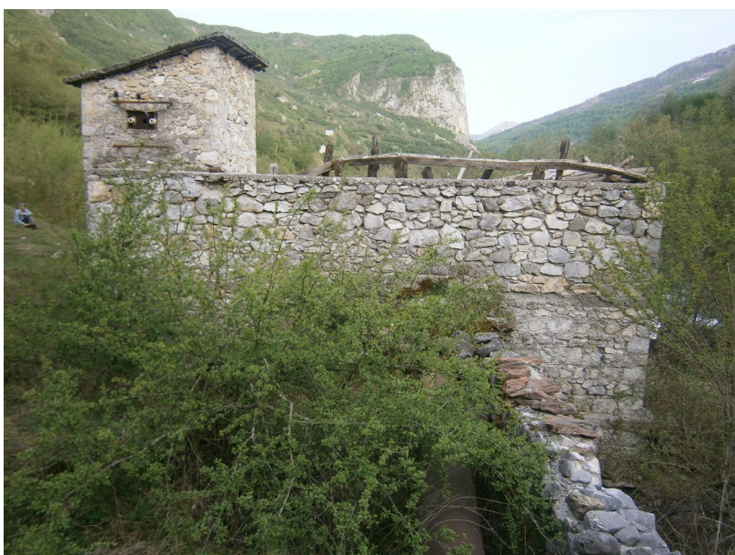
Curraj Eperm - bývalá hydroelektrárna s trubním náhonem