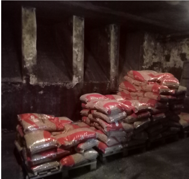
Malešov - ZŠ, sklad pelet