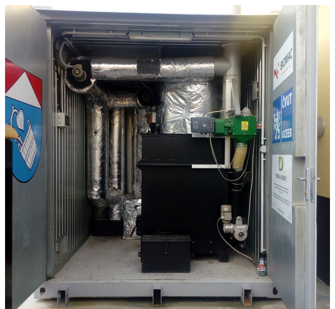
Mikolajice - mikroelektrárna Wave