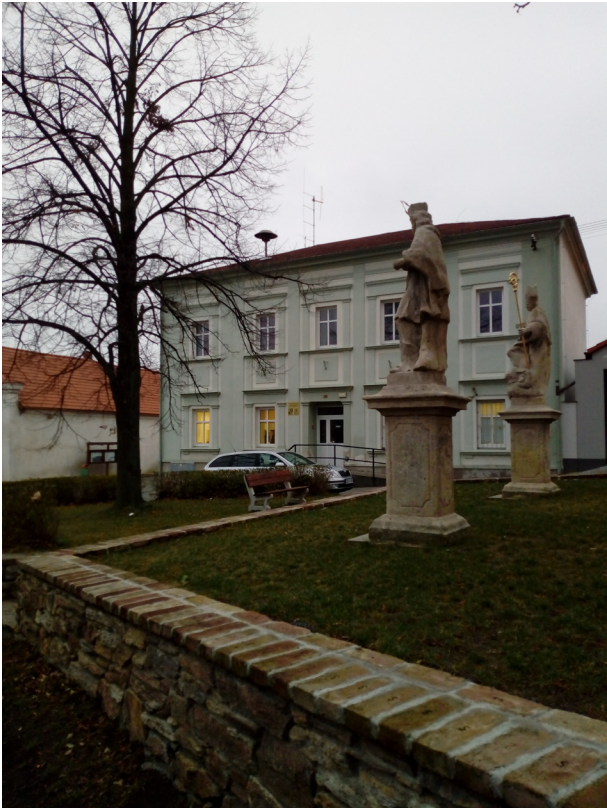
Malešov - úřad městyse, č.p. 45