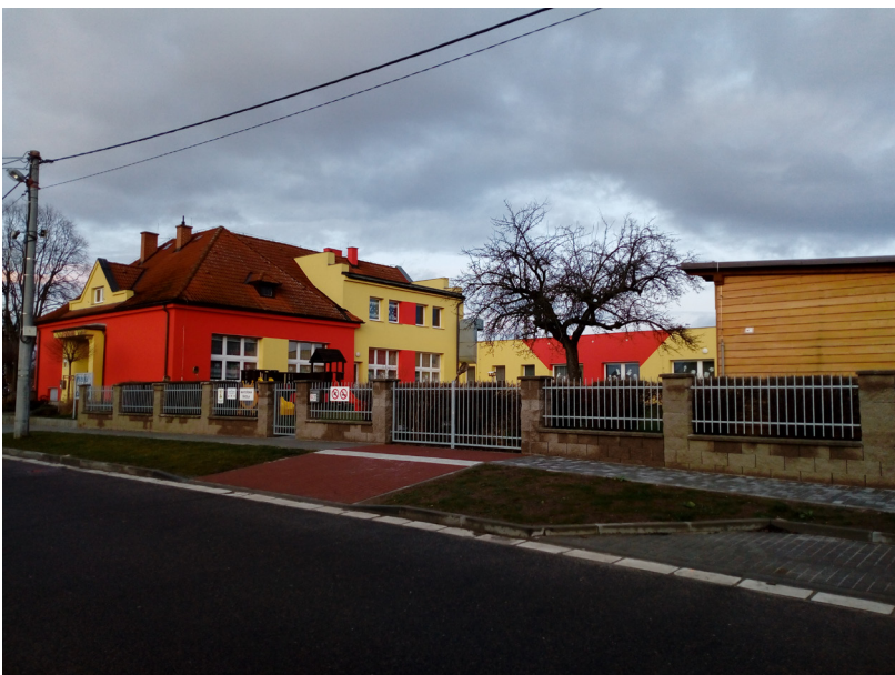
Rasošky - základní a mateřská škola, č.p. 172