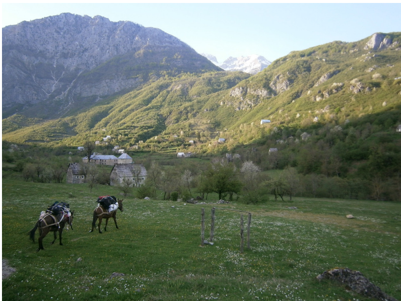
Curraj Eperm - pohled na údolí s roztroušenou zástavbou obce