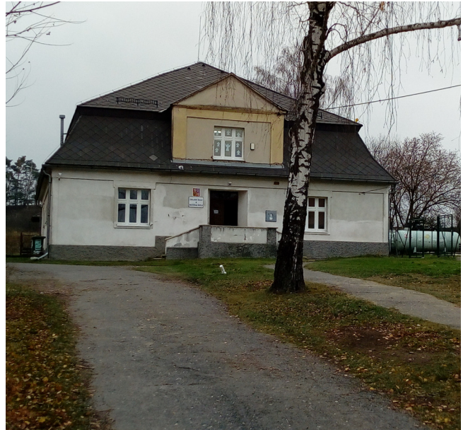
Malešov - školní družina, č.p. 187