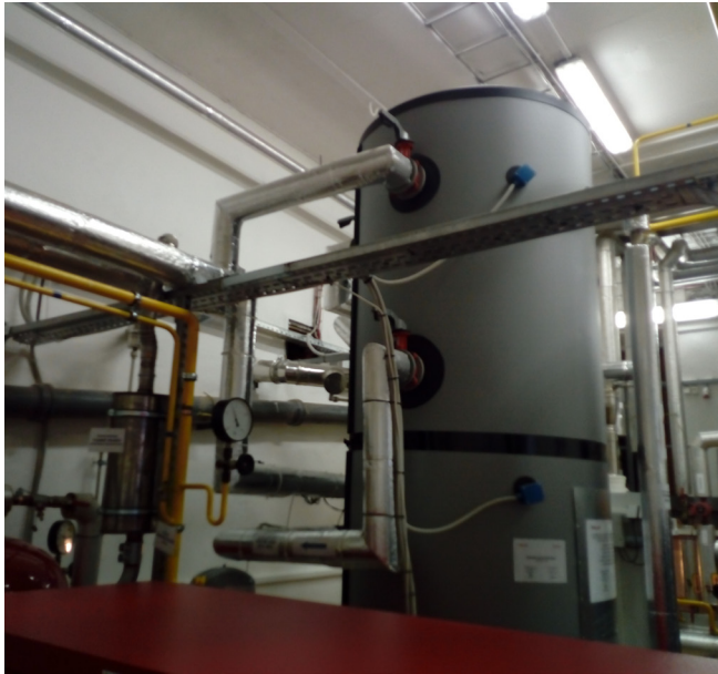
Budišov n. Budišovkou - obecní kotelna