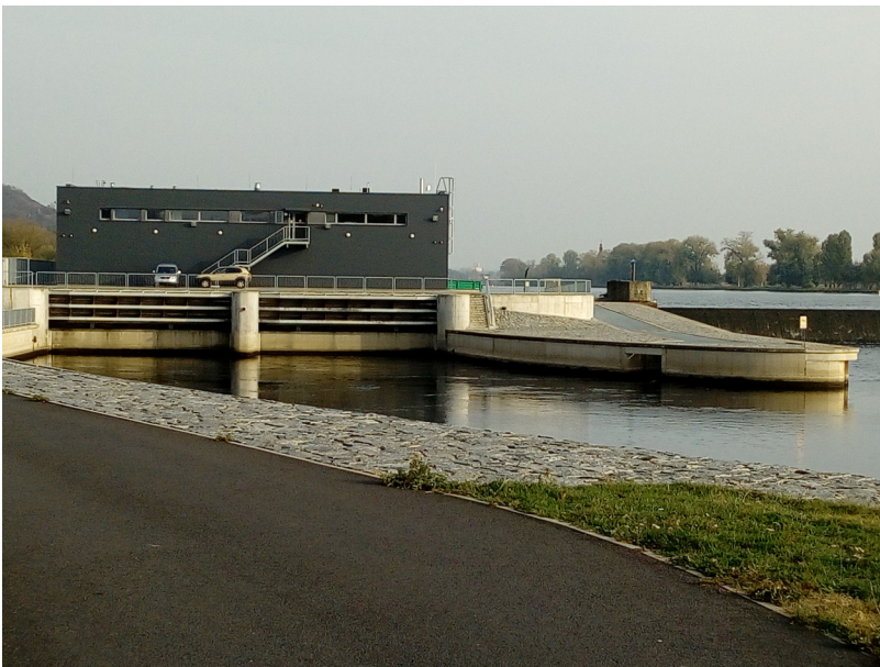
Litoměřice - jezová MVE