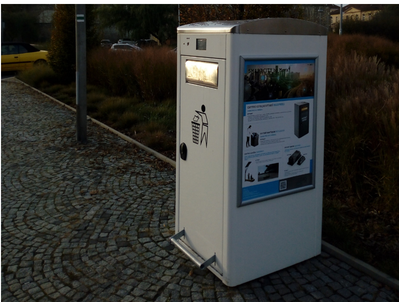
Litoměřice - chytrý odpadkový koš