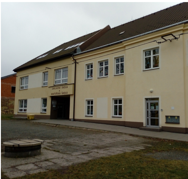
Malešov - základní škola, č.p. 107