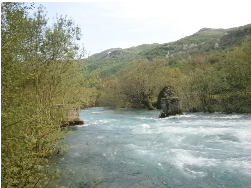
Curraj Eperm - řeka Currajve se zbořeným mostem