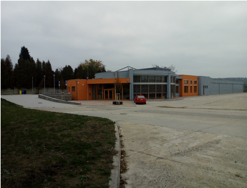
Litoměřice - výzkumné středisko geotermie RINGEN