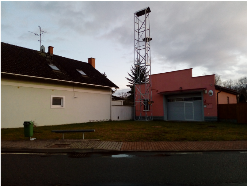
Rasošky - hasičská zbrojnice, č.p. 89