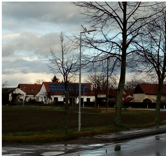
Vlkov - fotovoltaické panely