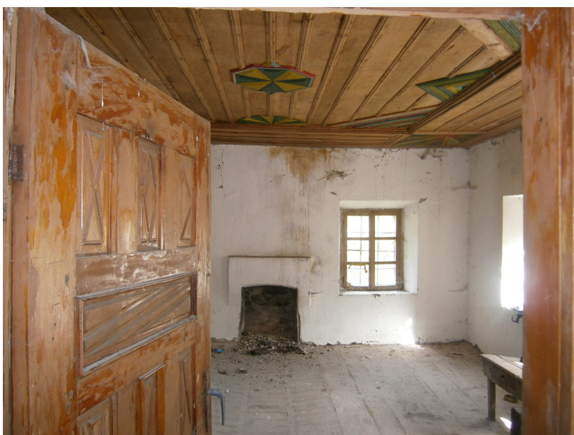
Curraj Eperm - horský dům, interiér