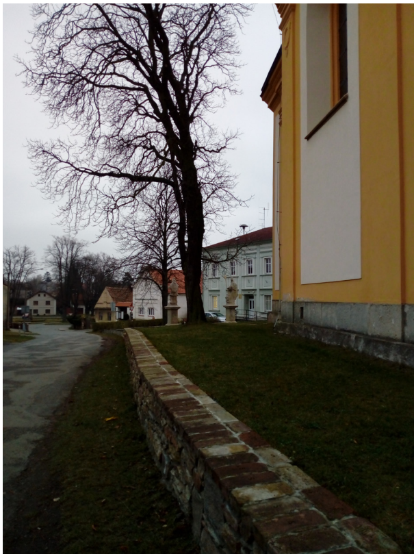
Malešov - náměstí s kostelem sv. Václava