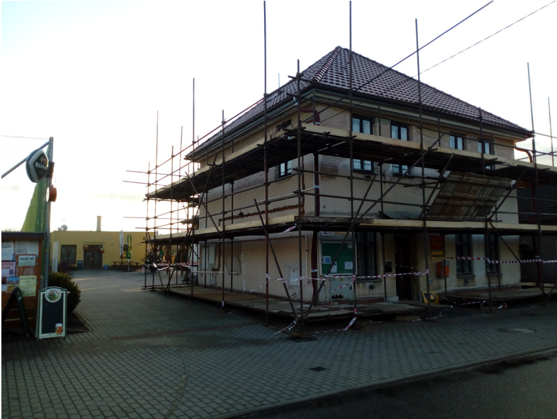
Rasošky - obecní úřad, č.p. 50