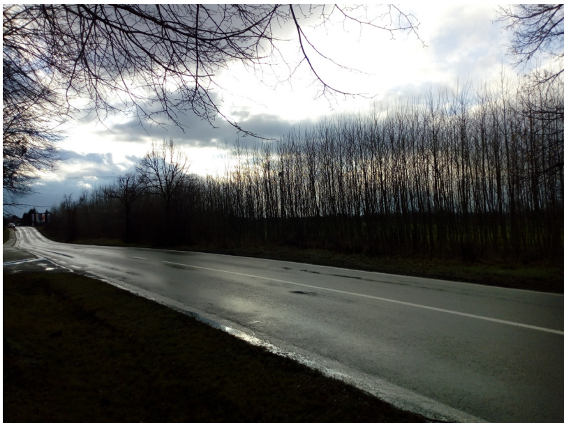
Rasošky - plantáž na rychle- rostoucí biomasu