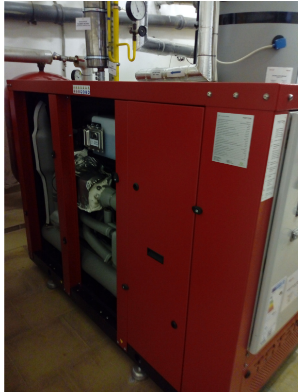
Budišov n. Budišovkou - kogenerační jednotka