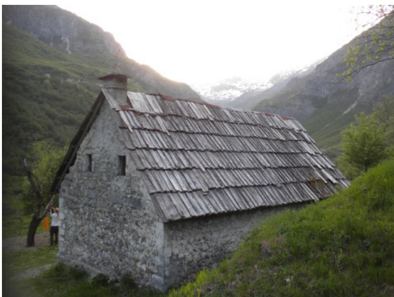
Curraj Eperm - horský dům