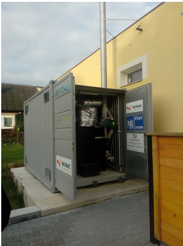
Mikolajice - mikroelektrárna Wave