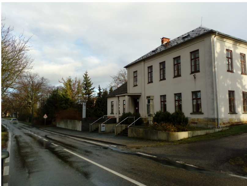
Vlkov - obecní knihovna, č.p. 7