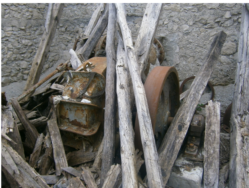
Curraj Eperm - původní vodní turbína hydroelektrárny