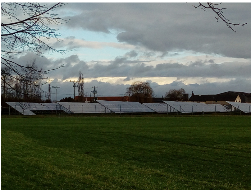
Vlkov - fotovoltaická elek- trárna