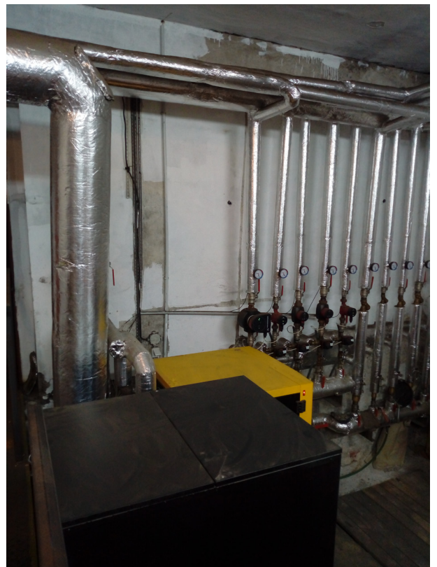
Malešov - ZŠ, kotelna na pelety